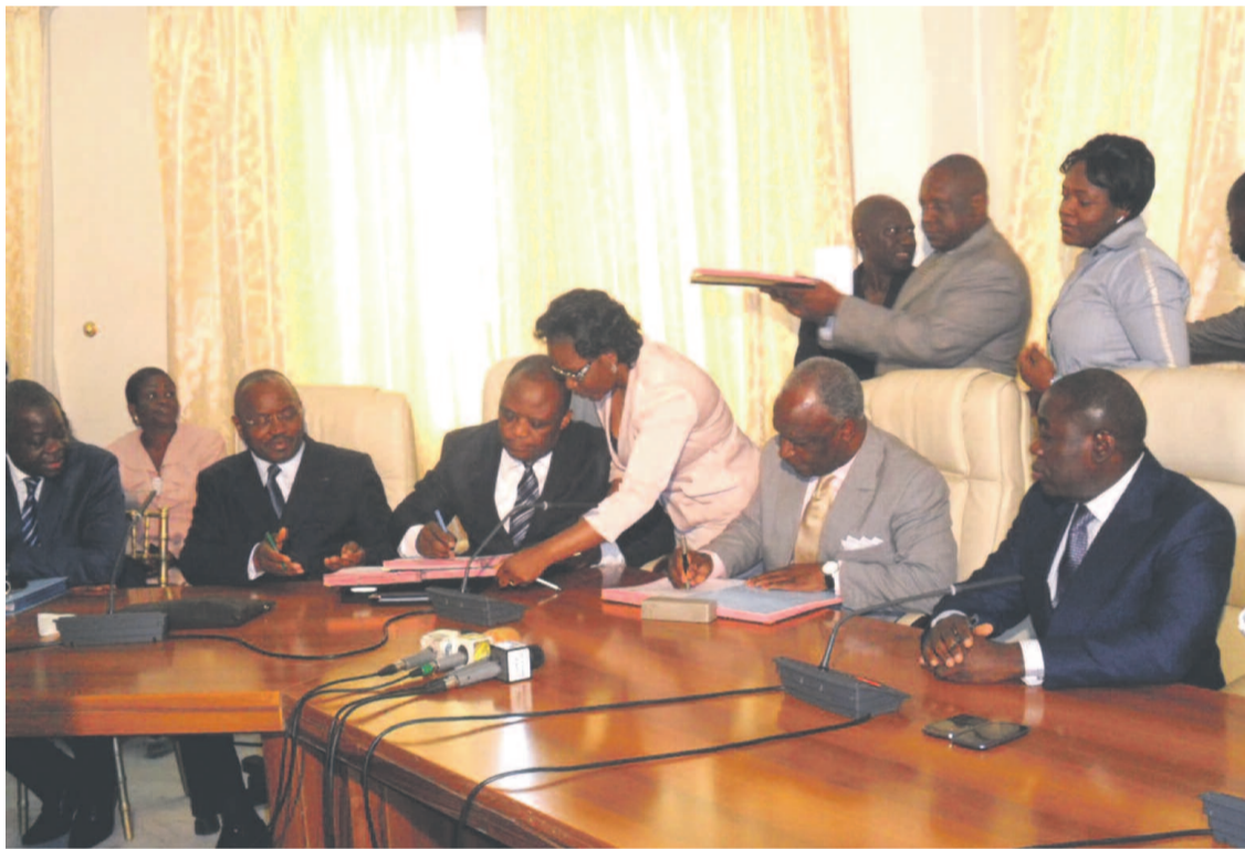
La signature du contrat entre le gouvernement et la SNDE