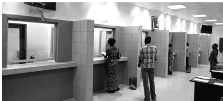
Les guichets de l'agence de Ouenzé

La dernière née des agences de la Banque postale du Congo (BPC), unique établissement financier étatique, a officiellement ouvert son bureau de Ouenzé au public, dans le 5 e arrondissement de Brazzaville.