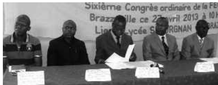
La tribune du 6 e congrès ordinaire