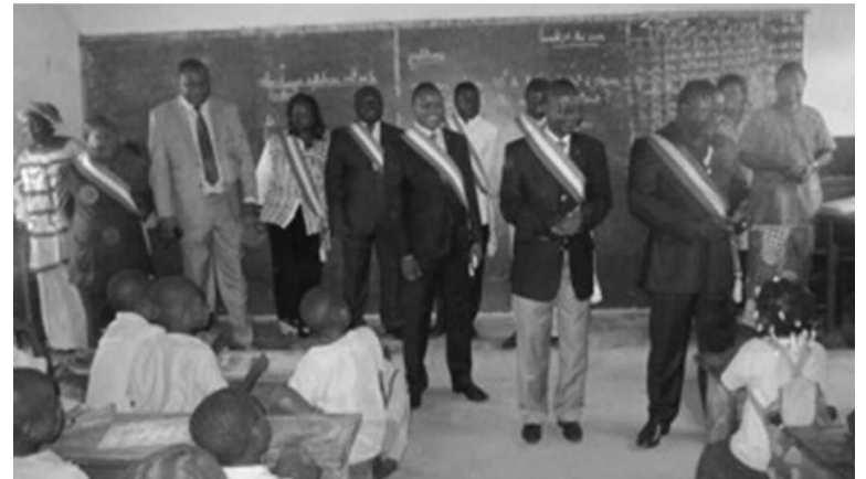
les députés visitant les élèves de l'école de Loango au Kouilou