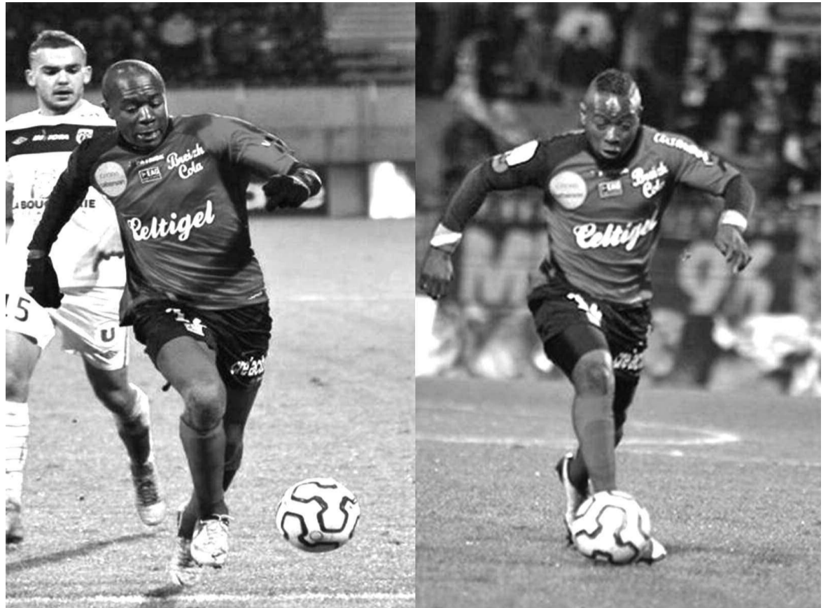
Le duo Douniama-Imbula a contribué à la précieuse victoire de Guingamp, qui reste en course pour la montée en Ligue 1

Monaco rate l'occasion d'officialiser sa montée en Ligue 1 en s'inclinant à domicile face à Caen (0-1). Remplaçant, Delvin Ndinga n'est pas entré en jeu. Inquiétant pour l'ancien Auxerrois qui n'a joué que 130 minutes en 2013 (en 9 entrées en jeu).