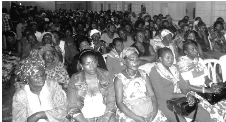
L'auditoire suivant attentivement les exposés

La journée a permis de partager sur certaines préoccupations de la femme et de la jeune fille.