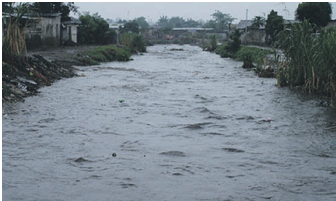
La rivière Mfoa, l'un des collecteurs naturels de Brazzaville