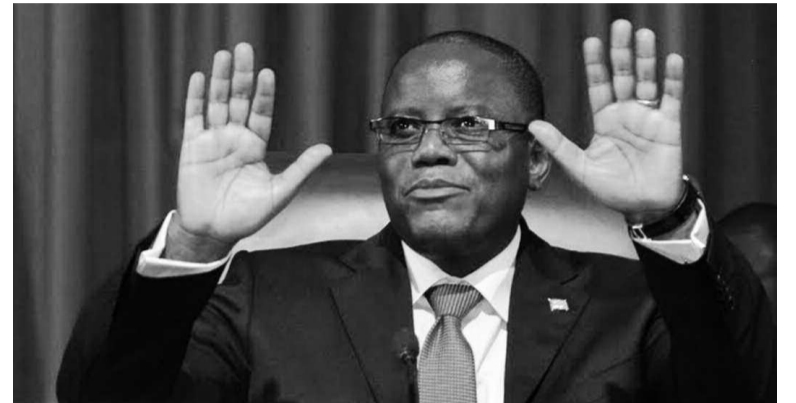
Aubin Minaku, président de l'Assemblée nationale et secrétaire général de la majorité présidentielle

Ce groupe parlementaire se réserve le droit d'introduire une plainte contre le bureau auprès de la Cour suprême de justice et exige la convocation immédiate d'une plénière consacrée à l'examen des différentes motions en souffrance.