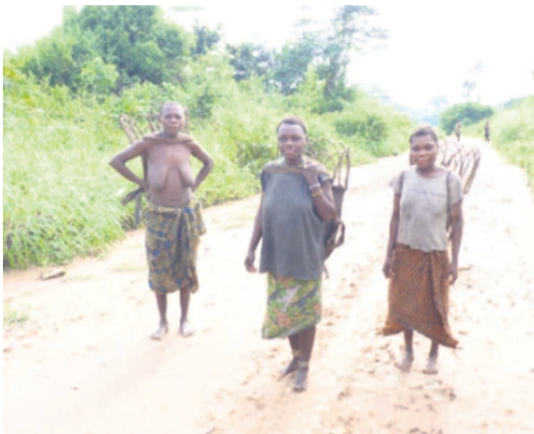
Des femmes autochtones dans une rue de Pokola (Nord Congo)

Du 12 au 14 juin, l'association Aide internationale au développement et à l'enfance (Aide ASBL) organise à Couvin en Belgique, la 5 e édition des Journées couvinoises de solidarité en faveur des peuples autochtones du Congo.