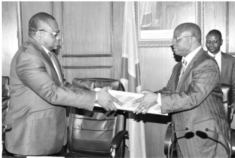
Remise des équipements au ministre en charge de la Population

Les équipements qui visent à permettre aux services urbains d'accomplir leur tâche dans le cadre de la décentralisation ont été remis par l'UE aux services techniques de la ville province, le 11 juin, dans la salle Samuel Kitoki de l'Hôtel de ville.