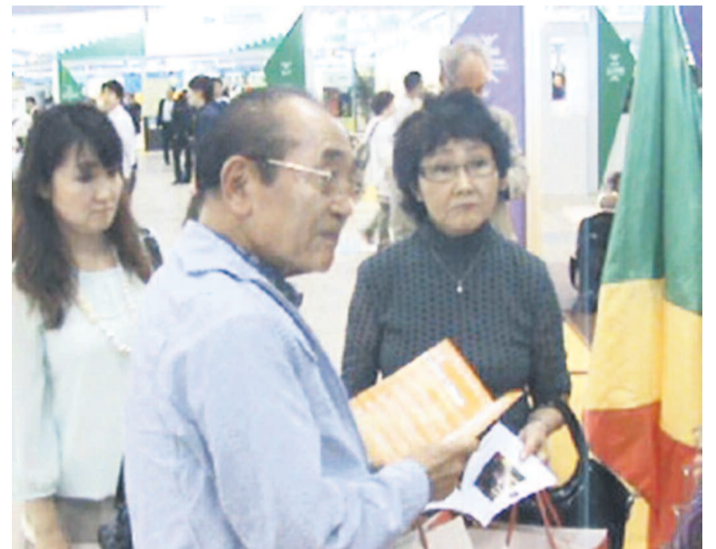
Les Japonais devant le stand pour s'enquérir de la réalité congolaise

Ainsi, toutes les opportunités économiques du pays inscrites dans le programme national de développe-