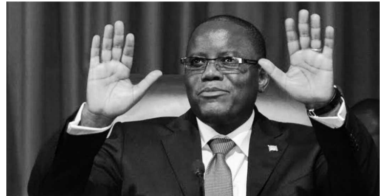
Aubin Minaku, président de l'Assemblée nationale et secrétaire général de la majorité présidentielle

Ce groupe parlementaire se réserve le droit d'introduire une plainte contre le bureau auprès de la Cour suprême de justice et exige la convocation immédiate d'une plénière consacrée à l'examen des différentes motions en souffrance.