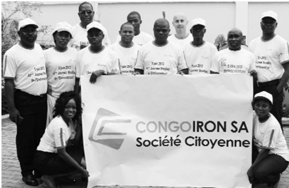
Les travailleurs de Congo Iron SA à la fin de la cérémonie de remise des paniers en liane organisée par le ministère du Tourisme et de l'environnement

La communauté internationale a célébré cette année la 41 e édition de la journée mondiale de l'environnement. En 2013, le thème de cette célébration annuelle s'intitule « Pensez-mangez-préservez » et se décline comme une campagne contre le gaspillage et la perte alimentaire avec pour objectif d'encourager le public à réduire son