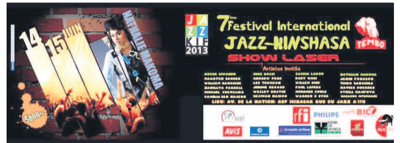
L'affiche du Festival international de jazz de Kinshasa, le Jazzkif