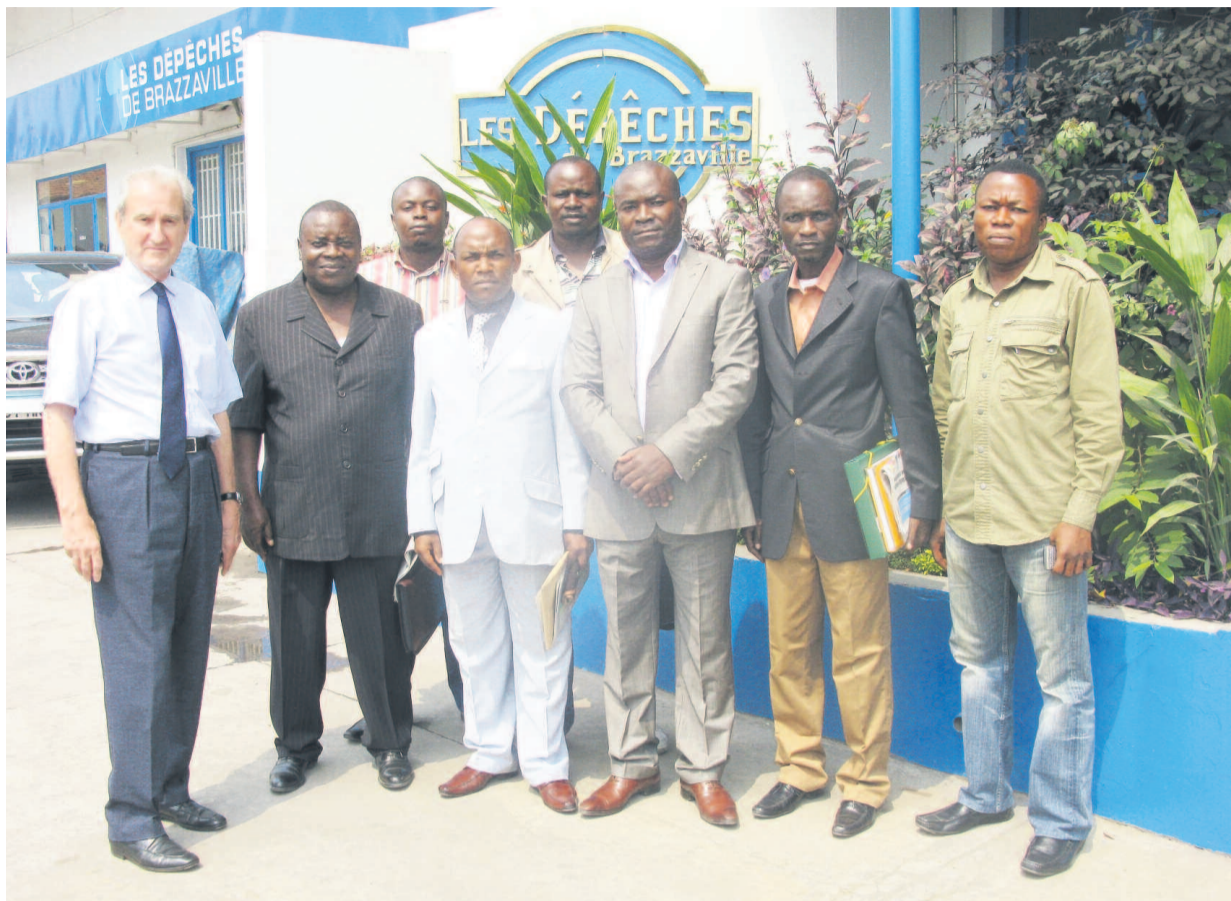
La délégation du CSLC et les responsables de la rédaction

Les journalistes des Dépêches de Brazzaville, dont le nombre