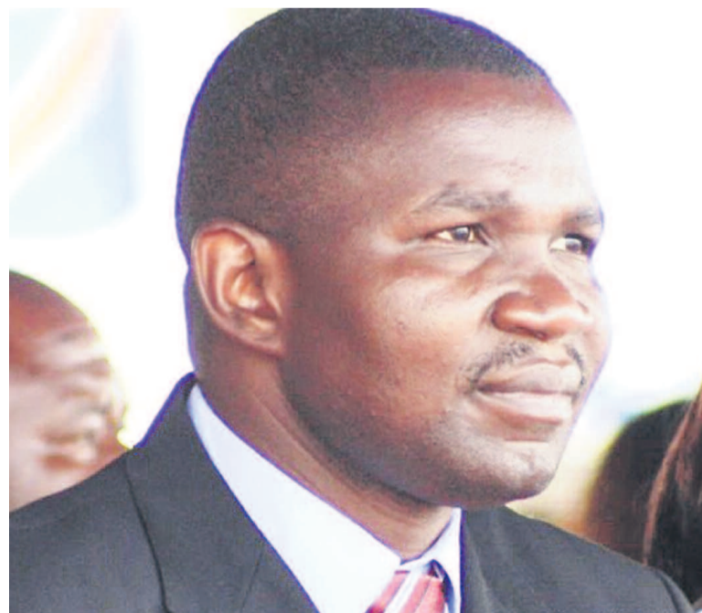
Le gouverneur du Nord-Kivu, Julien Paluku

La plénière convoquée lundi en vue de statuer sur la motion de défiance initiée par l'opposition contre le gouverneur Julien Paluku a été ajournée, faute de quorum. La tension ayant caractérisé la tenue de cette plénière, avec à la clé, une forte agitation entretenue aux abords du siège de l'Assemblée provinciale du nord-Kivu entre les pro et anti Paluku a motivé la suspension jusqu'à nouvel ordre des activités parlementaires au sein de cet organe délibérant. Cette décision du ministre de l'Intérieur vise notamment à tempérer les ardeurs des uns et des autres pour ne pas prêter le flanc aux ennemis du peuple congolais qui épient ses moindres contradictions pour sévir. Accusé de malversation, d'impopularité et d'une gestion superficielle de la guerre d'agression perpétrée par la rébellion du M23, l'incriminé continue néanmoins à faire de la résistance.