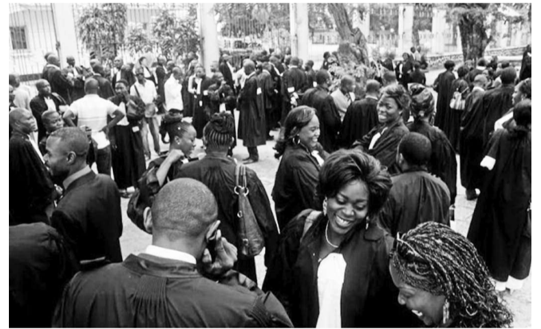
Des magistrats congolais

Le Fonds des Nations unies pour l'enfance (Unicef) a salué l'affectation de trente-neuf nouveaux juges pour enfants dans dix provinces sur les onze que compte la RDC. Dans un communiqué publié le 10 juin, cette agence de l'ONU a noté que cette décision porte à cinquante-quatre les effectifs des juges qui sont affectés dans quinze juridictions, pour garantir les procédures applicables aux enfants. L'Unicef encourage le gouvernement, à travers ses hautes instances judiciaires, à poursuivre les efforts entrepris dans le sens de l'amélioration du système de justice pour enfants, tel que recommandé par le Comité des droits de l'enfant. Pour cette institution,