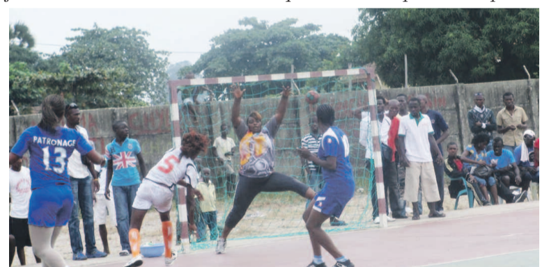
Un extrait du match Patronage/Banco Sport

encore, à emboîter le pas. « Nous avons décidé de prendre le train en marche avant d'avoir une solution favorable à notre requête. Je demande aux dirigeants d'Inter club et de Tié Tié sport de revenir à de bons sentiments et de mettre les enfants en chantier. Nous avons dépensé beaucoup d'argent pour leur préparation, il faudrait qu'ils jouent », a-t-il lancé. « L'idéal pour Patronage cette année est de reconquérir le championnat départe-