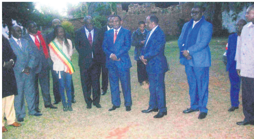
La délégation congolaise chez l'ambassadeur Émile-Léonard Ognimba

Il a également reconnu que la fête du lancement était belle grâce à l'implication de l'ambassadeur du