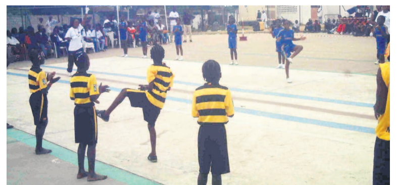
Une phase du match Light World School-Diables noirs

noirs sur le score étriqué de 22 à 21. Ce tournoi qui regroupe huit équipes minimes prouve la vitalité de ce sport qui prend de l'ampleur dans le département. « Nous avons commencé le nzango très jeunes, entre huit et douze ans. C'est pourquoi nous venons exprimer nos talents d'enfants à côté de nos