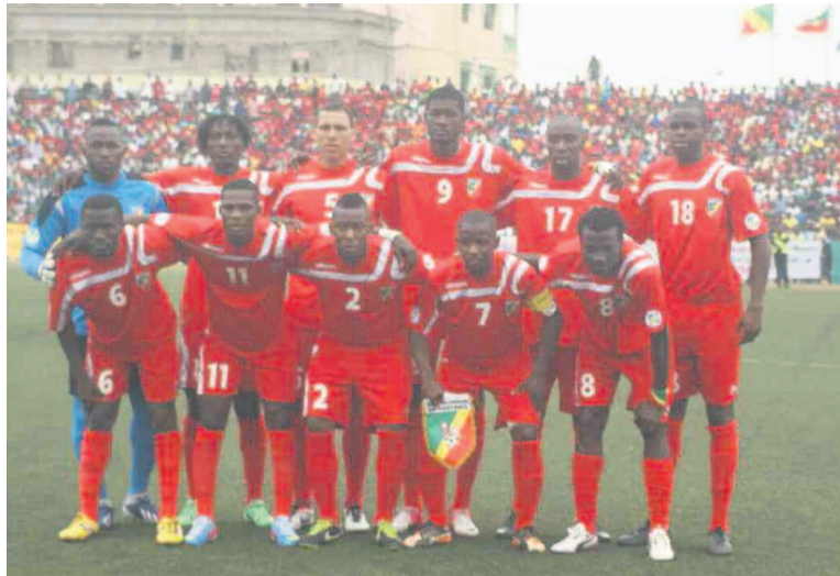
Les Diables rouges

À une journée de la fin de l'avant-dernière étape du chemin menant vers la qualification au Mondial 2014, le Congo court un danger. Le Burkina-Faso, son dauphin du groupe, vient de réduire l'écart d'un point qui les séparait grâce à sa troisième victoire d'affilée. Fort de son titre de vice-champion d'Afrique, le Burkina-Faso devient un danger pour le Congo. Le moindre faux pas pourrait faire l'affaire des Étalons qui auront le privilège de jouer dans leurs propres installations face au Gabon. La victoire du Burkina-Faso pourrait le propulser à la tête du groupe si le Congo perdait à Niamey ou se contentait du match nul. Le Gabon qui a repris confiance peut revenir à la hauteur du Congo en cas de victoire en Ouganda tout en espérant sur