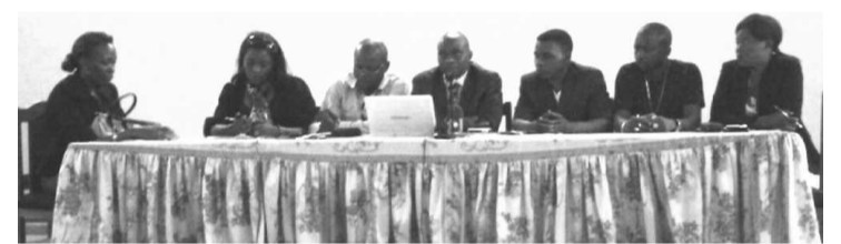
Présentation du rapport de la mission à la presse

Dans ses conclusions, la mission a noté que ces douze DDH sont victimes d'acharnement et d'intolérance politiques. Pour cette délégation, en effet, leur procès n'était pas juste et équitable. « Les juges n'avaient pas fait preuve d'indépendance et d'impartialité. Ils avaient obéi à la volonté politique en lieu et place des lois, règlements et nécessités de la démocratie », a-t-elle fait observer.