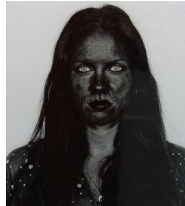
Pieter Hugo. (© DR)

au Cap. Sa série exposée à Arles There's a place in hell for me and my friends présente des portraits resserrés de ses proches et de lui-même. Il utilise un processus numérique qui lui permet de manipuler les canaux de couleurs et ainsi transformer les images couleur en noir et blanc et en faisant ressortir la mélanine de la peau de ses sujets. On voit apparaître tâches et brû-