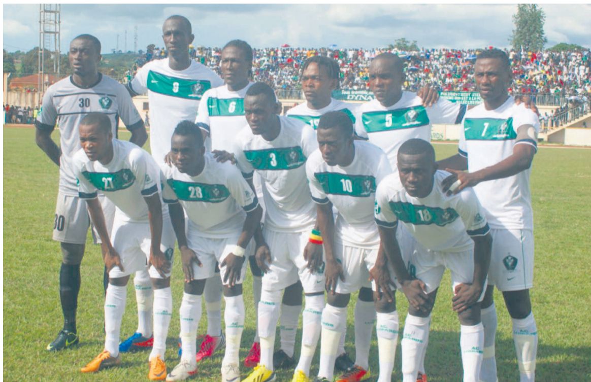
L'AC Léopards de Dolisie.

du Sud afin d'aborder les réceptions du Zamalek et de Al Ahly les 4 et 18 août au stade Denis-Sassou-N'Gesso à Dolisie avec beaucoup d'engagement. Dans le but