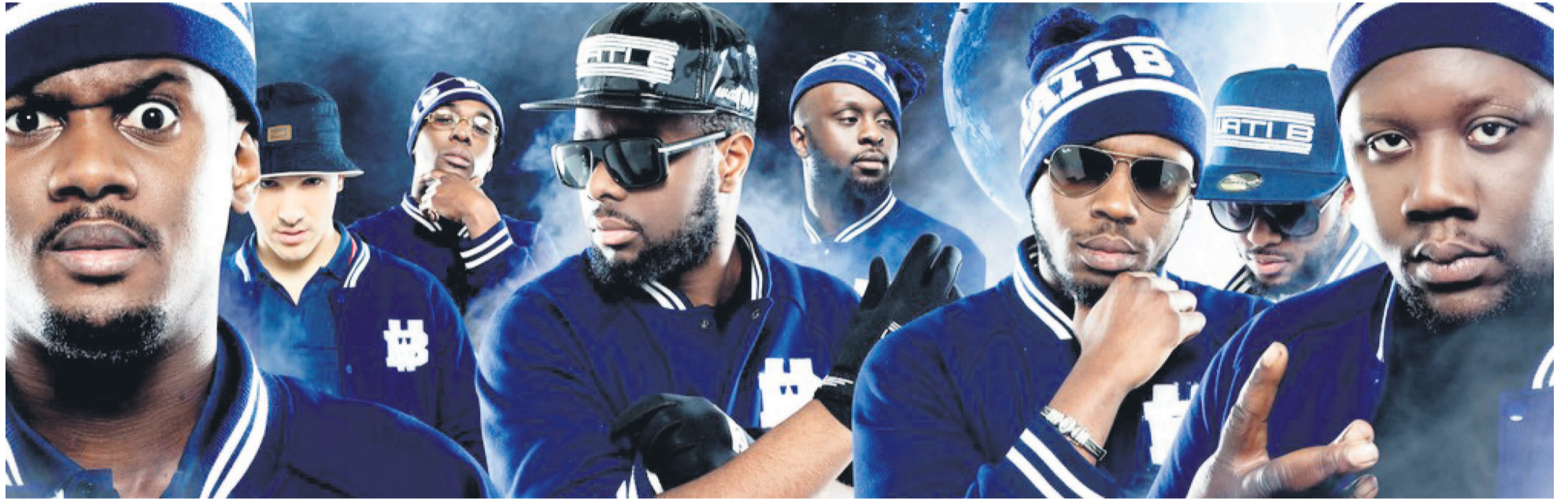
Le groupe Sexion d'Assaut.

À une époque où beaucoup pensaient que le rap c'était mieux avant, voire que le rap était mort, huit jeunes Parisiens sont arrivés comme un tsunami dans le paysage musical français. En quatre ans, Sexion d'Assaut s'est hissée à la tête des charts, raflant prix, disques d'or et reconnaissance de ses pairs. Retour sur le parcours d'un des groupes de rap les plus populaires aujourd'hui