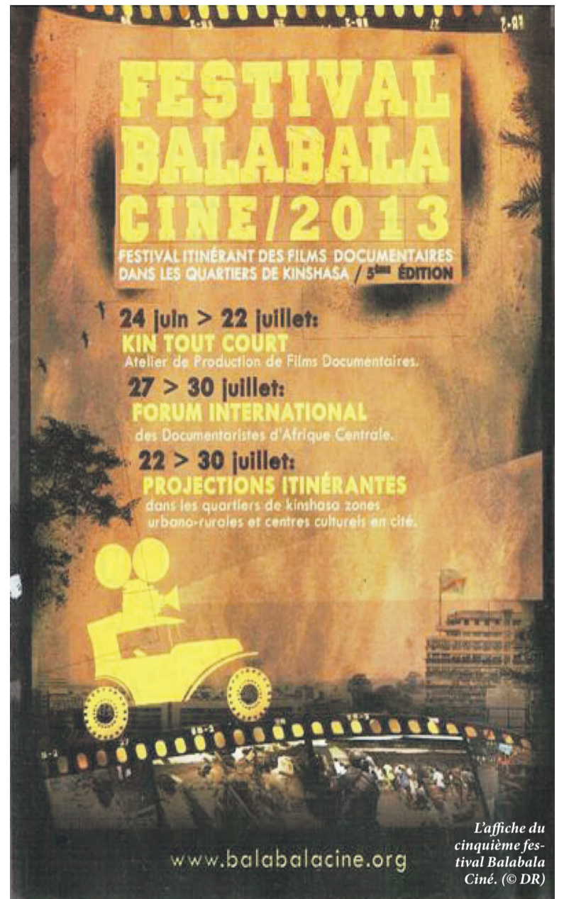
L'affiche du cinquième festival Balabala Ciné.