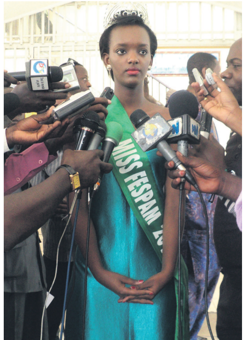
Miss Fespam répondant aux questions de la presse