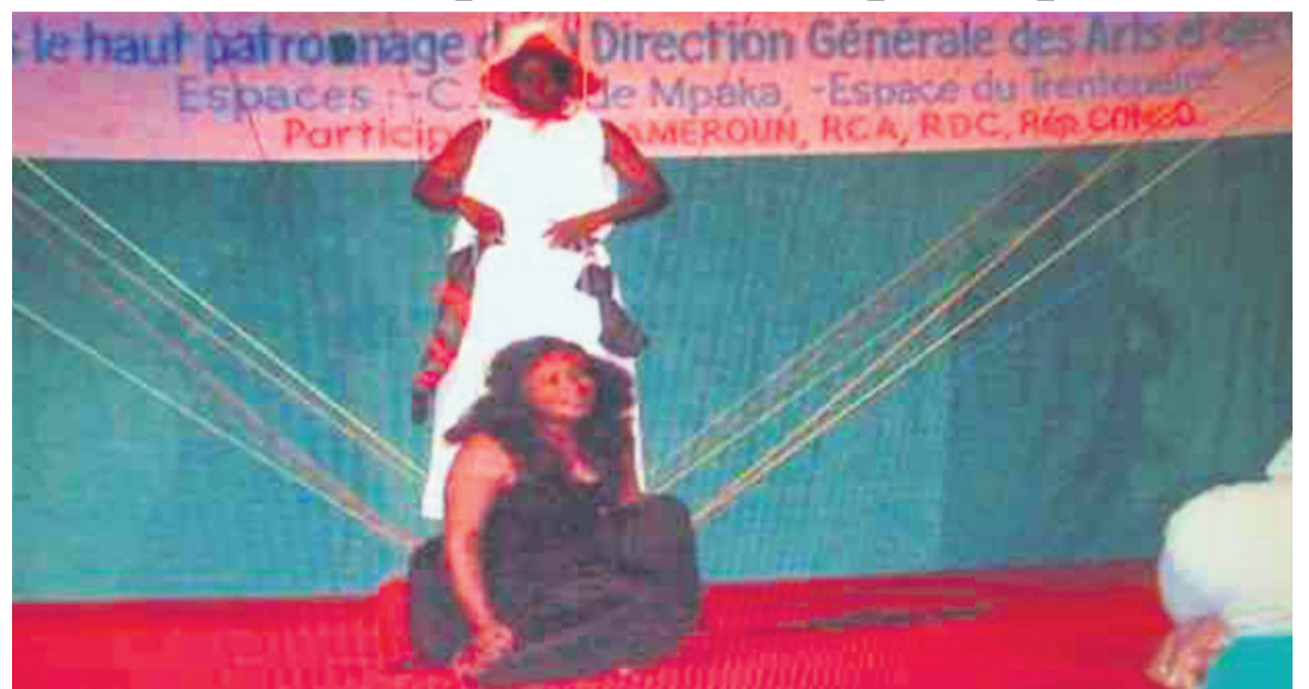
Une représentation théâtrale lors de la cinquième édition du Festival international Kimoko