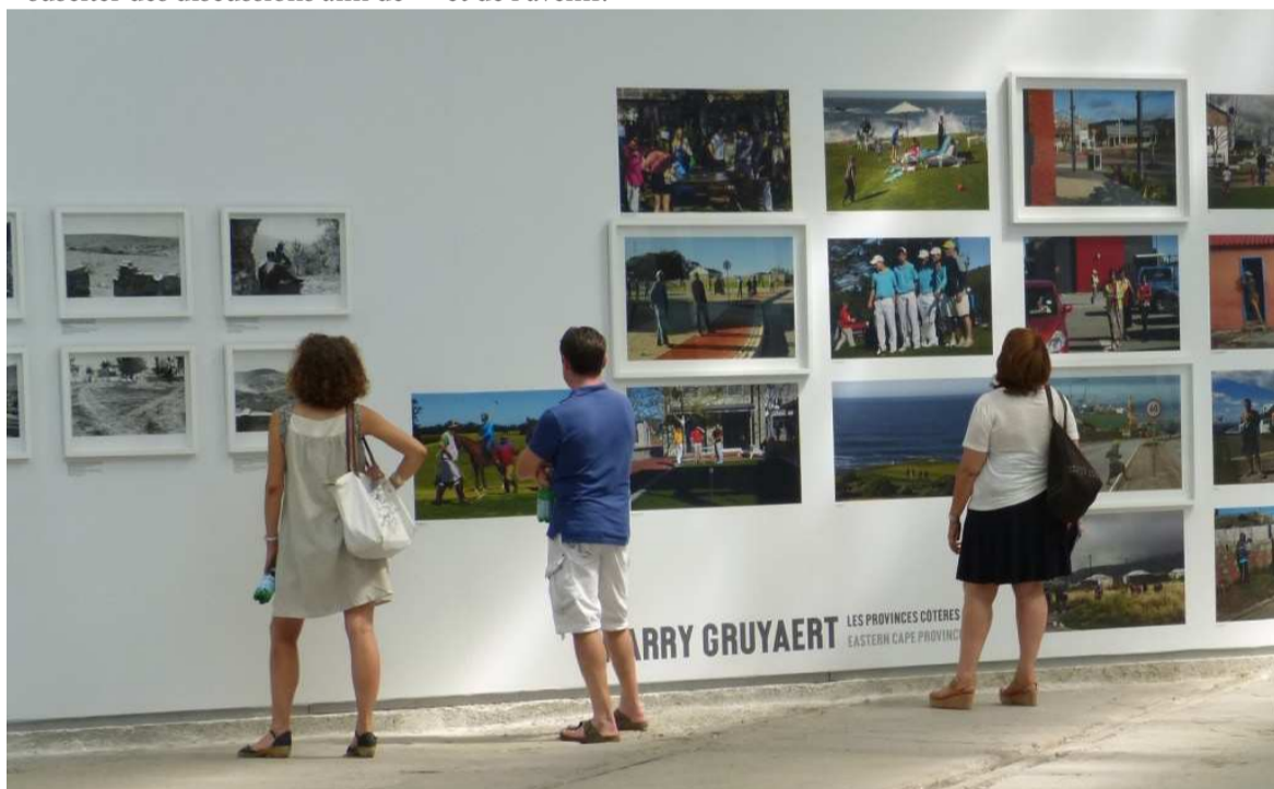
« Transitions, paysage d'une société ».

montrer combien il est difficile d'interpréter un lieu, un espace, une appartenance ». En effet, en Afrique du Sud, les problèmes liés à la terre sont