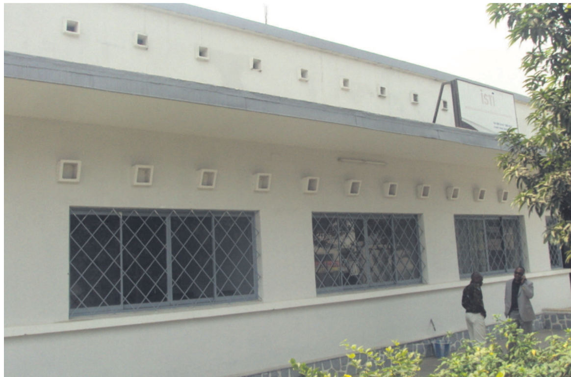
La façade de l'Ithem.

of business administration, international business), un en administration des entreprises (master of business administration), et un autre en développement informatique (master in computer application). Quant aux étudiants inscrits en licence, ils sont neuf, dont six en administration des entreprises et les trois autres en développement informatique, en communication d'entreprises (bachelor in professional communication) et en sciences (bachelor of sciences), pour une durée de trois ans. Selon les responsables de cet établissement, le départ de ces jeunes étudiants congolais en Inde est le début d'une coopération avec le groupe indien Angelic. Soulignons que les billets aller-retour, des étudiants, qui seront logés au campus de l'universi-