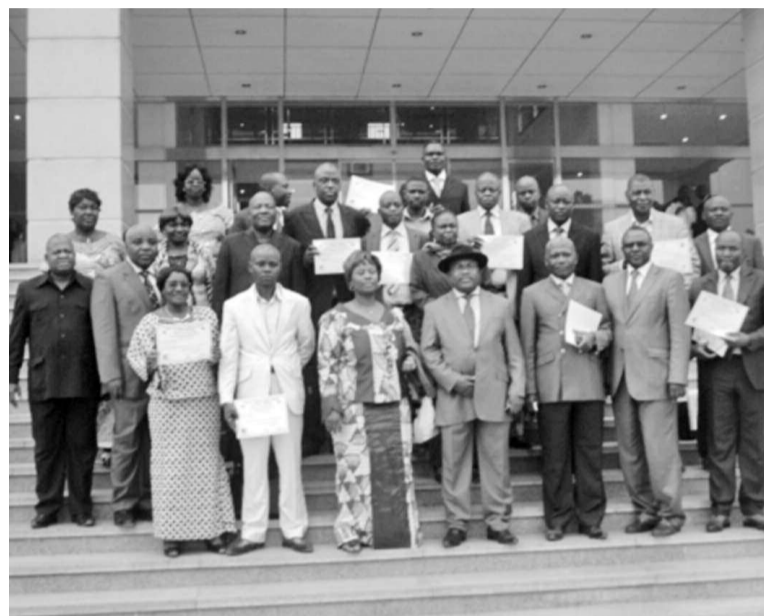
Les officiels posant avec les participants.

Les autres recommandations concernent l'appui technique des outils ; l'intensification du plaidoyer Genre (basé sur l'évidence) ; l'accompagnement des ministères et des collectivités locales pour l'application concrète de la budgétisation sensible au genre avec un guide de méthodologie