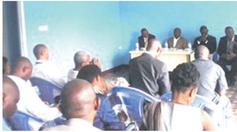
Les orateurs devant les journalistes

Cette activité organisée par FFJ a bénéficié de l'apport des deux grandes figures de la presse en RDC. Il s'agit du secrétaire général de l'Union nationale de la presse du