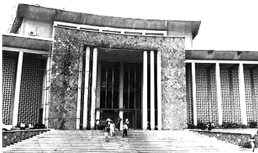
L'Université de Kinshasa

Lentement mais sûrement, le mouvement de grève amorcée depuis le 1er juillet tend vers son dénouement grâce à l'implication personnelle du Premier ministre qui a finalement acquiescé aux revendications du personnel scientifique de l'enseignement supérieur et universitaire. Après moult tergiversations, la rencontre entre Augustin Matata Ponyo et les grévistes a finalement eu lieu le 21 juillet. C'était une occasion pour les deux parties de discuter de vive voix en scrutant toutes les voies susceptibles de parvenir à un modus vivendi. Vingt-neuf délégués des syndicats des assistants et chefs de travaux venus de six provinces (Katanga, province orientale, Équateur, Bandundu, Bas-Congo et Kinshasa) auxquels se sont joints les membres du personnel administratif de l'Enseignement supérieur et universitaire (ESU), ont participé à cette rencontre de vérité. D'après le chef de la délégation de la province orientale, tout s'est bien passé, le Premier ministre ayant marqué son accord de principe quant à l'augmentation de salaire et la mécanisation des assistants. Il ressort de cette audience que les salaires tels