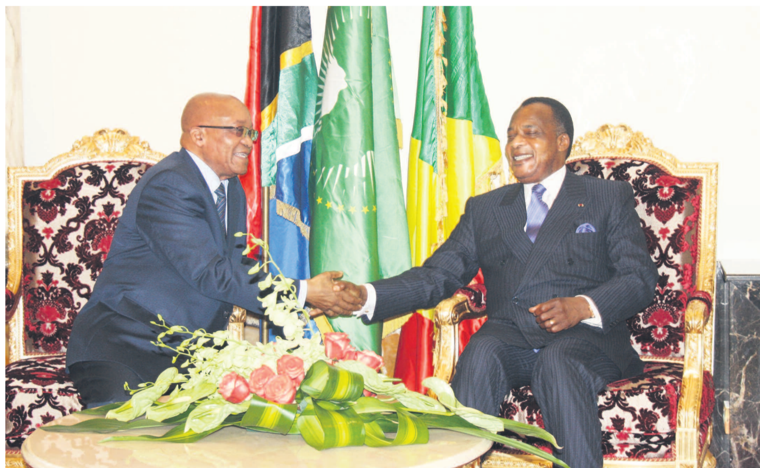
Jacob Zuma et Denis Sassou N'Guesso

La capitale congolaise accueille aujourd'hui, sous les auspices du chef de l'État congolais, Denis Sassou N'Guesso, le forum sur l'« Émergence des classes moyennes africaines ».