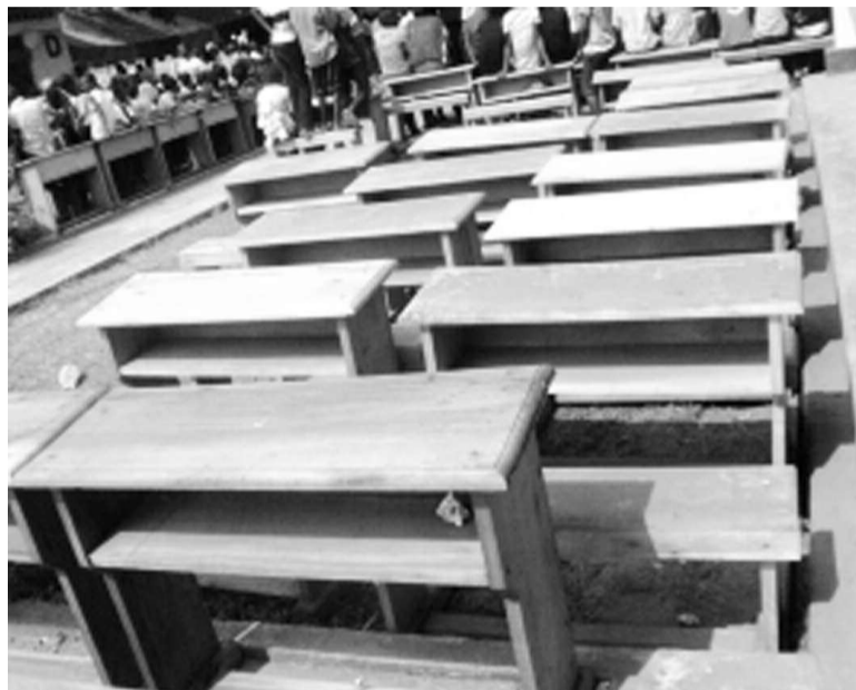
Les tables-bancs remis à l'école Trois-Glorieuses.