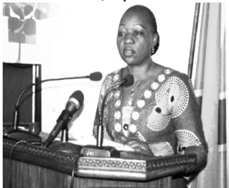
La ministre du Genre, de la famille et de l'enfant, Geneviève Inagosi

Aux signataires et garants de l'Accord-cadre sur la paix, la sécurité et la coopération, les participants leur ont recommandé de veiller à l'implication des femmes dans la conception et la supervision nationale et régionale du plan de mise en œuvre de l'Accord-cadre. Ils devront également inclure dans ce plan des objectifs visant à promouvoir les droits humains des femmes, l'égalité de genre et l'autonomisation économique des femmes.