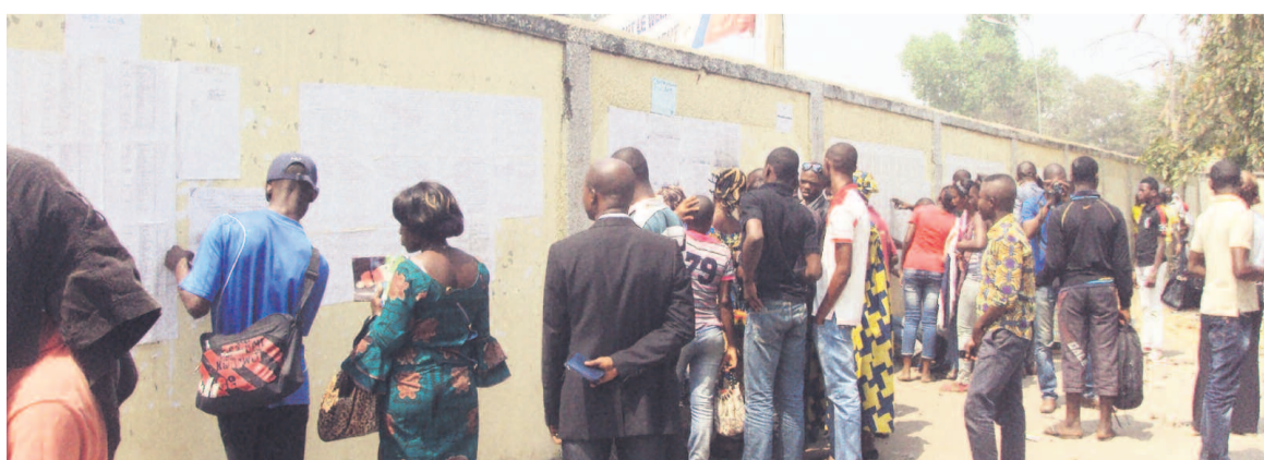
Les candidats vérifiant leurs noms sur les listes d'examen affichées à la Dec