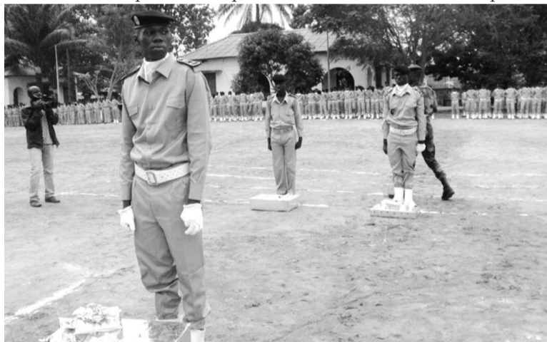
La cérémonie de fin d'année à l'école Général-Leclerc.

Notons que cette année, l'école militaire préparatoire Général-Leclerc a organisé plusieurs activités sportives culturelles. Les élèves ont bénéficié de l'instruction militaire, et les indisciplinés ont été remis à la disposition de leurs parents. Au total, cinquante avertissements écrits ont été infligés cette année contre 67 l'année dernière pour incivisme corporel. Trois élèves de la classe de terminale ont été remis à leurs parents