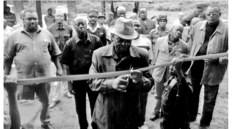
Coupure d'un ruban symbolique

Le 31 juillet s'achève le mandat des différents conseils départementaux de notre pays. L'heure est donc au bilan. À travers leurs visites de terrain et leurs passages sur les médias, les présidents de ces institutions visent à rendre compte de leur gestion quinquennale aux populations. C'est à ce titre que le président du conseil départemental de la Sangha s'est entretenu avec Les Dépêches de Brazzaville.