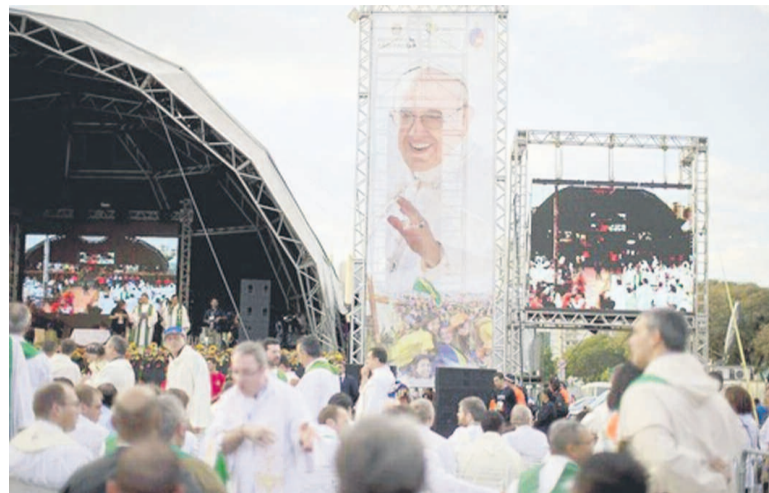
Au Brésil le pape François vient revigorer les jeunes et la vieille Église

Qu'il relance le renouveau de l'histoire chrétienne en Amérique latine et commence, pour ce faire, par le Brésil, est généralement considéré comme tout bénéfique par le catholique lambda. À la croisée des races et des réalités socio-historiques, le Brésil est comme un condensé de ce que l'Amérique latine représente : pays d'accueil jadis des esclaves et de métissages en tous genres mais aussi lieu de développement des