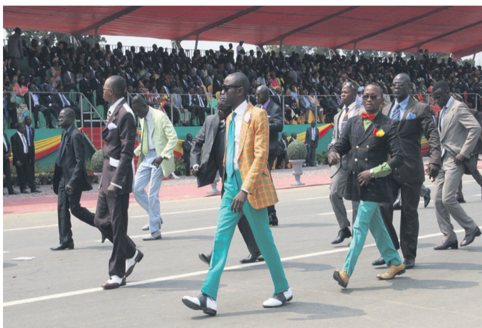
À Djambala, les sapeurs étaient de la partie