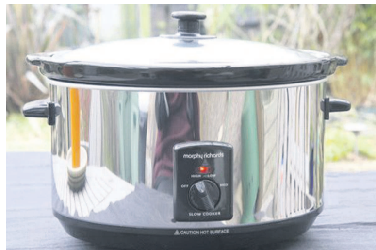
Une marmite électrique

allaient dominer le commerce d'une marmite facile d'utilisation (et de nettoyage) mais incroyablement efficace dans la cuisson des mets les plus coriaces. Dans les marchés, les cocottes-minutes se négociaient à 25 000 voire 50 000 FCFA selon leur contenance. C'était à qui exhiberait sa marmite sifflante – ou qui donnerait à entendre au voisin qu'on était passé à la modernité ! Le retentissement du siffleur signifiait tout simplement que le met était cuit. La cocotte-minute ainsi que d'autres ustensiles modernes ont rendu le temps de cuisson plus court. Au-