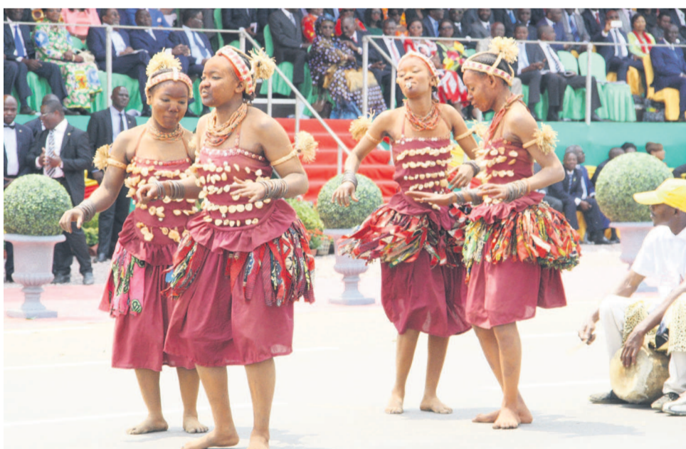
Les Tchikoumbi du Kouilou au défilé