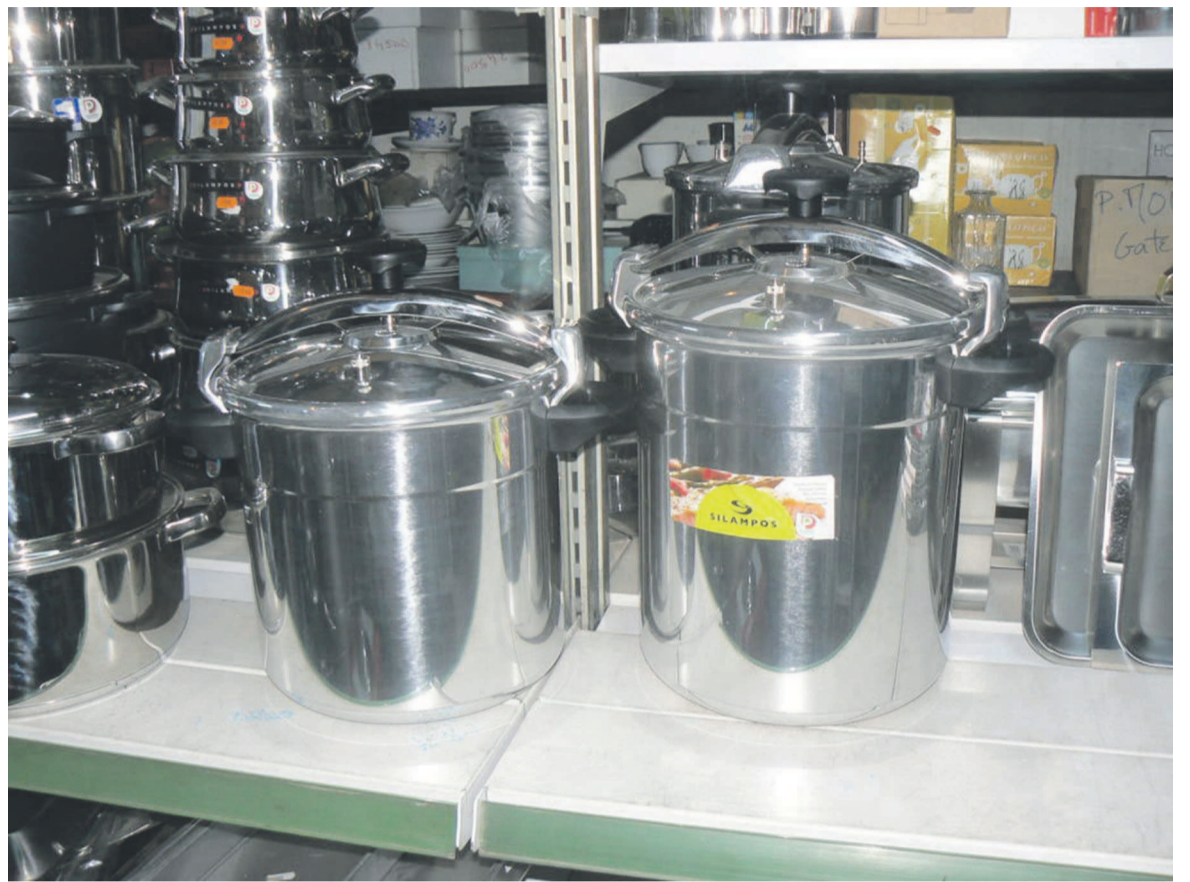
La cocotte-minute dans une boutique du centre-ville de Brazzaville.

aujourd'hui pourtant, l'utilisation de cette marmite semble en perte de vitesse. Soit que beaucoup de familles l'ayant acquise ne se sentent plus de devoir toujours utiliser une marmite qui a, en plus, la réputation d'être increvable, soit que les tendances culinaires orientent vers d'autres joujoux, le fait est que l'effet mode est désormais passé. Avant son intrusion dans le quotidien des Congolais, les plats mettaient du temps à cuire au bois de chauffe, au charbon, ou même au gaz. Pour qui avait programmé un plat aux haricots, il fallait compter une dépense supplémentaire en bois ou en charbon, alors que la cocotte-minute annihilait cela en peu de minutes. Le risque d'ailleurs étant que les plats cuisent plus qu'il ne faut, et que les haricots rêvés se transforment en un infect magma si l'on ne surveille pas de près le temps de la marmite à pression. Aujourd'hui, la donne a changé. Encore plus de Congolais ont voyagé et sont revenus au pays avec des ustensiles en-