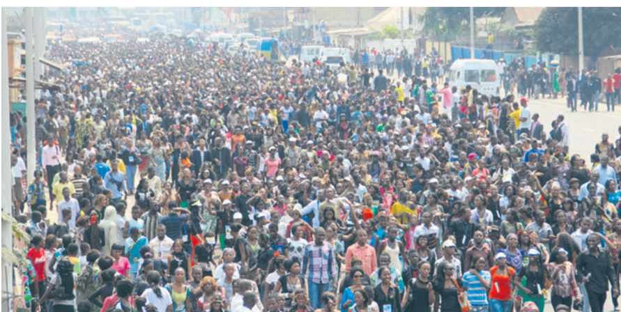
La marée humaine accompagnant le cortège en route vers le cimetière