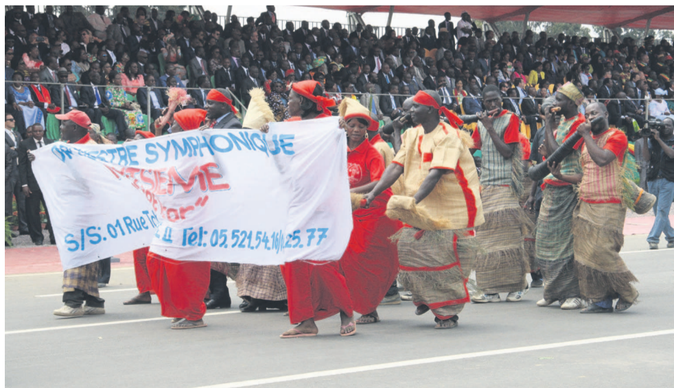
La danse folklorique Mantsiemeé des Plateaux