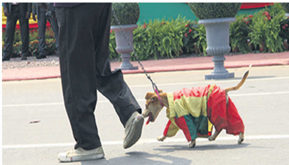
Tout comme les hommes, le chien vêtu aux couleurs nationales a défilé sur le boulevard