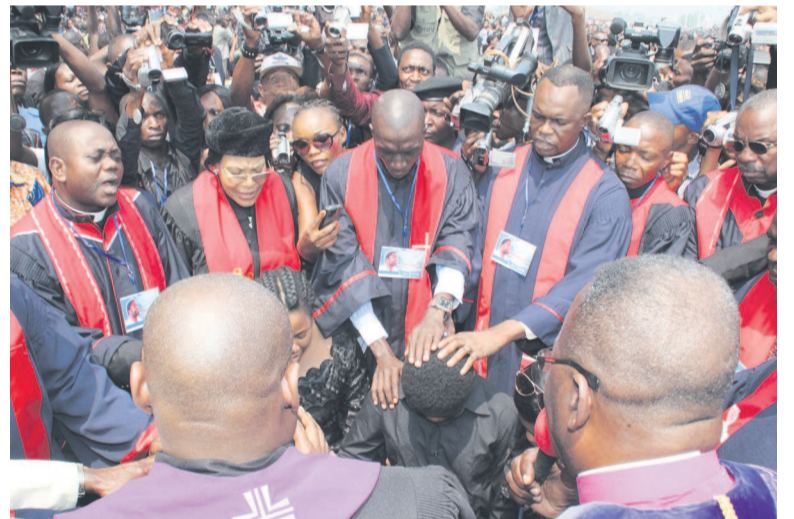
Les hommes de Dieu priant et bénissant les orphelins