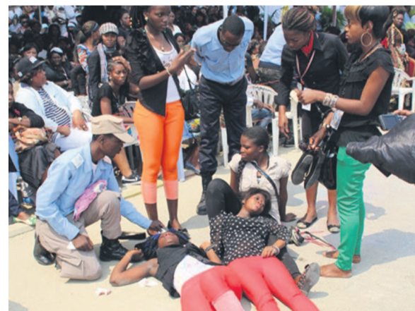
Des jeunes kinoises affalées sous le coup de l'émotion