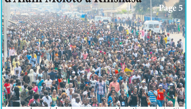
La marée humaine accompagnant le cortège vers le cimetière