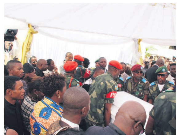
La levée du corps pour la Nécropole Entre ciel et terre