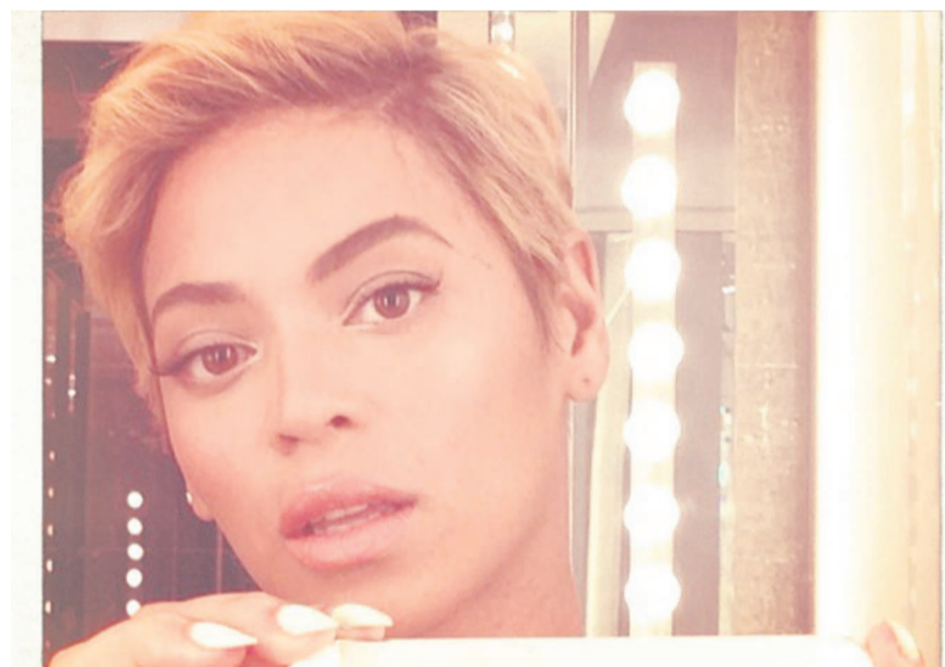
La nouvelle coupe de cheveux de Beyoncé.

Beyoncé : elle fait sensation cet été avec sa nouvelle coupe à la garçonne. Les New-Yorkais sont nombreux à relayer la nouvelle sur Twitter, tout comme l'étrange découverte, le 7 août, d'un petit requin mort dans le métro.