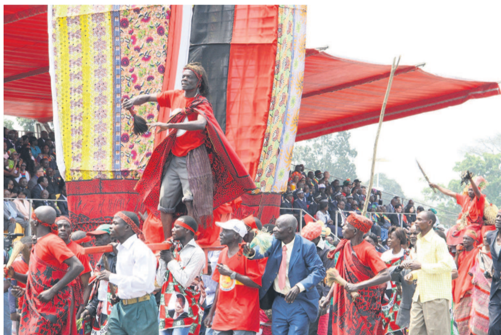
Une exhibition de la culture téké au défilé du 15 août à Djambala