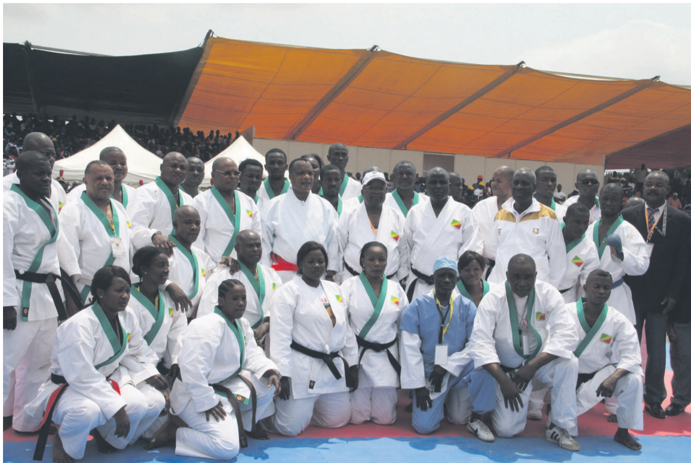
Le président de la République posant les Diables rouges karaté à Djambala