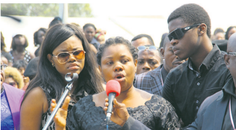
La veuve moloto faisant son témoignage entourée de ses deux aînés