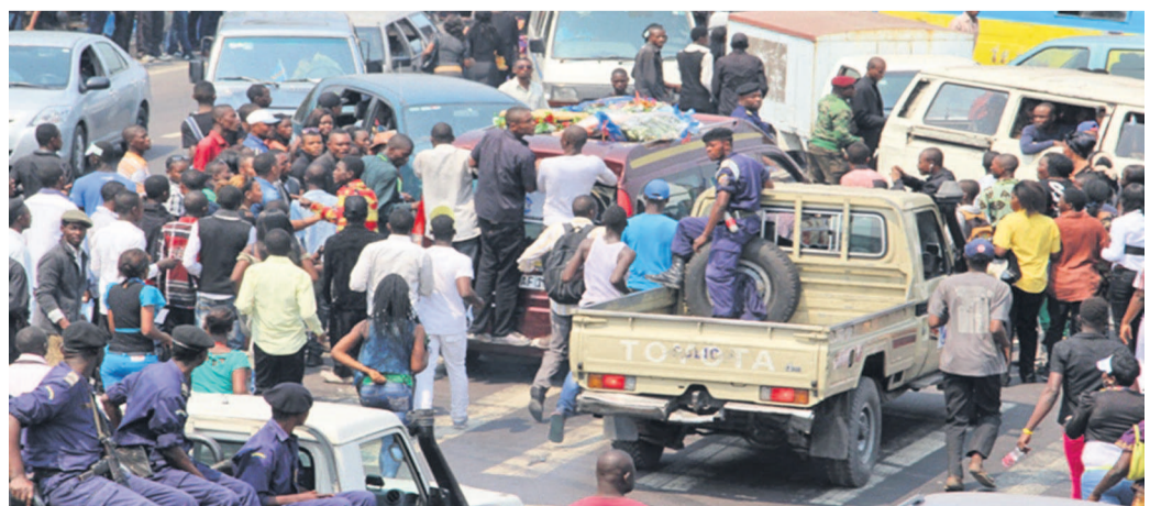
Embouteillage autour du cortège au niveau de Sendwe