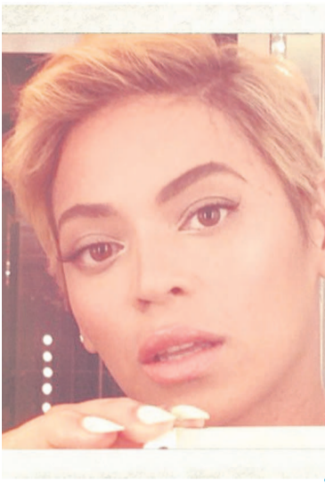
BEYONCÉ : CHANTEUSE

200 FCFA, 500 FC, 1€ www.lesdepechesdebrazzaville.com