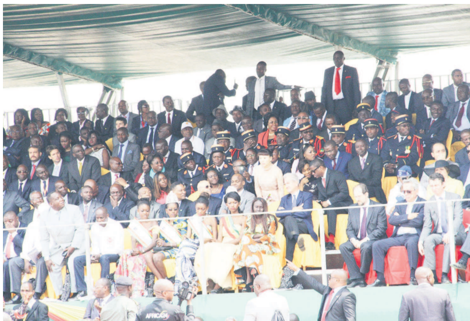
Au premier plan, la miss indépendance avec ses dauphines à la tribune