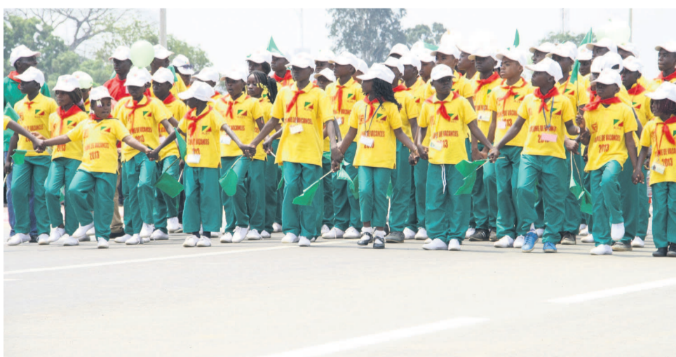
Passage des jeunes en colonies de vacances à Djambala