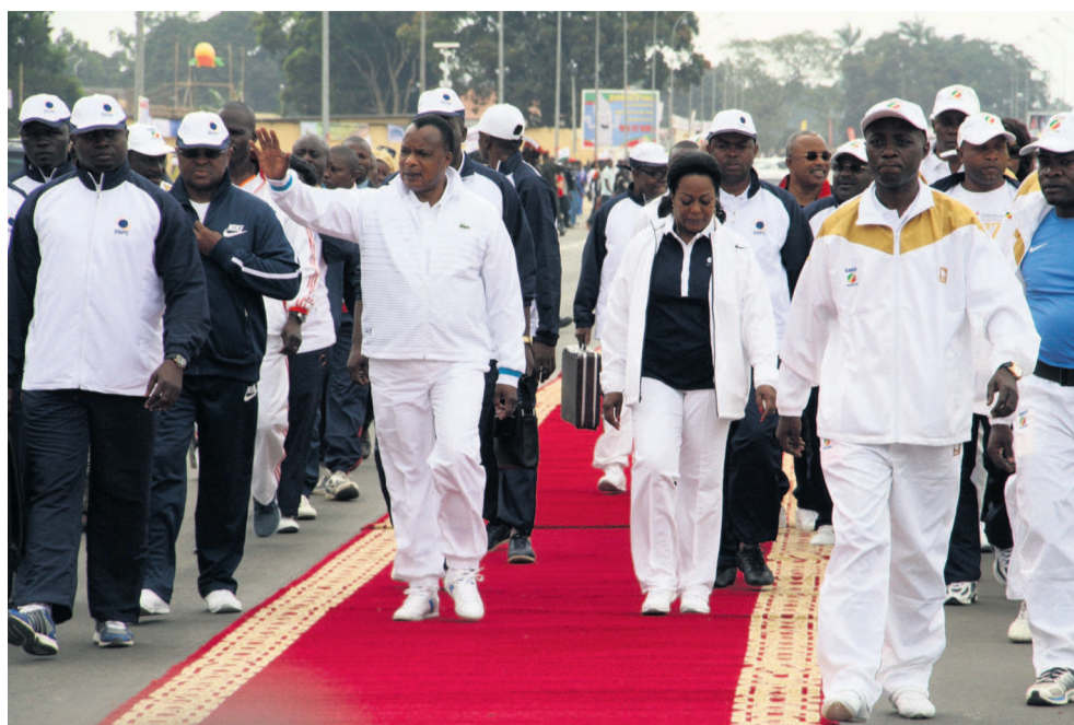
L'arrivée du couple présidentiel au lancement du SMIB