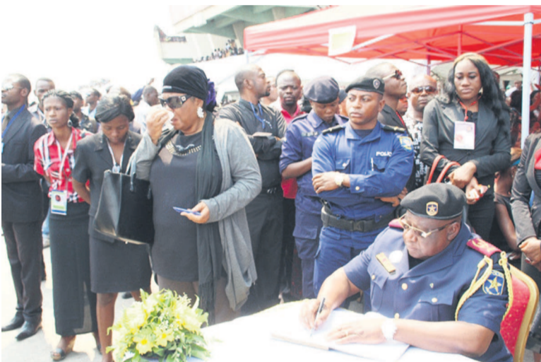
Le général Oleko signant le livre des condoléances