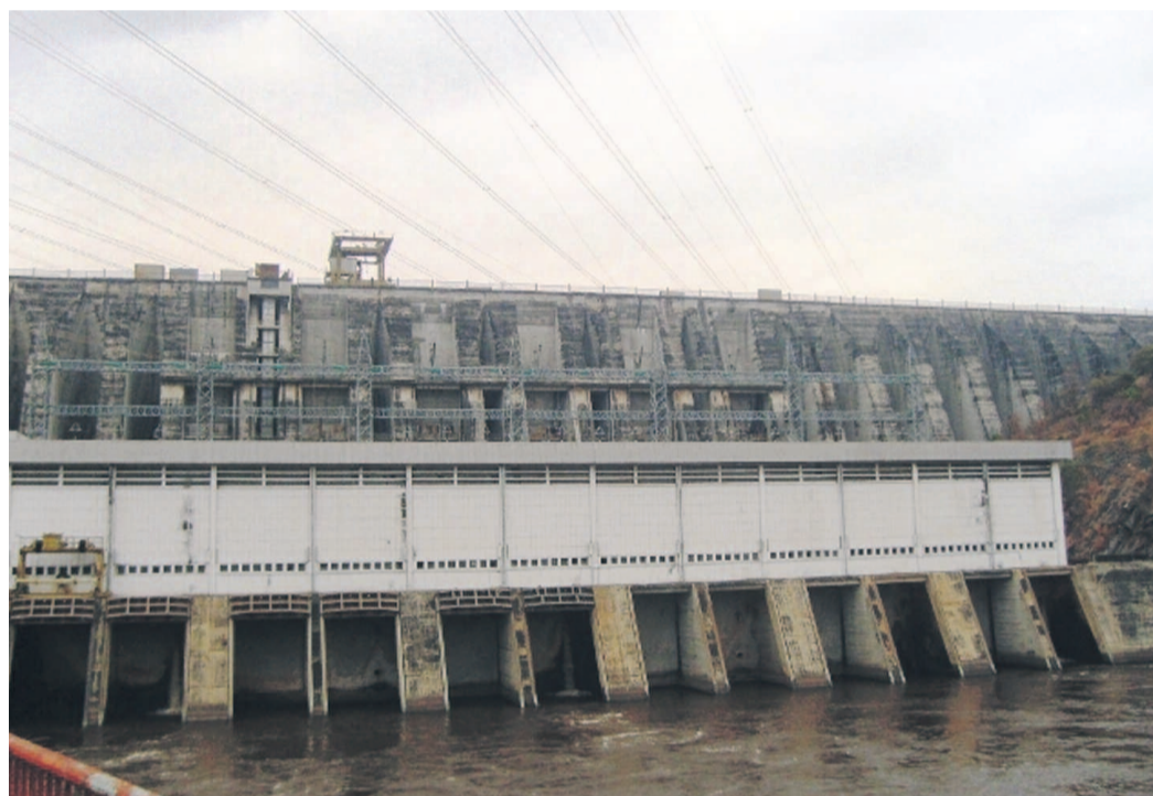
Une vue partielle du barrage d'Inga

L'atelier international de présentation du rapport final des études de faisabilité du développement optimal du site d'Inga et des lignes d'interconnexion organisé du 20 au 21 septembre au Grand Hôtel Kinshasa a permis de dégager quatre options importantes. Il s'agit du mode de partenariat