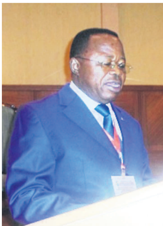
Le ministre Bruno Kapandji expliquant les enjeux du projet

L'atelier international de présentation du rapport final des études de faisabilité du développement optimal du site d'Inga et des lignes d'interconnexion organisé du 20 au 21 septembre au Grand Hôtel Kinshasa a permis de dégager quatre options importantes. Il s'agit du mode de partenariat