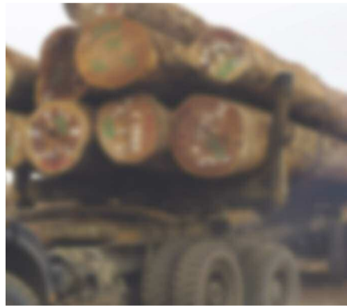
Le grumier procédant au retour à l'usine au port autonome de Pointe-Noire

Chaque année, l'administration forestière accorde des autorisations de coupures aux sociétés forestières qui ont des conventions d'aménagement et de transformations signées avec le gouvernement de la République, avec un quota bien précis des bois à transformer au Congo (85 %). Or, ces sociétés ont dépassé le quota des grumes légalement autorisé à l'exportation. C'est ainsi que l'administration forestière a procédé au blocage de ces grumes au parc à