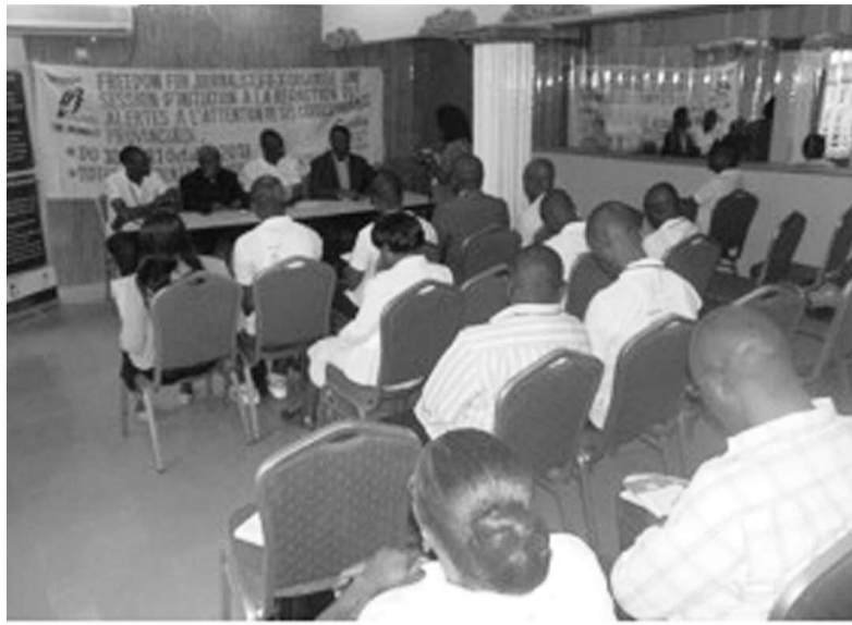
La salle lors du lancement de la formation