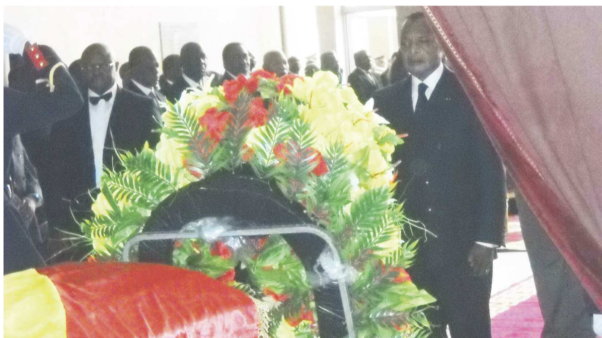
Le président de la République s'inclinant devant la dépouille du disparu