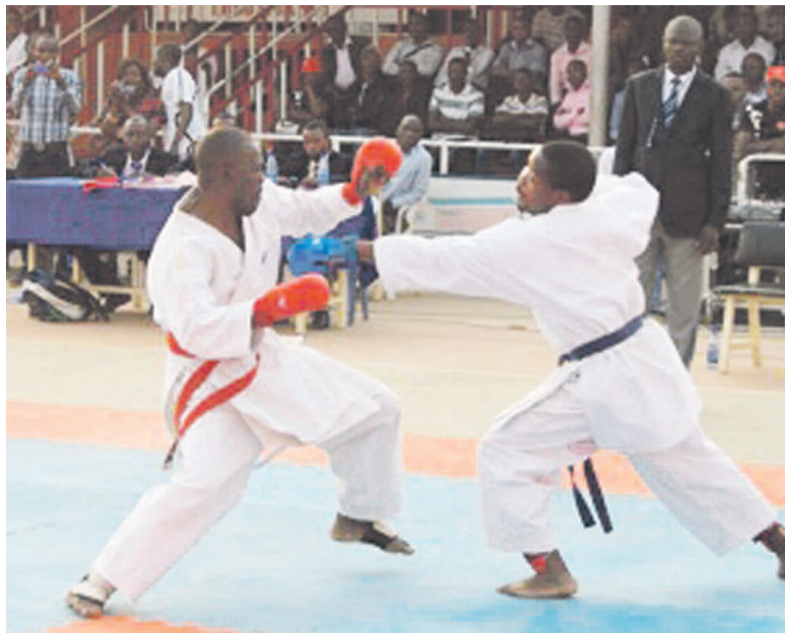
Combat de karaté au championnat national à Lubumbashi

La province du Kasai occidental a été vice-championne avec deux médailles en or engrangées. La ville-province de Kinshasa a été littéralement sous-représentée à cette compétition nationale de l'art martial d'origine japonaise. Deux athlètes seulement venus de la capitale de la RDC ont pris part à cette joute sportive, grâce à leurs propres frais de voyage. Et la capitale s'en est tirée avec une seule médaille en or. Le Kasai