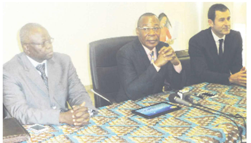
Le président des travaux

callations internationales. Bien évidemment, nous regarderons également les autres aspects liés à la mise en œuvre de l'accord que nous allons signer à la fin de nos échanges », a indiqué Akouala. Abordé par la presse sur les éventualités de réactiver tous les accords signés autrefois avec les autres pays partenaires, l'administrateur général de Congo télécom a déclaré qu'en matière de communication internationale, on paie moins lorsqu'un appel émis au Congo arrive directement en France sans passer par l'Italie. En d'autres termes : « Les