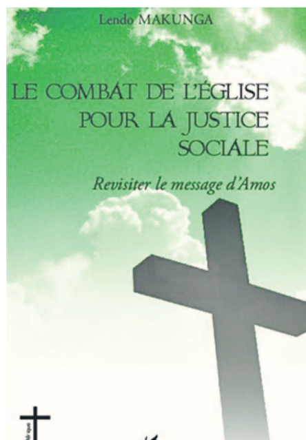
La couverture de l'ouvrage Le Combat de l'Église pour la justice sociale