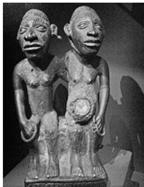
Statuette Kongo/Vili, Congo.

Ce qui donne à cette exposition son caractère exceptionnel, c'est la présence de nombreux objets prêtés par le Musée royal de l'Afrique centrale de Tervuren (Belgique). Fermé pour une longue période de rénovation, le musée belge a accepté de confier certains de ses trésors au musée Dapper, ce qui nous vaut aujourd'hui de découvrir des splendeurs peu connues du grand public. À celles-ci, s'ajoutent des pièces majeures du musée Dapper ainsi que d'autres, issues de collections publiques et privées européennes. Par son approche, claire et didactique, et par la diversité des pièces présentées,