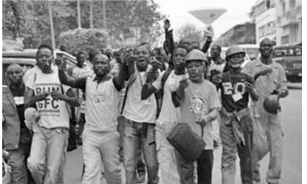
Les travailleurs de la société en colère

Situé à Mengo, à environ 15 km de Pointe-Noire, la société China-Wu-Yi-Sarl est une sous-traitante de la société MPC Industrie. Elle compte environ 500 travailleurs, et elle est en train d'exécuter pour le compte de la société MPC Industrie, les travaux de construction