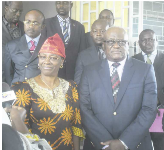
Le ministre des Sports et l'ambassadrice du Nigeria.