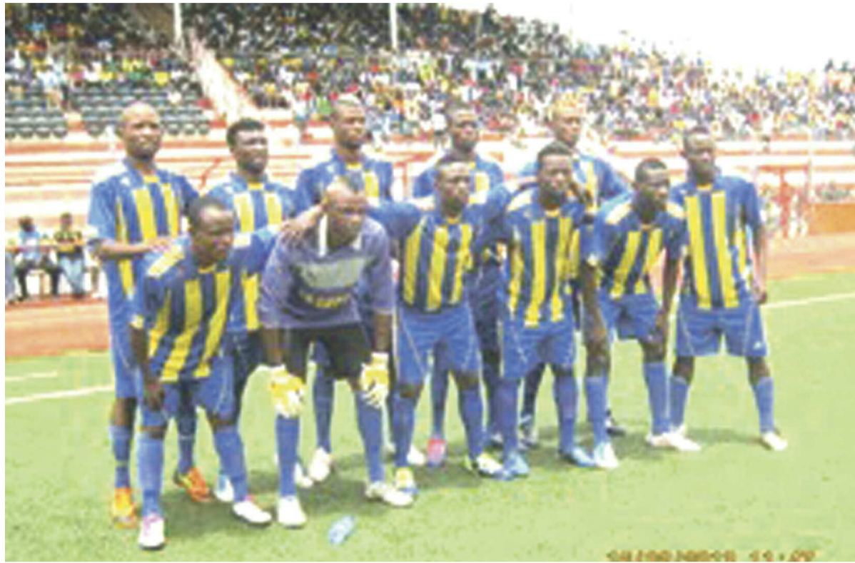
Le FC Saint-Éloi Lupopo de Lubumbashi