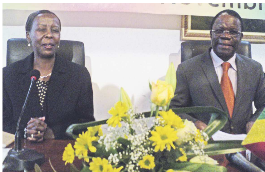
Louise Mushikiwabo et Basiele Ikouebe à l'ouverture de la grande commission mixte

La ministre rwandaise des Affaires étrangères et de la coopération, Louise Mushikiwabo, a sollicité jeudi, à l'ouverture des travaux de la 3ème grande commission mixte des deux pays, le plaidoyer de la République du Congo lors du prochain sommet en faveur de la réadmission de son pays au sein de la Communauté économique des États de l'Afrique centrale (Céeac).