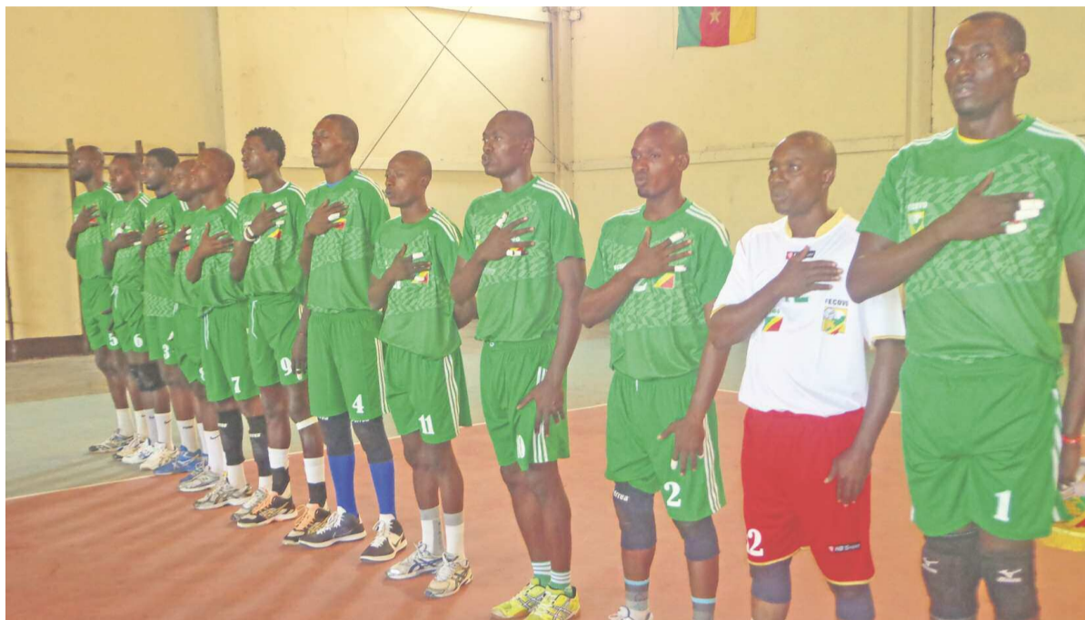
Les Diables rouges Volley-ball

Les deux sélections nationales qui ont bien entamé le tournoi n'ont besoin que d'une victoire, ce 8 novembre, pour valider leurs tickets si elles veulent poursuivre la compétition.