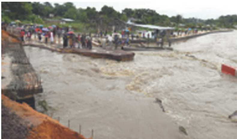
Les eaux de la rivière Mfilou débordent

La pluie diluvienne qui s'est abattue hier à Brazzaville a endommagé une partie de l'avenue de l'Auberge de Gascogne rendant difficile la circulation des habitants des quartiers Kingouari, Massina, Kinsoundi, Barrage et Nzoko, dans le 1 er arrondissement de Brazzaville.