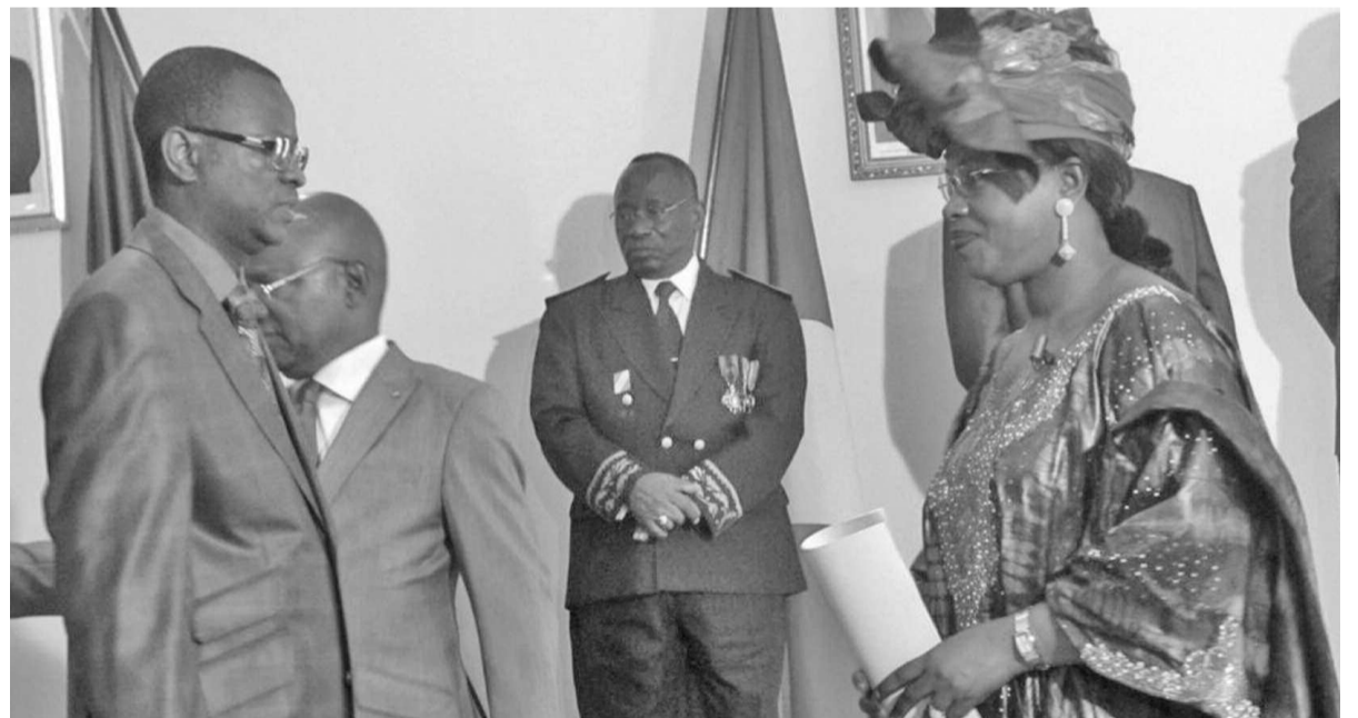
L'ambassadrice du Sénégal au Congo, Batoura Kane Niang, installant le consul général.

La cérémonie s'est déroulée le 7 novembre dans la salle de conférence de l'hôtel Elais sous les auspices de Batoura Kane Niang, ambassadrice extraordinaire et plénipotentiaire du Sénégal au Congo et en présence des autorités départementales.