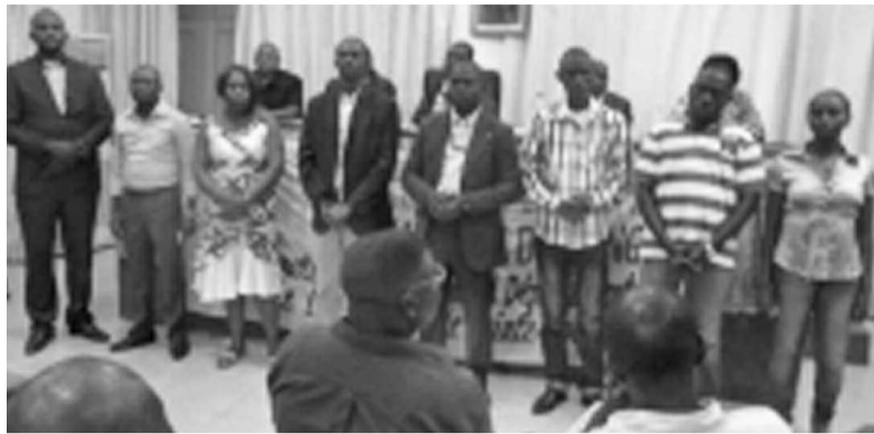
Les membres du bureau exécutif du conseil départemental de la jeunesse de Pointe-noire.

Au terme des travaux, les jeunes ont formulé des recommandations au gouvernement et au ministère de l'Éducation civique. Ils proposent la création et la protection des équipes