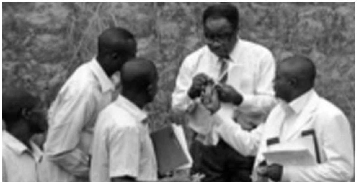
Un chantier de fouilles à la Pointe hollandaise, près du port fluvial de Brazzaville

vaux, il se fait aider par le Collège de France, le Muséum national d'histoire naturelle, l'université Paris I, mais également par les ministères congolais de l'Enseignement supérieur, du Tourisme ainsi que par l'université Marien-Ngouabi. Dans la base de recherches archéologiques installée près des grottes préhistoriques du Val de Louolo (une rivière à la frontière de Kindamba et de Mindouli), les étudiants sont initiés aux techniques de fouilles et aux géosciences.