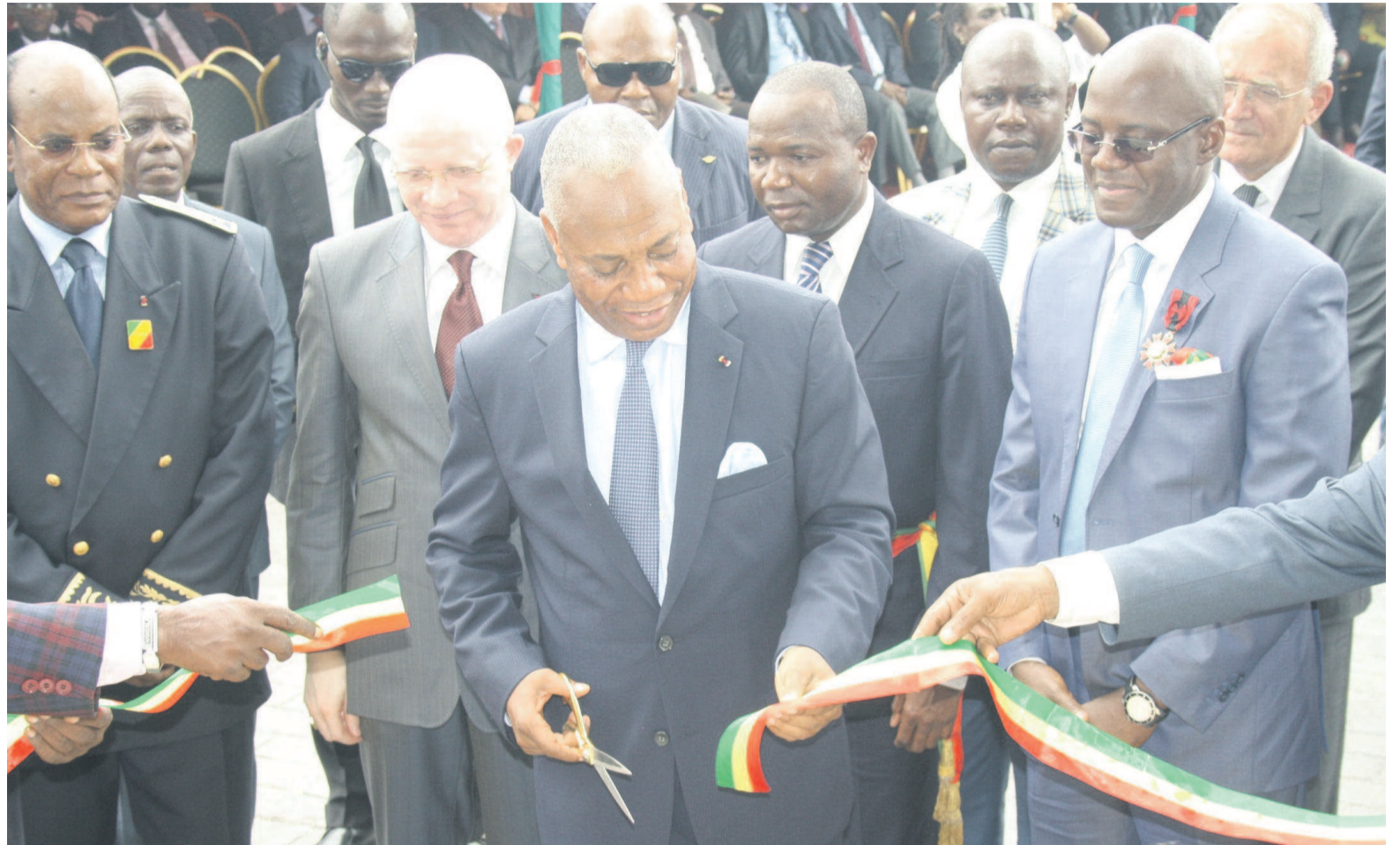
La coupure du ruban symbolique par le ministre d'État Firmin Ayessa