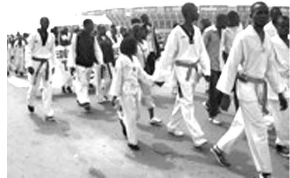
Les taekwondo'ins de la RDC

Le coup d'envoi du tournoi avec des combats est prévu dans l'après-midi du 29 novembre.