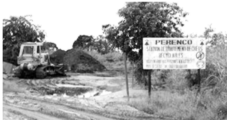
Un site de Perenco, à Moanda