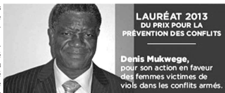
Denis Mukwege est lauréat du Prix de la Fondation Chirac depuis octobre dernier

PRIX DE LA FONDATION CHIRAC POUR LA PRÉVENTION DES CONFLITS