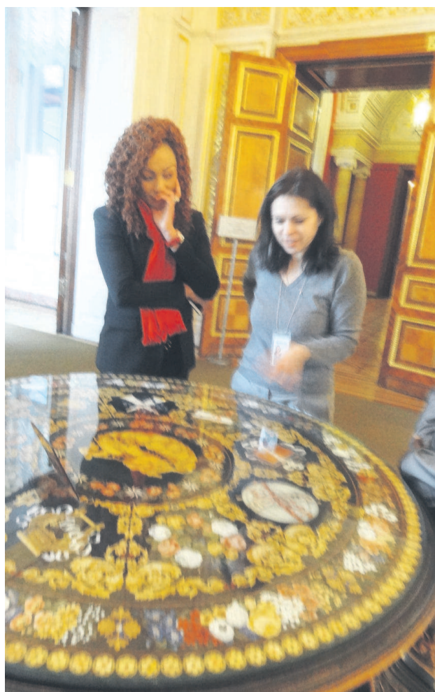
Table de jeux ayant appartenu à l'impératrice Cathérine II au Musée de l'Hermitage à Saint Petersburg