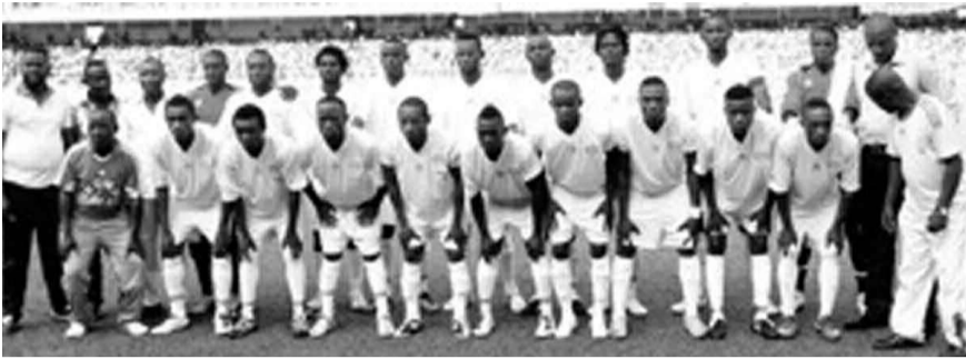
Forfait maintenu contre le DCMP par la Fécofa

L'instance faîtière du football de la RDC a réservé une fin de non-recevoir au recours des Immaculés de la capitale à propos du forfait qui leur a été infligé par la Linafoot. La Fécofa a ainsi rejeté l'appel du DCMP juste au niveau de la forme.