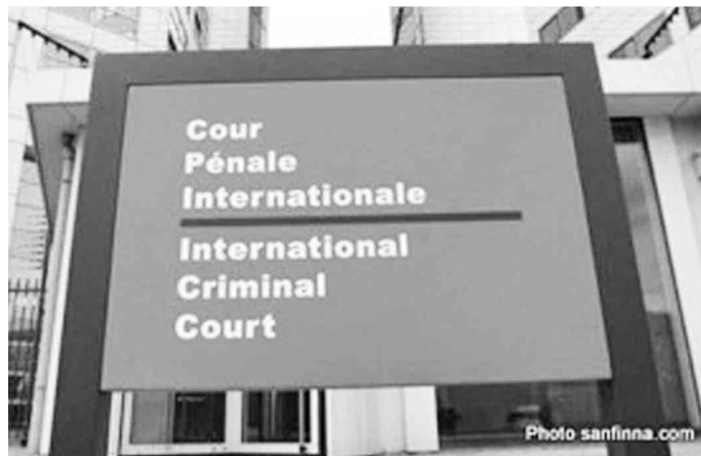
Le siège de la CPI, à La Haye

La société civile a, en effet, noté que les procédures de la CPI contre Uhuru Kenyatta et William Ruto, qui ont été élus, respectivement, en tant que Président du Kenya et Vice-président, ont généré des critiques infondées contre la Cour. Selon elle, l'Assemblée des États Parties (AEP), qui se tient du 20 au 28 novembre à La Haye intervient à un moment de grands défis pour la CPI en ce qui concerne l'Afrique, y compris les perceptions erronées au sujet des allégations selon lesquelles