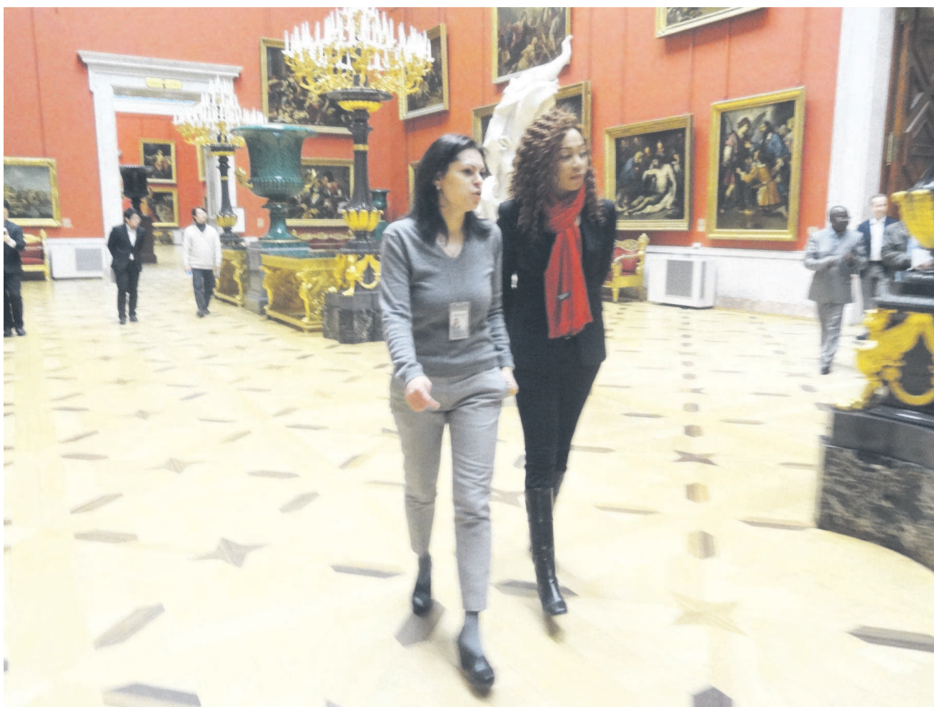
Visite de la salle spéciale contenant les toiles authentiques des peintres : Léonard de Vinci, Raphael, Rembrandt...