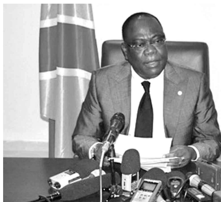
Le ministre des PT-NTIC, Typhon Kin-Kiey Mulumba

En effet, il est connu que cette mafia communément appelée « Sim-Box » fonctionne grâce à une connexion Internet et des cartes SIM qu'on acquiert chez les opérateurs de téléphonie mobile. Les pirates faisaient ainsi apparaître les appels venant de l'étranger comme émis à partir de la RDC. Le fait qu'on ait découvert chez les fraudeurs des stocks impressionnants de cartes SIM trafiquées de tous les opérateurs mobiles ne fait pas douter sur leur complicité, se convaincre le ministre. Les cartes Sim frauduleuses saisies chez les maffieux proviennent, entre autres, des opérateurs Orange (avec 972 cartes Sim), Vodacom (967 cartes Sim), Tigo (544 Sim), Africell (507 Sim box), Airtel (125 sim).