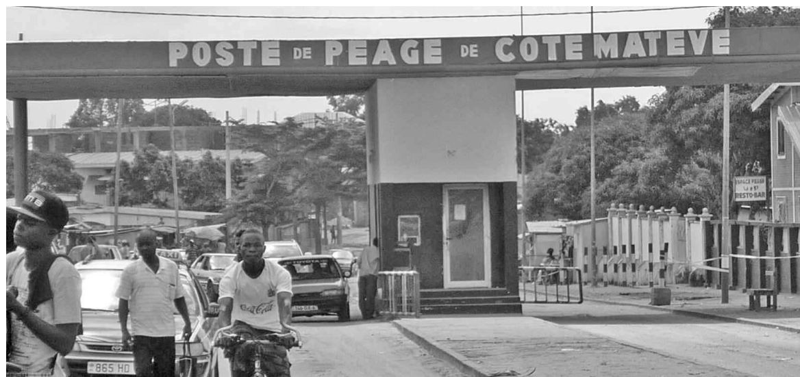
Le poste de péage de Côte Matève

Situé sur la route nationale n°4, plus précisément dans le 6e arrondissement de Pointe-Noire, l'emplacement du poste de péage de Côte Matève suscite de grands débats au sein de la population de la circonscription unique de Ngoyo. « Ce poste de péage n'a plus sa raison d'être, nous voulons qu'on le déplace plus loin d'ici », s'est confiée discrètement aux Dépêches de Brazzaville , une vendeuse du marché Péage.