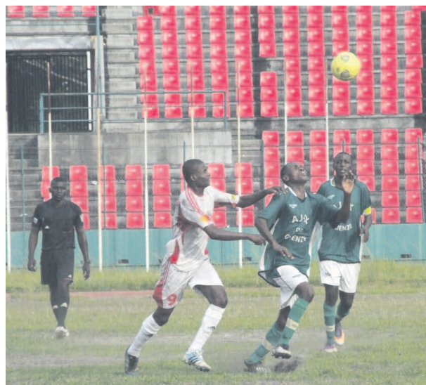
Une contre-attaque de l'équipe d'Ajax de Ouenzé.