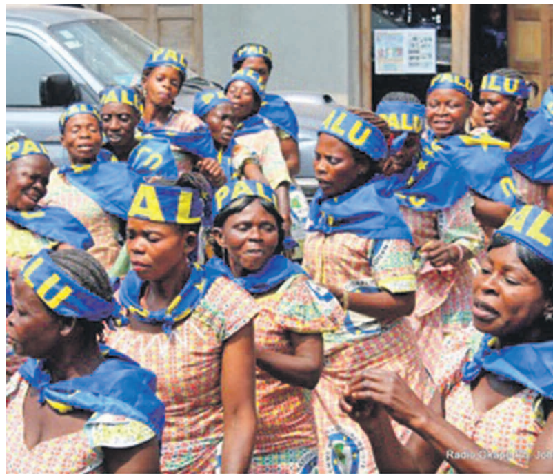
Des femmes du Palu