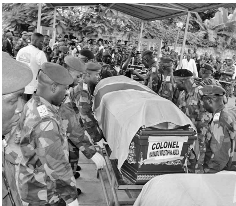
Levée de corps à la clinique Ngaliema