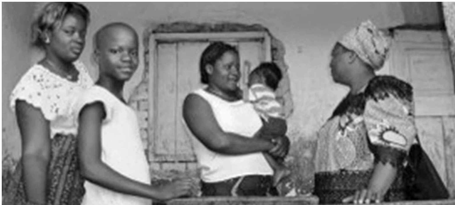
L'adoption de la loi sur la reproduction permettra de réduire le taux de mortalité infantile et maternelle

C'est dans ce cadre qu'elle a ciblé dans son action de plaidoyer les députés nationaux qui ont la responsabilité de voter des lois. Au cours d'un déjeuner de presse que cette coalition vient d'organiser à l'hôtel Sultani dans la commune de la Gombe en faveur de la proposition de loi sur