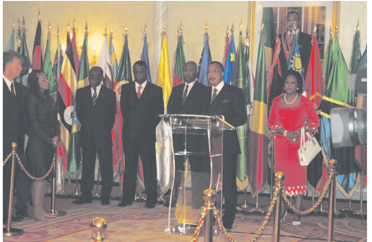
Le président de la République s'adressant au corps diplomatique

Denis Sassou N'Guesso a lancé le même appel en direction des deux Soudan, mais également des dirigeants du Soudan du Sud afin que cessent les violences. Il a formé le vœu qu'une solution définitive soit trouvée au conflit israélo-palestinien. « Le Congo accorde au multilatéralisme un intérêt particulier, car il est la source des réponses aux ques-