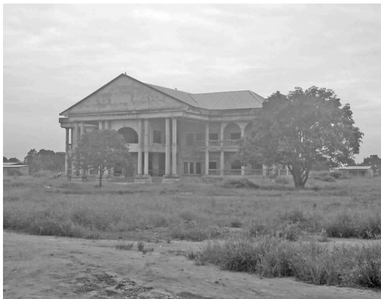
Le siège inachevé de la mairie de Ngoyo.

Intronisé en début 2012, le maire de Ngoyo occupe avec ses administrés une bâtisse louée à un prix onéreux. Les agents de la mairie et des services déconcentrés s'agglutinent dans les quelques pièces à leur disposi-