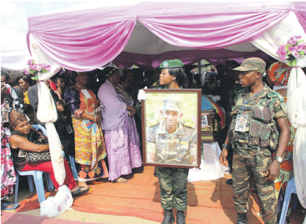
La chapelle ardente dressée au camp Kokolo