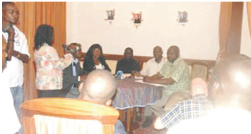
Les défenseurs des droits de l'Homme devant la presse