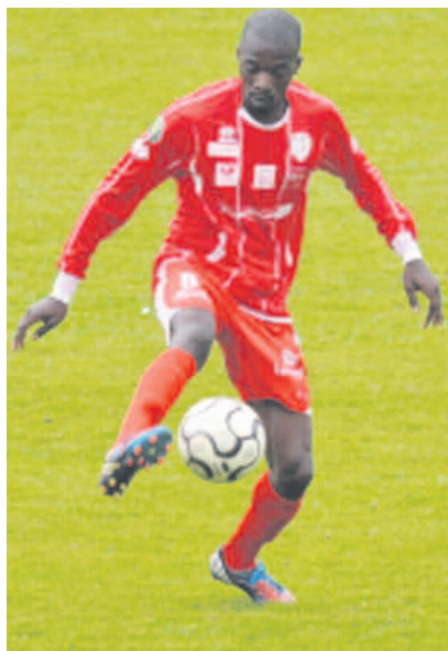
Doté d'une technique appréciable balle au pied, l'ancien Rennais pourra être utile grâce à sa qualité de passe, notamment dans la première relance

Mer, Cannes, Kocaelispor, Hamilton et Beauvais, a débarqué en Algérie samedi. Le lendemain, après une visite médicale, il paraphait son contrat, sans test préalable. Dès qu'il aura obtenu son visa pour la Tunisie, il rejoindra son équipe à Sousse, où la JSM sera en stage de préparation pour la phase retour. La reprise aura lieu le 17 janvier par un périlleux déplacement chez le Mouloudia d'Alger.