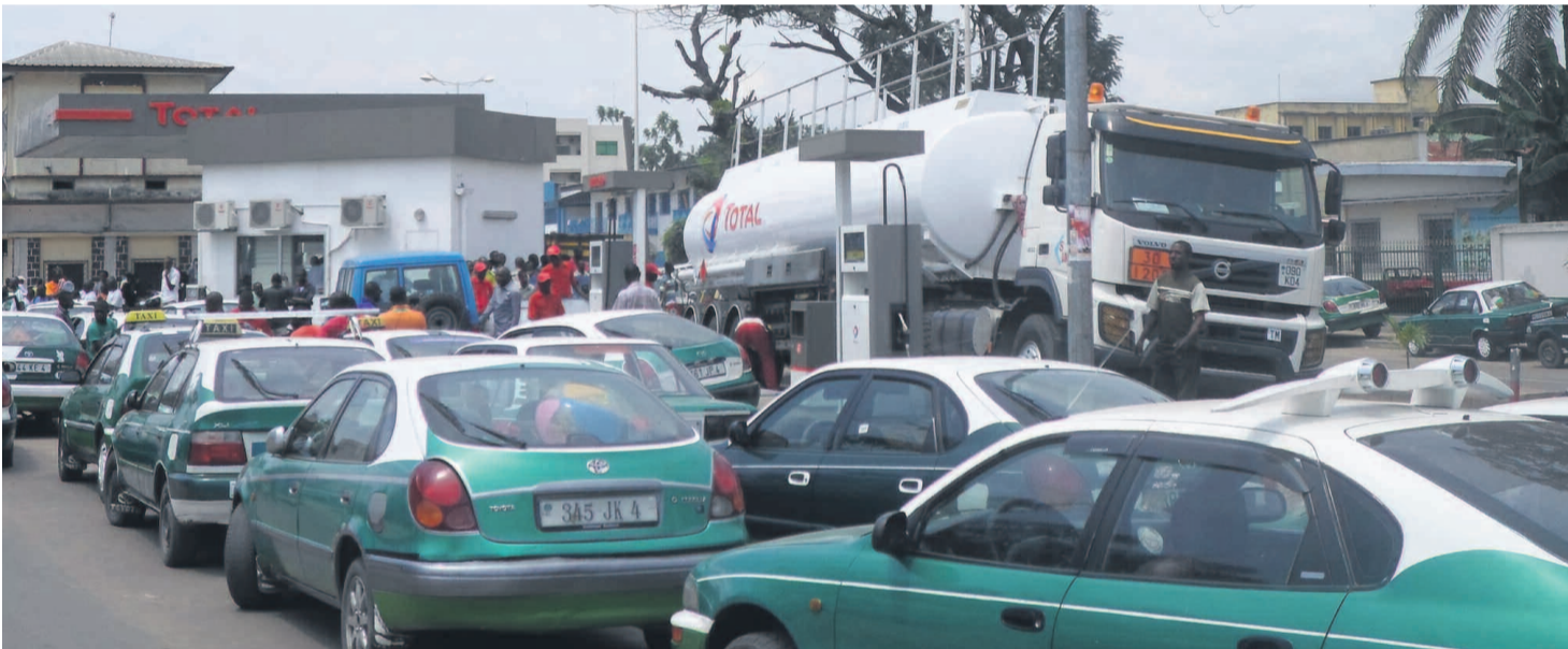
Une file d'attente devant une station service

Une pénurie d'essence, aux origines non révélées, perturbe fortement le transport en commun, depuis vendredi, occasionnant ainsi une augmentation de la course qui est passée de 1000 à 1500 FCFA chez certains taximen notamment.