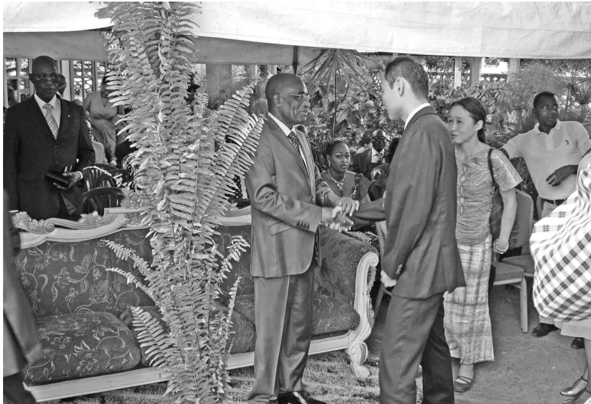
Poignée de main avec l'un de ses partenaires.

Ce ministère prévoit la production d'intrants aquacoles, le renforcement des capacités humaines et techniques et des capacités de surveillance du territoire marin et fluvial; l'intensification de l'appui aux communautés de pêche, la