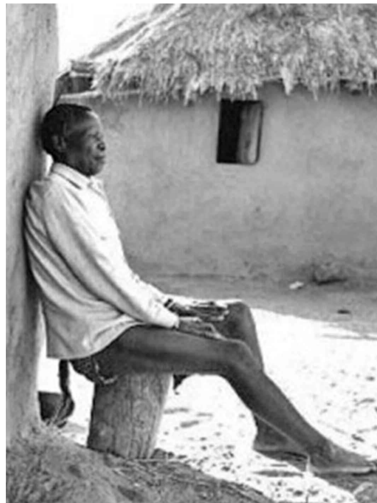
Les personnes âgées méritent l'attention et le soutien de la communauté