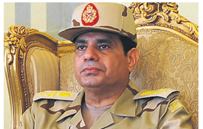
Le général Abdel Fattah Al-Sissi

l'élection présidentielle se tiendrait avant les législatives. Plusieurs observateurs estiment que ce calendrier sera profitable au maréchal Al-Sissi, âgé actuellement de 59 ans. Rappelons que depuis l'éviction du président islamiste Mohamed Morsi, le seul président jamais élu démocratiquement en Égypte, les frères musulmans, qui l'avaient porté au pouvoir, ne cessent chaque jour qui