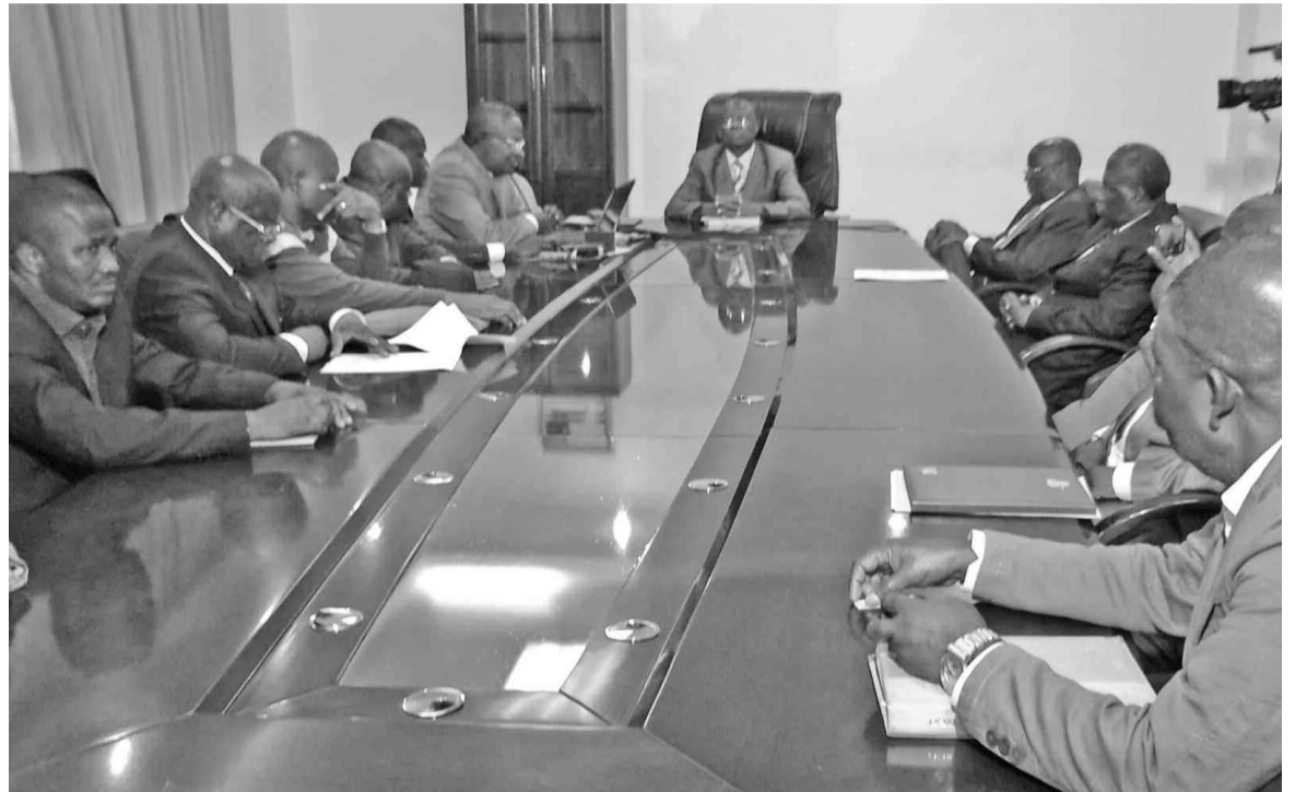
Les membres de l'ADC lors de la réunion.

Réunis en séance de travail le 25 janvier à Brazzaville, dans le cadre de l'Association des départements du Congo (ADC), les présidents des conseils départementaux vont formuler à l'endroit des autorités compétentes quelques observations sur la marche de la décentralisation administrative des départements.