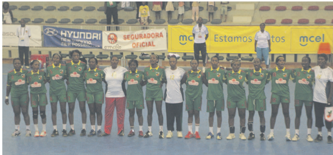
Les Diables rouges dames chantant la congolaise