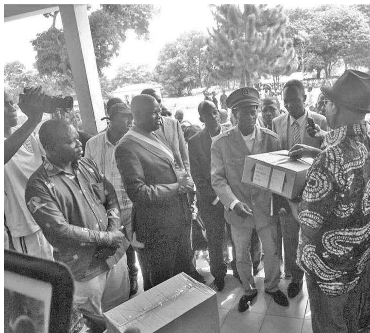
La cérémonie de remise de dons

Devant le désarroi des habitants d'Onguia, les responsables des clubs Rotary de Brazzaville, qui avaient pris l'engagement de secourir ces habitants et constatant qu'au centre hospitalier universitaire (CHU) de Brazzaville il y avait des lits qui étaient déclas-