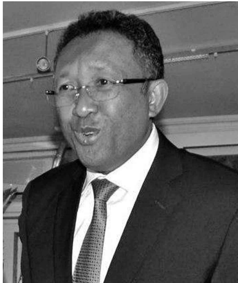
Le président Hery Rajoanarimampianina