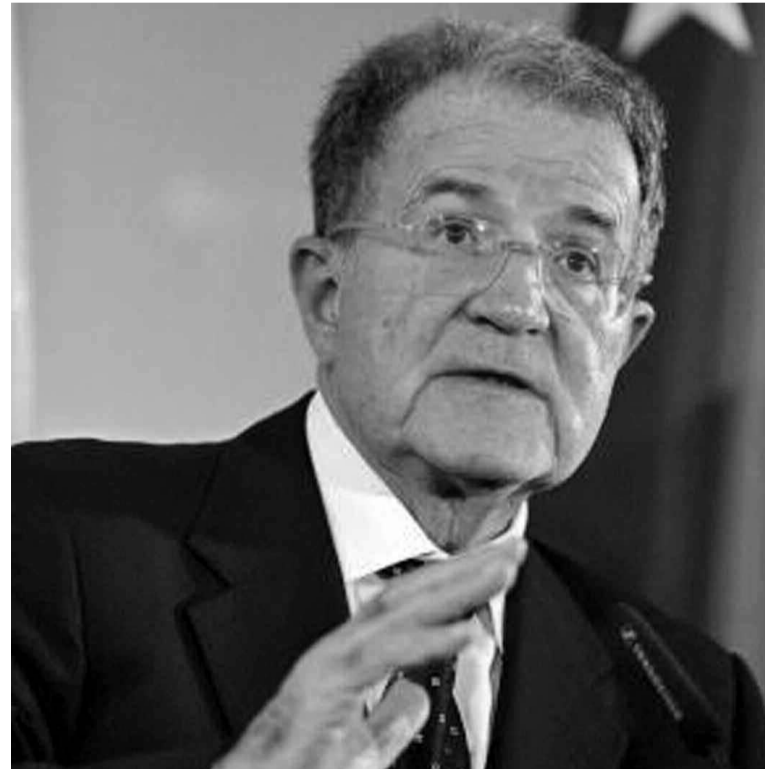
L'ancien Premier ministre Romano Prodi

été absente des préoccupations mondiales, mais cette fois ce n'est pas au chevet d'un grand malade