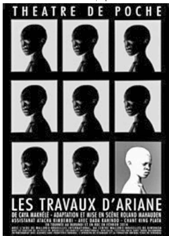
Le spectacle est promis à une diffusion prioritairement africaine