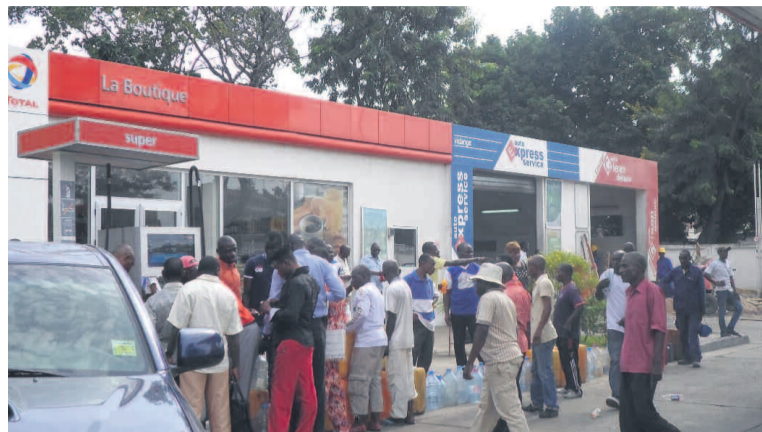
La queue devant les stations-services qui font face à la pénurie de carburant

«Nous sommes un entrepositaire. Nous recevons des produits. C'est un problème de capacité. Hier il y