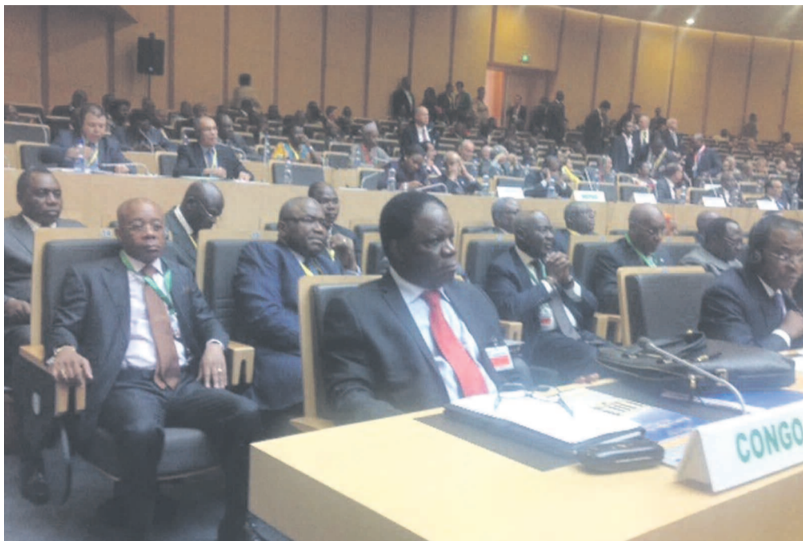
La délégation du Congo. Au premier plan Basile Ikouébé, ministre des Affaires étrangères, suivi des ministres Coussoud-Mavoungou et Mokoko.

agenda apprêté par les commissaires de l'UA énumèrent les axes du développement de l'Afrique les cinquante prochaines années, il est revenu dans le discours de Nkosazana Zuma de ces interpellations souvent entendues dans l'arène de l'UA. À savoir, entre autres, réaliser l'unité du continent sans laquelle les engagements seront vains, renforcer les commissions économiques sous-régionales afin de promouvoir à terme l'intégration du continent, mettre un terme aux guerres récurrentes au sein des États et à leur cortège de malheurs pour les populations.