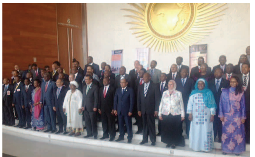
Photo de groupe à l'ouverture de la session