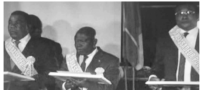
Les trois nouveaux ambassadeurs