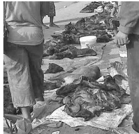
Vente au marché de Ouessou de la viande de brousse en période de fermeture de chasse

interpellation. Ainsi donc, le laxisme des agents des Eaux et Forêts présents dans la localité annihile les initiatives et toutes les dispositions de lois prises par les autorités nationales.