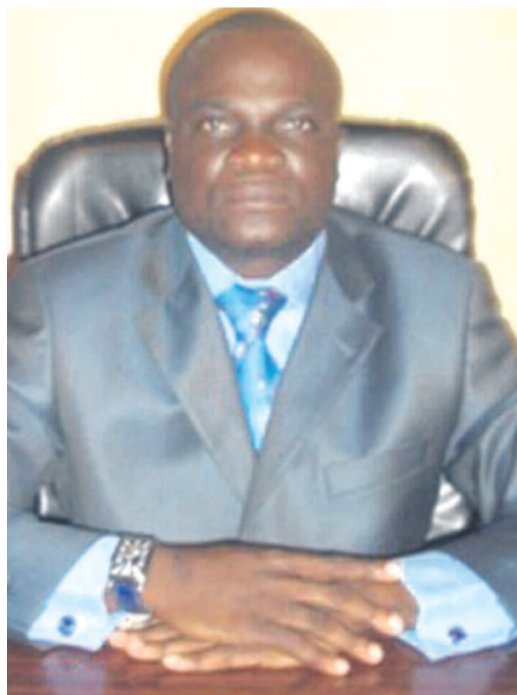
Le député national Willy Bakonga

Une information faisant état de l'arrestation du député Willy Bakonga a circulé à Kinshasa le 14 février. Ce membre de la majorité présidentielle, à en croire des sources, aurait été accusé de viol sur mineure et traîné devant la justice. Alors qu'il devrait être transféré au parquet général de la République, des sources judiciaires citées par radiookapi.net, ont fait savoir que son instruction ne pourrait se faire qu'au niveau du parquet au regard de son statut de député national. Cependant, aucune indication n'a encore été fournie quant aux circonstances ayant conduit à cette arrestation qui n'est pas la première du genre mettant en cause un officiel. Tout ce que l'on sait est qu'elle est intervenue le jour de la Saint-Valentin que de nombreux jeunes filles et garçons ont dévié de son contenu pour en faire une fête de la dépravation et de la déperdition morale sur fond de licence sexuelle.