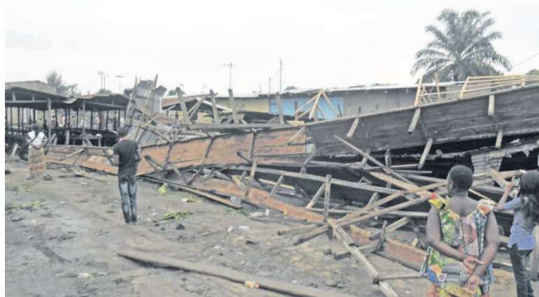
Une vue partielle du marché de Diata après l'orage

fourniture d'eau et d'électricité, la cherté des produits de première nécessité et les modalités de paiement des arriérés et arrérages des retraités. Un intervenant a informé le député que l'eau de la Société nationale de distribution n'était pas de bonne qualité. Sa couleur jaunâtre, a-t-il dit, atteste bien sa mauvaise qualité. «Tous les Congolais n'ont pas les moyens fi-