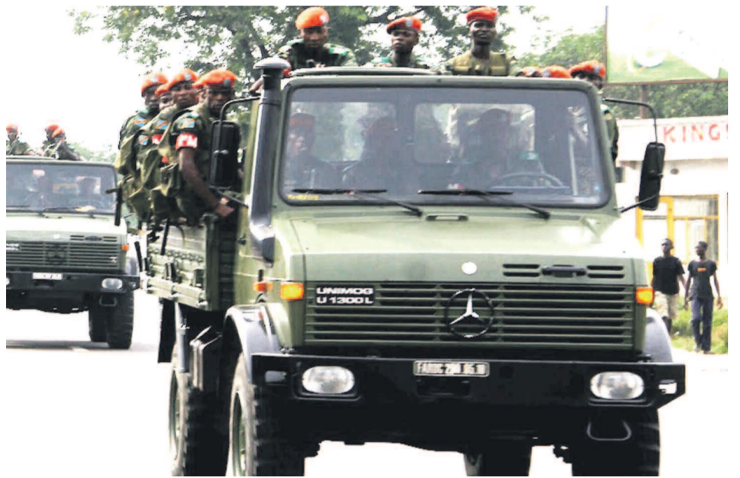
Un convoi des Fardc