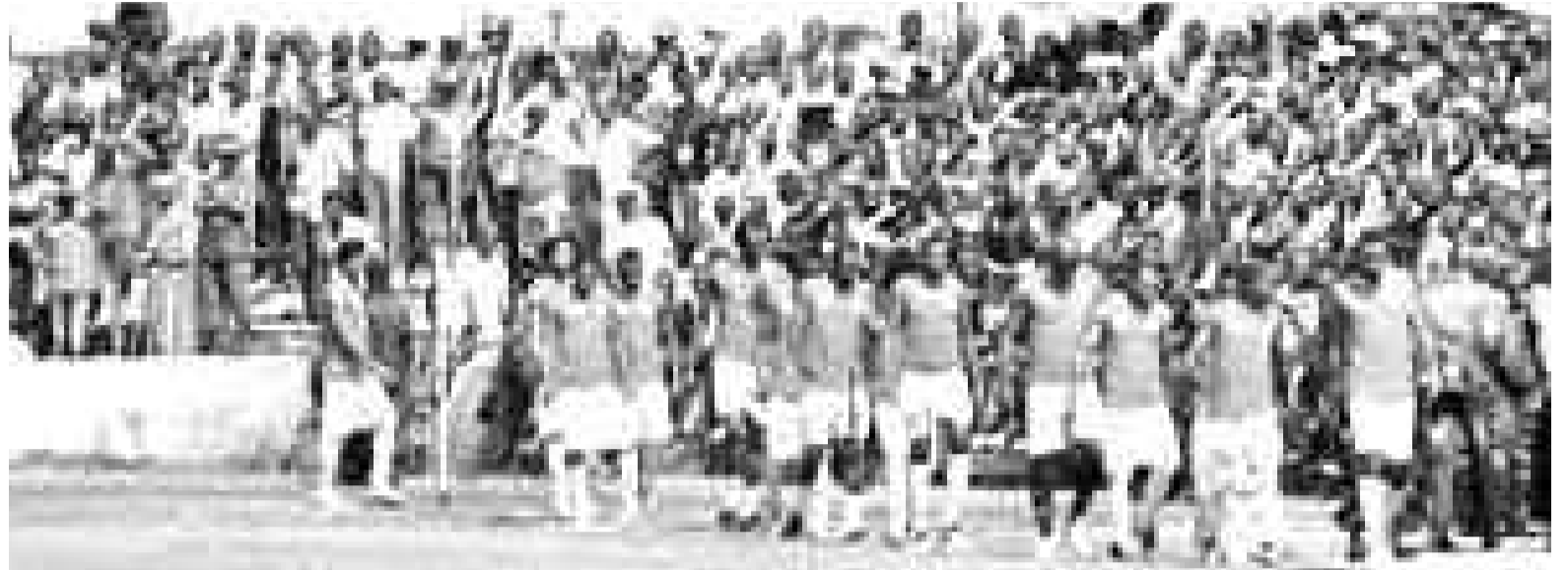
Sanga Balende de Mbuji-Mayi