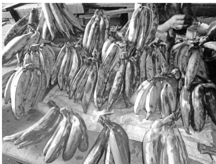
Des bananes sur un étal du marché d'Ouenzé.

Brazzaville est la principale destination du produit. Quelques marchés en constituent les grands points d'approvisionnement tels que ceux de PK, Bourreau, Intendance et Thomas-Sankara. Les prix qui y sont proposés varient entre 8.000 et 20.000 FCFA, par rapport au nombre de régimes rassemblés. C'est au niveau de ces marchés que revendeurs et consommateurs s'approvisionnent, avec des coûts ad-