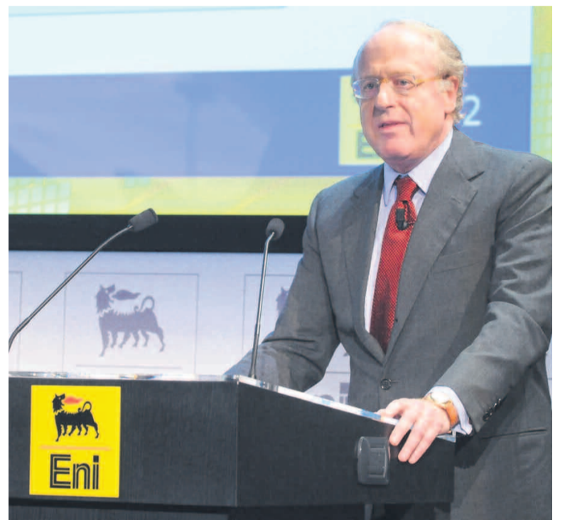
L'administrateur délégué d'ENI, Paolo Scaroni

Pour Scaroni, ces résultats sont bien entendu le couronnement de la ténacité qui a misé, longtemps avant tout le monde, sur l'Afrique. Mais