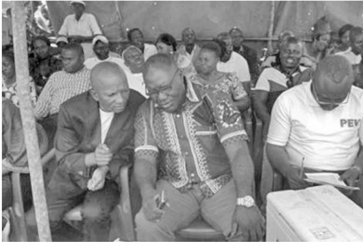
Le médecin chef de zone, l'administrateur du territoire et le directeur adjoint du PEV lors du lancement de la campagne