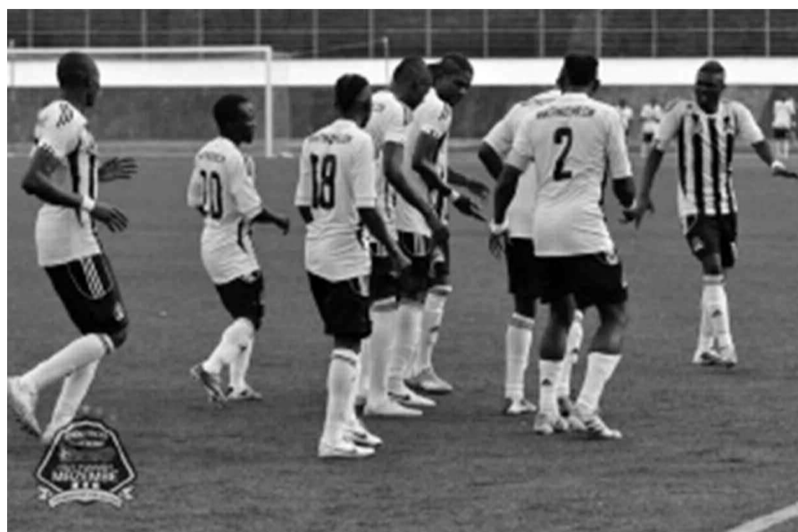
TP Mazembe tombeur d'Astres de Douala