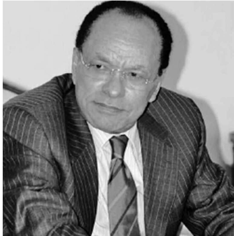
Léon Kengo wa Dondo