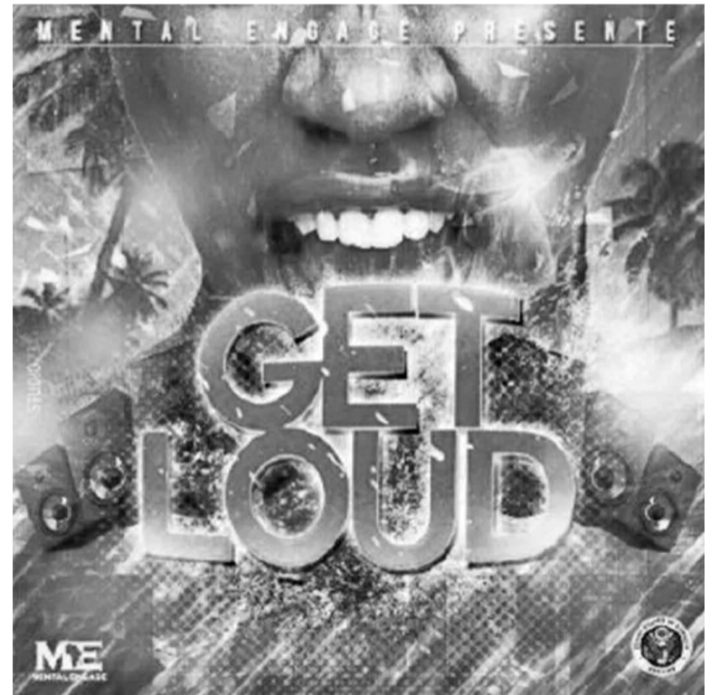
La pochette de Get Loud !

La réalisation de Get Loud ! s'est étalée sur une période de trois mois entre le 15 septembre et le 14 décembre dernier. Œuvre gratuite, elle est diffusée sur plusieurs radios communautaires du pays depuis le début du mois avec possibilité de copie pour qui le veut. Get Loud ! est aussi téléchargeable gratuitement sur Internet notamment via SoundCloud et plusieurs autres plates-formes de téléchargement libre. Projet initié de concert avec l'Ambassade des États-Unis pour sensibiliser sur les questions de la femme en RDC, Get Loud ! veut faire œuvre utile en mêlant engagement à expression artistique. En effet, dans trois mois devrait s'effectuer une première enquête pour mesurer ses premiers impacts sur les comportements sociaux en RDC. L'équipe Mental Engagé, entend collaborer avec certaines associations de défense des droits des femmes dans les cinq villes-échantillons précitées pour une analyse des statistiques de plaintes des femmes enregistrées. L'opération à mener durant l'année, une fois le trimestre quitte à l'aider à orienter ses messages de sensibilisation en fonction des tendances. Ce, au travers