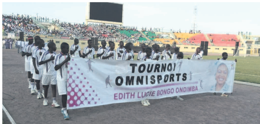
Les athlètes lors du défilé

points des équipes en compétition. Les deux formations ont fait jeu égal, zéro but partout. Un score contraire aux pronostics d'avant match qui prévoyait la victoire de l'une des deux équipes, selon l'appartenance des supporters. Pour ce match d'exhibition, les joueurs ont fait preuve d'un niveau de jeu appréciable. Les talents se sont révélés individuellement et collectivement. Ce sera certainement le cas pour les rencontres dans d'autres disciplines rete-