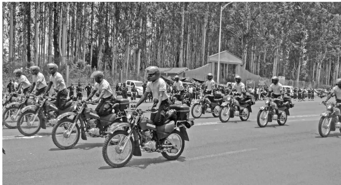
La séance d'exercices

Ces stagiaires venus de la Gendarmerie nationale et de la Direction générale de la sécurité présidentielle (DGSP), ont pris part à un stage de formation des motocyclistes. Organisé à Brazzaville, l'exercice avait un caractère pédagogique et a nécessité dix semaines d'apprentissage.