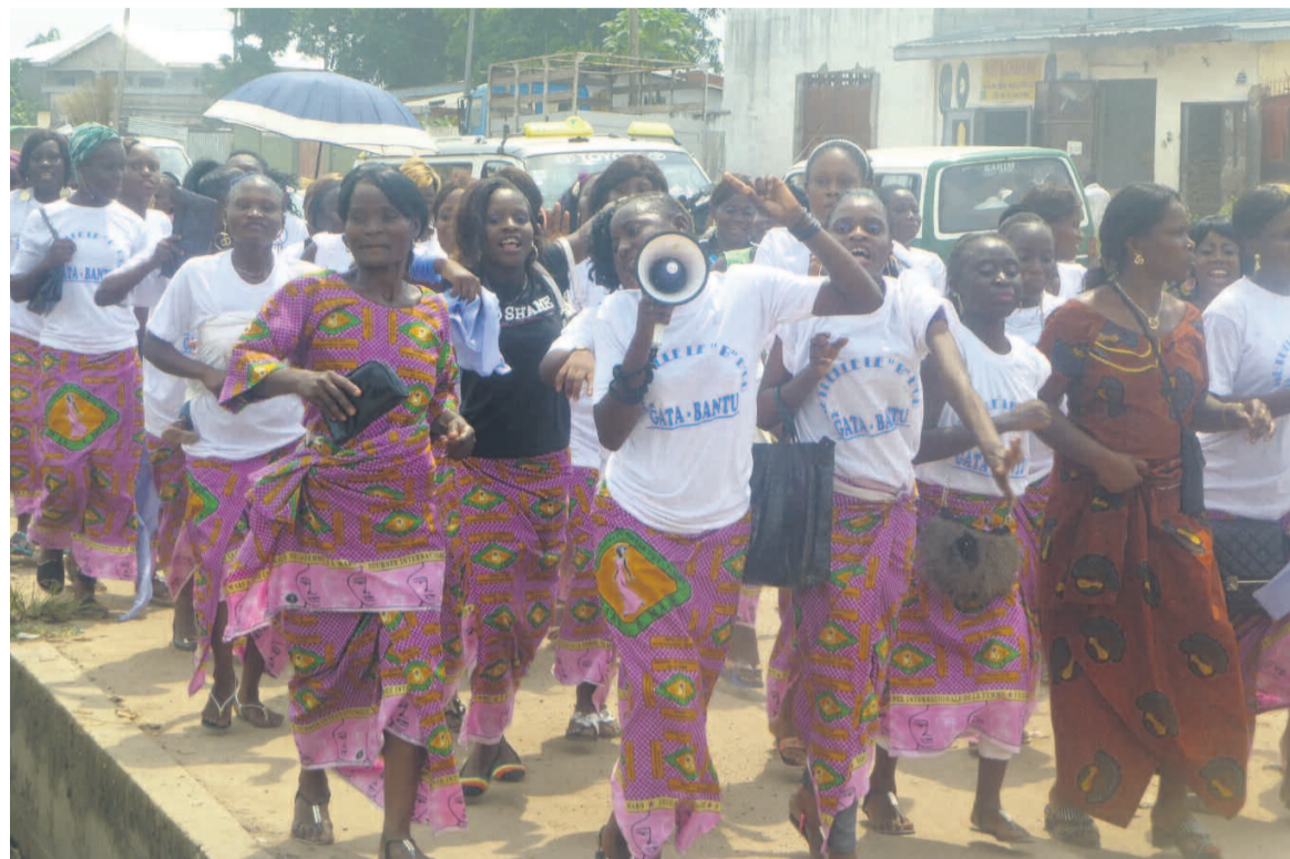
Les femmes du CDR pendant la marche

ternationale de la femme, a dit Joslyne Lydie Boungou Matouta, c'est pour montrer publiquement notre mutation en politique [...]. Nous avons décidé de répondre à l'appel des Nations unies. Un appel pour l'égalité de droit et de chance, un appel pour l'émancipation, un appel à œuvrer pour la paix véritable, un appel pour les droits de la femme et un appel pour la lutte po-