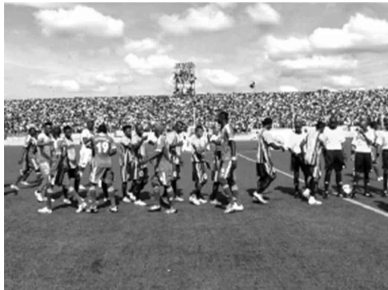
V.Club et Dynamos FC avant le coup d'envoi au stade Tata Raphaël