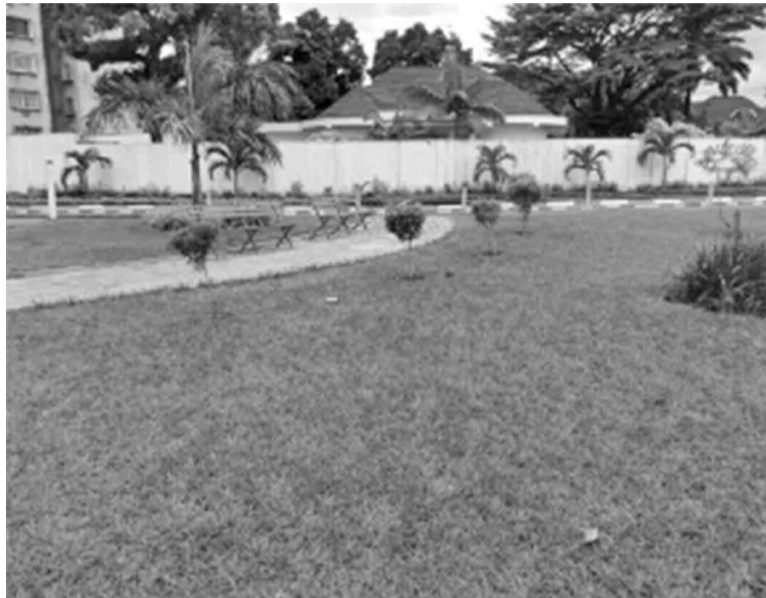
Le square Chez Nicolas