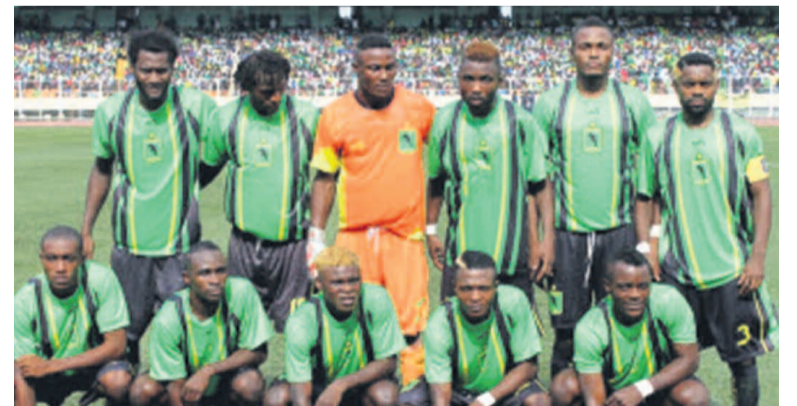
As V.Club de Kinshasa

Sewe Sport de la Côte d'Ivoire pour les Corbeaux du Katanga et de Kaizer Chiefs de l'Afrique du Sud pour les Dauphins Noirs de la capitale. En Coupe de la Confédération, la moisson a été négative pour les deux clubs congolais