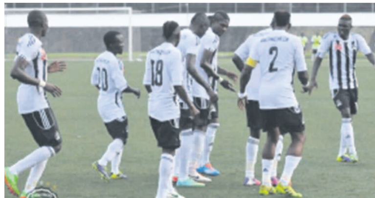
TP Mazembe de Lubumbashi

Les deux clubs congolais qualifiés en huitièmes de finale de la 19e édition de la Ligue des champions d'Afrique, TP Mazembe de Lubumbashi et As V.Club de Kinshasa, connaissent déjà leurs prochains adversaires. Il s'agit de