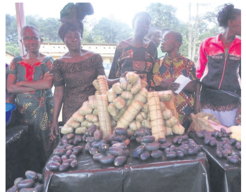
Les femmes participant à l'exposition vente

nin, avant de lancer le prix de la meilleure élève de la Lékoumou. Ces activités sont une initiative du Réseau Diva Airtel, dont l'épouse du chef de l'État est la marraine. Orienté prioritairement