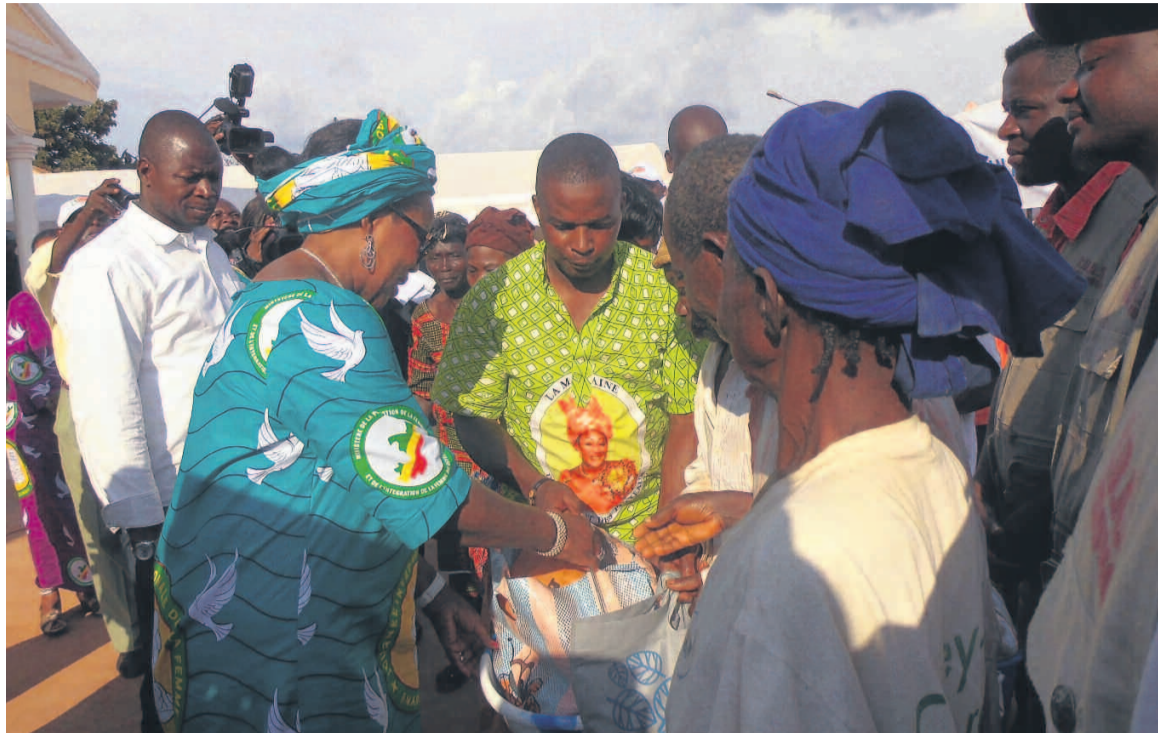
Antoinette Sassou N'Guesso offrant des dons

Lors du rassemblement organisé au complexe sportif de Sibiti, Antoinette Sassou N'Guesso a pris la parole pour encourager toutes les femmes rurales du Congo en général et celles du département de la Lékoumou en particulier, à plus de dynamisme afin de matérialiser le combat contre la pauvreté en milieu féminin. La ministre Catherine Embondza Lipiti a, dans son discours, exhorté le public à bannir toutes les discriminations et l'injustice dont sont victimes les femmes, afin de promouvoir l'égalité en droit entre l'homme et la femme, et de donner les mêmes chances et les mêmes opportunités aux filles et aux garçons, aux femmes et aux hommes dans tous les domaines de la vie. « Au moment où nous cé-