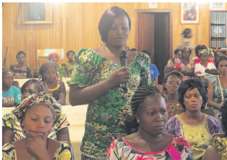
Les participantes aux débats

Du 6 au 8 mars, les femmes de cette communauté urbaine de la Sangha ont célébré la journée sous le signe de l'engagement.