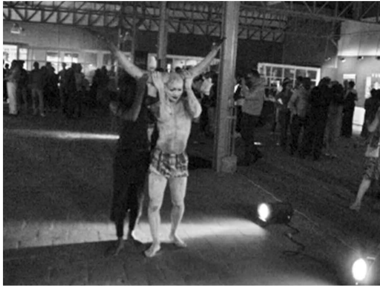
Zeus métamorphosé en taureau avec ses cornes en demi-lune

Avant d'arriver à l'installation vivante, les quelques lumières perceptibles sur le sol dès l'entrée de l'Espace Bilembo esquissent le symbole de l'infini, entendu par l'artiste comme signe de renaissance de notre humanité, en référence au funeste calendrier maya qui prédisait la fin du monde en date du 21 décembre 2012. Il suffit de lever les yeux pour voir alors quelques pas plus loin, derrière un rideau de bambou, les fameux «