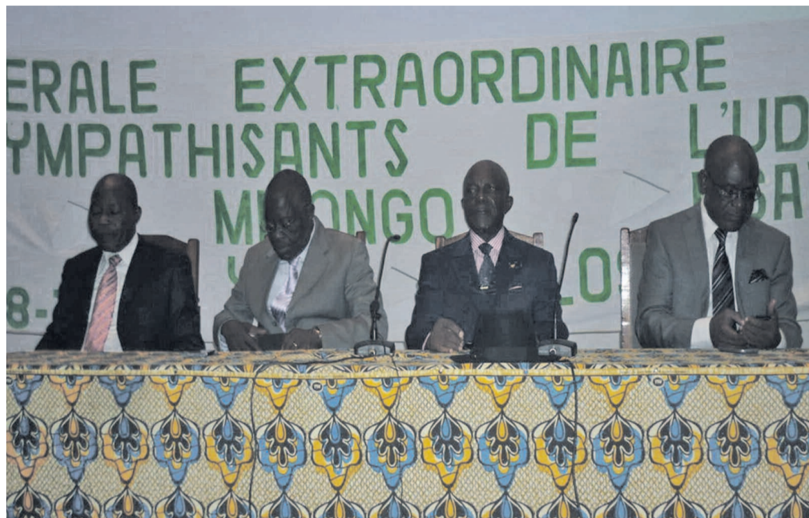
Le présidium de l'assemblée générale de la fédération de Pointe-Noire du parti UDR-Mwinda.