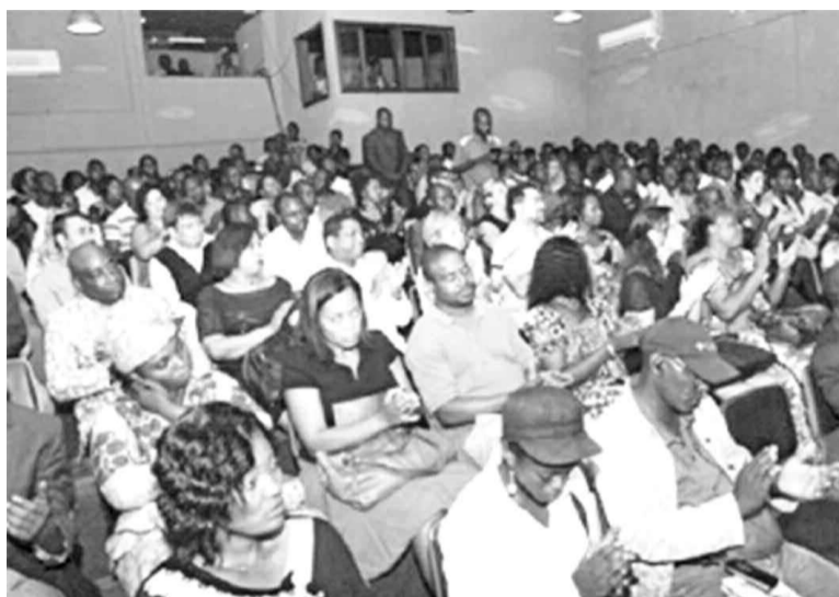
Une vue partielle du public lors du concert de INA-Vijana

L'entrée en matière, un aveu patriotique, ne pouvait être mieux exprimé que par Congo avenir. Interprété par une voix féminine, le désormais très célèbre air de feu Tabu Ley n'a pas manqué de faire effet sur le public cette fois encore. La version offerte, un extrait de slam et un grand chœur féminin inclus, a rajouté une note plutôt agréable à l'œuvre qui n'en a été que plus appréciée. Nzinzzi, rendu avec la complicité d'un chœur mixte a remis à vif le souvenir du King Kester porté en terre presque deux semaines plus tôt. Budje d'Eddy Mboyo et Partage de Ray Lema ont