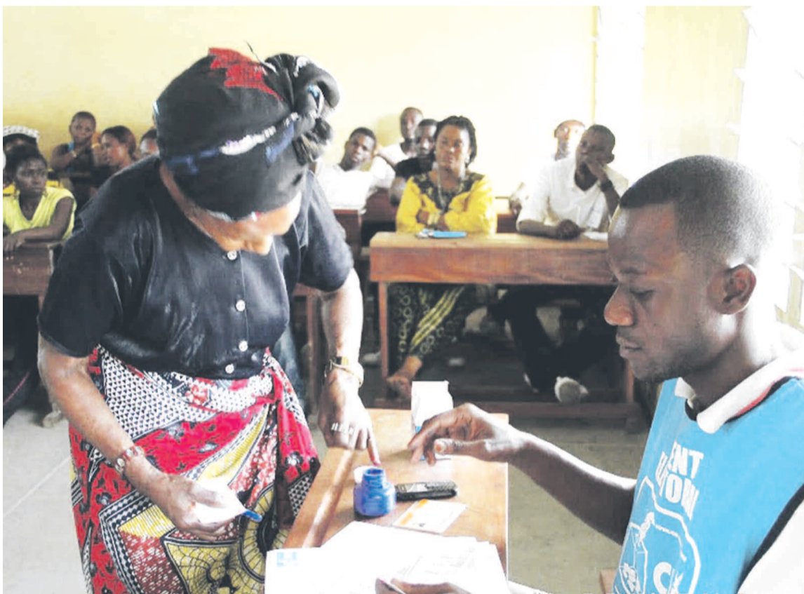
Opération de vote dans un bureau de la Cénis

L'Assemblée nationale a la lourde responsabilité de lever des options au temps opportun sur les outils importants et déterminants censés orienter le travail de l'organisme de gestion des élections en RDC. Les élus doivent notamment se prononcer sur la feuille de route de la Commission électorale nationale indépendante (Céni) qui propose les élections provinciales au suffrage indirect et les modifications à apporter à la loi électorale. De l'urgence qui sera accordée à chaque dossier lié aux élections dépendra finalement l'exécution du calendrier électoral et, par ricochet, la suite du processus électoral en cours.