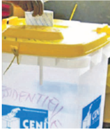
Les locales pointent à l'horizon

La deuxième phase comprend 10 provinces dont la ville province de Kinshasa. Comme au Bandundu, le travail consistera à la formation des préposés à la collecte puisés dans base des données de la CENI et à la dite collecte des données. La tâche s'annonce difficile dans les parties du pays où règne l'insécurité notamment au Nord-Katanga et au Kivu ainsi que dans certains territoires dits à problème. Le fichier électoral des locales dépendra énormément de l'opération de fiabilisation du fichier électoral et stabilisation des cartographies.