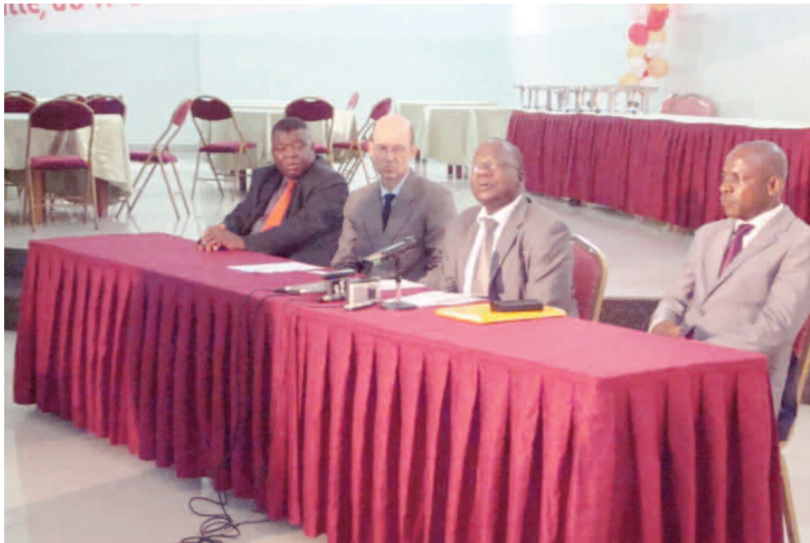
Le présidium des travaux. (crédit photo Adiac)

nombrement du RGA est étroitement lié à une meilleure coordination et supervision du travail du personnel sur le terrain. « Coordonnateurs superviseurs nationaux membres du BCRGA ; le bureau de coordination et