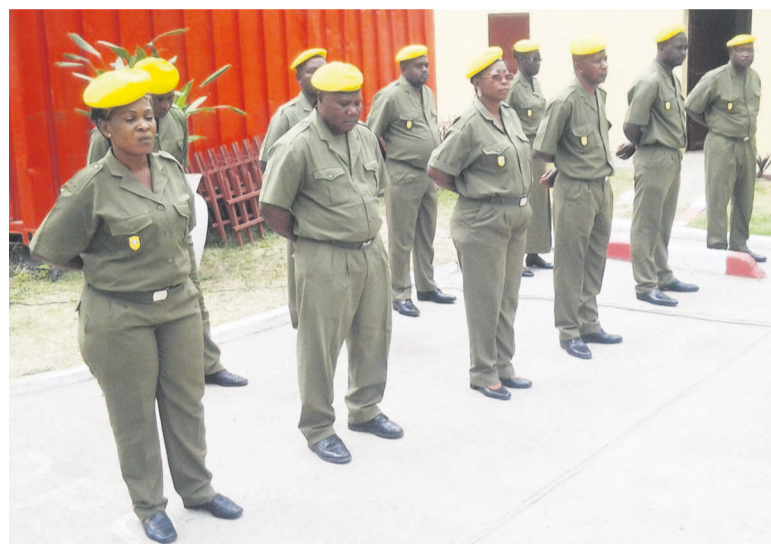
Les dix congolais de la promotion 2012-2014.

La cérémonie de fin de formation, qui devait être organisée en Centrafrique où se trouve le siège de cette école sous-régionale, a été délocalisée dans chaque pays de la Cémac en raison de la crise politique qui y sévit. C'est ainsi que le Congo a procédé, le 30 juin à la direction générale des Douanes, à la remise des diplômes à ses récipiendaires. « En temps normal, [cette céré-