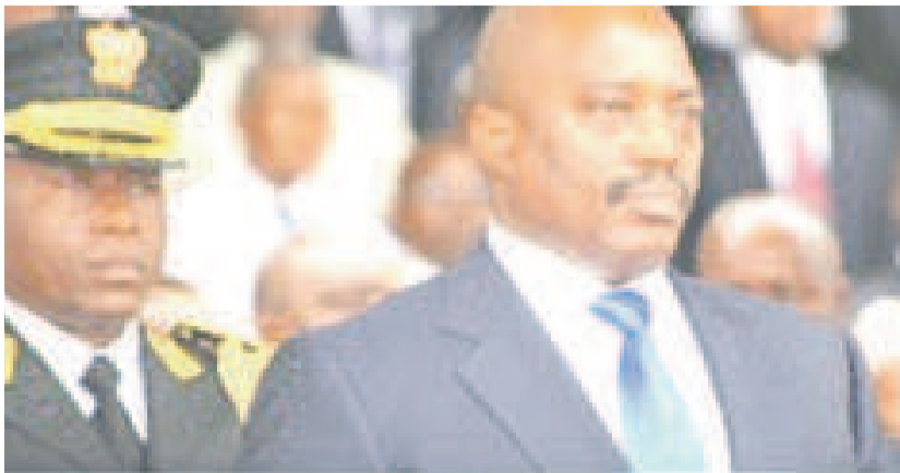
La garde républicaine

« J'annonce solennellement à la Nation congolaise que nos forces armées ont le contrôle absolu de l'ensemble du territoire national », a déclaré le président Joseph Kabila. L'annonce semble être passée inaperçue et pourtant elle vaut bien son pesant d'or quant on s'imagine un seul instant le lourd tribut que la RDC a payé à la suite des guerres et autres rebel-