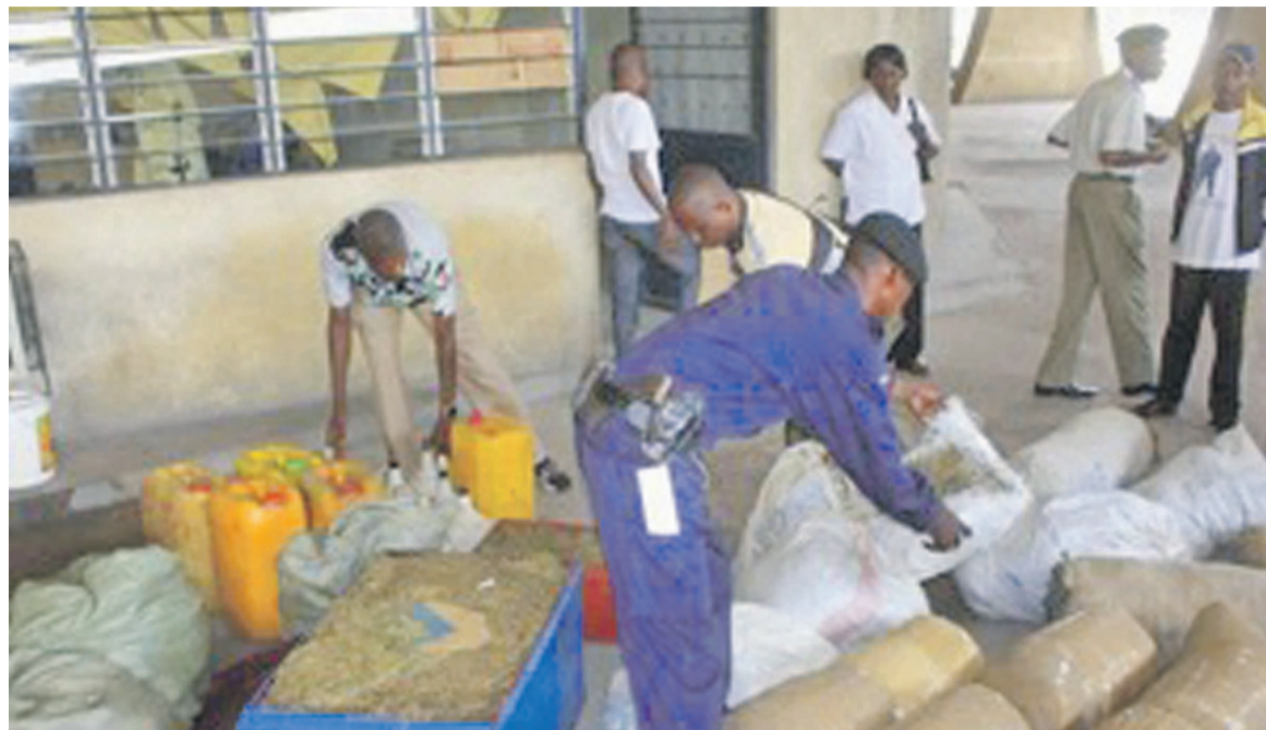
drogues et autres stupéfiants saisis destinés à l'incinération