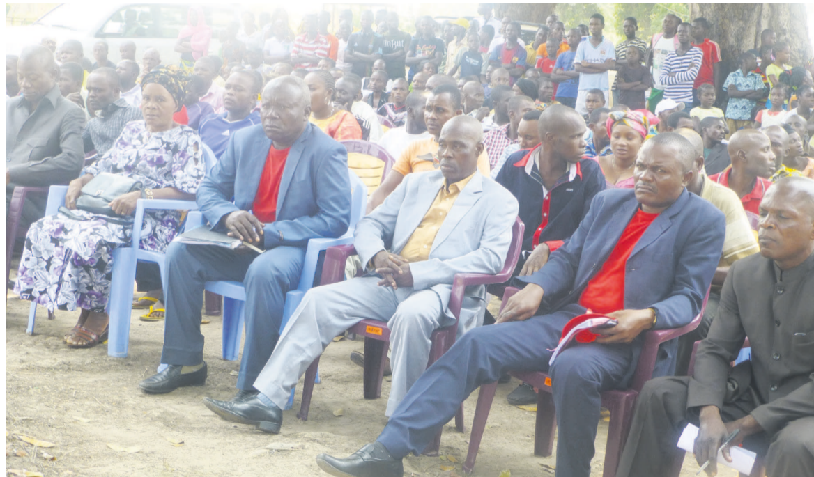
L'assistance suivant la communication du député de Ngabé

doivent remplir les conditions ci-après : avoir signé un contrat avec l'unité de gestion du fonds ; présenter un projet acceptable et bancable (coût du projet, compte de résultats, plan de financement, tableau d'amortissement de microcrédit) ; ouvrir un compte à la microfinance ; être déjà promoteur d'une activité quelconque et manifester la volonté de travailler en équipe. Pour cette catégorie de porteurs de projet, les crédits vont de 200 000 à 500 000 FCFA. Le fonds ne remet pas d'argent : en fonction de l'évaluation du projet, le fonds mettra à leur disposition du matériel et autres intrants, plus un petit fonds de démarrage qui est remboursable. Toutes les personnes qui travaillent pour un projet ne sont pas considérées comme des travailleurs du fonds : celui-ci leur assurera uniquement la commercialisation de leurs produits. En ce qui concerne ceux qui vont travailler dans un projet élaboré par le fonds, il est nécessaire de remplir les conditions suivantes : avoir signé un contrat avec l'unité de gestion du fonds ; ouvrir un compte de domiciliation de salaires à la microfinance ; avoir de la motivation et manifester la volonté de travailler en équipe. Les employés travaillent pour le compte du fonds qui les rémunérera. Il s'occupe, de ce fait, du