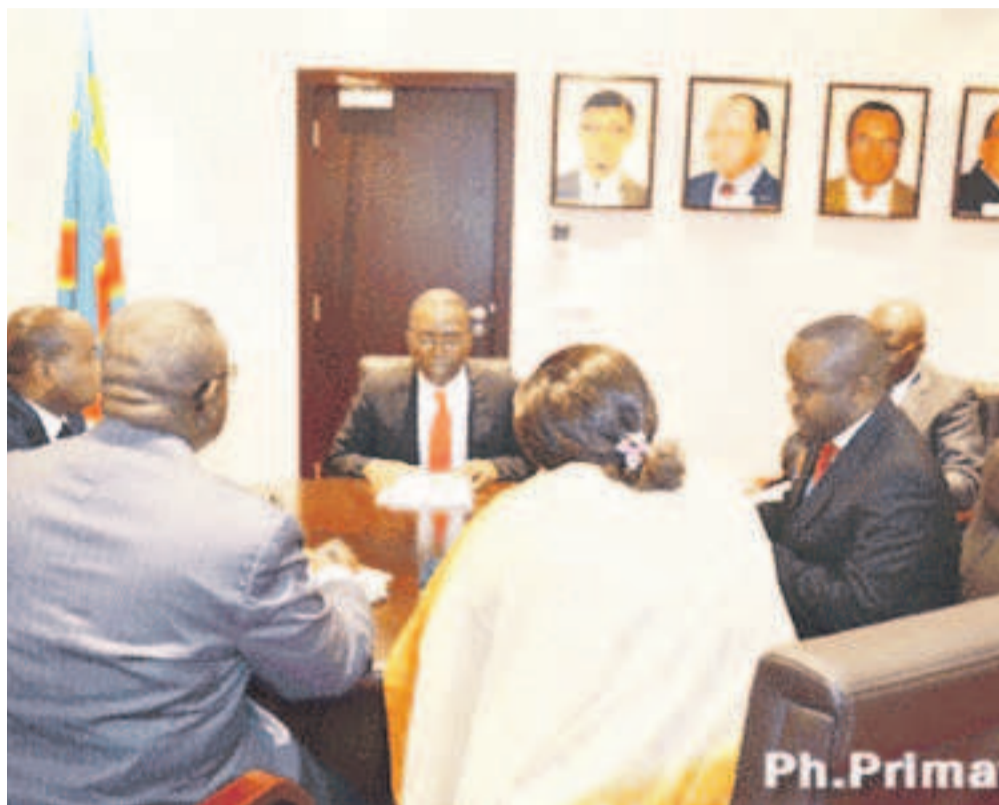
Séance de travail de la troïka congolaise

Le dernier rapport de la Banque mondiale (BM) relatif au CPIA « Country policy and institutional assessment » a classé le Congo démocratique sur une liste restreinte de huit pays africains qui se sont démarqués en initiant suffisamment de réformes dans le secteur financier au cours de l'année 2013. Sa note est passée de 2,7 à 2,9, impulsée essentiellement par la gestion macroéconomique. L'annonce vient du gouvernement à l'issue de la réunion de la Troïka stratégique du 1er juillet 2014. Pour le gouvernement, cela prouve à suffisance que les différentes réformes engagées dans le cadre de l'amélioration de la gouvernance économique-financière portent leurs fruits. Page 11