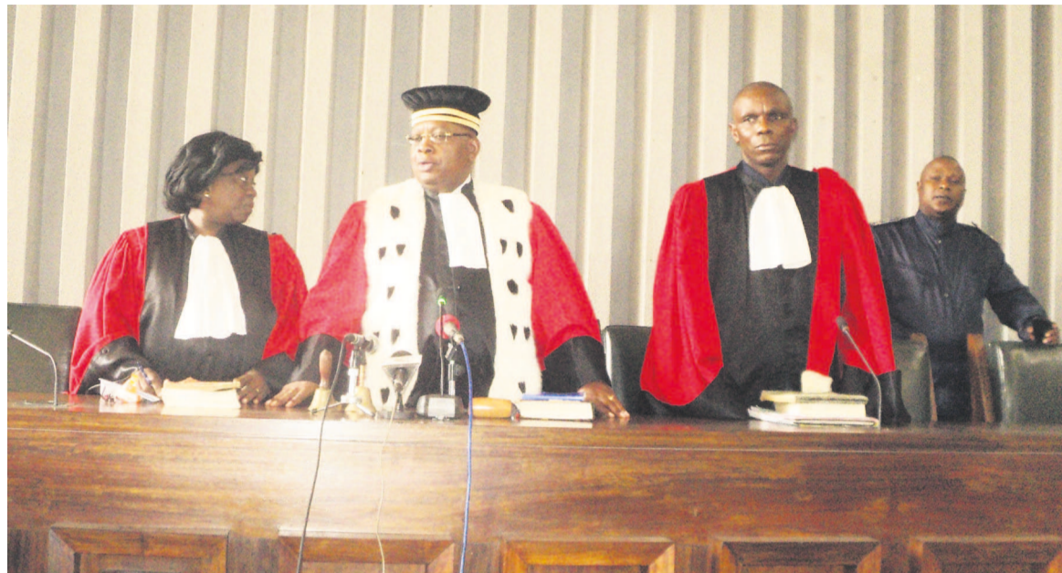
Les membres de la Cour d'appel à l'ouverture de la session criminelle