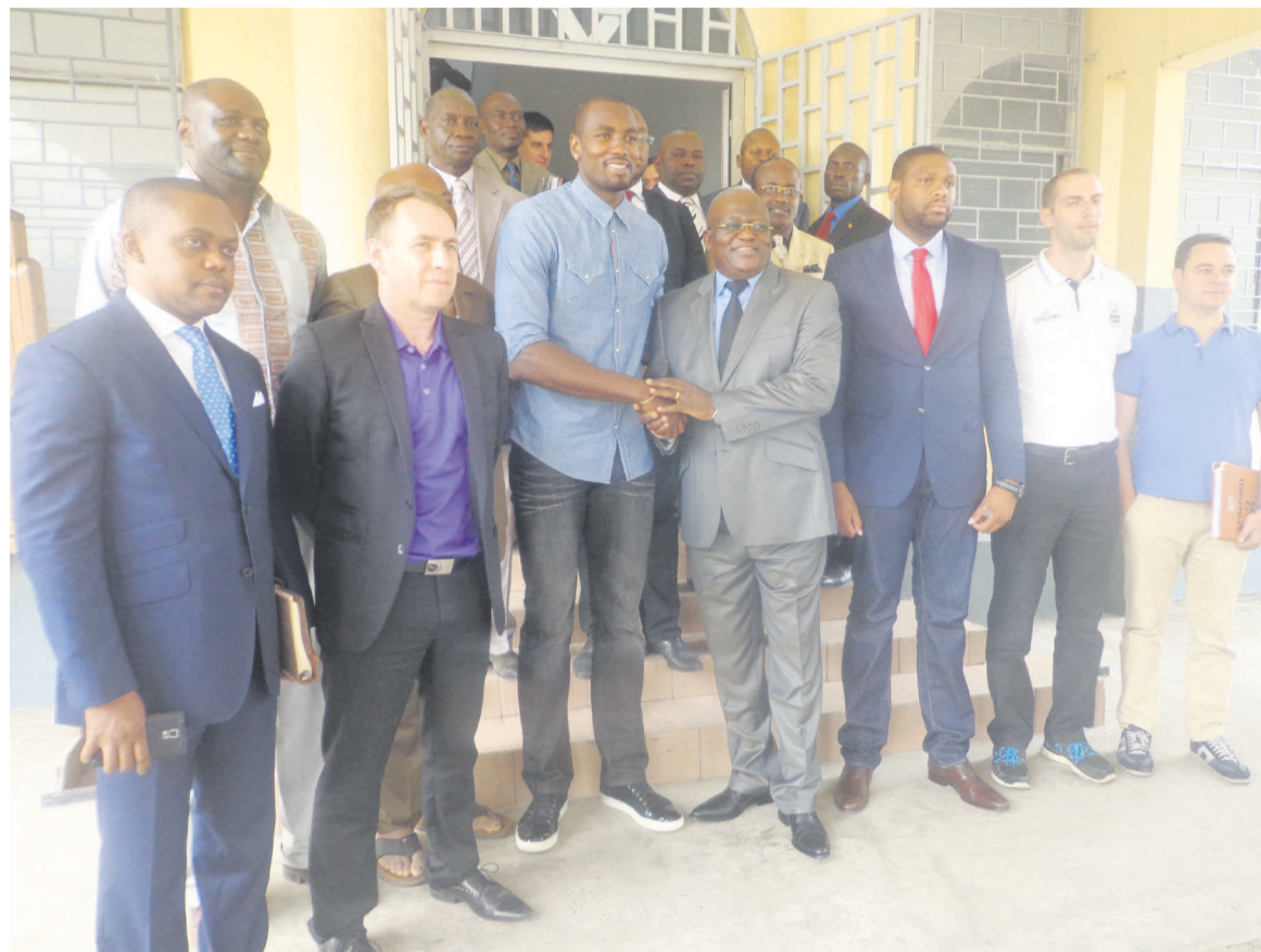
Le ministre des Sports et Serge Ibaka entourés des responsables de la Ligue et de la Fédération ainsi que des partenaires du basketteur.

Dans la vision de Serge Ibaka de transmettre une sorte de témoin à des jeunes Congolais qu'il souhaite faire rêver dans cette discipline, le Congo tire un autre profit. En dehors de cinquante jeunes qui ont bénéficié d'un stage d'imprégnation au basket-ball, le partenariat gagnant-gagnant entre la Ligue de Brazzaville et la Ligue Île-de-France a accouché d'un important projet qui pourrait rendre les basketteurs Diables rouges plus compétitifs, dans le but de gagner des médailles. La préparation des Jeux africains est donc garantie par ce partenariat avec la Ligue Île-de-France. Les Diables rouges bénéficieront de multiples stages de formation qui seront confirmés par le regroupement des athlètes congolais évoluant en Europe notamment ceux de la diaspora. « Un accord de principe a été trouvé entre la Féccoket et la Ligue de France pour que nous puissions accompagner ce projet dans le regroupement de nos