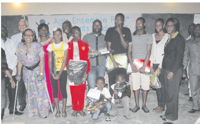
Les responsables de l'A2EH et ses partenaires posent avec les meilleurs élèves de l'établissement. «adiac»