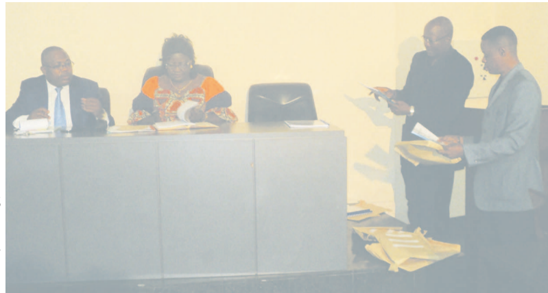
La séance d'ouverture des plis.

Parmi ces sociétés, quatre établissements ont soumissionné