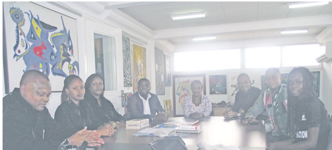
Lors de la séance de travail entre les deux parties

Cette cinquième édition qui met un accent particulier sur l'instrument a pour thème : l'instrument de musique africaine et son rôle dans le monde. Or, quand on parle d'instrument, on parle de conservation et quand on parle de conservation, il n'y a pas mieux que les Bassins du Congo dans la sous-région Afrique centrale, en dehors du grand musée du Cameroun qui a des millions de collections. Le musée du Bassin du Congo est sur cette lancée, a reconnu Hu-