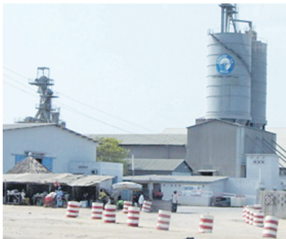
L'usine Sonocc à Loutété

Comme ici à Bangui, les ressortissants de la RCA au Congo organiseront une marche de soutien au forum de Brazzaville