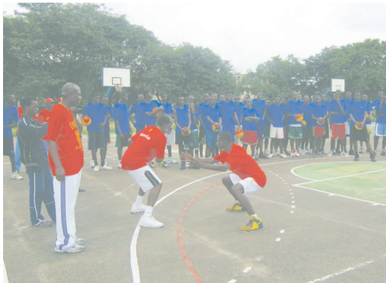
Une formation de basket

Le programme du camp prévoit une conférence de presse dans la matinée du 21 juillet. Elle sera animée par les basketteurs venus des États-Unis.