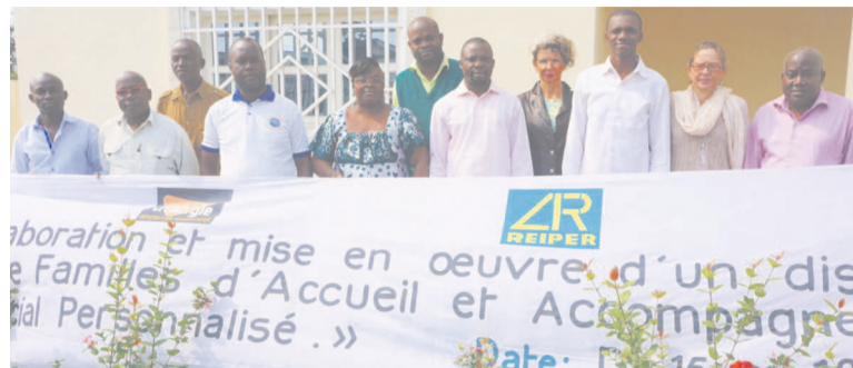
photo de famille à la fin du séminaire