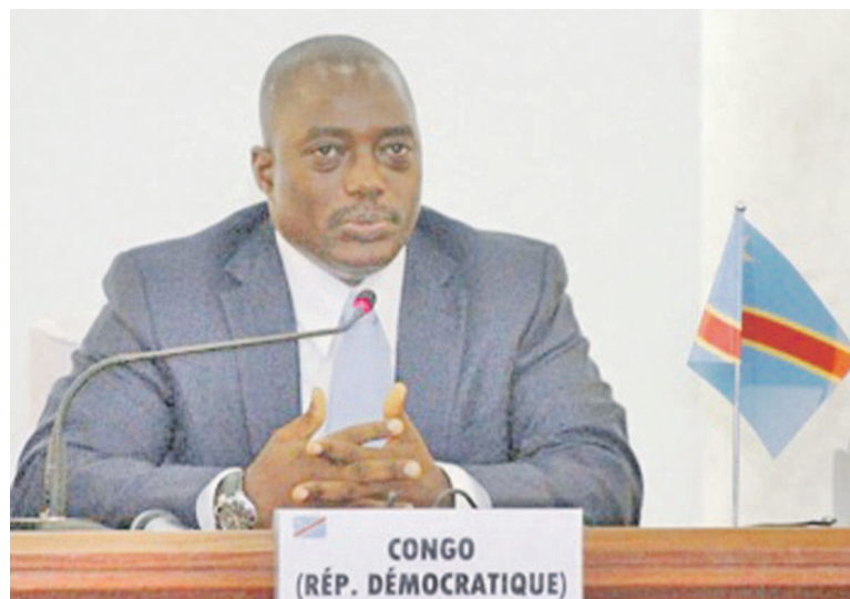
Joseph Kabila Kabange

Une frange d'opposants réunis dans une plate-forme appelée Coalition des forces politiques et sociales de l'opposition, ont lancé le mercredi 16 juillet dernier, une croisade judiciaire à l'encontre du chef de l'État, Joseph Kabila, à travers une pétition qu'ils comptent transmettre à la Cour pénale internationale. C'est dans la salle polyvalente de la paroisse Notre dame de Fatima qu'ils ont fait leur show qui s'est terminé par la récolte des signatures. Parmi les principaux animateurs de cette action, on peut citer l'Union pour la Nation congolaise