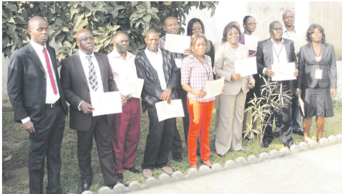
La photo de famille

formation qui a pour but de faire la promotion du développement durable en entreprise a regroupé les cadres de Congo Terminal, de l'ONG Forêts et développement,