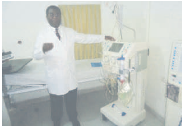
Le Pr Alain Guy Honoré Assounga

Le néphrologue congolais a fait cette invite à l'occasion de l'opération porte ouverte qu'il a organisée le 22 juillet à Brazzaville en faveur de ses collègues médecins, des patients et des journalistes qui ont visité les installations de la structure qu'il a mise en place dans la capitale congolaise