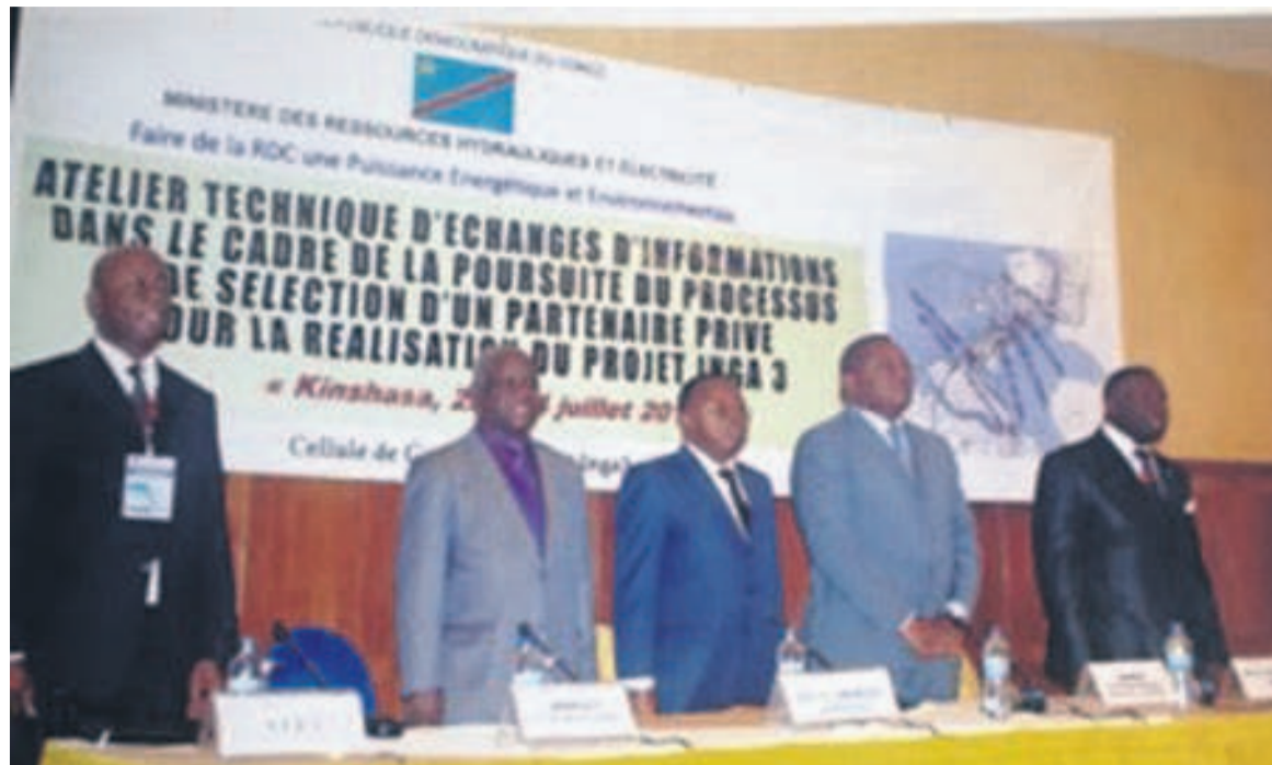
Le coordonnateur de la CGI3, les ministres des Affaires foncières, des RHE, et de l'Environnement ainsi que le secrétaire général des RHE, lors du lancement de l'atelier

Au cours de ces travaux, des entretiens de trois heures avec chacun des candidats développeurs participants ont permis de recueillir des informations-clés permettant d'alimenter la finalisation du document de consultation.