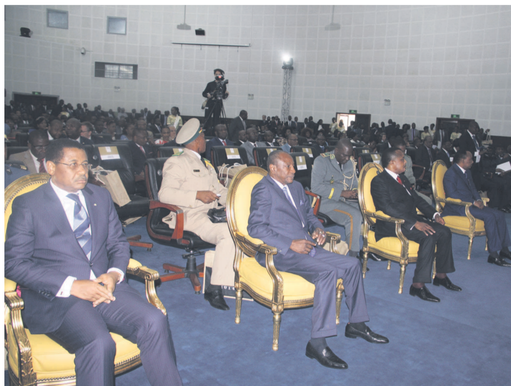
Les chefs d'État et de délégations à l'ouverture du Forum