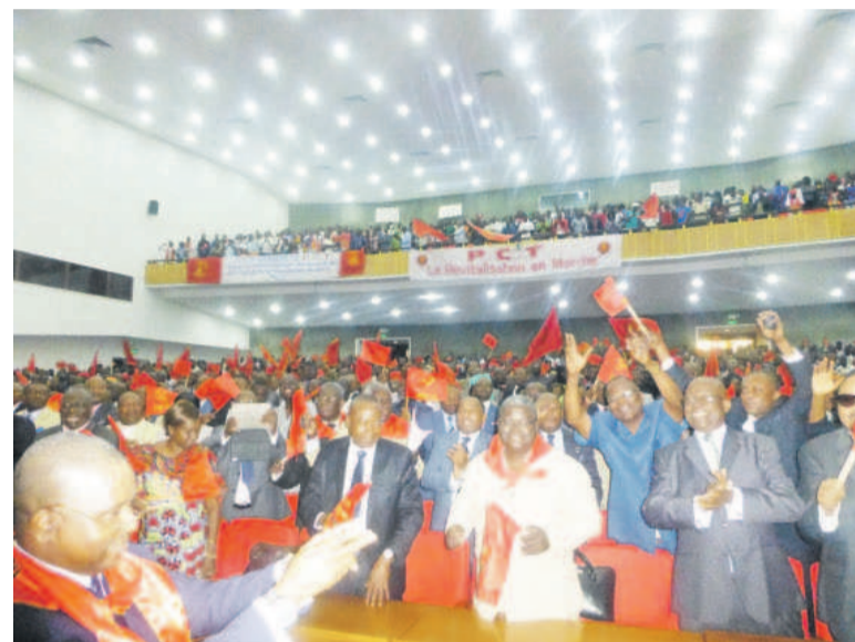
Les membres saluant l'entrée en salle du secrétaire général

personnalisent ce débat en jetant le discrédit sur le président de la République, Denis Sassou N'Guesso, qui, à en croire le secrétaire général du PCT, n'a pas non plus donné son point de vue sur la question. Le chef de l'État, a-t-il renchéri, ne mérite pas les commentaires que l'on entend ici et là, de la part de certains opposants ou intellectuels, parce que les Congolais savent qu'il « est un