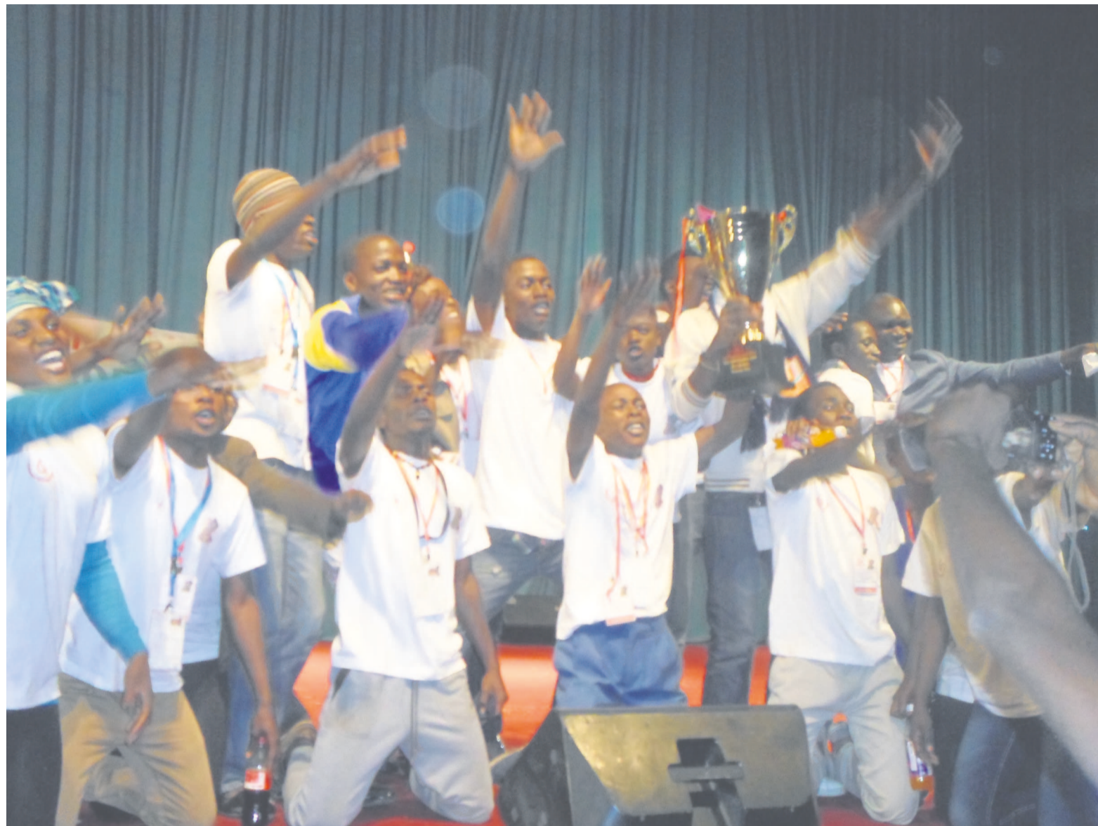
Les lycéens de Pierre Savorgnan De Brazza exhibant leur trophée