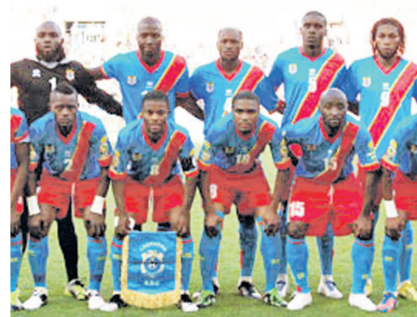
Léopards de la RDC