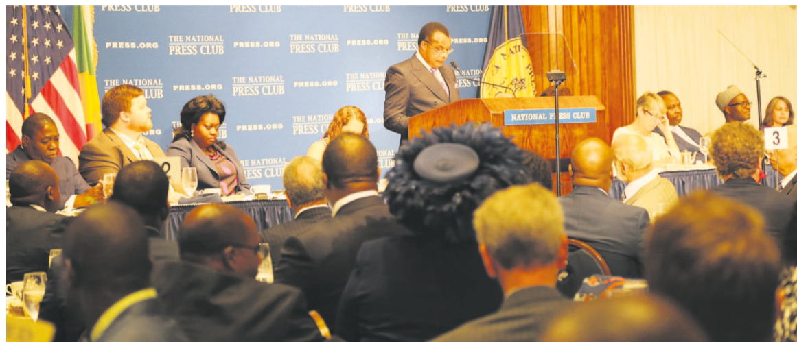
Le président Denis Sassou N'Guesso s'exprimant devant la presse et le corps diplomatique au National Press Club à Washington

À la veille de l'ouverture du sommet États-Unis-Afrique, le chef de l'État congolais, Denis Sassou N'Guesso, a donné vendredi 1er août, à Washington, une conférence sur le thème de la Paix et de la sécurité en Afrique centrale. Devant un parterre de journalistes et de personnalités rassemblées au National Press Club (Club de la presse nationale), le président a appelé à une refondation des relations entre les États-Unis et l'Afrique et invité les États-Unis à prendre cinq mesures concrètes dans ce sens.