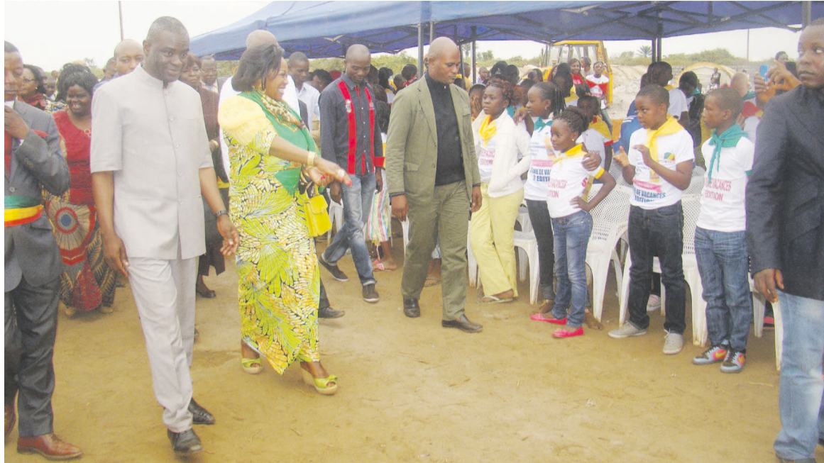
L'épouse du chef de l'Etat en compagnie du ministre de la jeunesse et de l'éducation civique

Le ministre de la Jeunesse et de l'éducation civique, Anatole Collinet Makosso, a lancé le 30 juillet dernier à Sibiti, une colonie de vacances qui réunit des enfants venus de tous les départements du Congo et de la diaspora notamment du Gabon, du Cameroun et de la France. La cérémonie, au site de Loukana sur la route d'Imvouba à 4 km du centre-ville, s'est déroulée sous les auspices de l'épouse du chef de l'État, Antoinette Sassou N'Guesso, en sa qualité de marraine de la municipalité accélérée du département de la Lékoumou