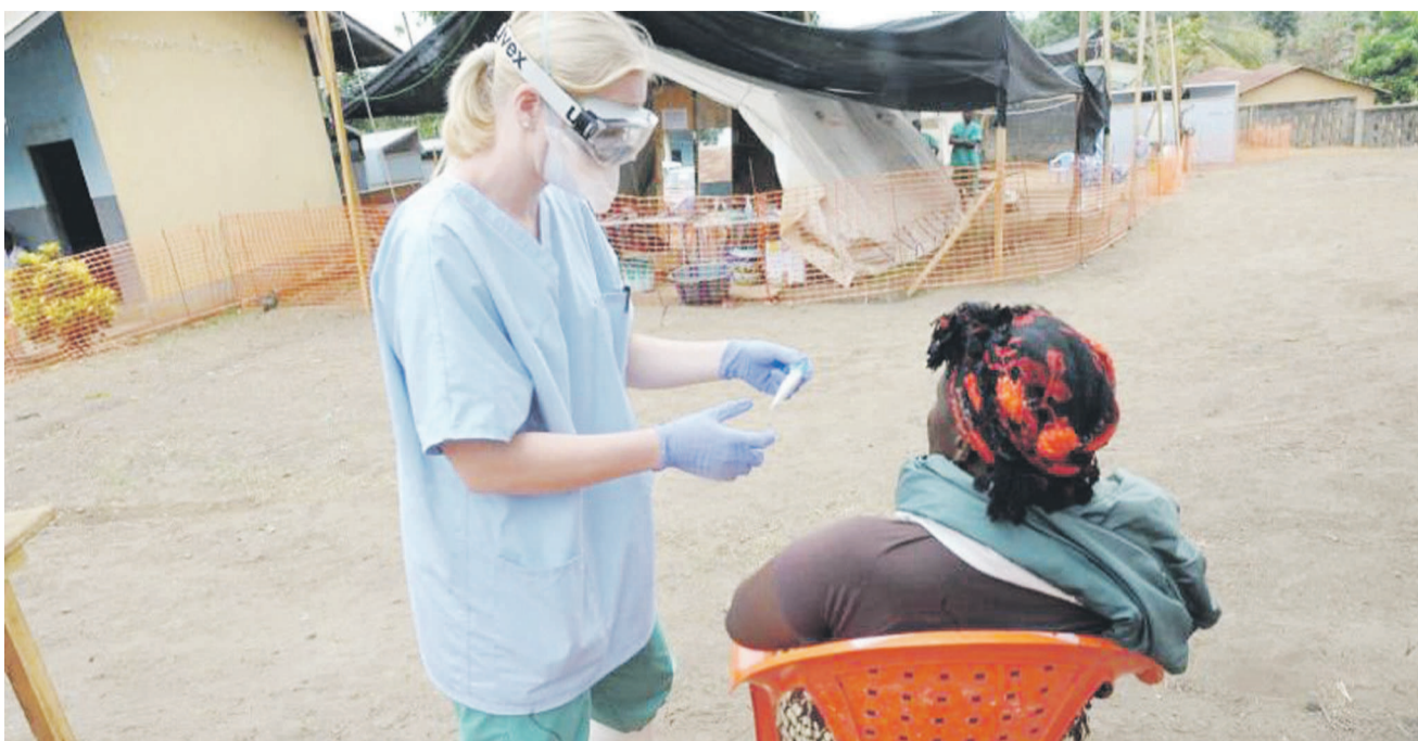
Ébola tue entre 25 et 90% des malades, selon l'OMS

Dans le même ordre d'idées, il a été décidé que le service d'hygiène soit étendu aux frontières au niveau de l'aéroport de Kindu au Maniema, le seul qui n'en est pas pourvu actuellement. En outre, les services d'hygiène aux frontières devront dorénavant être dotés des thermomètres laser afin