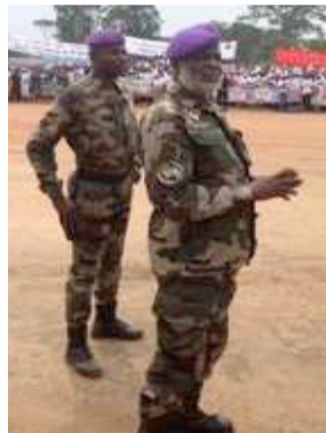
Le commandant de la Garde républicaine, à Djambala, lors du lancement de la municipalisation accélérée des Plateaux, le 5 mai 2013

Le général Nianga Ngatsé Mbouala s'adressait à son unité dont une partie est engagée pour la sécurisation des