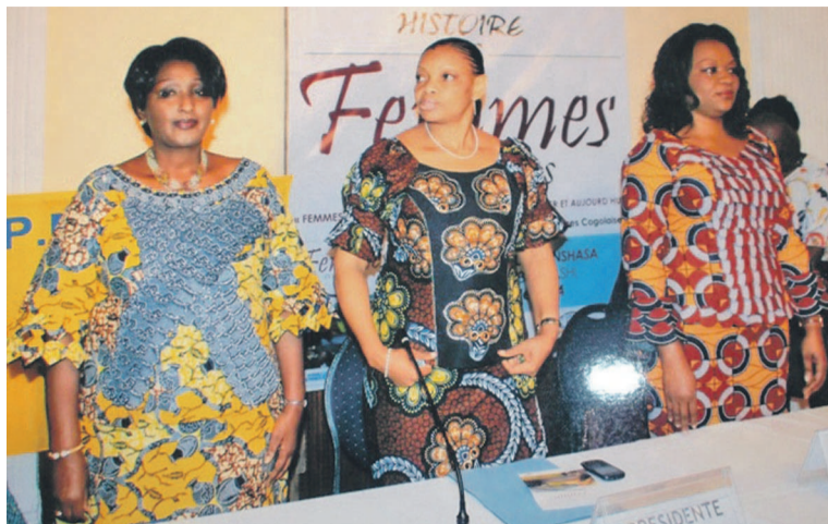
La représentante de l'Onu-femmes, la présidente de la Lifce et la ministre du genre, lors du vernissage.

leurs, noté que l'ONU-femmes, qui se considère comme une accompagnatrice à toutes initiatives visant le développement de la femme, a accepté cet ouvrage dans toute son originalité et toute sa simplicité.