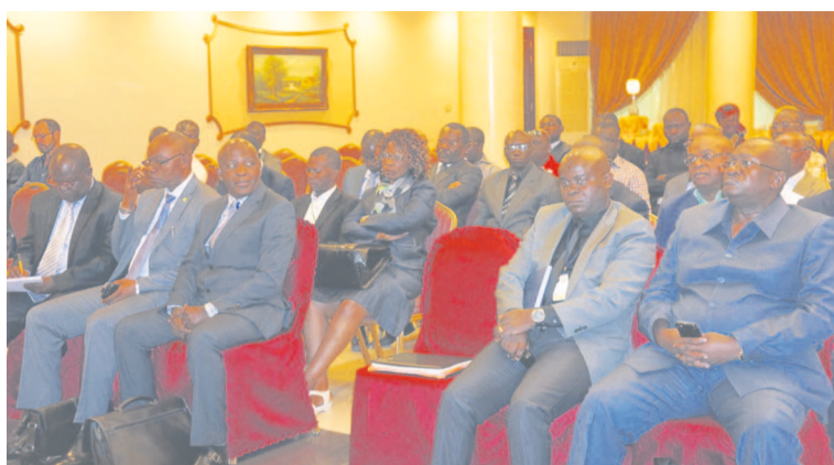
Tous les participants à la réunion

En effet, la note circulaire n° 01272 du 7 juillet 2014 des mi-