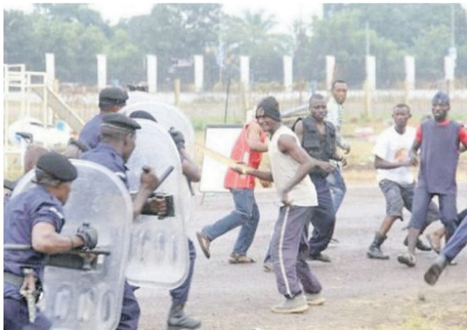
La solution aux violences urbaines en dehors de la répression policière

Une étude réalisée par Raoul Kienge-Kienge, professeur au département de droit pénal et de criminologie mais également directeur au Centre de criminologie et pathologie sociale, a préconisé une gestion du phénomène fondée sur l'instauration d'une gouvernance démocratique dans la sous-région, grâce à une politique criminelle de sécurité des droits socioéconomiques, civils et politiques des jeunes citoyens au lieu d'une simple politique de sécurité publique violente et inefficace.