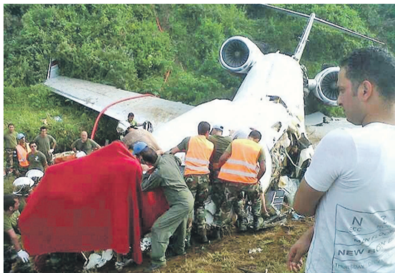
Crash d'un avion à Bukavu en février 2012

tions. Au-delà, l'on croit savoir que le forum de Washington permettra de lever un coin de voile sur cette question tout en donnant des indications claires sur la participation ou non de Joseph Kabila à la présidentielle de 2016. Page 18