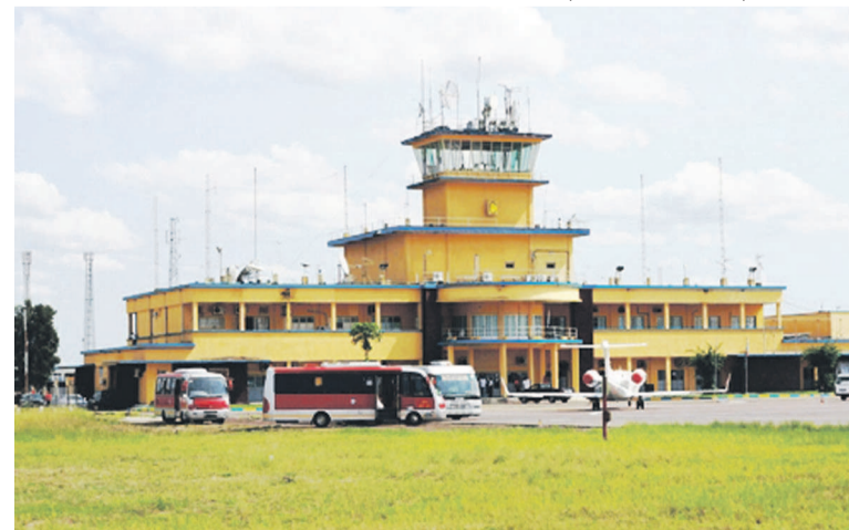
Une vue de l'aéroport international de Ndjili