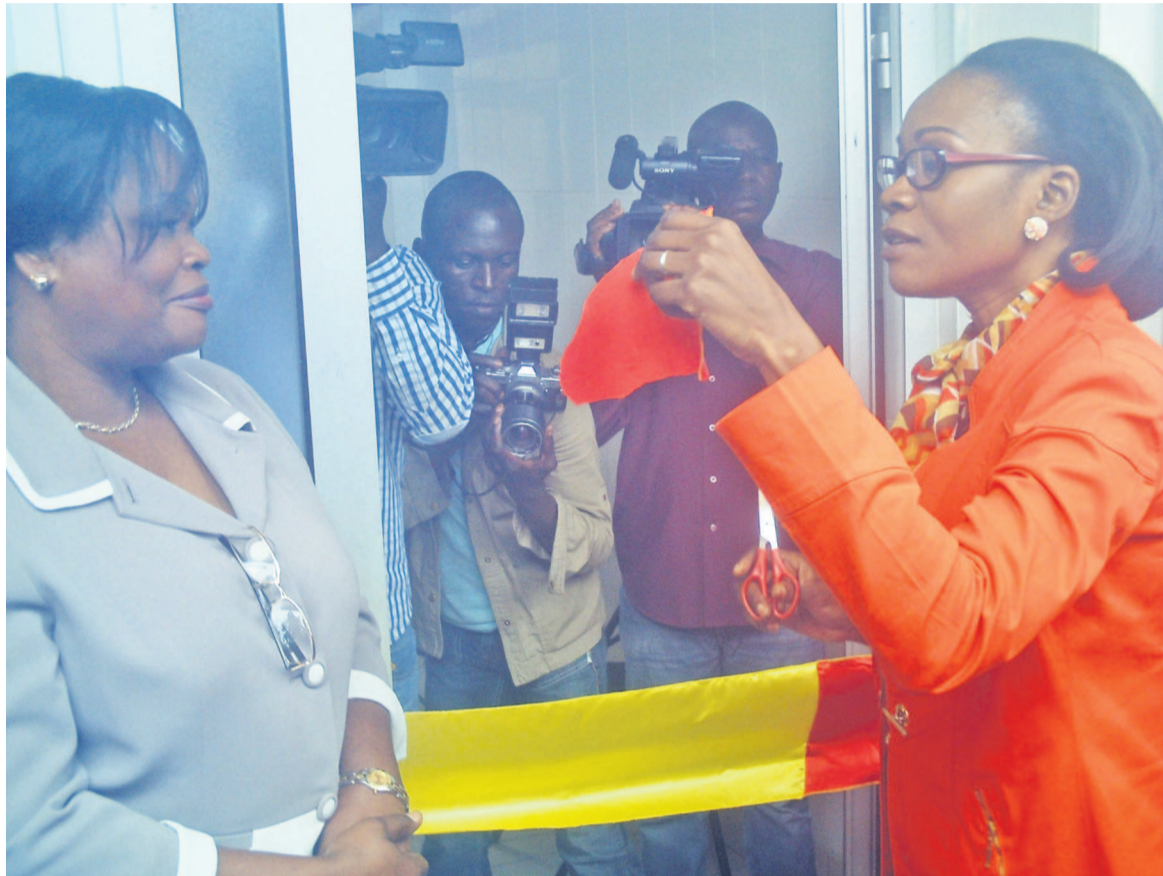
La dg du Cnts coupant le ruban devant la dg de l'hôpital général de Loandjili

interdépartemental de transfusion sanguine, l'hémovigilance sera aussi de mise dans ce Centre. «J'interpelle les prescripteurs utilisateurs des produits sanguins sur le fait que le produit qui a été rendu à un patient doit