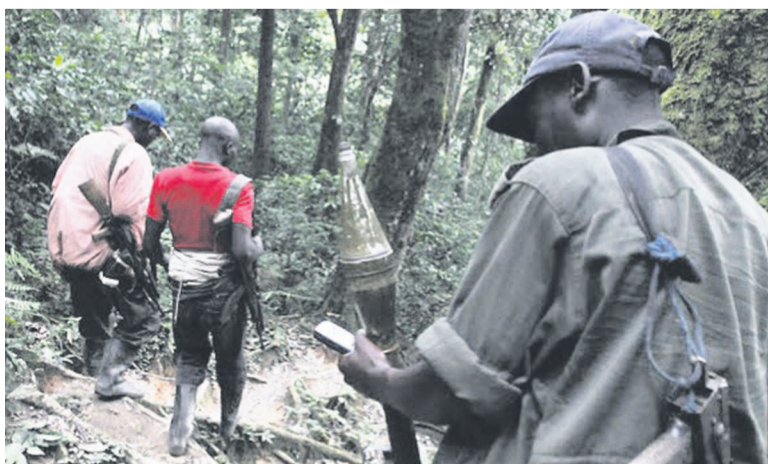
Des éléments FDLR