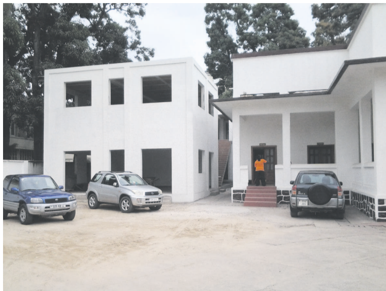
Le siège de la Cemaco

Les différentes étapes s'entremêlent. La dernière étape est du ressort des chambres de commerce qui abriteront le Cemaco. Les antennes fonctionneront comme des services spécialisés des chambres consulaires. Pour un début, le Cemaco disposera de deux représentations : l'une à Brazzaville et l'autre à Pointe-Noire. La procédure du recrutement a déjà été amorcée avec le Projet de renforcement des capacités commerciales et entrepreneuriales en République du Congo (PRCCE) par appel d'offre. Plusieurs dossiers des soumissionnaires ont été aussi déposés. Reste le dépouillement qui se fait attendre. « On a déjà dessiné le profil de certains collaborateurs qui seront les deux patrons des antennes, respectivement à Brazzaville et à Pointe-Noire. Mais aussi de prendre des dispositions au niveau des deux chambres de commerce pour qu'elles anticipent sur la mise à disposition d'un point focal », a indiqué le PRCCE. Une fois les locaux identifiés, les secrétaires greffiers, l'équipe des animateurs permanents seront sélectionnés avec l'appui de l'assistance