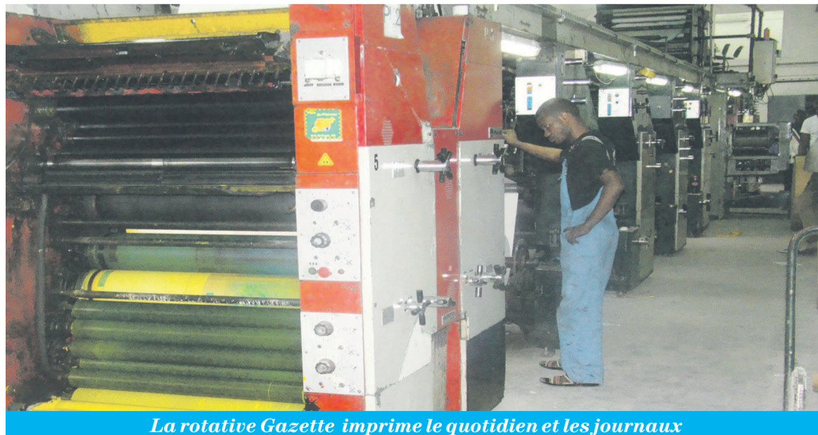
La rotative Gazette imprime le quotidien et les journaux