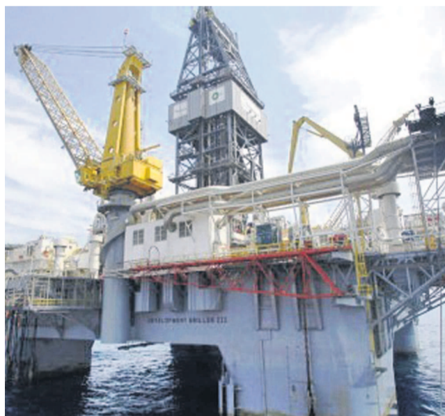
Exploitation pétrolière aux larges de la côte atlantique

La trouvaille de la société Oil of DR Congo, une filiale du groupe Fleurette appartenant à l'homme d'affaires israélien Dan Gertler, est une réserve potentielle de pétrole estimée à trois milliards de barils. Ce qui, à en croire les experts, pourrait booster l'économie nationale en cette phase de reconstruction du pays. En effet, les ressources pétrolières considérables enfouies dans ce gisement sont susceptibles d'augmenter fondamentalement le PIB de la RDC si elles sont extraites et exportées de façon sûre et économique. Avec une production de cinquante mille barils par jour, assure-t-on, il est possible que la RDC élève son PIB à hauteur de 25%. Pour l'instant, Fleurette