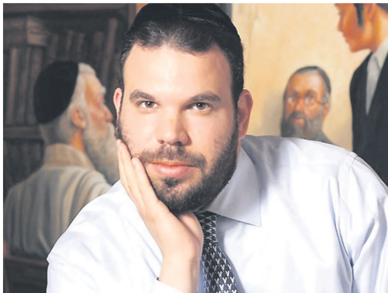
L'homme d'affaires israélien Dan Gertler

La RDC est en passe de devenir un géant pétrolier du continent grâce à la découverte, depuis quelque temps, d'un important gisement dans le territoire de l'Ituri en Province Orientale. Il s'agit, en fait, d'une réserve potentielle évaluée à trois milliards de barils. C'est la société Oil of DR Congo, une filiale du groupe Fleurette appartenant à l'homme d'affaires israélien Dan Gertler qui, à l'issue de deux phases de tests sismiques au niveau des blocs I et II du lac Albert, a fait cette découverte. Celle-ci, en croire les analystes, pourrait booster l'économie nationale en cette phase de reconstruction du pays. En effet, comme l'indique le communiqué du groupe Fleurette, les ressources potentielles considérables enfouies dans ce gisement peuvent « augmenter fondamentalement le PIB de la RDC si elles sont extraites et exportées de façon sûre et économique ». Avec une production de cinquante mille barils par jour, assure la source, il est possible que la RDC élève son PIB à hauteur de 25%. Cette réserve pourrait être de même ampleur du côté ougandais du lac Albert, précise la même source. Pour l'instant, le groupe s'est lancé dans des études de faisabilité pour voir