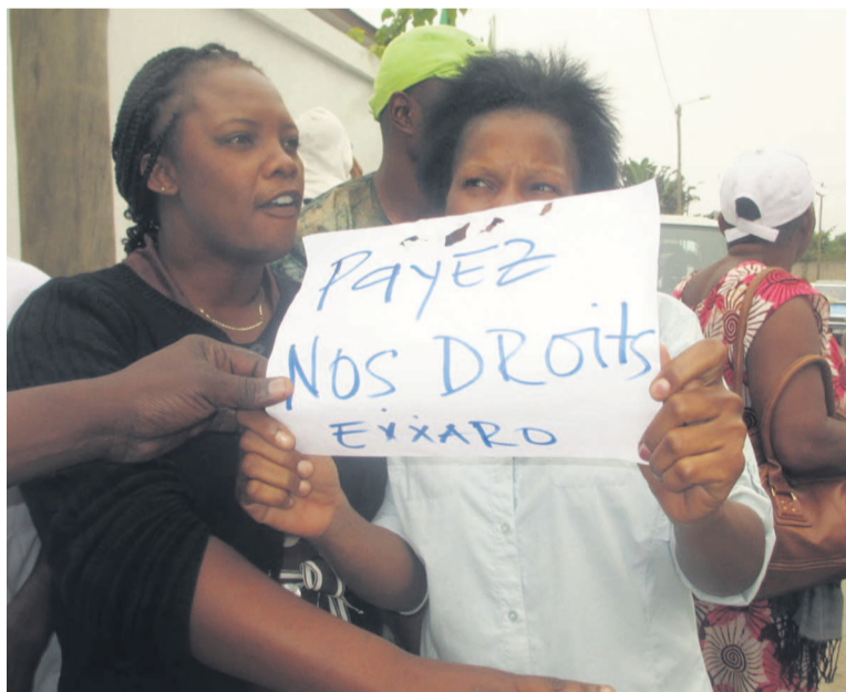
Des manifestants

Selon les sources proches du dossier, en cas de résiliation anticipée, le client sera redevable au traiteur pour le paiement des prestations terminées jusqu'à la date effective de résiliation