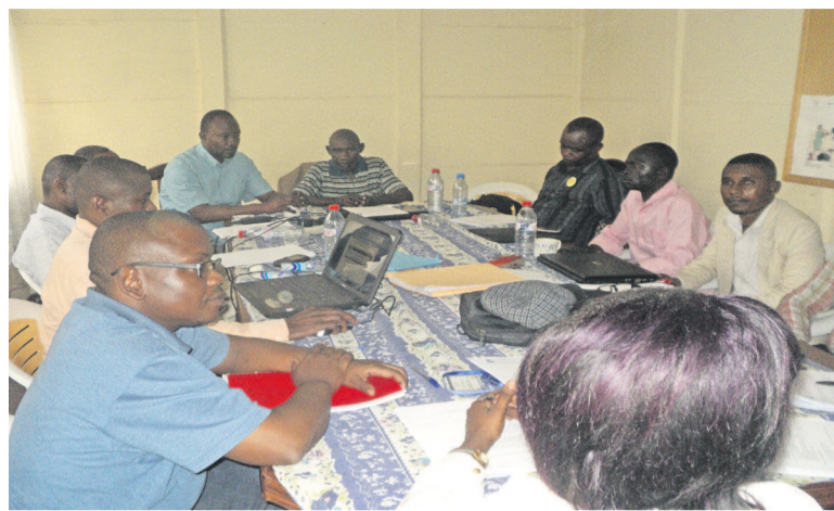
Des enseignants de droit en formation

Au total 201 enseignants ont été formés dont 151 des départements de Brazzaville, dix-huit du Pool ; huit des Plateaux; seize de la Cuvette; deux de la Cuvette-Ouest et six de la Sangha. Le conseiller à l'enseignement technique, Jacques Mabiala, explique : « dans le passé nous étions sur la comptabilité faite selon l'Ocam, (le premier plan de gestion comptable et des affaires en Afrique centrale). Actuellement, avec le nouveau système comptable OHADA, adopté dans le domaine du droit et de la comptabilité, cette harmonisation doit intégrer la formation des en-