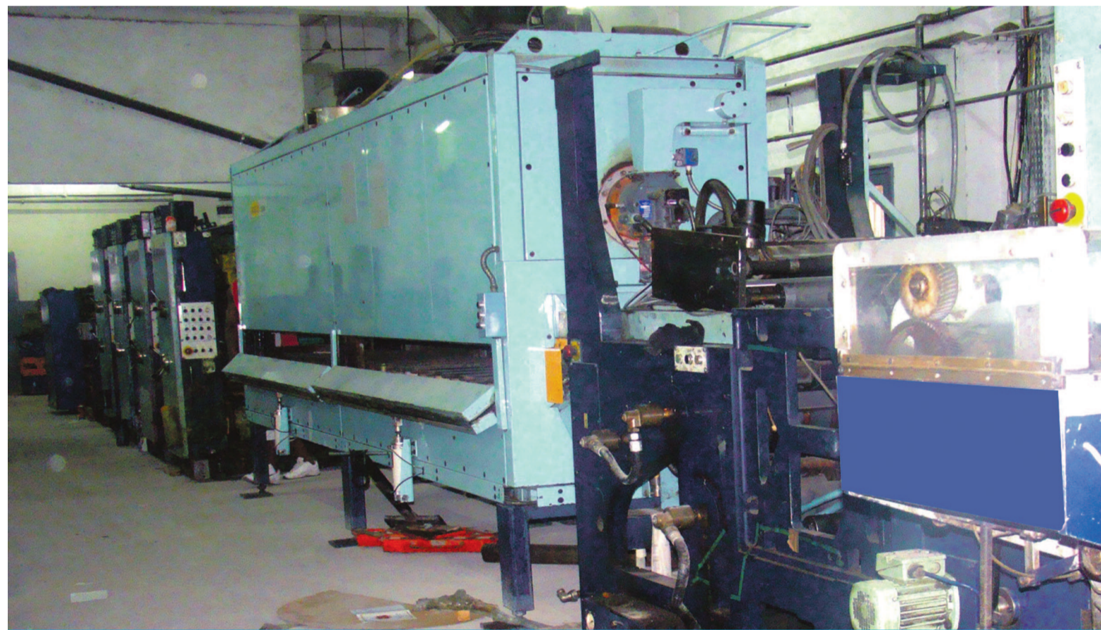
Une vue partielle de la rotative «Rotoman» en cours d'assemblage

machines diversifiées, commandée en France, vient d'être installée dans l'atelier brazzavillois du groupe Adiac. Ouvrant ainsi l'imprimerie des Dépêches de Brazzaville au marché de la production des imprimés tels que les magazines, les revues, les manuels scolaires, les agendas, les affiches et affichettes, les dépliants, les catalogues..., sans limite de pagination et avec l'insertion d'une couverture haut de gamme, si besoin est.