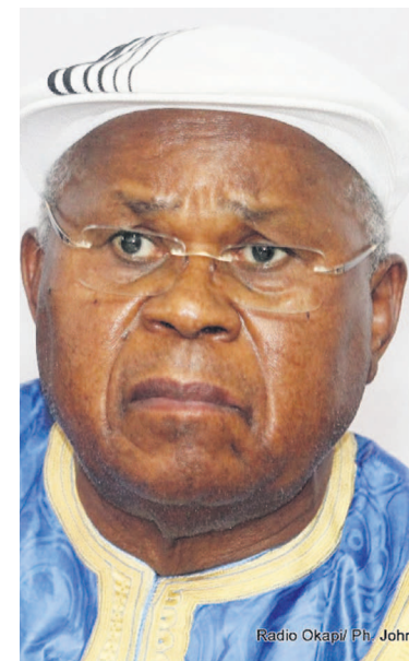
Etienne Tshisekedi

Des sources proches de la RVA ont confirmé que l'avion a bord duquel a pris place le président de l'UDPS a décollé très tôt, le matin du 16 août, de l'aéroport de Ndjili à destination de Bruxelles. Etienne Tshisekedi serait accompagné de son médecin et de son épouse. « Aucun fils présent. Sa situa-