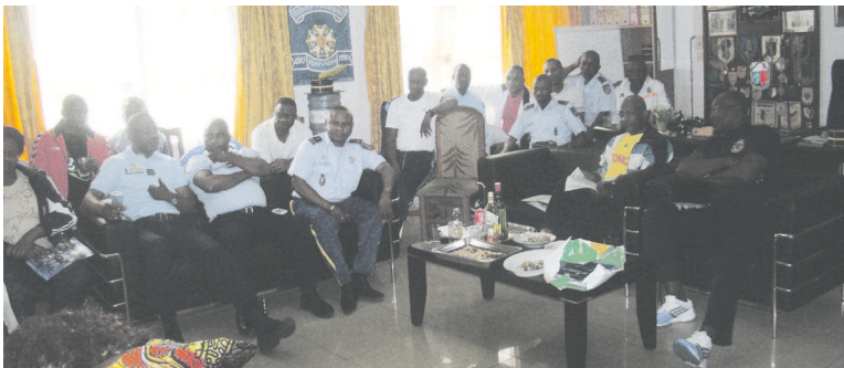
Des gendarmes suivant le défilé en direct à la télévisions

En effet, les gendarmes n'ayant pas effectué le déplacement de Sibiti, chef-lieu du département de la Lékoumou, pour prendre part au défilé marquant les 54 ans de l'indépendance nationale, ont célébré la