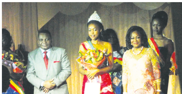
La miss indépendance posant avec la première dame et le ministre de la culture et des arts