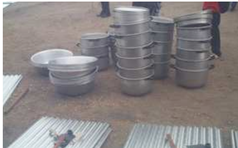
Une exposition d'ustensiles de cuisine

La mairie de Pointe-Noire, les sous-préfet et maire de Tchiamba Nzassi, le Consul général du Sénégal et plusieurs personnalités tant politiques, administratives que celles du monde des affaires ont également été primées. Ils ont reçu des diplômes d'excellence pour les uns et d'honneur pour les autres. Le comité de gestion du Comice a aussi distingué 10 femmes et autant d'hommes, suite à leur participation active et remarquée lors de ce Comice. Des hommes et femmes