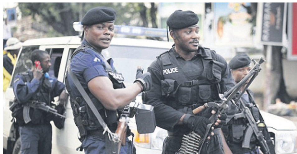
Des policiers en faction

Tout récemment encore, le quartier Delvaux dans la commune de Ngaliema avait été le théâtre d'une scène de braquage perpétrée par un groupe de malfrats dans