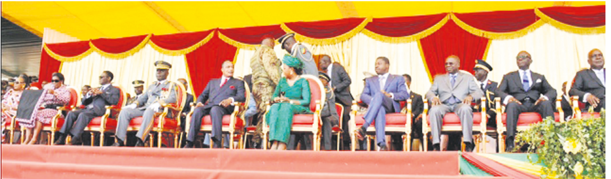
Le couple présidentiel et les chefs d'État invités à Sibiti

La ville de Sibiti, chef-lieu du département de la Lékoumou, a rayonné à l'occasion de la commémoration du 54ème anniversaire de l'indépendance marquée par un défilé civil et militaire de près de cinq heures.