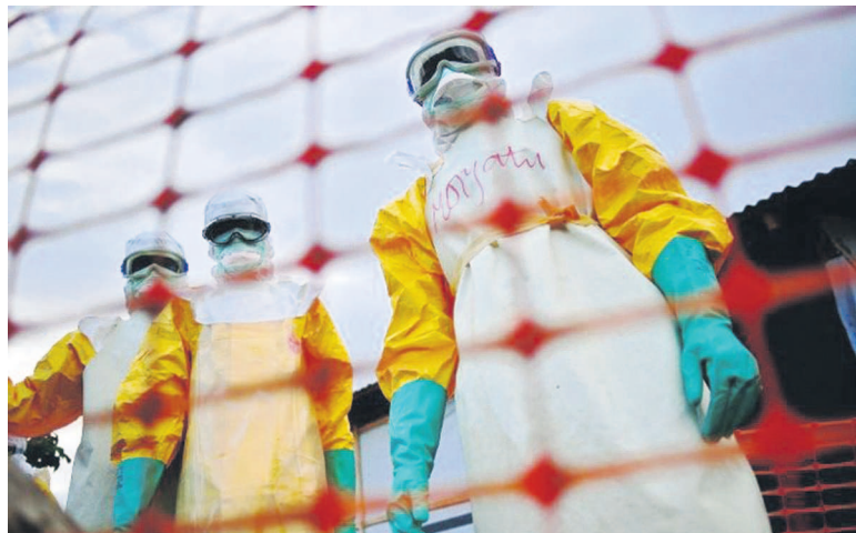
Des employés de Médecins sans frontières s'approchant du corps d'une victime à Kailahun en Sierra Leone

Les épidémiologistes congolais offrent leur expertise aux États affectés en matière de surveillance et d'éradication de cette épidémie classée au niveau III des urgences de santé publique.