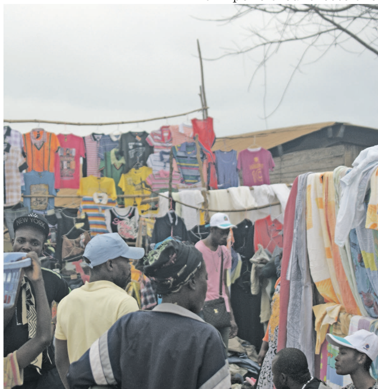
Un étalage de friperie