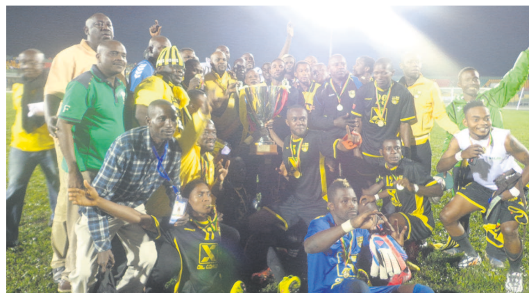
Photo de famille des Diables noirs

Le pari est réussi pour les Diablotins qui ont fini par sauver leur saison en remportant, le 14 août dans le nouveau stade de Sibiti, la coupe nationale face au Club athlétique renaissance aiglon (Cara) qu'ils ont battu aisément 2-0.