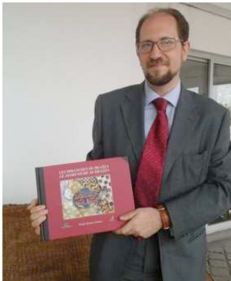
L'ambassadeur d'Italie au Congo posant à la Galerie du Bassin du Congo