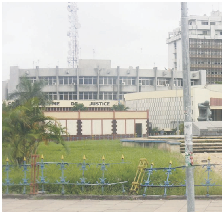
La Cour suprême justice

La première audience devant la plus haute juridiction du pays est fixée au 29 août. À la requête du Greffe de la Cour suprême de justice (CSJ), l'huissier près de cette instance a notifié à la Voix des sans-voix pour les droits de l'homme (VSV) que l'affaire Chebeya sera appelée devant cette plus haute juridiction du pays à l'audience publique du 29 août 2014 à 10h.