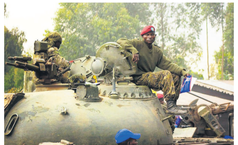
Des militaires des Fardc postés à la localité frontalière de Kibati au Nord-Kivu

Une tâche ardue presque impossible lorsqu'on sait que toutes les bornes laissées par les Belges et les Allemands