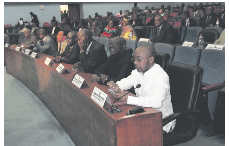
Les membres du gouvernement et du Sénat

gouvernement s'emploie à un engagement spécial au titre du service civique qui fera de sorte que les bénévoles sortent de la prise en charge par des parents