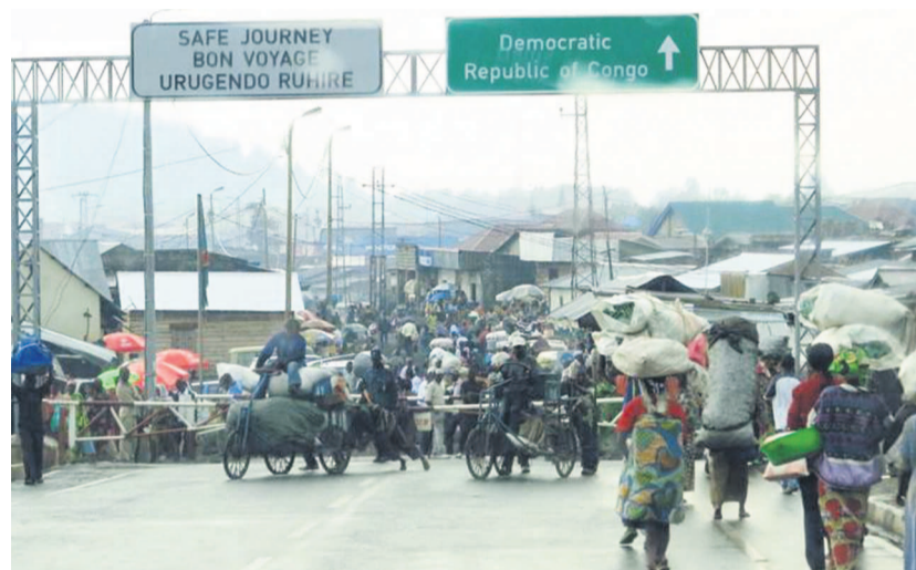
Les différends frontaliers entre les deux pays en voie d'être resorbés

Les experts des deux pays s'attendent, depuis le début de la semaine, à retrouver les vingt-deux bornes qui délimitent historiquement leur frontière commune afin de tracer une nouvelle en tenant compte des dernières évolutions naturelles. L'objectif de cette action est non seulement technique, mais aussi et surtout politique eu égard aux différends frontaliers qui, souvent, mettent en mal les relations diplomatiques entre le Rwanda et la RDC. Une tâche ardue lorsqu'on sait que toutes les bornes laissées par les Belges et les Allemands en 1911 n'ont pu être entretenues ces trente dernières années au point que certaines ont même disparu à vue d'œil, enfouies sous terre, ou simplement déplacées.