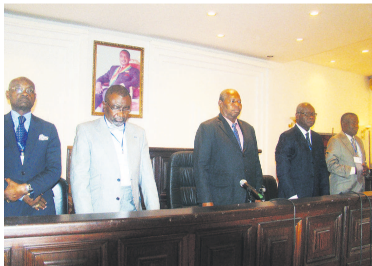
Le présidium des travaux

la Caresco a participé, après la disparition de son président, au recensement administratif spécial. Elle avait envoyé ses membres dans la Sangha, les Plateaux, Pool, la Bouenza, le Niari, Kouilou et à Pointe-Noire.