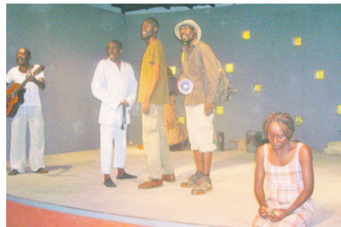
Les comédiens de Pointe-Noire en scène

Depuis plus de dix ans, les Jouthec réunissent dans les différents districts et villages du Kouilou, les comédiens et acteurs du continent, pour des échanges culturels et interculturels profitables à tous. C'est aussi l'occasion pour les troupes et compagnies de théâtre locales de montrer aux visiteurs leur