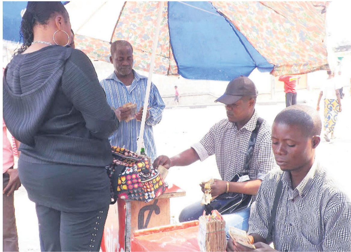
Des cambistes opérant à Kinshasa

Le suivi de l'exécution de cette nouvelle disposition a été confié au ministre provincial des Finances, Économie, Commerce, Industrie, Petites et Moyennes entreprises et Artisanat ainsi qu'à celui en charge