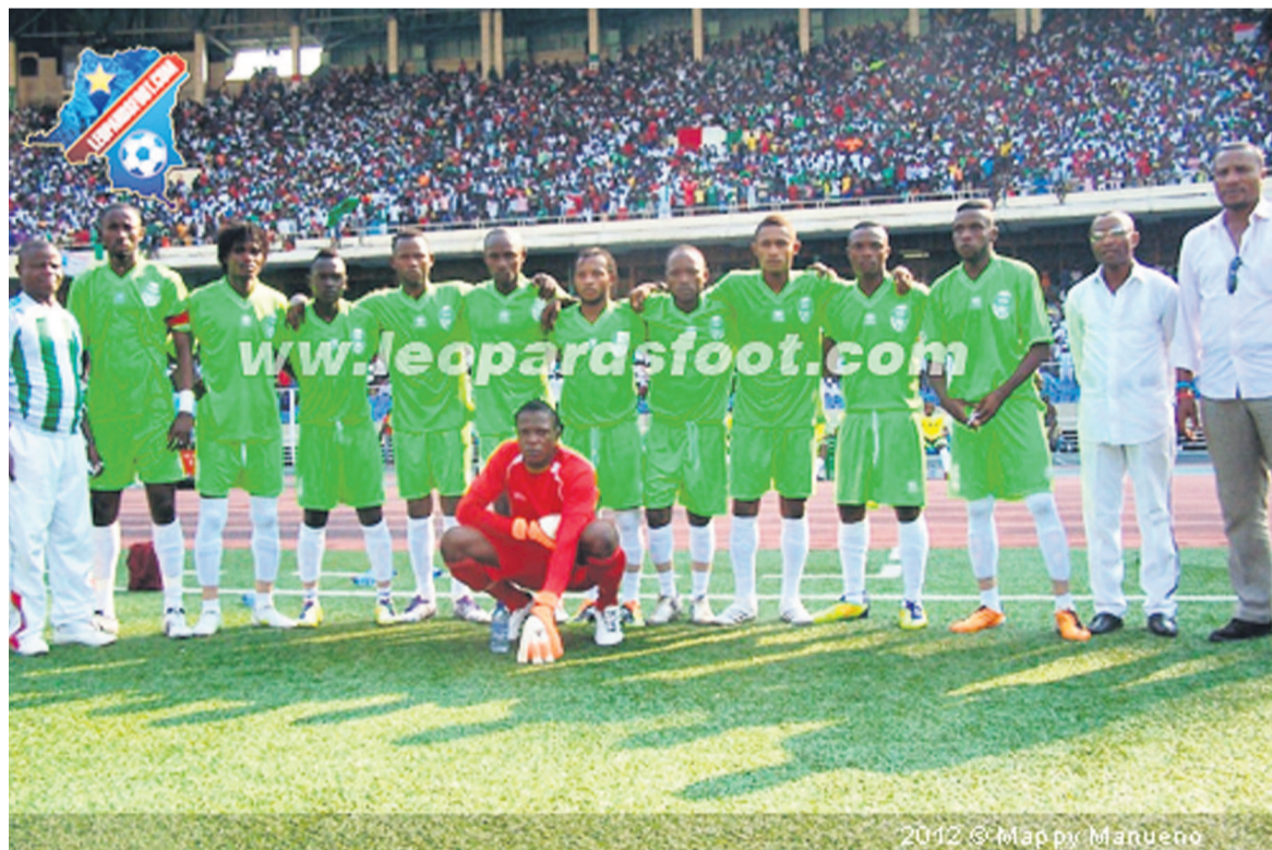
DCMP