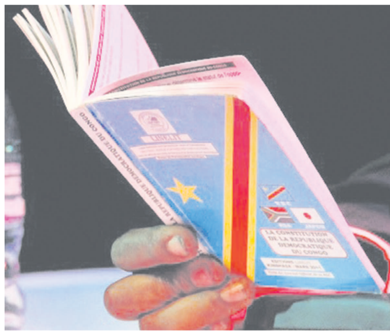
La Constitution de la RDC

contre les tentatives de réviser ou de changer la Constitution de la RDC. Ces organisations disent fonder leurs actions sur l'article 64 de la Constitution qui stipule : « Tout Congolais a le devoir de faire échec à tout individu ou groupe d'individus qui prend le pouvoir par la force ou qui l'exerce en violation des dispositions de la présente Constitution... ». Page 12