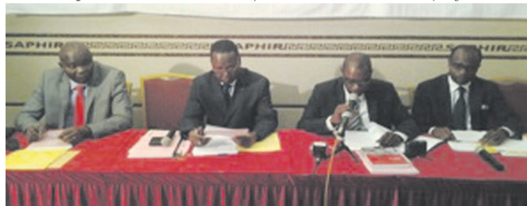
Le coordonnateur du Padé, encadré à droite, lors de l'atelier des PME performantes et dynamiques.

des partenaires économiques étaient représentés. « Notre pays est entré dans la phase de la diversification de l'économie. Au cours de celle-ci, il faut avoir