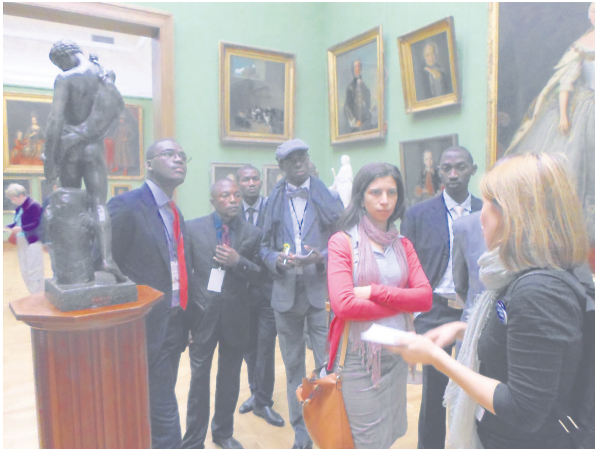
Visite de la galerie nationale Tretyakov

Au Palais des Armures, les membres de la délégation africaine se sont fait une idée de l'opulence dans laquelle vivaient les familles royales. Robes dorées et couronnes qui accentuaient la beauté de Catherine La Grande de Russie, trônes en or massif sur lequel les tsars et les princes calaient leur physique imposant... Pour terminer en beauté cette série de visite des sites culturels, les jeunes leaders devraient se rendre au pied de la tour de Moscou, le mausolée Lénine et bien d'autres. Le temps de sé-