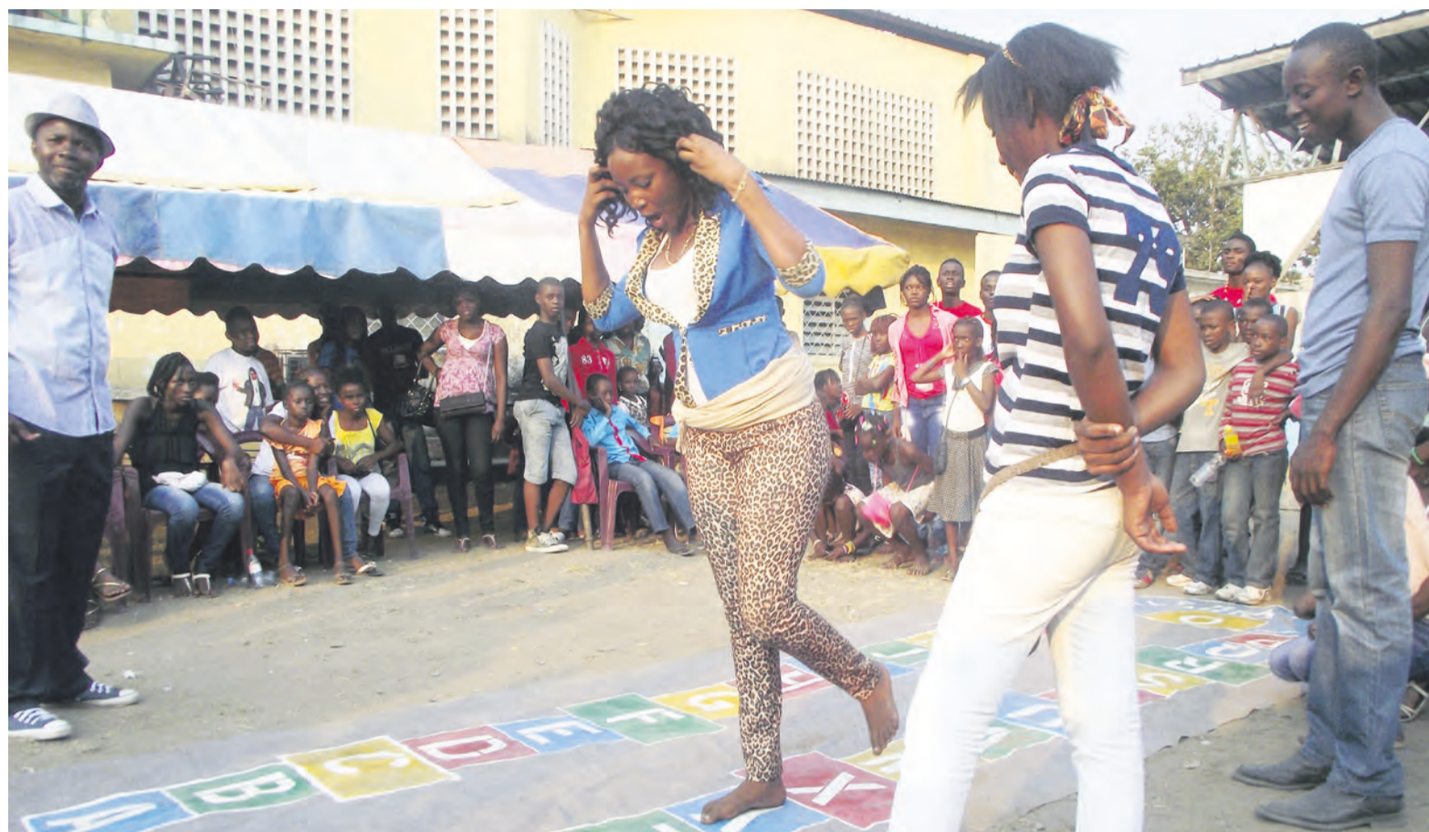
Les jeunes filles jouant à la marelle au Cercle culturel Sony Labou Tansi

« Ce premier festival Alphabet Africa organisé à Brazzaville a été une toute première au monde. C'est une histoire qui a commencé au Congo- Brazzaville et qui va traverser les frontières. En Europe et ailleurs, il y a beaucoup de choses, mais en Afrique, il n'y a rien. En France par exemple, à partir de juin-juillet, il y a plus de 500 festivals. Il faut organiser des festivals au pays, car si nous ne le faisons pas, les autres viendront prendre