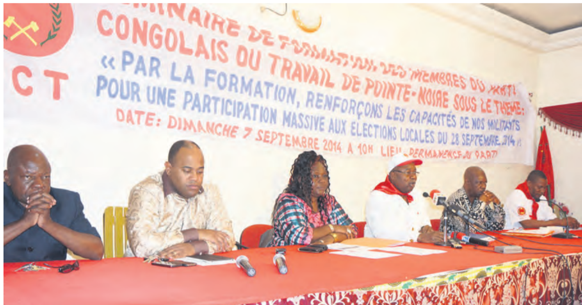
Tribune de la réunion

Le mot du séminariste, lu à l'occasion de cette réunion, salue l'initiative du secrétariat fédéral du PCT de Pointe-Noire qui permet de renforcer la capacité de mobilisation des membres du parti en vue d'affronter les élections locales du 28 septembre prochain.