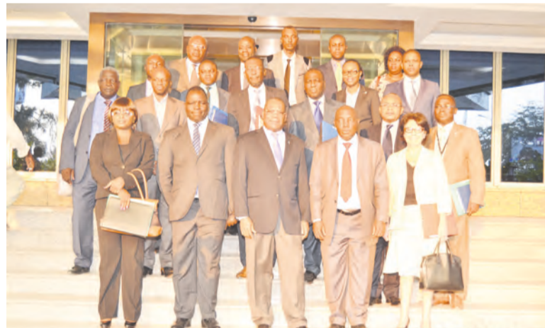
Les membres de l'Anif et de l'association professionnelle des établissements de crédit

L'Anif travaille le plus souvent avec les banques auprès desquelles converge tout flux financier. En plus, elles ont en leur sein des logiciels anti-blanchiment. Ces outils signalent sur le client si le flux dépasse le volume de son activité. Si tel est le cas, la banque doit informer l'Anif après avoir bloqué le compte. À son tour, l'Anif saisit le procureur de la République. Cette évaluation est importante pour le Congo ( les autres pays ne la