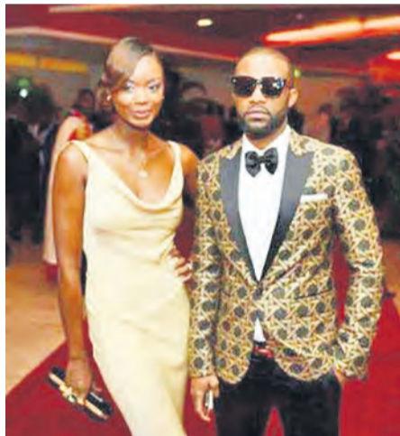
Isabelle Béké et Fally Ipupa

L'actrice est à la fois amusée et étonnée du buzz suscité par la divulgation de cette information.