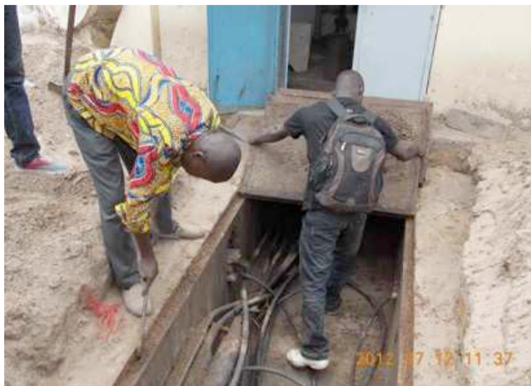
Un raccordement des câbles à fibres optiques par des agents de Congo Télécom

Dans l'optique d'établir une véritable économie numérique, la mise en place des conditions de gestion de la fibre optique dans le cadre du Projet de Couverture nationale ou du CAB (African Backbone Cable) est une exigence. Selon le ministère des Postes et Télécommunications, le projet réalisé avec Congo Télécom et le ministère des finances serait très avancé. La structure en création va, selon des informations, porter au nom de l'État la propriété de tout le haut débit qui est déployé au Congo par la SNE, Congo Télécom et le projet de couverture nationale. L'institution serait une société anonyme ou un établissement public. Elle proposera aux opérateurs sous forme d'appels d'offre, d'une concession de service public, ou sous forme de contrat de gestion ou d'affermage,