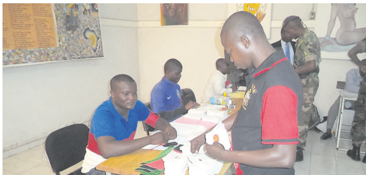
Un électeur en train de voter

À l'intérieur du pays, le constat est presque le même, à quelques ex-