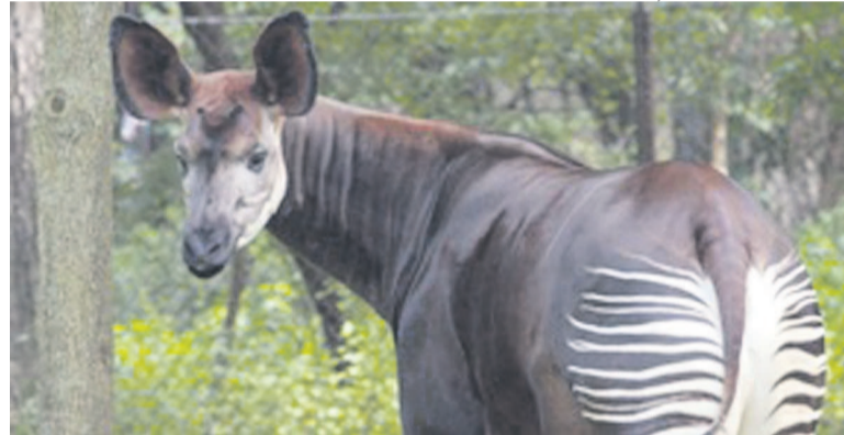
L'Okapi vivant uniquement en RDC

« Ce qui fait de ce pays un territoire aussi riche, c'est la beauté