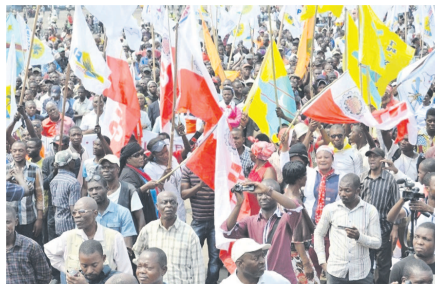
Des militants de l'opposition