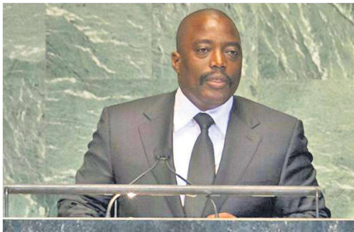
Le président Joseph Kabila à la tribune des Nations unies

Le discours du président de la République, Joseph Kabila, prononcé le 26 septembre à la tribune des Nations unies n'a pas apporté une réponse au débat sur la révision de la Constitution qui divise la classe politique congolaise. Au contraire, il semble apporter de l'eau au moulin de ceux de l'opposition qui ont toujours déploré le mutisme du chef de l'État face à cette question et laisser libre court à la spéculation qui a pris en otage l'ensemble de la population congolaise. À la veille d'une marche de l'opposition contre la révision de la Constitution, l'adresse du président de la République n'aura pas eu le mérite de calmer les ardeurs. Aux yeux des opposants, il n'a fait que conforter les craintes de tous ceux qui n'ont cessé de dénoncer une tentative de déverrouillage de l'article 220 de la loi fondamentale de la RDC par la majorité présidentielle. Ils souhaiteraient que le président Joseph Kabila se prononce de manière solennelle devant la communauté internationale sur cette question qui a transcendé la sphère nationale.