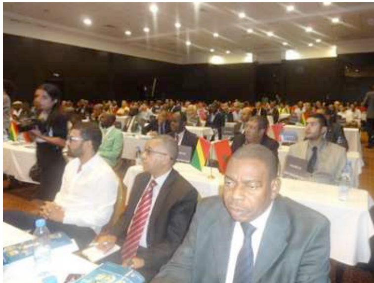
Le symposium maroco-congolais

Le ministre à la présidence chargé des ZES a informé les Marocains que le Congo met en place des ZES, une stratégie de diversification économique. Ces zones ont pour vocation de booster les investissements,