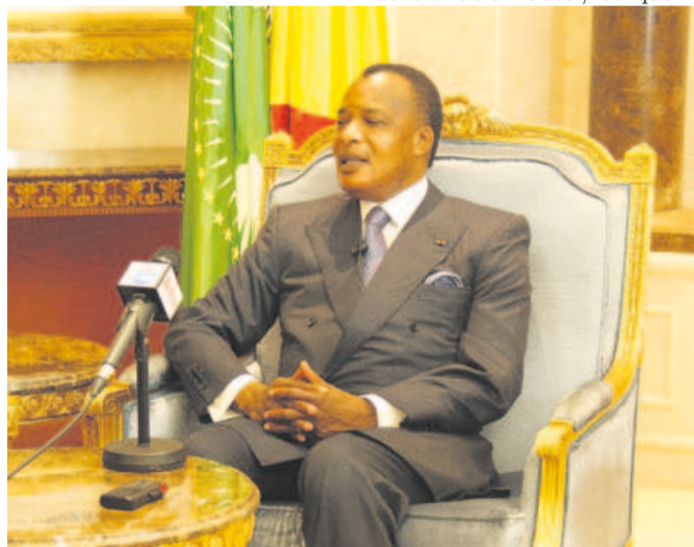
Le président Denis Sassou N'Guesso

annonce a été faite. Nous avons lancé l'idée et avons aussi estimé que d'autres, sûrement, suivront. J'ai déjà pris des contacts avec quelques homologues en Afrique qui se proposent de suivre. Nous pensons que les OMD s'ils ne se contentent que des financements classiques, des aides publiques au développement, ils ne seront jamais atteints. Il faut de nouvelles idées pour financer les OMD. Voilà pourquoi on parle de financements innovants. D'autres idées pourraient aussi arriver comme la taxation des transactions financières et tant d'autres.