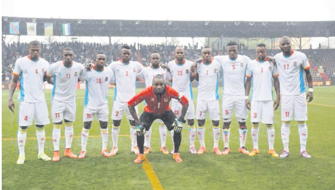
Les Léopards avant le match contre la Sierra Leone à Lubumbashi

Les Léopards de la RDC affrontent, le dimanche 11 octobre au stade Tata Raphaël de Kinshasa, les Éléphants de la Côte d'Ivoire en troisième journée du groupe D des éliminatoires de la Coupe d'Afrique des Nations prévus au Maroc pour 2015. Selon la Radio Top Congo dans sa page sportive diffusée le matin du 26 septembre, le sélectionneur de la RDC, Florent Ibenge, aurait déjà confectionné sa liste des présélectionnés pour cette rencontre, avec quelques réaménagements par rapport à la liste des joueurs retenus pour le match contre le Cameroun et la Sierra Leone. Ainsi, constate-t-on l'absence du gar-