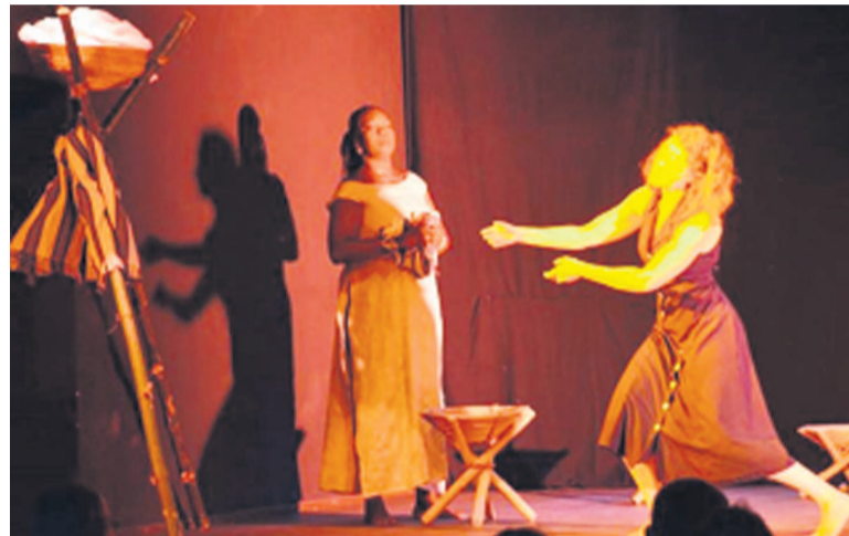
La pièce de théâtre Deux sœurs, un souffle, trois poussières

Après plusieurs mois de séparation que chacune a vécus à sa manière, les deux sœurs se retrouvent réunies autour de la dépouille mortelle de leur mère. Méra, a construit sa vie loin de la famille à l'opposé de Néré, sa cadette qui restée au chevet de la famille. Autour de la dépouille de la maman décédée, ressurgissent les ambivalences : amour et désamour, haine et attirance, estime et complicité, tendresse et froideur... Cette pièce de théâtre d'une profon-