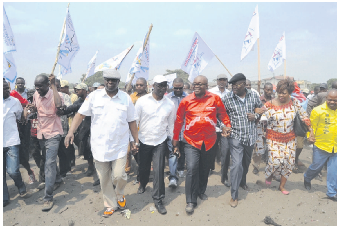
Legendes et crédit photos: Photo 1: Des opposants arrivant à la place Sainte-Thérèse de Ndjili, lors du meeting du 4 juillet

Il a été reconnu à sa charge les infractions d'outrages au chef de l'État et de discrimination raciale et tribale, à la suite de ses interventions faites à l'occasion du meeting de l'opposition politique tenue à la place Sainte-Thérèse à N'djili, le 4 août. Le député national sera condamné, le 11 septembre, « à l'issue d'une procédure de flagrance au cours de laquelle ses droits fondamentaux n'étaient pas respectés par la Cour suprême de justice (CSJ) », à une peine de ser-