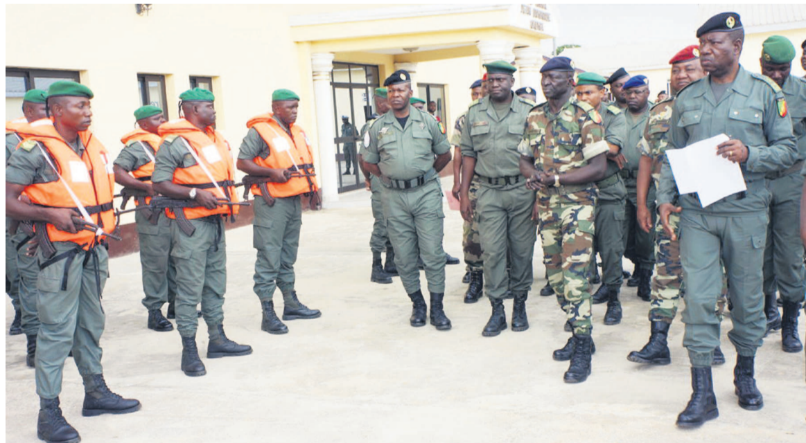
Les responsables de l'opération visitant la composante de la base navale