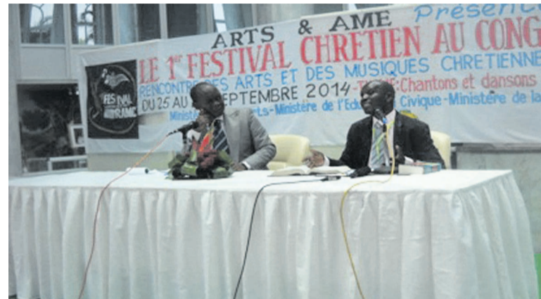
Le présidium des travaux

« Je suis l'Éternel, ton Dieu qui te guérit », peut-on lire dans le psaume 103. Si le sida est une