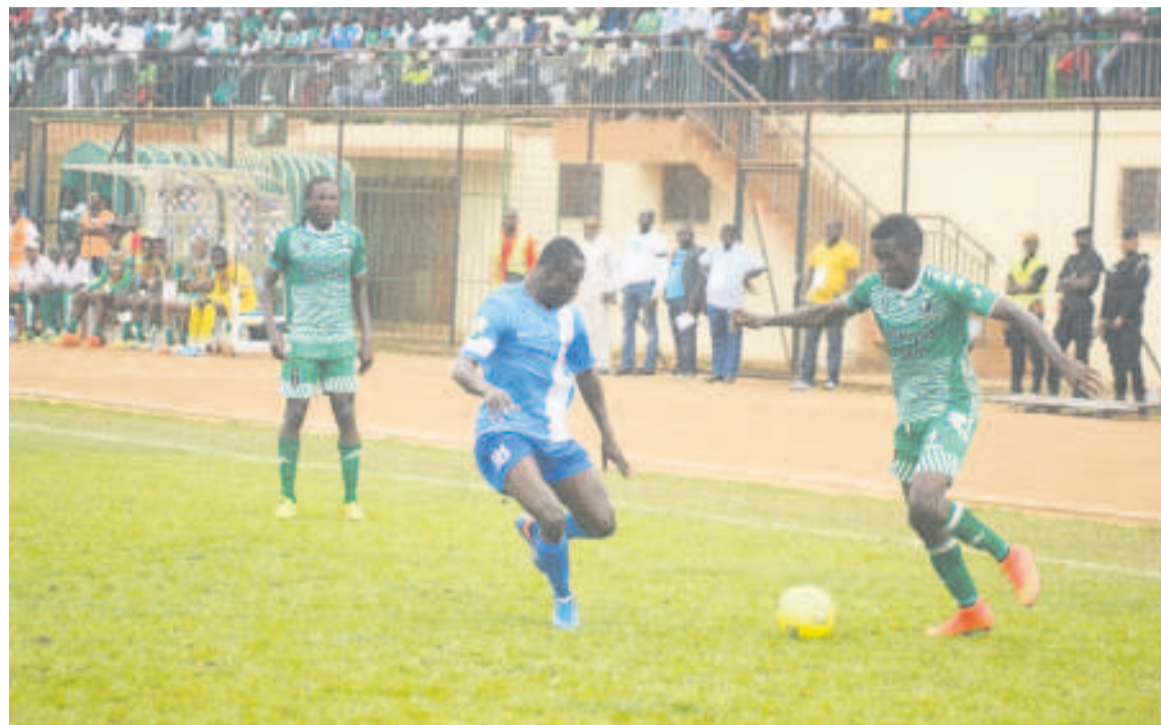
Les Fauves du Niari éliminés par le Séwé sport

C'est la première fois en compétition africaine que les Léopards manquent une qualification à Dolisie alors qu'ils n'avaient qu'un but de retard à remonter. Les mêmes causes ont produit les mêmes effets puisque ce scénario n'est que la suite logique des demi-finales de la Coupe du Congo perdues cette saison par les Fauves du Niari devant les Diabes noirs alors qu'ils avaient également un but à remonter. Le club ivoirien a tenu le coup. Mais le grand bou-