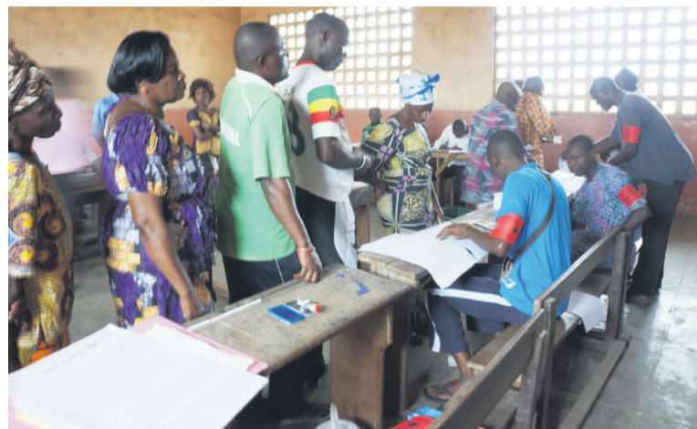
Les électeurs à l'intérieur du bureau de vote à Mvou-Mvou

de vote de l'école Ndéndé Niengo, commente : « Le centre n'est confronté à aucun problème lié à la logistique. Il y a actuellement plus de 200 électeurs qui ont voté avant le début de l'après midi sur 841 électeurs attendus dans ce centre. Nous pensons que ce chiffre pourra doubler avant la fermeture totale des bureaux de vote ». Au lycée de Mpaka et à l'école primaire