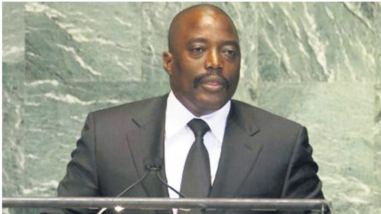
Le président Joseph Kabila à la tribune des Nations unies