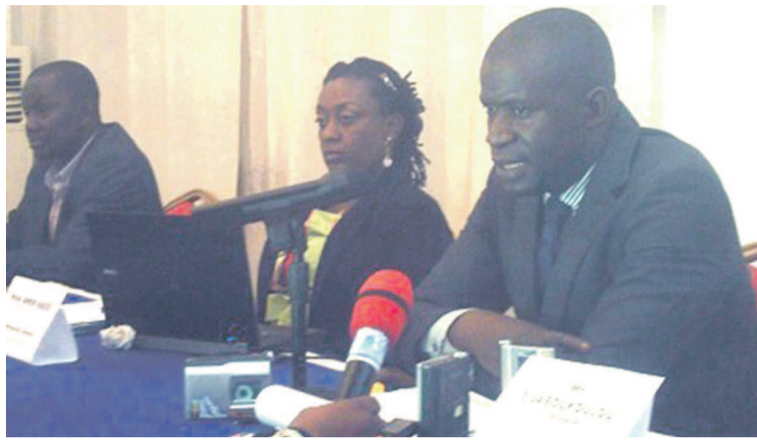
La tribune officielle à l'ouverture de la foire des banques