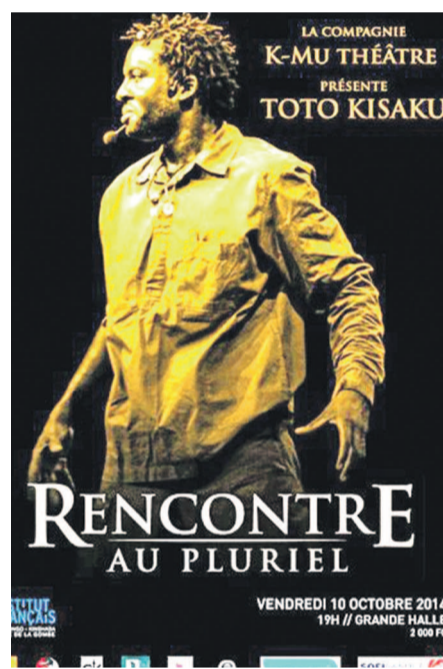
L'affiche du spectacle Rencontre au pluriel