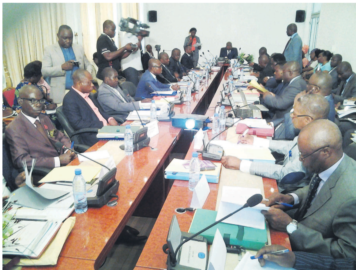
Le comité de direction lors du conseil d'administration

Avec cette somme le ministère de l'Équipement et des travaux publics va achever les travaux liés à la municipalisation accélérée dans les départements de la Lékoumou, du Pool et des Plateaux avant de poursuivre ceux engagés dans la Sangha et la Likouala.