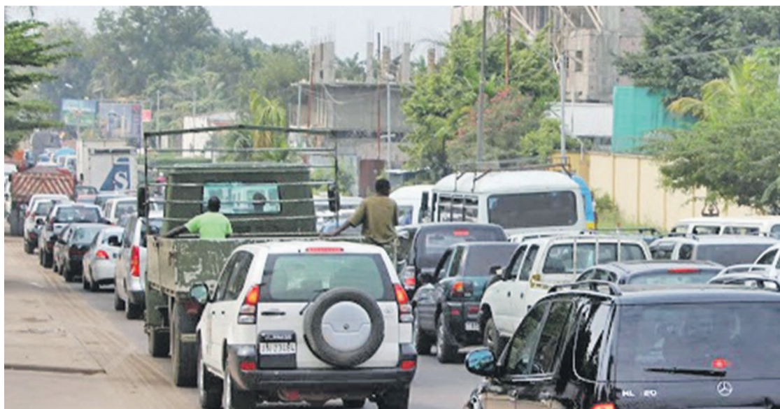
Des véhicules sur une avenue de Kinshasa

C'est ce mercredi 8 octobre que la Direction générale des recettes de Kinshasa (DGRK) démarre la campagne de recouvrement forcé des vignettes automobiles pour les exercices fiscaux passés. Cette opération intervient au terme du moratoire accordé aux propriétaires des véhicules et autres engins motorisés retardataires afin de leur permettre de s'acquitter de la vignette de l'exercice 2013. L'hôtel de ville avait, à l'occasion, mis un bémol à cette campagne afin de permettre une rentrée des classes apaisée au mois de septembre.