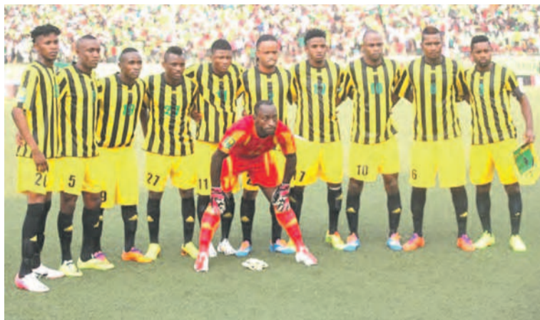
V.Club de Kinshasa

des champions par TP Mazembe, champion du Congo en titre, Sanga Balende vice-champion du Congo et l'AS V.Club qui a fini troisième du championnat national certes, mais qui, à la faveur de l'article suscité du Règlement de la Ligue des champions, devra défendre son titre, en cas de victoire contre Entente Sétif qui est un préalable non négligeable. Et en Coupe de la Confédération, c'est CS Don Bosco de Lubumbashi -quatrième du championnat national-, qui aura à prendre la place laissée vacante par V.Club. Et le deuxième club en C2 africaine, c'est le FC MK, vainqueur de la Coupe du Congo en 2014. Rappelons la finale aller de la 18e édition de la Ligue des champions d'Afrique entre V.Club et Entente Sétif est prévue pour le dimanche 26 octobre 2014 au stade Tata Raphaël de Kinshasa. Et l'on apprend que le gouverneur de Kinshasa, André Kimbuta, s'est résolu de réfectionner cette infrastructure sportive pour cette circonstance.