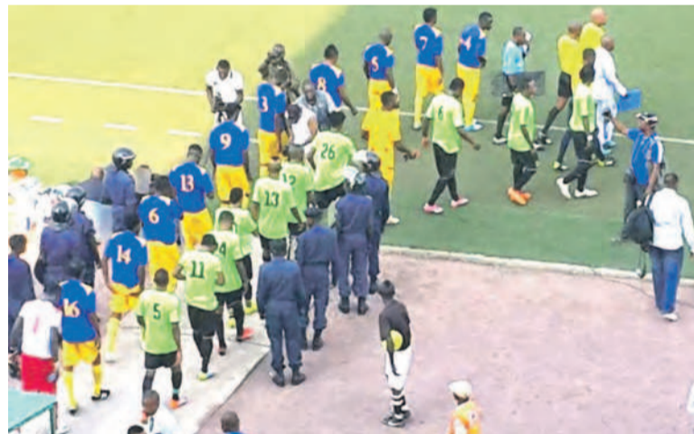
V.Club et Racing club de Kinshasa montent sur l'aire de jeu du stade Tata Raphaël

Dans le groupe A, le champion sortant, le TP Mazembe a atomisé, le dimanche 5 octobre au stade TP Mazembe de la commune de Kamalondo à Lubumbashi, l'AS Bantous de Mbuji-Mayi, par sept buts à zéro. Toujours dans ce groupe A, Sanga Balende s'est imposé le même dimanche sur l'US Tshinkunku par un but à zéro. La Ligue nationale de football a par ailleurs infligé un forfait AC Capaco de Beni (Nord-Kivu) qui devait se déplacer à Lubumbashi pour affronter Lubumbashi Sport. Dauphin Noir de Goma a également perdu par forfait face à CS Don Bosco pour la même raison d'absence à l'heure du coup d'envoi. Reporté à lundi 6 octobre 2014 suite à une forte averse qui s'est abattue sur la ville de Bukavu le 5 octobre, et rendant le stade de la Concorde de la commune de Kadutu impraticable, le match entre OC Muungano de Bukavu et Saint-Eloi Lupopo de Lubumbashi s'est soldé sur le score vierge de zéro but partout.