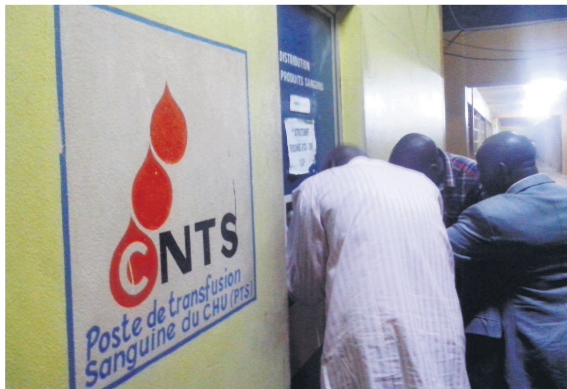
Les demandeurs de sang en attente