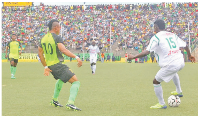
Vue du match de la Division 1 entre V.Club et DCMP le 23 février 2014

Le communiqué du secrétariat de la Linafoot rendu public le jeudi 9 octobre fait savoir que le match entre le FC MK et le Racing Club de Kinshasa (RCK), deux clubs de la capitale congolaise, est reporté au mardi 14 octobre au stade Tata Raphaël ; et les rencontres entre, d'une part, TP Mazembe de Lubumbashi et AC Capaco de Beni, et de l'autre, JS Groupe Bazano de Lubumbashi et AS V.Club de Kinshasa sont renvoyées à une date ultérieure. La Linafoot a également modifié