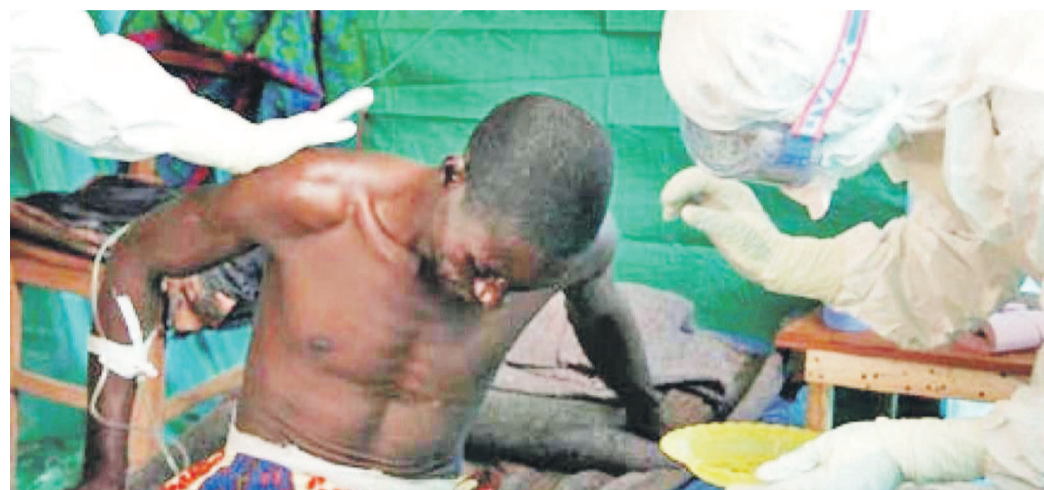
Traitement d'un malade d'Ebola

Les unités des FARDC et de la police déployées aux frontières, d'après la même source, sont appelées à renforcer la sécurité, afin qu'il n'y ait pas d'infiltration des cas suspects.