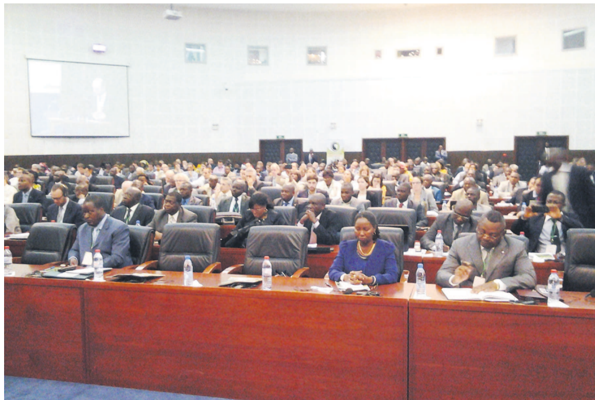
Les participants à la session de Brazzaville