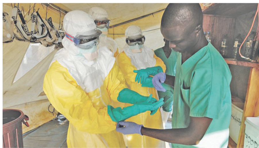
Traitement d'un malade atteint par le virus d'Ebola