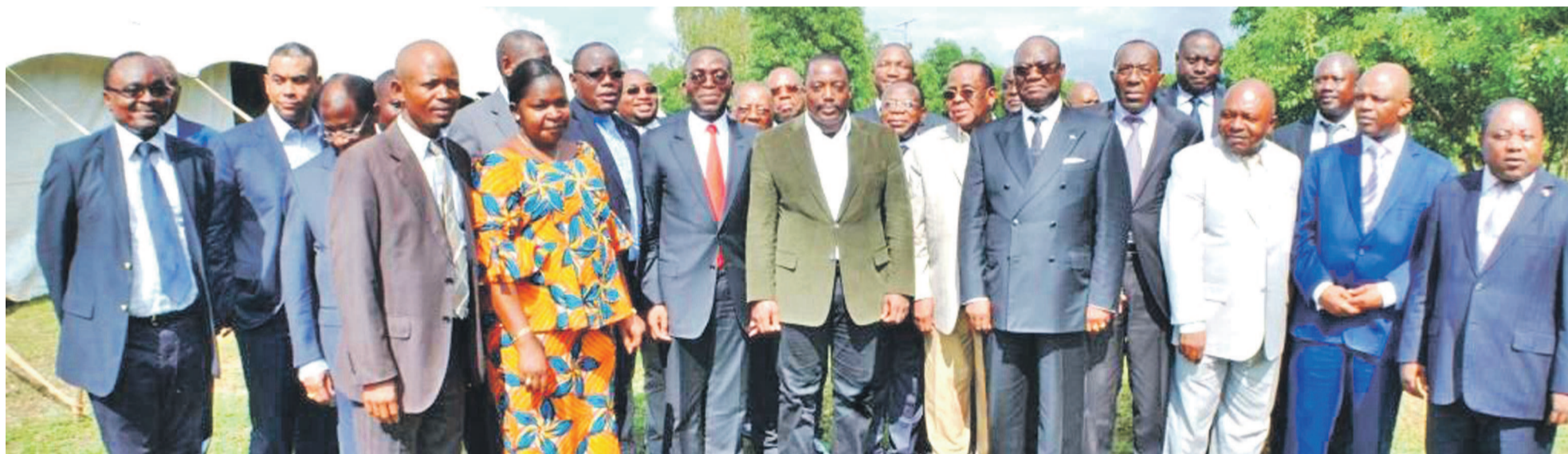
Joseph Kabila posant avec quelques cadres de la Majorité à Bukanga Lonzo

Présidant mardi une réunion à Kingakati, Joseph Kabila a insisté sur la cohésion et la cohérence devant régir dorénavant les actions du regroupement politique, loin des intérêts partisans. Le chef de l'État qui avait autour de lui tous les bonzes du bureau po-