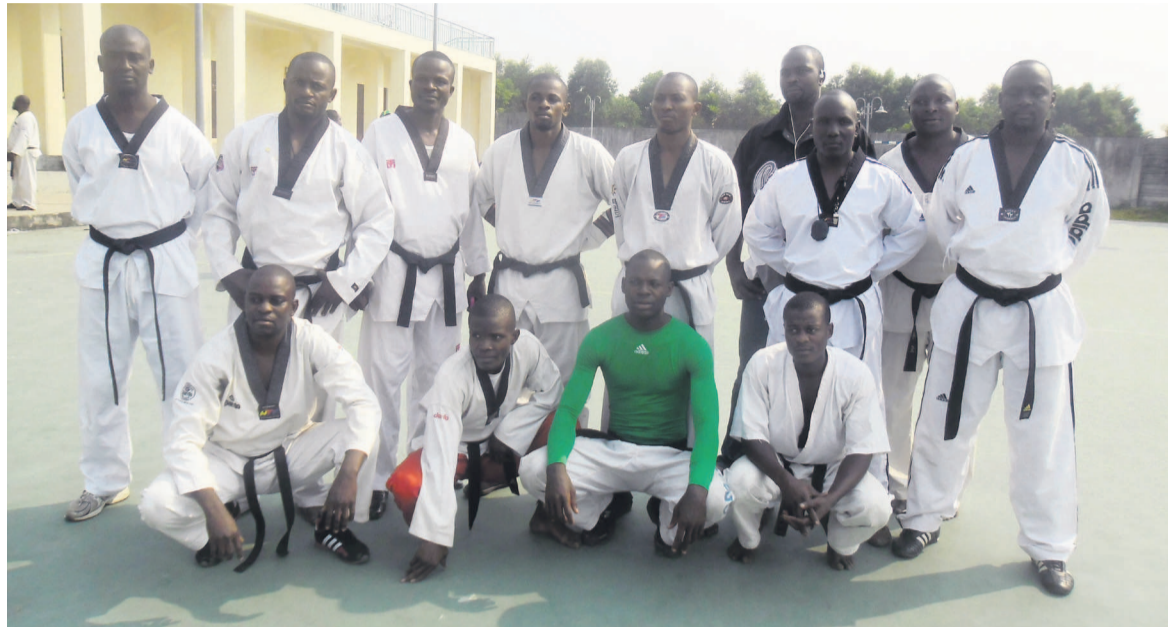
Les taekwondoïens congolais

Les athlètes congolais se sont fixé l'objectif de figurer dans le carré d'as de compétition prévue du 28 au 29 novembre, à Dakar au Sénégal, bien avant l'ouverture du sommet de la Francophonie qui aura lieu dans le pays.