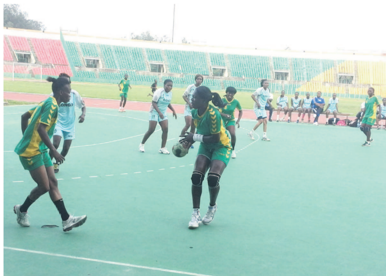
Une rencontre de l'Étoile du Congo