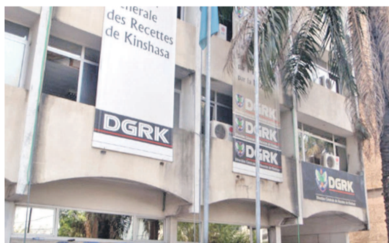
Les bureaux de la DGRK.