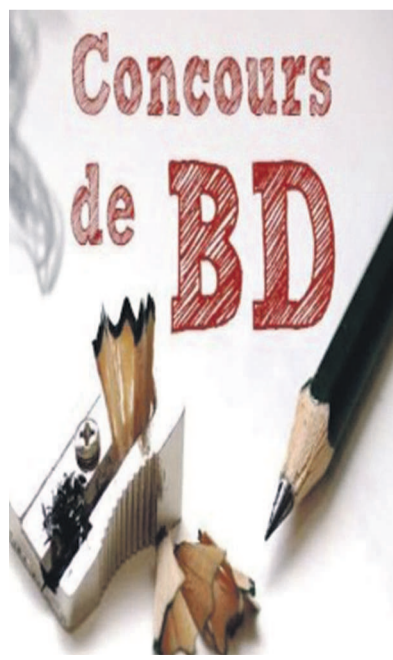
Photo : L'affiche du concours de BD