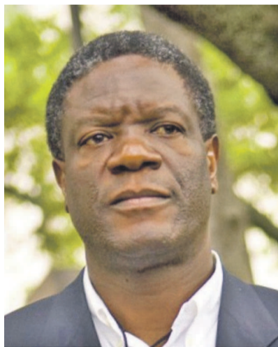
Dr Denis Mukwege

Après le prix Olof-Palme, celui des droits de l'homme des Nations unies ainsi que le Prix international du Roi-Baudouin pour le développement, il vient de se voir décerner le prix Sakharov dans son édition 2014. Ce prix crée en 1988 honore les personnes ou les organisations qui ont consacré leur existence à la défense des droits de l'homme et des libertés. Pour cette année, le choix a été porté sur le Dr Mukwege en raison de l'abnégation et du courage qu'il a affichés dans les soins apportés aux femmes victimes de violences sexuelles. Le travail du gynécologue a été fortement apprécié à Strasbourg par le Parlement européen eut égard surtout aux risques qu'il encourt sur un territoire gangrené par des conflits armés récurrents. Déjà en 2012, le médecin a échappé à une tentative d'as-