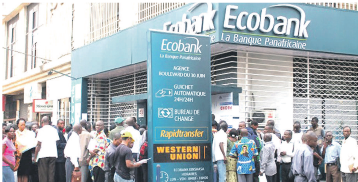
Des agents et fonctionnaires de l'État attendant la paie du mois devant une banque à Kinshasa.