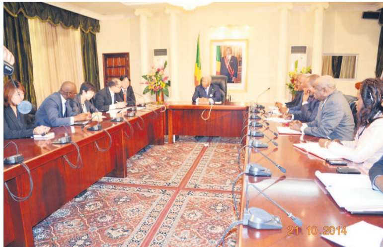
Le ministre au centre, lors de la réunion