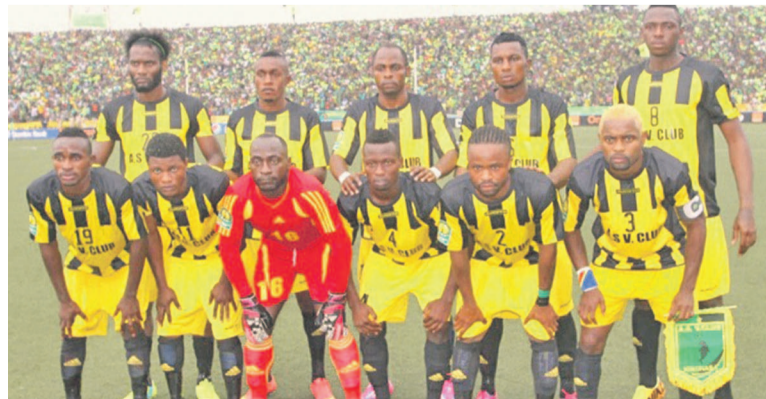
V.Club de Kinshasa

Du côté du staff technique de V.Club, nous sommes conscients aussi bien de l'enjeu du match que de la carrure de l'adversaire. L'on s'attend donc à un match costaud et plein. Intervenant le 20 octobre sur la RTNC, l'entraîneur principal du club, Florent Ibenge a déclaré : « D'aucuns pensent déjà à la Coupe du monde des clubs où V.Club va rencontrer le Real de Madrid. Mais avant de penser à cette éventualité, il y a la finale aller de ce dimanche. Il ne faut pas qu'on mette la charrue devant le bœuf. C'est un match costaud, difficile et nous travaillons pour le gagner. Nous savons que l'adversaire est difficile à manier ». Florent Ibenge a lui aussi lancé un appel de soutien de tout le peuple afin que le club représentatif de la RDC remporte cette troisième finale de la C1, après le sacre de 1973 face à Ashanti Kotoko de Kumasi (Ghana) et la défaite de 1981 contre Jeunesse électronique de Tizi-Ouzo (actuel Jeunesse sportive de Kabylie) d'Algérie. L'arrivée à Kinshasa de la délégation d'Entente Sétif est annoncée pour le vendredi 24 octobre 2014, une délégation composée de cinquante-cinq personnes dont dix-huit joueurs.