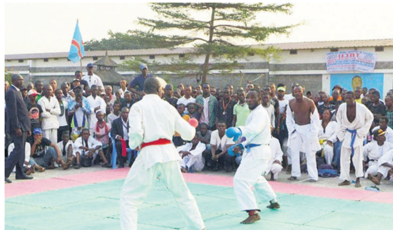
Vue d'un combat au 20 e championnat de Kinshasa de karaté

En kumite senior homme par équipe, le club Armée de l'Eternel