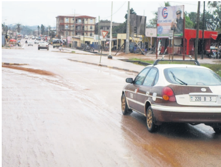
une vue des artères de Ouesso

La ville a grandi en effet ! D'un seul arrondissement, elle est passée à deux, et bientôt trois avec son extension sur Mokeko situé à environ 15 km. L'avenue Marien N'Gouabi, principale artère de la ville, réhabilitée en 2011 et longue de 3100 mètres borde d'importantes institutions dont la Banque des États de l'Afrique centrale. Le luisant bâtiment, avec son architecture futuriste, qui fait face à une moderne station-service a précipité des constructions aussi modernes