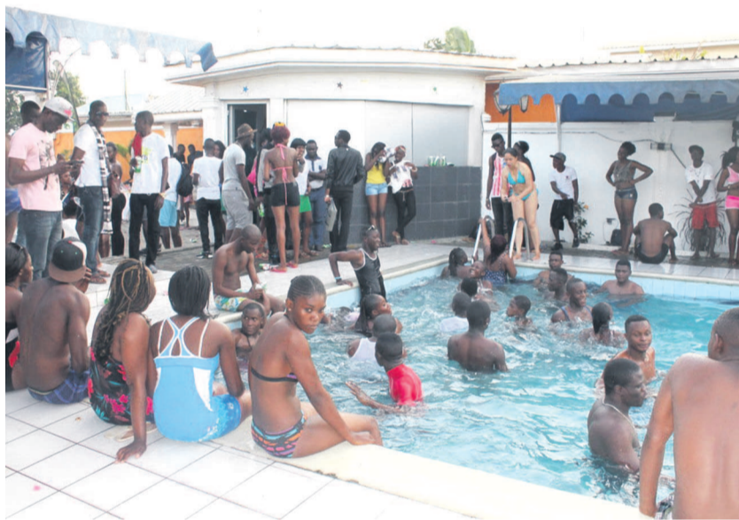
Les jeunes pendant la piscine party

Ce 18 octobre, c'est un pari gagné pour les promoteurs du groupe K.Y. S. concept, après sept éditions couronnées elles aussi de succès. Les Ponténégrins ont fini par prendre goût à cette culture de baignade, de détente et de bonne ambiance autour d'une