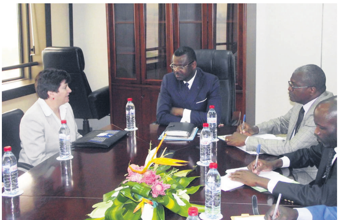
La séance de travail entre le ministre du tourisme et l'ambassadrice des États-Unis au Congo

« Avec le ministre du Tourisme et de l'environnement, nous avons abordé plusieurs aspects, notamment comment accompagner les efforts du gouvernement à propos de l'environnement et aussi comment encourager le tourisme. » En effet, les États-Unis qui apportent beaucoup dans la gestion de l'environnement au Congo voudraient également le faire dans le domaine touristique. « Chez nous, on n'a pas de ministère du