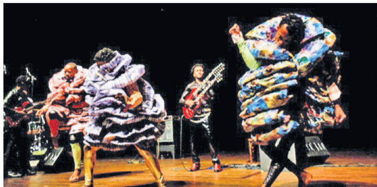
Un spectacle des studios Kabako