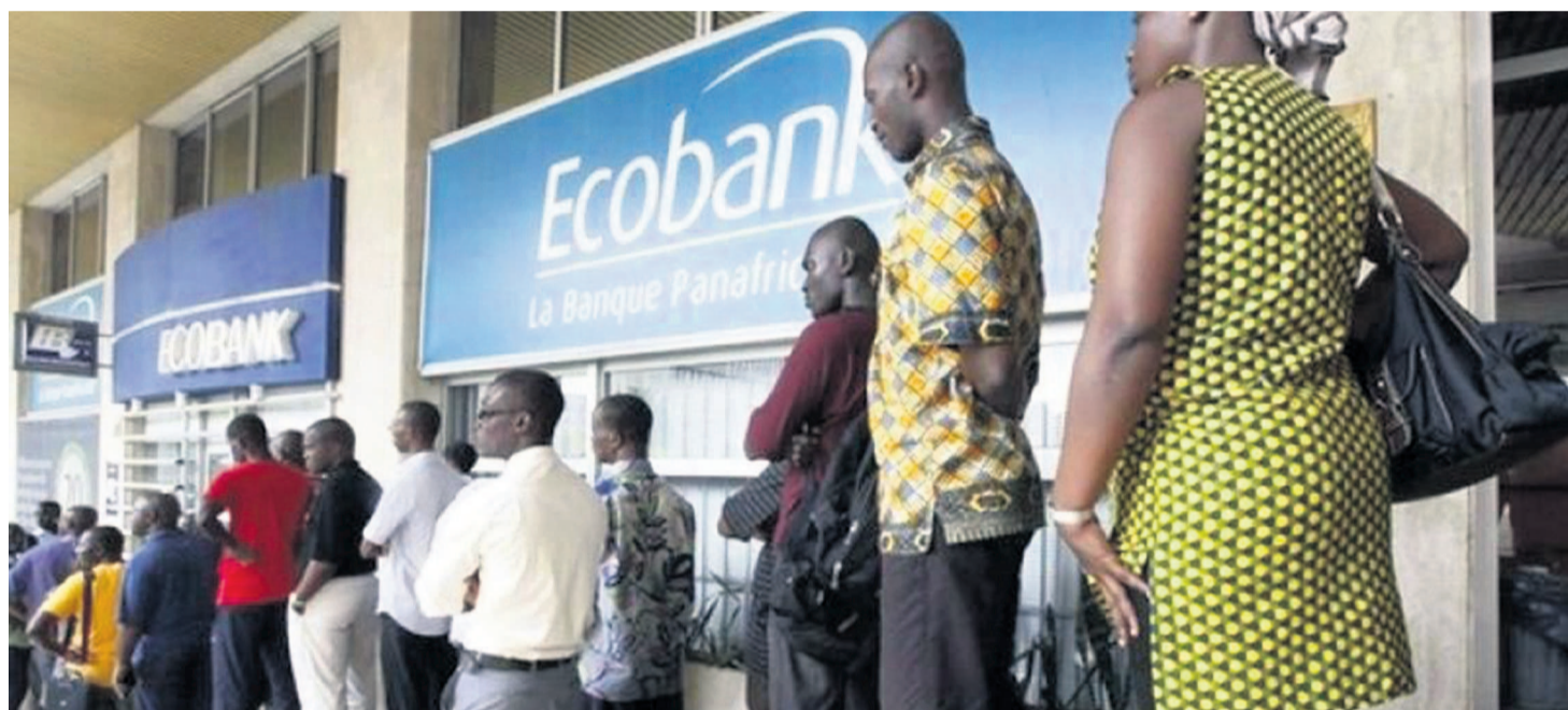
Des fonctionnaires attendant percevoir leur rémunération mensuelle

Dans la recherche des voies de sortie de ce qui paraissait déjà comme une crise, l'ACB se serait réunie en comité de direction extraordinaire qui lui a permis de décider de la reprise de la paie.