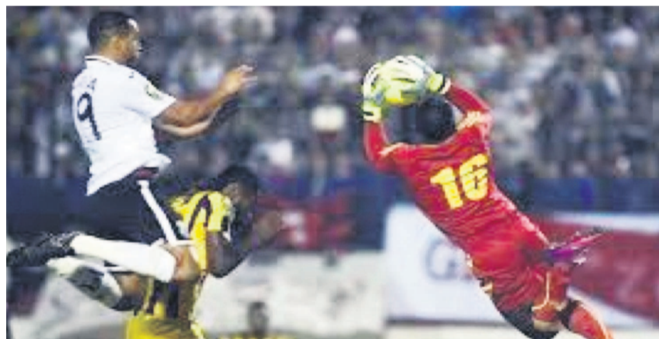
Vue d'une action du match Entente Sétif contre V.Club à Blida

L'AS V.Club n'a pas réussi l'exploit de ramener le trophée de la 18e édition de la Ligue des champions d'Afrique au terme de la finale retour de la Ligue des champions d'Afrique.