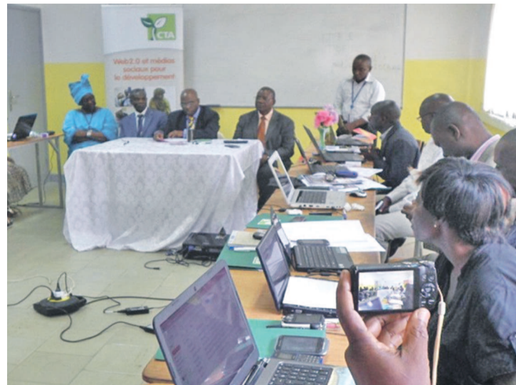
Vue de la salle pendant les travaux

Notons que le Centre technique de coopération agricole et rurale a entre autres missions de faciliter l'accès et la diffusion de l'information dans les domaines de l'agriculture et du développement rural dans 78 pays d'Afrique caraïbes pacifique (ACP) incluant le Burkina Faso et d'appuyer l'adoption des applications Web 2.0 et des médias sociaux représentant une grande opportunité pour répondre à cette mission.