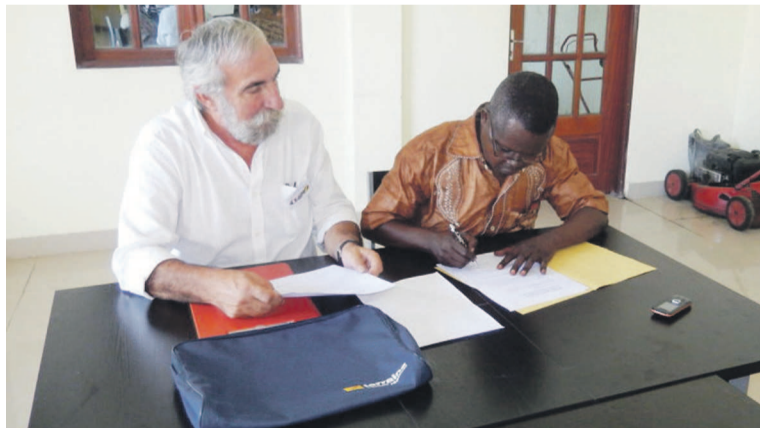
La signature de la convention entre les deux parties

thèque nationale du Congo. Ainsi, l'Association solidarité Congo s'engage à fournir des ouvrages à cette structure. Aussi, s'est-elle engagée à financer le transport de ces ouvrages de Lunéville à Brazzaville. La Bibliothèque nationale du Congo de son côté assurera la bonne gestion de ces