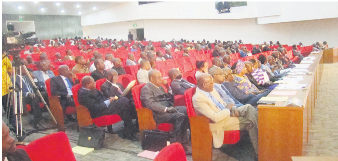
Une vue des sénateurs