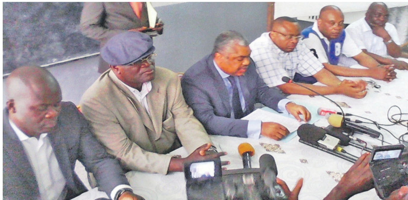
Une réunion des membres de l'opposition parlementaire

À l'approche de la clôture de la session en cours au Parlement, constate l'opposition parlementaire, « le pouvoir sortant se met avec ruse à dérouler des mécaniques de résistance à la possibilité d'alternance politique démocratique par la création des obstacles artificiels au parachèvement du processus de 2011 ». Dans une déclaration signée le 8 décembre, les groupes parlementaires UDPS, MLC et UNC ainsi que leurs alliés ont dénoncé, entre autres, les manœuvres de la majorité visant à tripatouiller le cycle électoral actuel par la subordination des échéances électorales à l'organisation d'un recensement. Ce regroupement politique prône le consensus dans le processus électoral conformément aux standards internationaux. Il s'agit concrètement de parvenir à un accord de tous les protagonistes au processus dans la définition des options fondamentales devant aiguiller l'organisation des élections dans un environnement électoral apaisé.