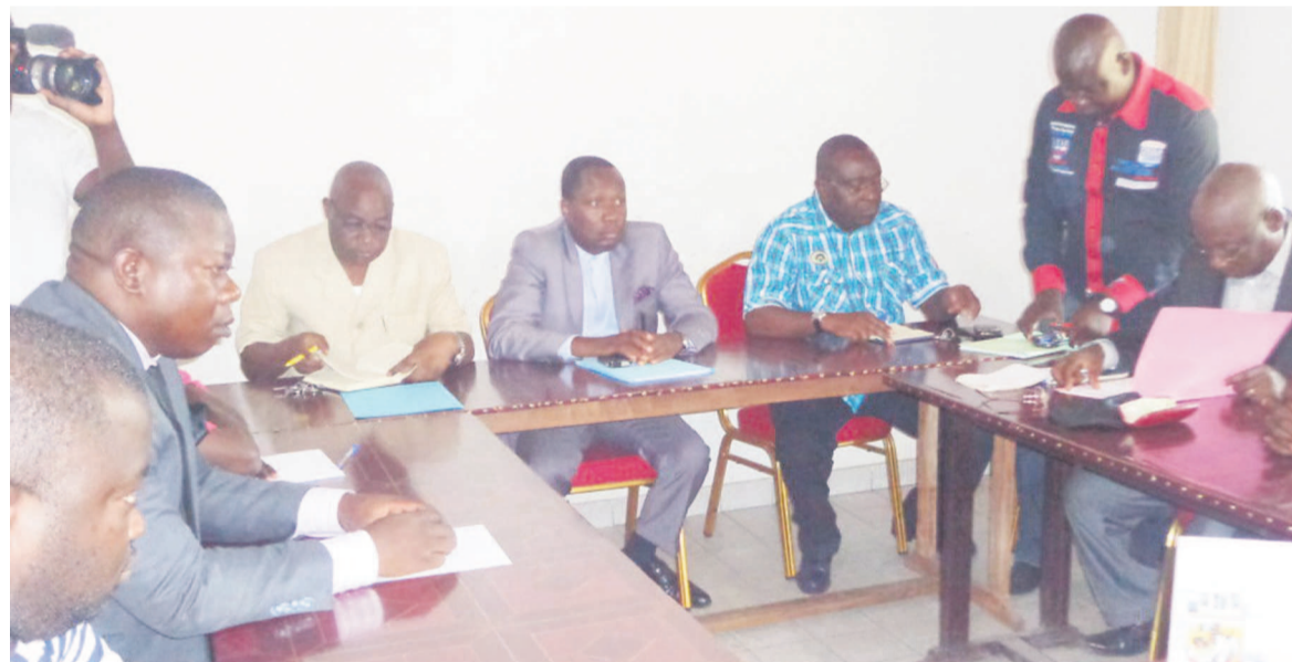
La Fécofoot échangeant avec les secrétaires généraux des clubs

Le démarrage du championnat national édition 2014-2015 annoncée pour le 20 décembre était au cœur des débats le 8 décembre entre les secrétaires généraux des clubs et les responsables de la Fédération congolaise de football.