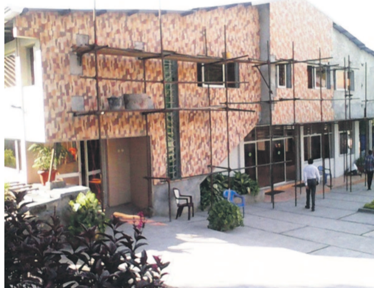
Le temple en cours de construction

L'église a été dédiée de manière simple par le pasteur Barthélemy Masuaku qui a juste fait une prière à genoux devant la chaire face à la grande assemblée des fidèles et des hôtes réunis. La configuration du temple est assez originale. La salle dédiée au culte attenante à la salle de fête occupe le rez-de-chaussée du bâtiment à deux niveaux dont les étages composent les bureaux administratifs. À lui seul, l'édifice couvre le gros de la superficie de la parcelle qui l'abrite soit 1 245 m 2 sur 1 500 m 2 . L'architecte Arnold Ndongala, plus que ravi d'avoir mené à terme la tâche confiée par son pasteur, a estimé le coût global des travaux à 1 250 000 $. Les fidèles du CET ont contribué centime par centime pour l'érection de leur temple. Ils sont fiers d'y être parvenus sans apport extérieur. À Kinshasa, ce ne sont pas les églises qui manquent mais, le plus