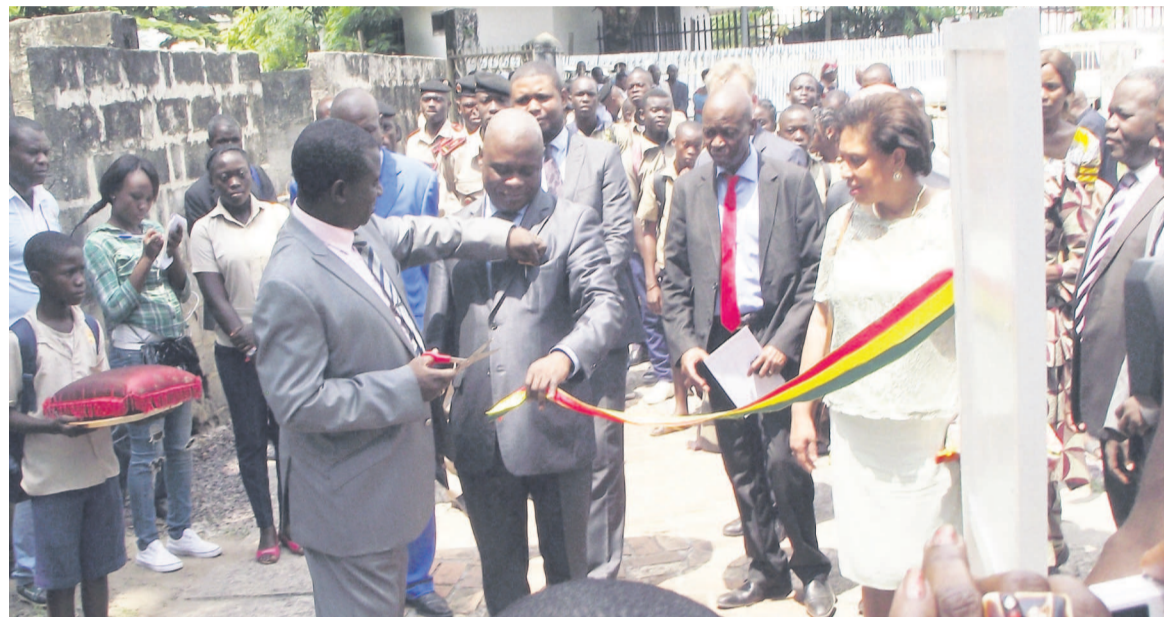
Le directeur de cabinet du ministre de la culture et des arts coupant le ruban symbolique

Ils sont nombreux, les vestiges, les témoins du temps, sur le territoire congolais, du littoral jusqu'aux massifs forestiers de l'extrême nord, en passant par le massif du Chaillu, les savanes des vallées du Niari, du Pool et des Plateaux. Ces témoins du temps qui constituent la plus value que les Congolais ont en partage, consciemment ou tacitement. Ces témoins du temps qui taisent toutes les basses discriminations égoïstes et parfois matérialistes : racisme, ethnocentrisme, sexisme, intégrisme,