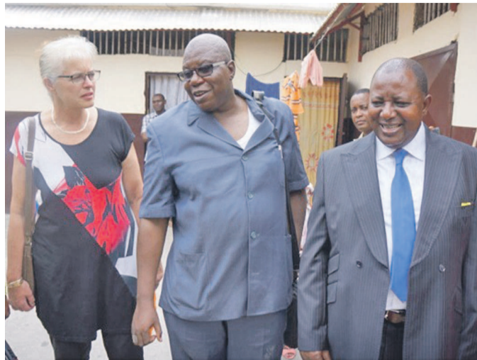
Visite guidée des autorités à la maison d'arrêt de Pointe-Noire

A cette occasion, Paul Morossa, directeur général de l'Administration pénitentiaire du Congo a exprimé, au nom du gouvernement sa gratitude à l'Union européenne, avant d'indiquer qu'il s'agit là de la preuve d'une coopération dynamique entre son pays l'institution occidentale. « La volonté du gouvernement est de moderniser l'espace judiciaire en général et le régime pénitentiaire en particulier. Construire une prison n'est donc pas dénué de signification et de portée politiques ; c'est fournir à une communauté humaine de