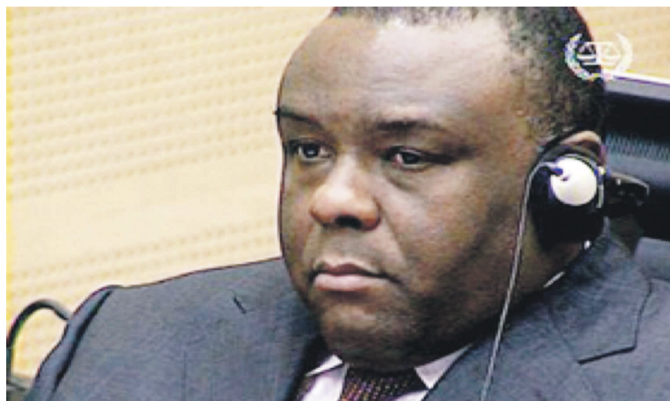
Jean Pierre Bemba

D'après certaines indiscretions, les trois secrétaires généraux signataires de la déclaration les excluant du MLC, qui étaient eux-mêmes candidats ministres, cherchent à régler des comptes à leurs collègues promus juste pour se venger de leur absence de la liste du gouvernement. Page 13