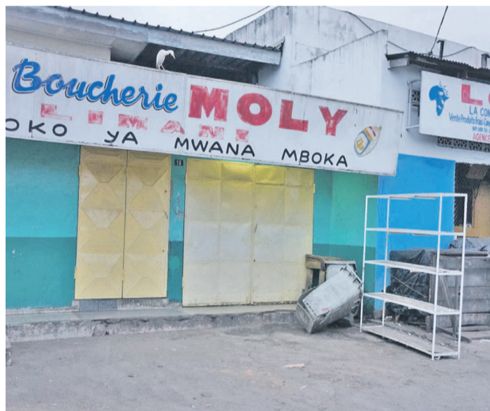
Vue de quelques boucheries temporairement fermées au grand marché de PN

et véreux n'obéissant pas à l'affichage des prix, et qui persistent dans la commercialisation des sacs en plastique et d'autres produits interdits ou dépourvus des dates limites de consommation et de péremption ont été temporairement fermés. Les propriétaires ont été convoqués à la direction départementale de la concurrence et de la répression des fraudes.