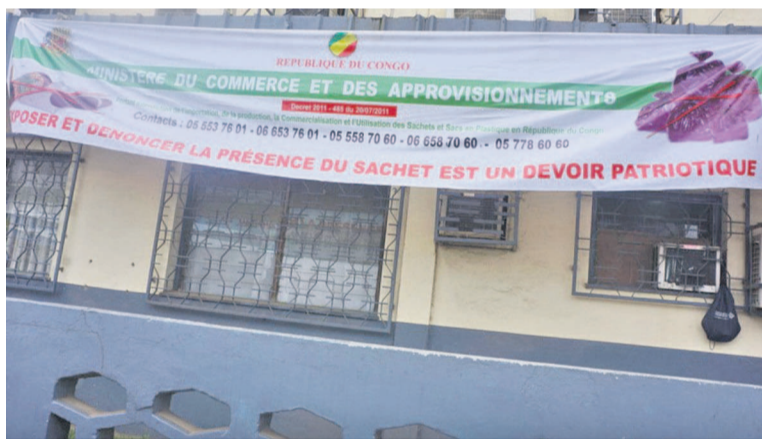
Une banderole à Tchiamba Nzassi interdisant l'usage des sachets

Ainsi, au cours de cette descente, Gaspard Massoukou a rappelé aux commerçants quelques infractions qu'ils pouvaient encourir dans l'exercice de leur profession comme la pratique des prix illicites, l'importation des produits prohibés, la date de péremption, le défaut de factures ou du facturier de vente, les denrées impropres à la consommation, le refus de faire inspecter la marchandise,