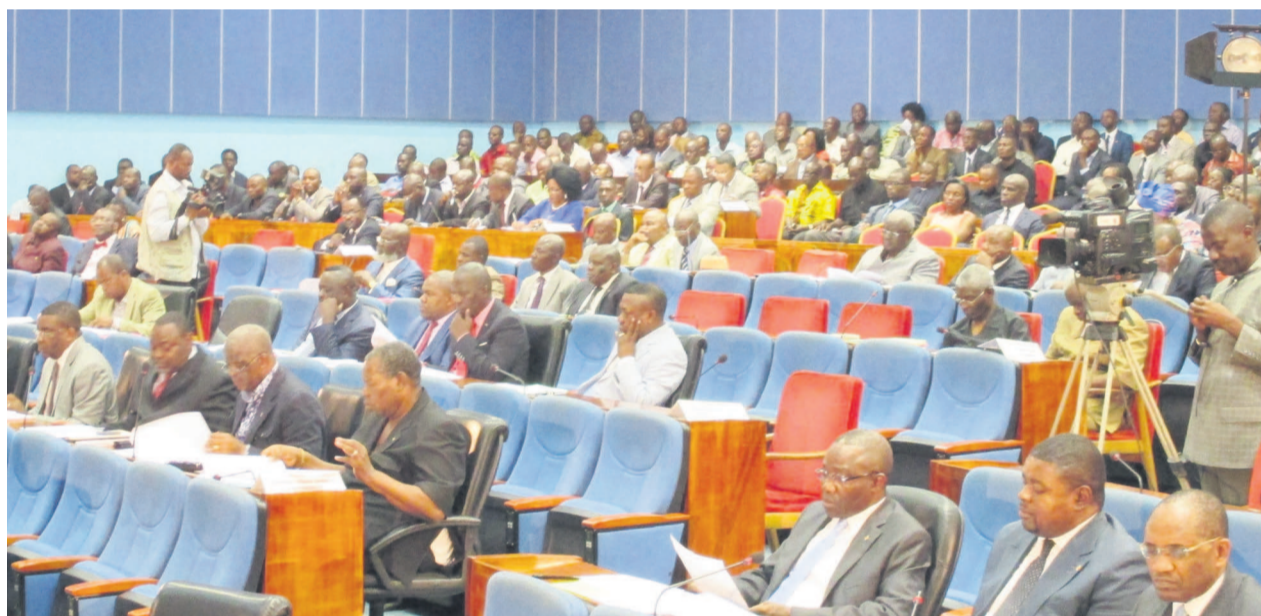
Les députés en plénière avant l'adoption du budget