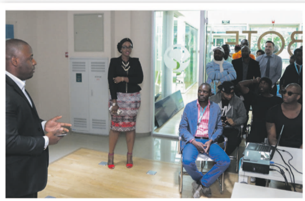
Conférence au siège d'ECAir