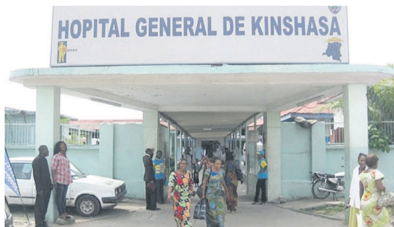
Des médecins bien formés assureront une bonne prise en charge des malades dans les hôpitaux

La famille médicale congolaise vient de s'enrichir avec l'entrée en profession de quatre cent un nouveaux médecins.