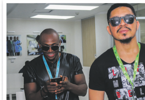
Le groupe Bracket au 3e étage de ECAir House