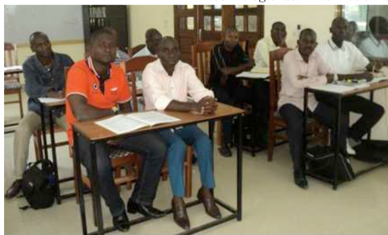
Les étudiants en plein cours

L'Institut théologique et pastoral dénommé « Institut moisson des assemblées de Dieu au Congo », a lancé, depuis le 15 octobre, à Brazzaville une formation de base et de recyclage destinée aux pasteurs des églises au Congo.