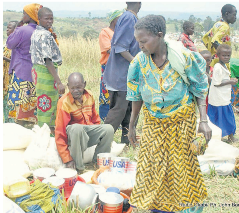
L'assistance humanitaire soulage les souffrances des populations dans les besoins

cursions répétées des groupes armés, plusieurs habitants ont dû abandonner leurs villages pour trouver refuge ailleurs. Des villages entiers ont été même saccagés par des groupes armés qui ont semé la terreur et la panique dans les populations qui dénoncent la montée de l'insécurité. Pour continuer à apporter son assis-