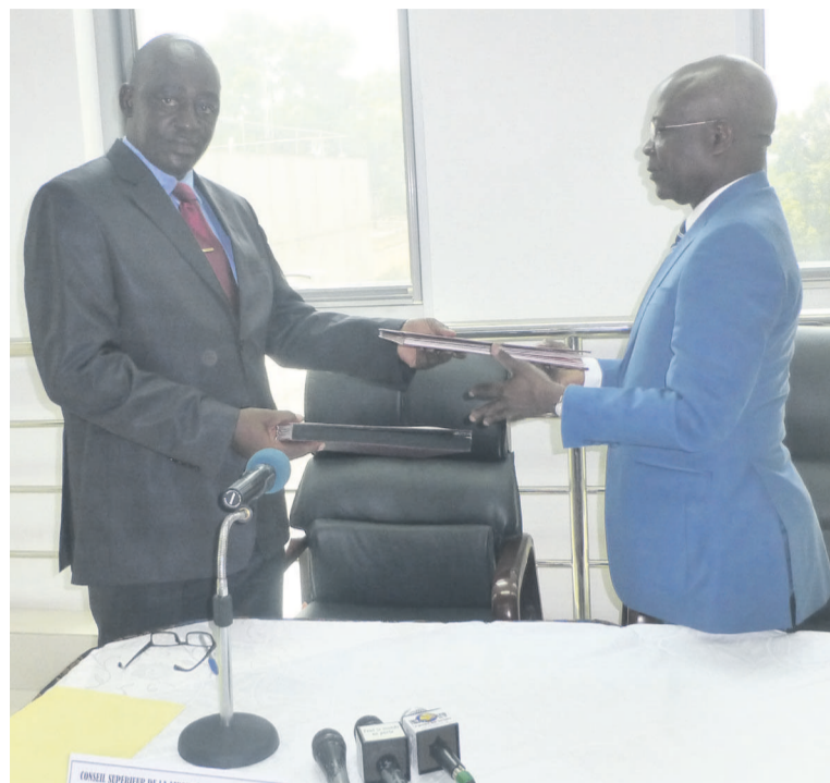
L'échange des parapheurs entre les deux présidents

Ce protocole a pour objet de régir les modalités de coopération entre les deux institutions de régulation. Les deux parties sont tenues au respect de leurs obligations communes et s'engagent notamment à œuvrer dans la cohésion en vue des échanges des informations crédibles indispensables à la veille électorale ; se prémunir des risques contre les dérapages des médias et l'atteinte à l'ordre public ; mettre en place les mécanismes efficaces de pilotage du monitoring des médias en période électorale et non électorale ; mutualiser leurs efforts dans la mobilisation des ressources et des appuis techniques ; faire le plaidoyer en vue de la promotion de la liberté de la presse ; promouvoir la formation tant des hauts conseillers, des personnels des deux conseils que des professionnels de l'information et de la communication de leurs États respectifs ; favoriser la mise en place d'un système d'information, d'éducation et