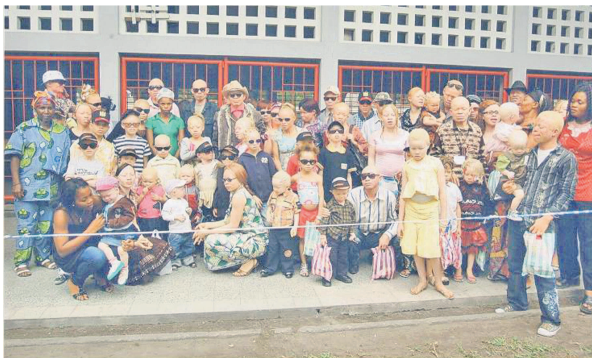
Des albinos, lors d'une journée de sensibilisation par la FMT

Au cours de cette journée, la FMT ne va pas déroger à ses