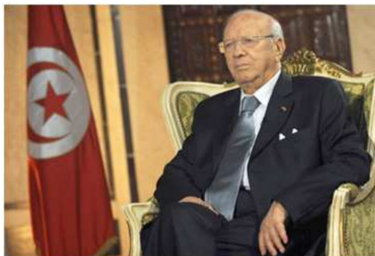
Le président Beji Caïd Essebsi

Le président sortant a félicité le vainqueur de l'élection présidentielle. « Le docteur Moncef Marzouki a félicité tout à l'heure Monsieur Béji Caïd Essebsi pour sa victoire à l'élection présiden-