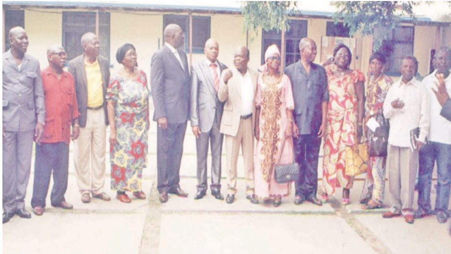
Photo de famille après la réunion

L'AENAM vise entre autres, à développer l'esprit de corps parmi les anciens élèves de l'ENAM par le biais des actions d'entraide ; contribuer à la promotion du caractère impersonnel de l'administration publique congolaise ; veiller sur l'utilisation rationnelle de ses membres et promouvoir la déontologie administrative et la