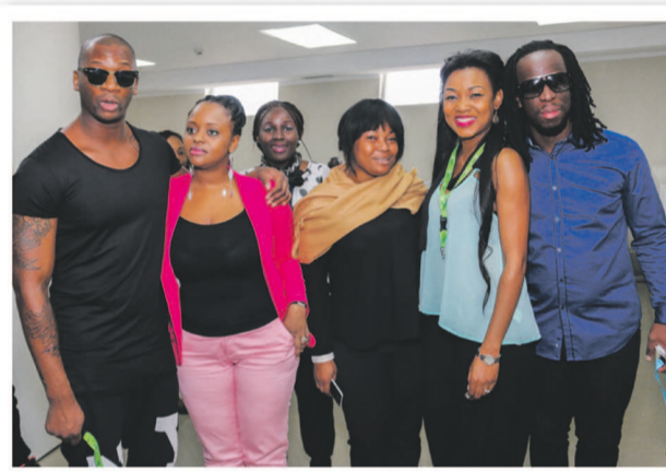
Singuila, Arielle T, Youssoupha, avec des agents d'ECAir