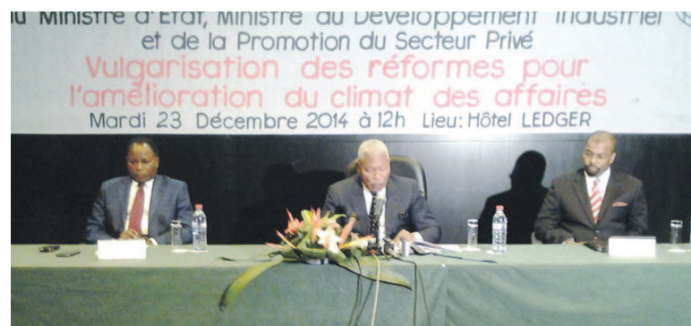
Le ministre Isidore Mvouba, au centre, lors de la conférence de presse

Face aux défis de diversification de l'économie congolaise par le développement du secteur privé, considéré comme le moteur de croissance économique et de création d'emplois, le gouvernement inscrit l'amélioration du climat des affaires parmi ses priorités. Pour ce faire, des réformes à court et moyen termes ont été initiées en vue de faciliter les procédures de création des entreprises et améliorer le rang du Congo dans le