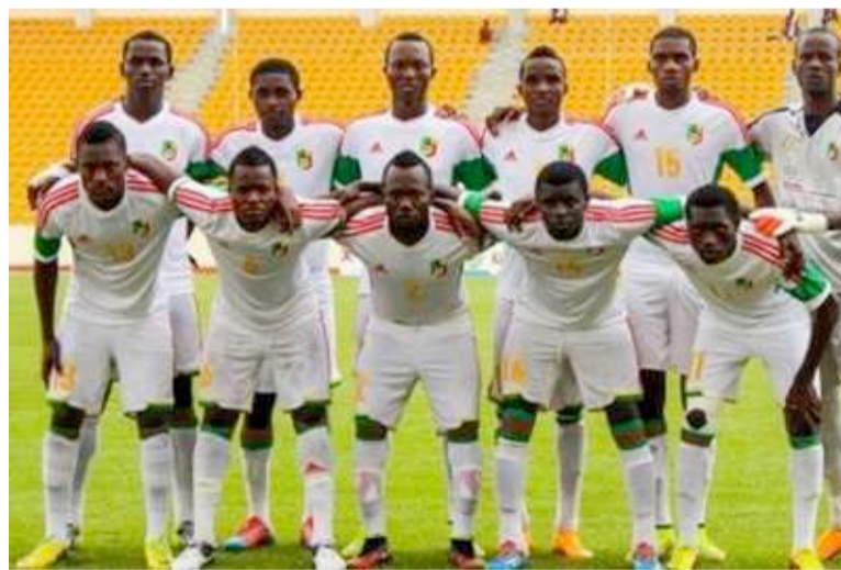
Les Diables rouges juniors

La Côte d'Ivoire, par ailleurs, trois fois finaliste de la compé-