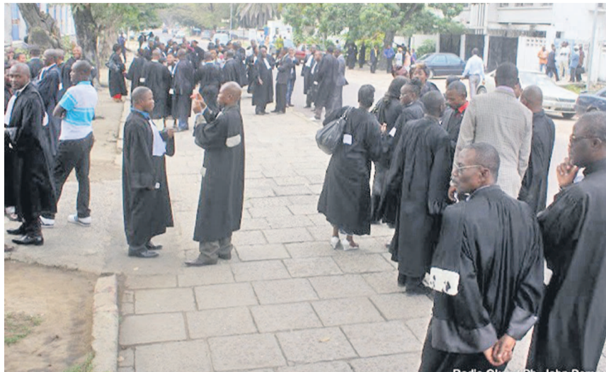
Des magistrats lors d'une manifestation devant la primature

La décision est prise après une rencontre entre leurs différents syndicats et le nouveau ministre en charge du secteur, Alexis Thambwe Mwamba.