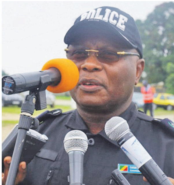
Gaëtan Victor Oborabassi, directeur départemental de la police au Kouilou et à Pointe-Noire

« Il n'existe pas de situation inquiétante qui vient des frontières, le flux migratoire est contrôlé et maîtrisé. La police se préoccupe aussi sur d'autres phénomènes comme les accidents sur la voie publique, les filles et garçons de rue, il est question de continuer à débusquer tous les bandes armées, les délinquants et autres