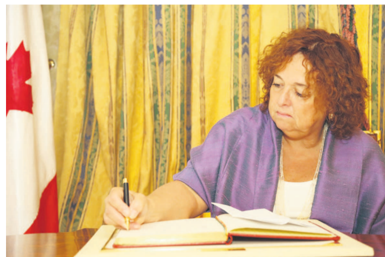
L'ambassadrice du Canada, Ginette Martin

entre les deux pays est régie par l'accord de coopération commerciale signé le 25 septembre 1974 à Brazzaville. Cette coopération concerne