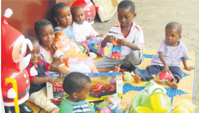
Les enfants recevant les jouets