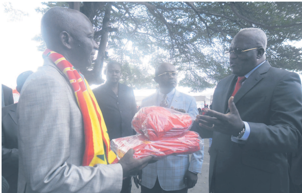
Le ministre des Sports donnant les consignes de campagne

Le ministre des Sports a quant à lui, expliqué que la campagne de soutien qui n'est pas la première du genre vise, entre autres, à pousser les Diabes rouges à donner le meilleur d'eux-mêmes pour des performances