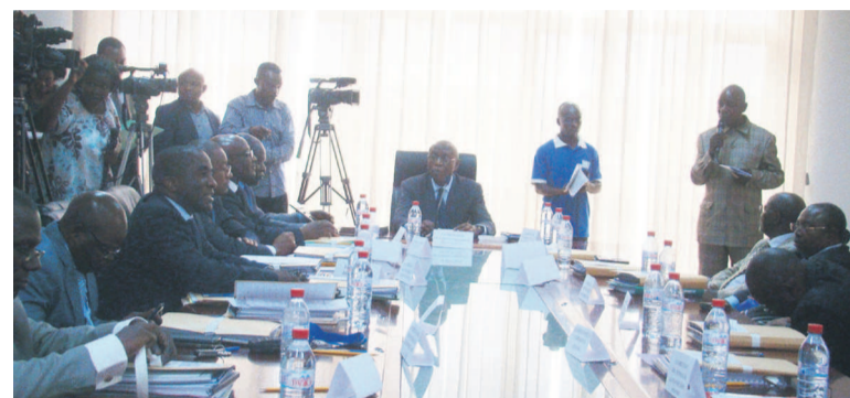
Les membres du comité de direction de l'ANAC

L'Agence nationale de l'aviation civile (ANAC) se fixe plusieurs objectifs pour 2015, avec un budget en hausse de 3%, par rapport à 2014 (9, 827 milliards FCFA).