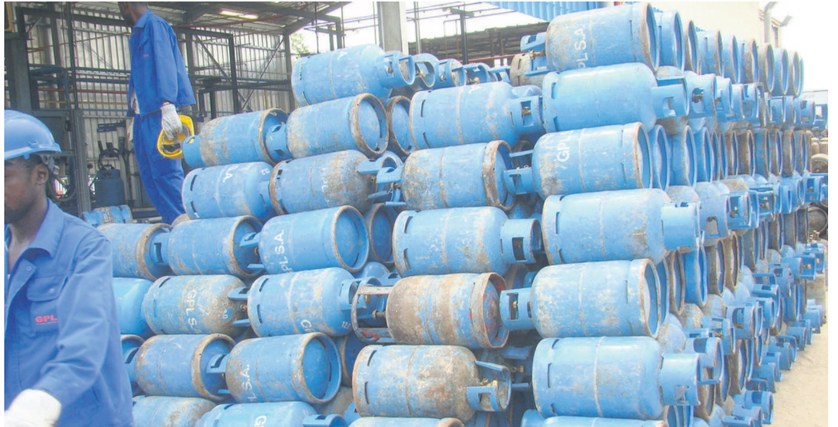
Du gaz prêt à commercialiser au sein de la société GPL.sa

En ce qui concerne la protection contre incendies, il est construit une réserve d'eau assez importante, de 650 m 3 /heure, contre 250 m 3 /heure laissé par hydro-Congo.