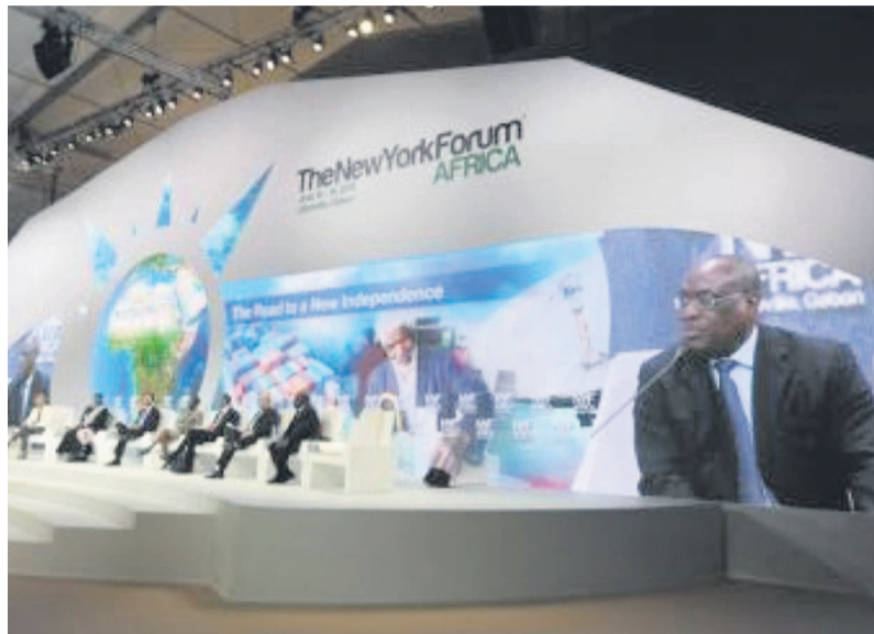
Vue d'une précédente édition

significatif y présenteront leur projet. Le forum, apprend-on, accueillera également la seconde édition de l'African Citizen Summit qui portera sur la création d'emploi et l'entre-