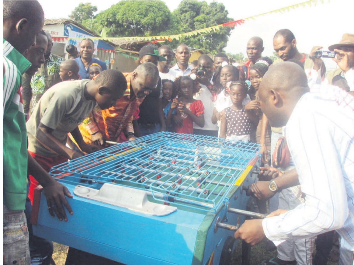
Le ministre Collinet jouant au jeu de baby au centre de Mfilou

« Les enfants y viennent nombreux, nous sommes ici depuis le 20 décembre et le Parc fermera ses portes le 5 janvier. C'est gratuit pour tous les enfants de Brazzaville, il suffit que l'enfant réponde aux poids exigés. Nous avons aussi mis à disposition