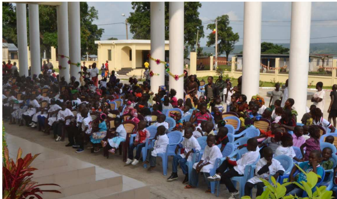
Une vue des enfants de Ngabé attendant leurs jouets