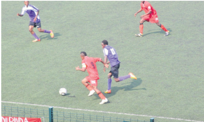
L'extrait d'une rencontre de football au complexe sportif de Pointe-Noire

À la sortie de l'assemblée générale élective de la Fécofoot en octobre dernier à Owando, Jean Michel Mbono, président de la Fécofoot avait décidé d'arrêter les championnats nationaux de ligue 1 et 2. Au moment de cette mesure, combien même quelques matches s'étaient joués en ligue 2, la Jeunesse sportive de Poto-Poto (JSP)