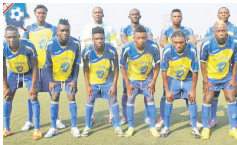
FC Saint-Eloi Lupopo

Dans le groupe A, l'on note la victoire du FC Saint-Eloi Lupopo, le 24 décembre au stade Frédéric-Kibassa-Maliba de Lubumbashi, sur Lubumbashi Sport par deux buts à un, en match