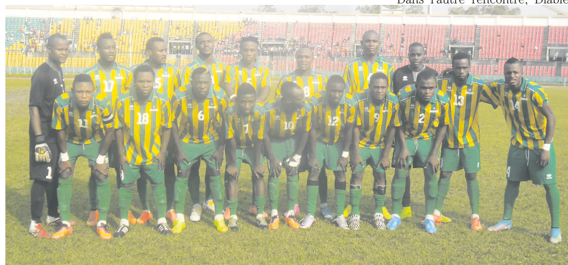
L'équipe de l'Etoile du Congo Adiac

Les stelliens sont venus à bout de Saint Michel de Ouenze (SMO) 4 à 1 comme pour se consoler de son déboire face à Tongo FC 1-3 lors de la deuxième journée.