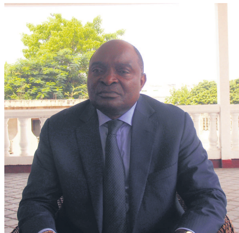
L'ambassadeur Félix Ngoma

Deux ans après l'ouverture de la représentation diplomatique congolaise à New Delhi en Inde, la coopération entre les deux pays porte déjà ses fruits. Deux lignes de crédits estimés à plus de 159 millions de dollars américains sont, en effet, déjà octroyées au Congo.