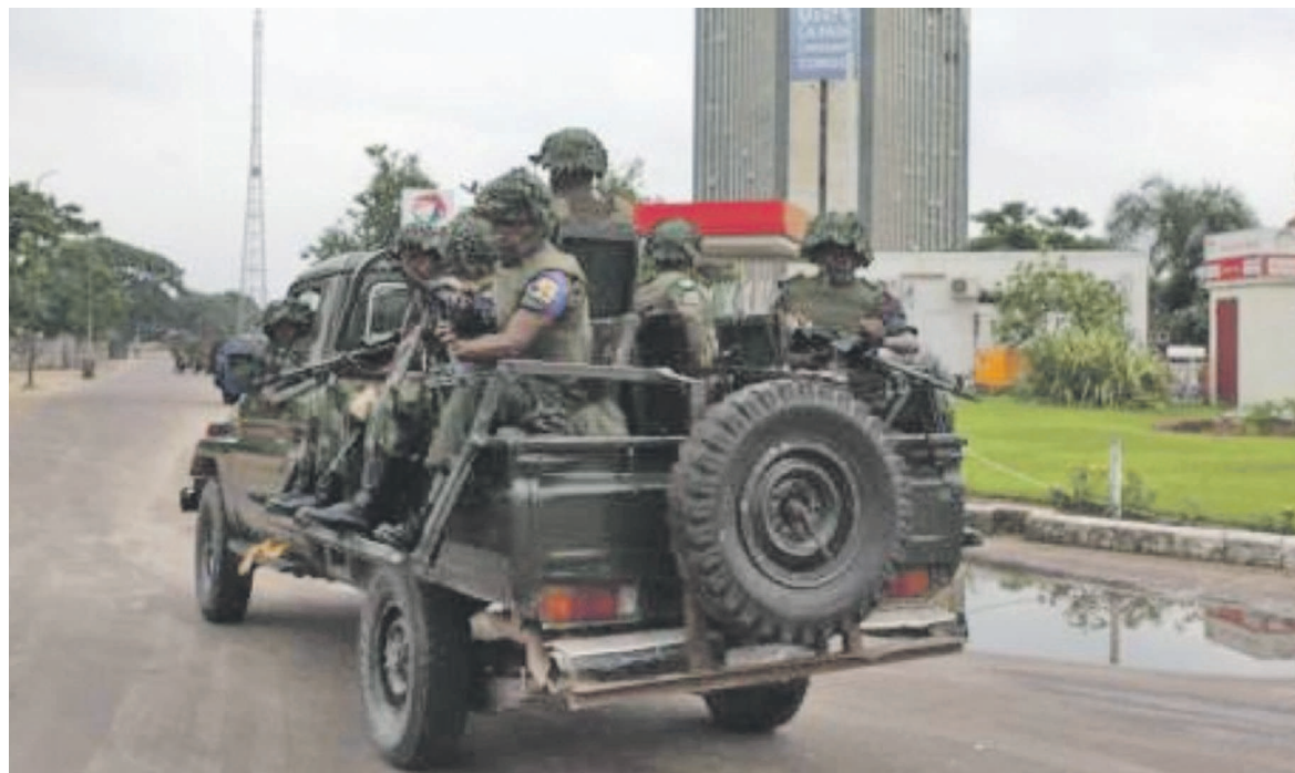
Une patrouille de la garde républicaine sillonnant la ville

Un scénario qui a eu un effet d'entraînement dans d'autres sites universitaires et académiques tels que l'UPN, l'Ista/Ndolo, l'ISC,