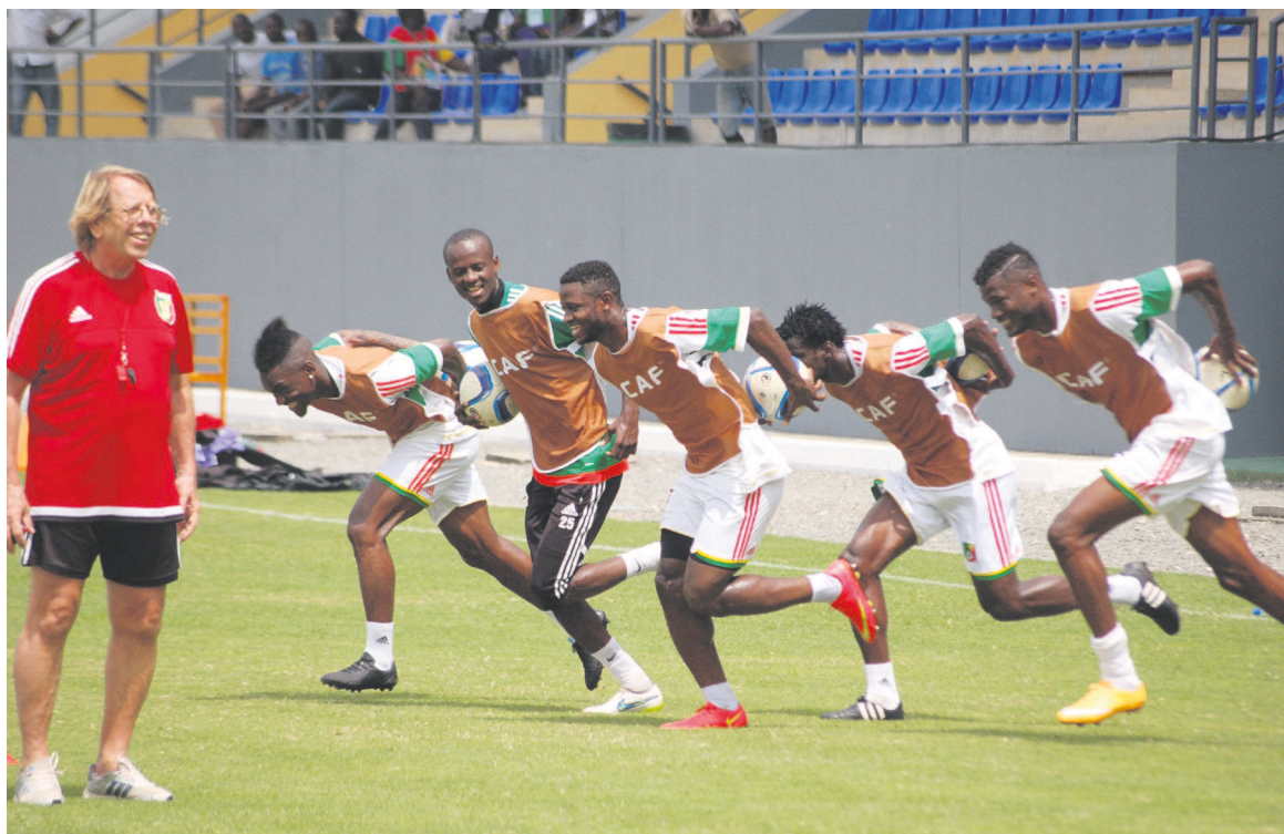
Les Diables rouges ce matin à l'entraînement

L'entraînement de ce lundi était le plus important parce qu'il devra permettre aux joueurs d'être au meilleur niveau le 21 janvier contre le Gabon. Les Diables rouges ont effectué une séance d'endurance intensive marquée par un échauffement de vingt minutes consacré à la technique individuelle et collective avec le ballon. Ils ont travaillé notam-