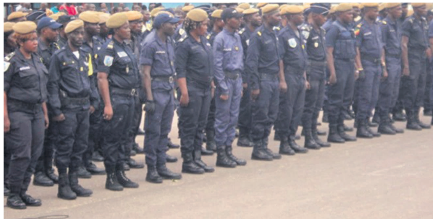
Les policiers suivant les instructions de la hiérarchie

La vraie question, c'est celle de la porosité des frontières et de la dis-