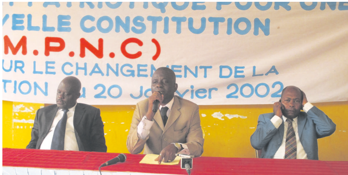
Le bureau du MPNC

Cette dynamique a aussi énuméré quelques faiblesses, notamment sur la délimitation de l'âge, qui constitue une mesure discriminatoire à l'endroit des jeunes ; la longue durée du mandat présidentiel fixé à sept ans qui n'est pas de nature à favoriser l'alternance démocratique ; et la considération des étrangers au même titre que les nationaux donnent lieu à des