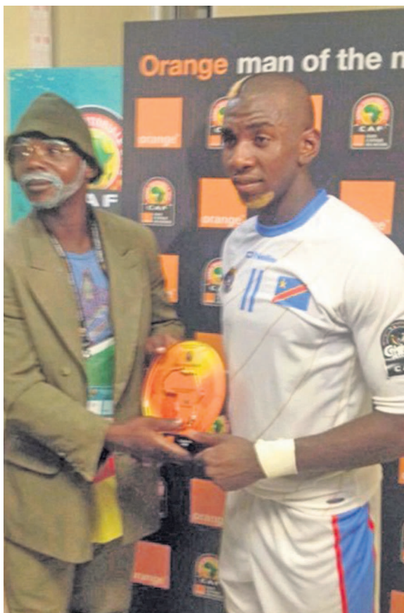
Yannick Bolasie élu homme du match entre la RDC et la Zambie

Les Léopards de la RDC ont disputé, le 18 janvier, à Ebibeyin en Guinée Équatoriale, leur première rencontre du groupe B de la phase finale de la 30e Coupe d'Afrique des Nations. Le score d'un but partout contre les Chipolopolo de la Zambie n'a visiblement pas été satisfaisant pour les sportifs congolais.