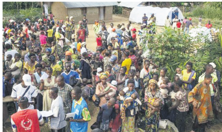
Enregistrement des déplacés dans un camp

Les démunis sont répartis dans la quasi-totalité des provinces du pays.