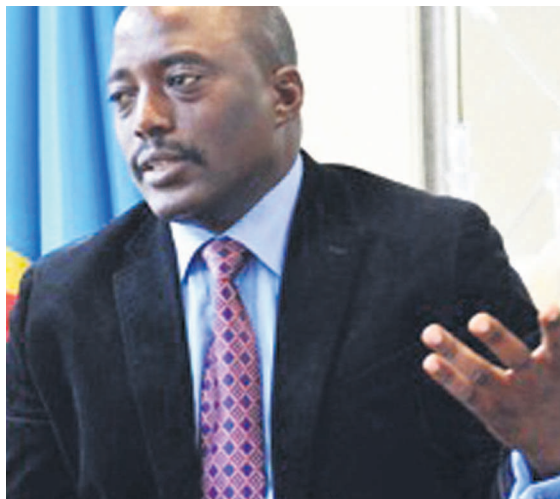
Le chef de l'État, Joseph Kabila Kabange

Avec la publication récente du calendrier électoral fixant la présidentielle et les législatives au 27 novembre 2016, le compte à rebours a véritablement commencé pour Joseph Kabila. Pour ses partisans, l'heure est plutôt au repositionnement par rapport à cette échéance qui se rapproche à grande enjambée avec sa cohorte d'incertitudes par rapport aux lendemains de plus en plus incertains.