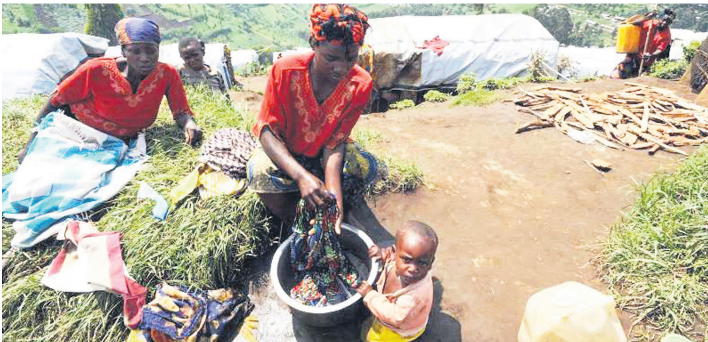
Les déplacés vivent dans le dénuement le plus total

Les dernières analyses du Cadre intégré de classification de la sécurité alimentaire pour le premier semestre 2015, relayées par le Bureau de l'ONU pour la coordination de l'aide humanitaire (Ocha), ont révélé qu'en RDC, environ 6,5 millions de personnes sont en crise alimentaire et des moyens d'existence aigüés et ont besoin d'une assistance. Les démunis sont répartis dans la quasi-totalité des provinces du pays. Le nombre total de cette catégorie des personnes a baissé de près de 7% par rapport au second semestre de 2014 tandis que celles en situation d'urgence a augmenté de plus de cinq cent mille.