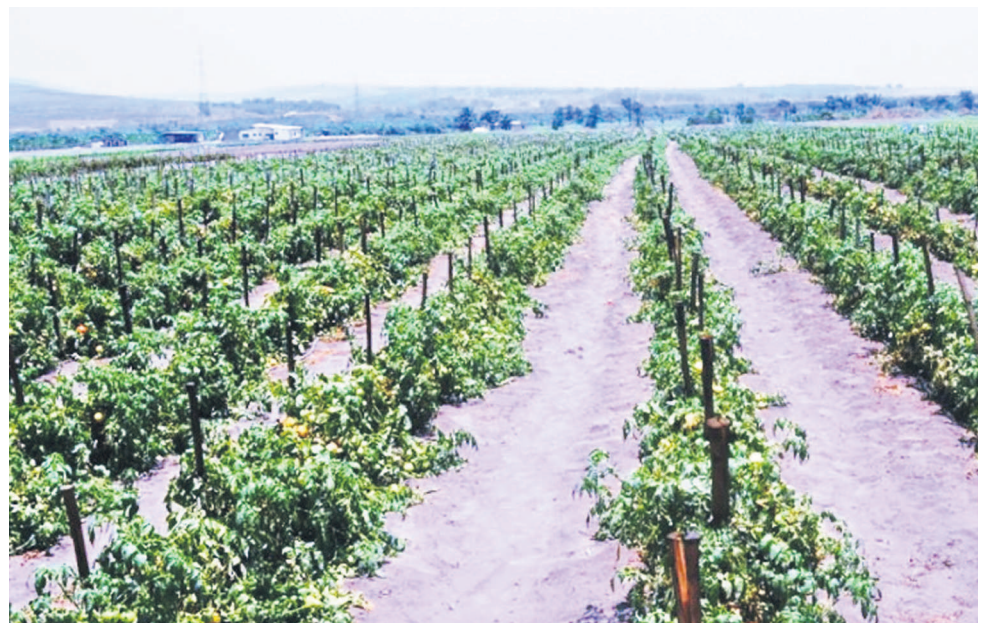
L'autosuffisance alimentaire fait partie des priorités du gouvernement