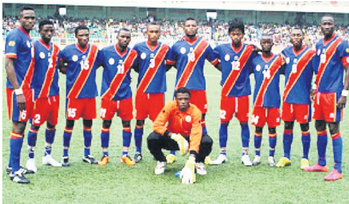
Léopards de moins de 23 ans (photo d'archives)