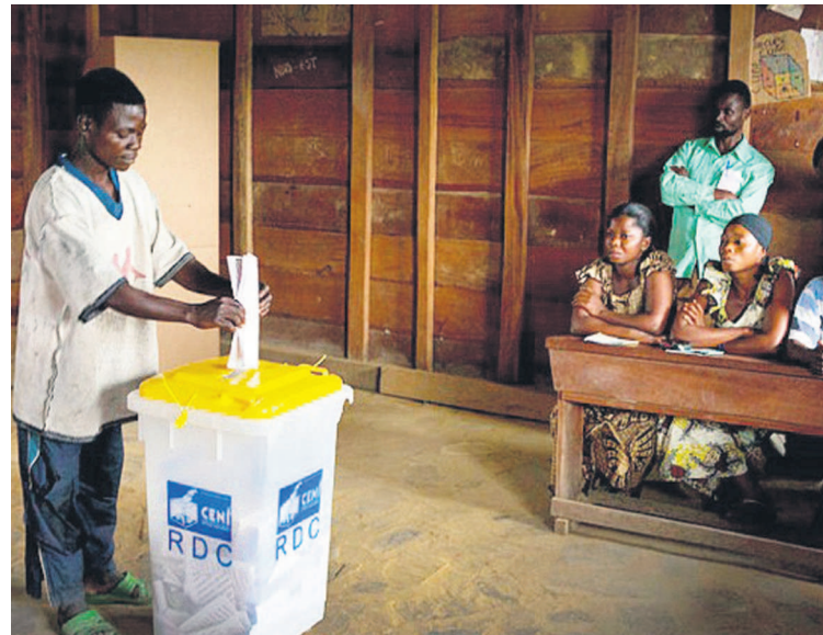
Un électeur introduisant son bulletin de vote dans l'urne à Walikale en novembre 2011

septembre au 23 octobre 2015 et celle des candidats conseillers communaux et des secteurs/chefferies, du 9 au 23 octobre 2015. Le jour de vote est le même, le 25 octobre 2015, pour les députés provinciaux