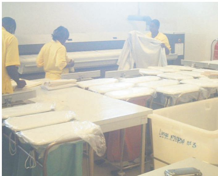
Une vue des agents de la buanderie

Pour montrer l'importance du sujet de la formation, la directrice de l'hôpital général Adolphe-Sicé a mis à la disposition des séminaristes des statistiques édifiantes relevées en Europe sur la question. « Le Centre européen pour la prévention