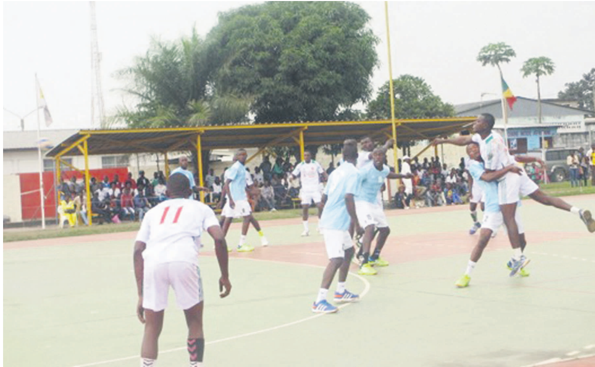
Un extrait du match de handball au stade Enrico Mattéi

C'est ainsi que les équipes qui ont bien entamé leur compétition veulent s'affirmer tandis