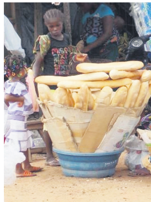
Vendeur de pain ambulancier

En effet, dans cette ville, le pain est vendu partout et généralement sans emballage, dans les différents marchés de la place, aux abords de trottoirs, dans les rues et avenues des quartiers, ce qui l'expose à la poussière et aux microbes. À cela s'ajoute sa manipulation à chaque fois qu'une personne veut s'en acheter. « Le pain se vend n'importe où et même par n'importe qui dans des conditions peu hygiéniques, il est donc indispensable que soit mise en place une équipe de services d'hygiène qui aura