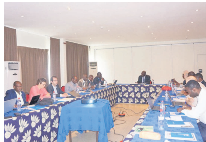
Les participants à la réunion

taires sur seize attendus (cf.annexe 3) ont pris part à ces travaux. On cite : le secrétaire exécutif adjoint de la COMIFAC, le directeur des forêts du Cameroun, le représentant de la République du Congo, le représentant de la RCA, le représentant de l'ATIBT, le directeur régional CIFOR, le président du comité de pilotage régional de la conférence des forêts denses et humides d'Afrique centrale (CEFDHAC), les représentants des sociétés forestières du Congo (IFO et CIB-Olam), les bureaux de certification (Rainforest Alliance et Bureau Véritas), la cellule de gestion du PPECF.