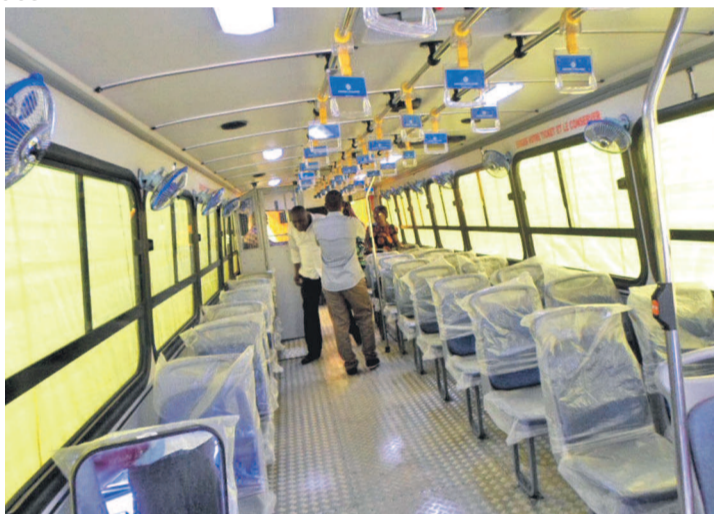
Une vue de l'intérieur d'un bus

d'offres concernant le recrutement d'un bureau d'étude a été lancé par l'AFD. De même, en collaboration avec la même agence et la direction générale des grands travaux, les services municipaux sont à pied d'œuvre pour la finalisation des termes de référence de l'étude de faisabilité et la réflexion sur l'intégration d'une composante. « Cet accroisse-