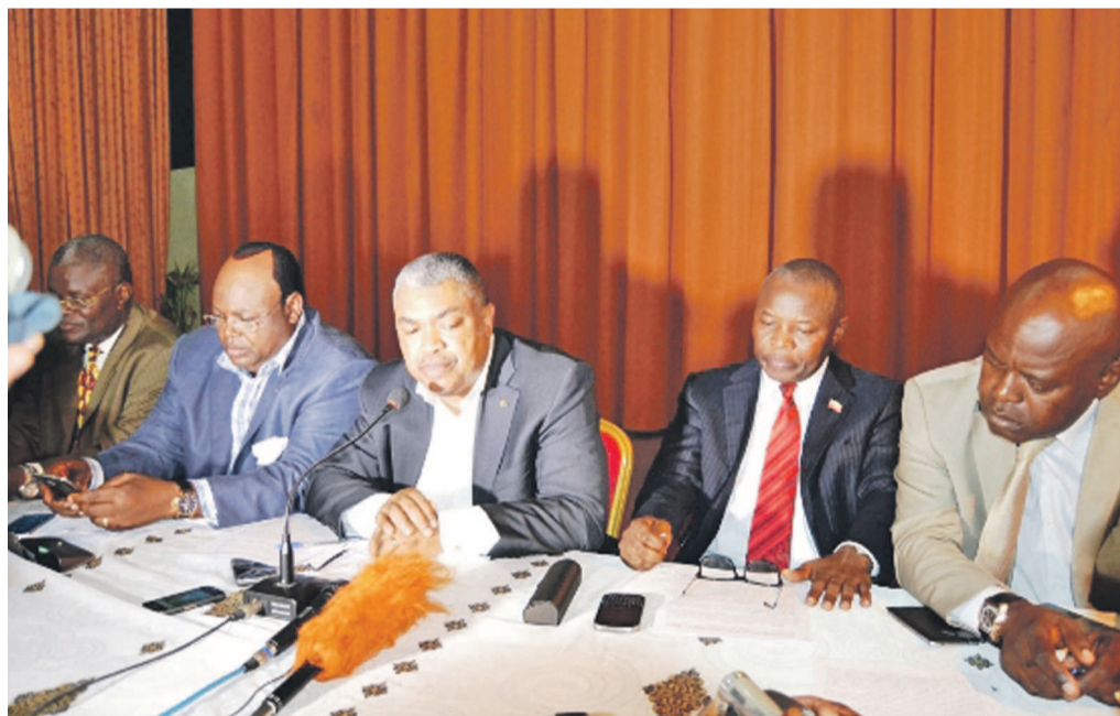
Quelques leaders de l'opposition congolaise

qui représentera l'opposition entière à la course pour la magistrature suprême dans la perspective d'un tour unique. D'où l'enjeu des échanges cette semaine avec l'administration Obama qui, d'après des sources, voudrait voir l'opposition tirer les enseignements de 2011 en resserrant les rangs autour d'un candidat unique afin de maximiser ses chances de parvenir à l'alternance tant souhaitée. Page 21