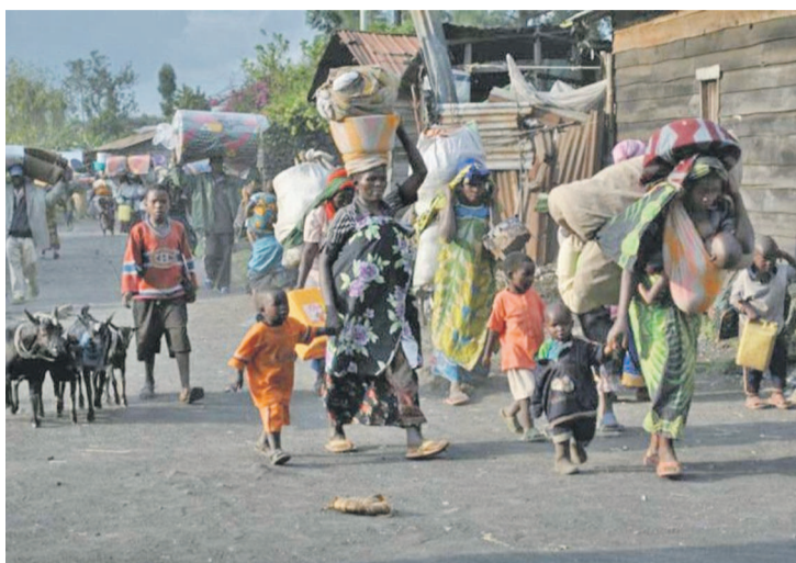
Des déplacés dans l'est de la RDC

De la Province Orientale au Katanga, ces personnes forment, selon le Bureau de l'ONU pour la coordination de l'aide humanitaire (Ocha), une poudrière humanitaire depuis plus de dix ans.