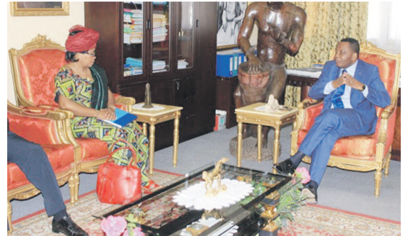
Le ministre de la culture et des arts s'entretenant avec la princesse Marie Mpanguélé Nguempio

« Comme vous savez très bien, le lancement des préparatifs de la dixième édition du Fespam aura lieu à Mbé ; je suis venue m'enquérir des modalités de la tenue de cet événement », a-t-elle indiqué à sa sortie d'audience, avant de prédire une totale réussite de cette soirée. Cette année, Mbé va donc être à l'honneur parce que la République du Congo est dans une démarche d'inscription de ses sites historiques, dont la cité royale de Mbé sous la liste du patrimoine mondial