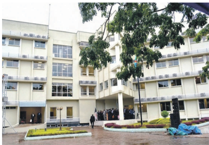
Le nouveau Palais de justice

L'édifice abritera notamment la Cour constitutionnelle, le Conseil d'État et la Haute cour militaire.