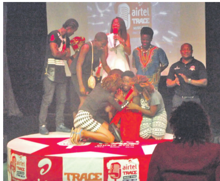
La joie de l'artiste entouré de ses parents après son sacre

Si en sus de son voyage au Kenya pour la finale de Trace Africa, la gagnante a bénéficié d'un chèque de 2.000.000 FCFA, un passeport rouge, Airtel Trace plus l'enregistrement d'un album avec la mega star Singuila aux Etats-Unis. Les quatre autres candidats finalistes ont reçus des téléphones nou-