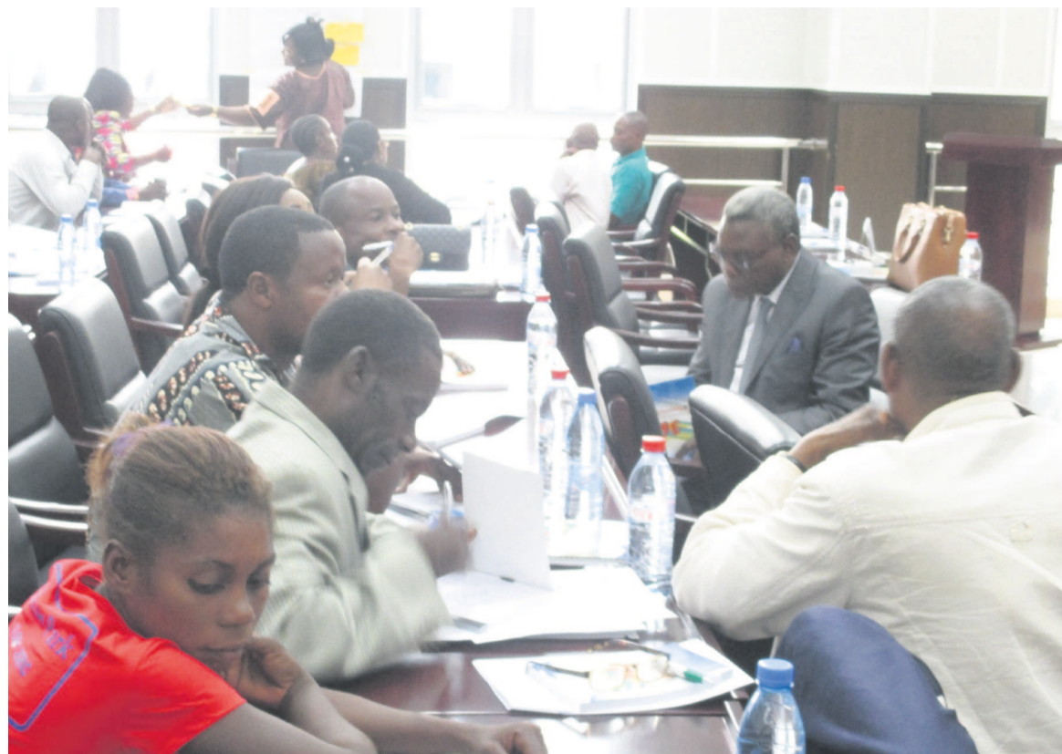
Une vue des participants au cours de l'atelier

« Il est frappant de constater à quel point l'exploitation des ressources naturelles s'accompagne souvent d'un net recul des droits de l'Homme. Les lieux d'implantation de certaines entreprises deviennent parfois des sites sur lesquels prospèrent non seulement les richesses, mais aussi les violations des droits fondamentaux. Le progrès économique devient, paradoxalement, un facteur de régression des droits de l'Homme en raison des incidences néfastes qu'il engendre. Le premier de ces effets est incontestablement l'exploitation de la classe ouvrière », a déclaré le directeur général des Droits humains, Philippe Ongania. Pour lui, « Les effets les plus néfastes de l'exploitation des ressources naturelles sur l'environnement ne sont