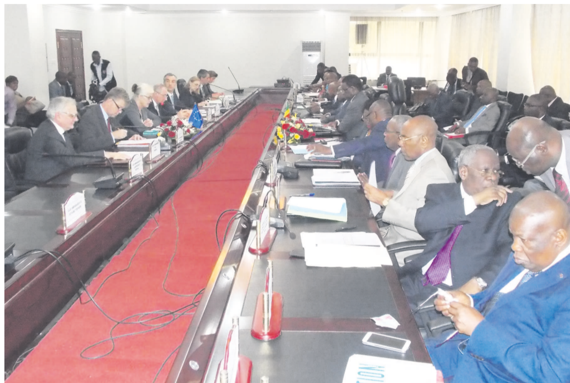
Une vue partielle des deux délégations

l'UE européenne ont par ailleurs examiné la situation en Centrafrique à la lumière des