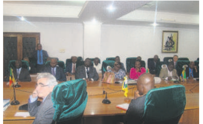
La séance de travail

L'atelier qui s'est déroulé dans la salle de réunion du ministère des Affaires étrangères, du 16 au 19 février, avait pour objet de familiariser les participants avec les concepts clés de la MLC de l'OIT, 2006, et de souligner les avantages de la ratification.