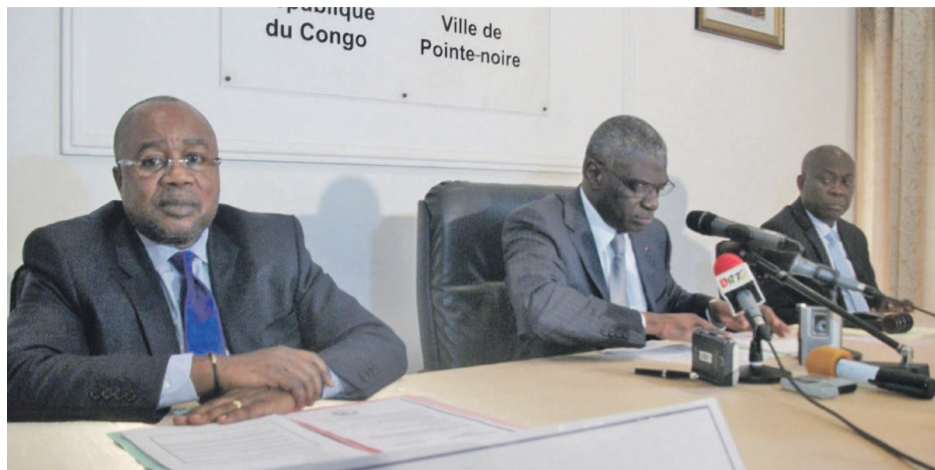
Le maire entouré des deux vice-maires

Légère augmentation du budget 2015 S'agissant du point sur le budget du Conseil exercice 2015, socle de cette session, le maire a souligné que celui-ci a été élaboré dans un contexte national dominé par la chute vertigineuse du prix du baril de pétrole. « Cette situation s'est traduite depuis juillet 2014 par une diminution significative des recettes de l'État, une contraction des dépenses de ce dernier, et une baisse tendancielle des dotations d'investissement et de fonctionnement aux collectivités locales », a notamment