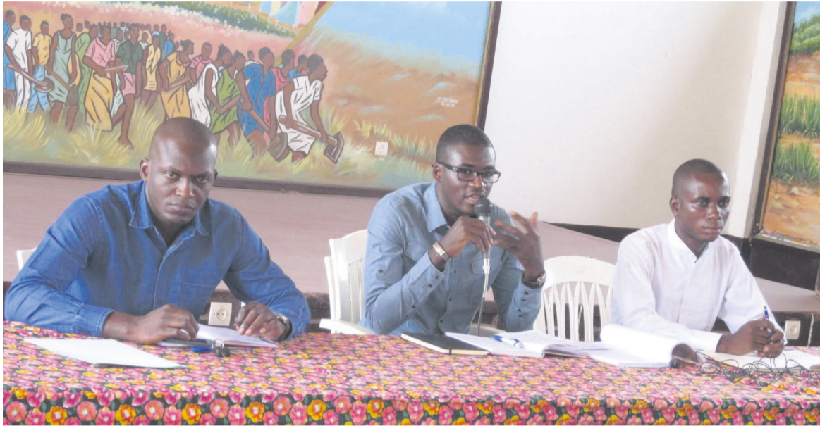
La direction nationale de la FMC en face des responsables des comités

dans les sphères politiques. « Actuellement il y a plusieurs sujets en débat sur la place publique, Parmi lesquels on peut citer le débat