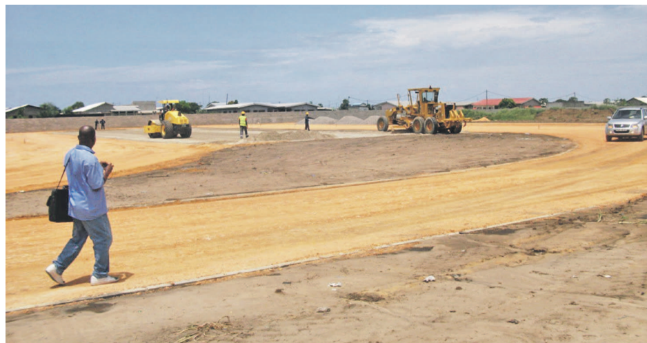
Le site de la société de transport

Rappelons que cette session se tient deux mois après la session extraordinaire consacrée à l'adoption du budget primitif de l'année 2014.