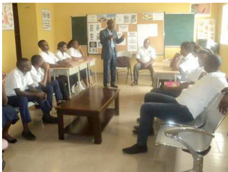
Les discussions sur le VIH

À l'occasion de la Semaine de sensibilisation éducative organisée du 16 au 18 février, par l'Institut Saint-François d'Assise, en partenariat avec le Conseil national de lutte contre le Sida (CNLS), les élèves du secondaire de cet établissement ont été sensibilisés sur le VIH/Sida et les maladies sexuellement transmissibles.