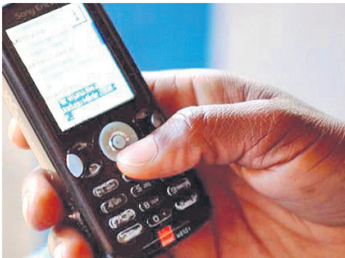
Les opérateurs de la téléphonie mobile aux abois