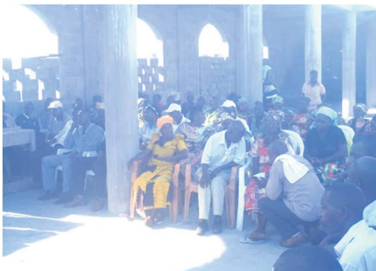
La population pendant la mise en place des comités communautaires de ciblage

Après le lancement du Projet Lisungi, le 16 février au siège de la mairie du 2e arrondissement Mvou Mvou à Pointe-Noire, les 11 comités communautaires de ciblage sont désormais en place dans les 11 quartiers de Mvou Mvou. Ceci, à l'issue des assemblées générales organisées du 17 au 19 février à Pointe-Noire.