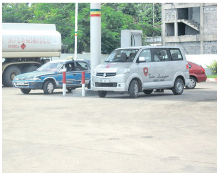
Une station-service après le phénomène de pénurie

Le sourire est enfin revenu sur les lèvres des automobilistes ponténégrins qui pendant près d'un mois ont eu du mal à se ravitailler en carburant dans les différentes stations-services.