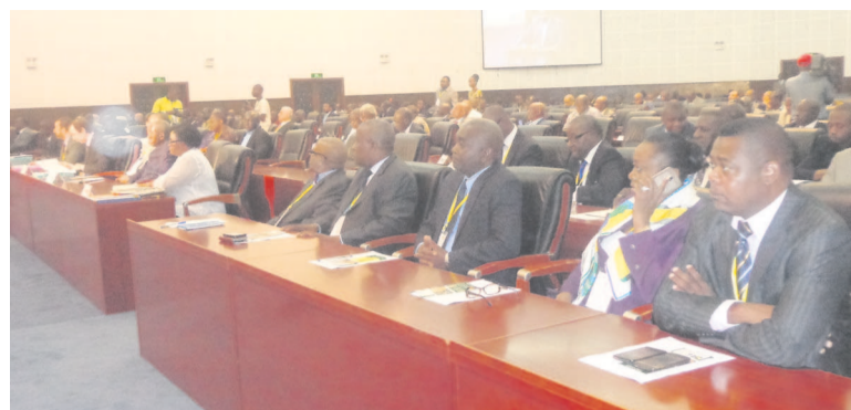
Vue des participants

La visite des infrastructures sportives qui s'effectuera ce mercredi donnera à coup sûr l'occasion aux chefs de mission d'apprécier à leur juste valeur, la qualité des installations sportives de la compétition et d'entraînement ainsi que les sites d'hébergement que le Congo mettra à la disposition de la jeunesse africaine du 4 au 19 septembre prochain.