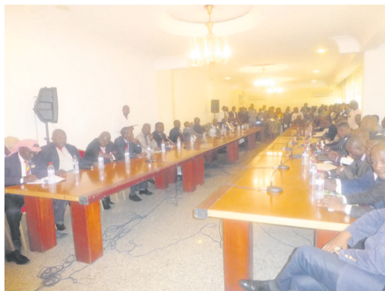
Une vue des signataires

ment, poursuit le document, devra s'atteler à mettre en œuvre, dans l'apaisement, les réformes politiques devant conduire à la tenue des futures élections présidentielles. Les signataires de ce document ont, en outre, sollicité la mise en place au préalable d'une Commission préparatoire chargée de déterminer le contenu, l'ordre du jour et le déroulement