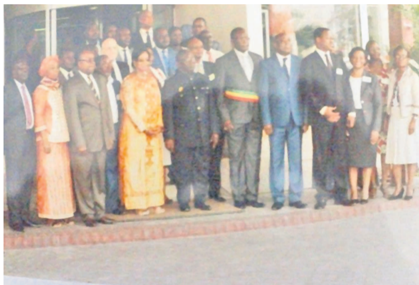
La photo de famille à l'ouverture de l'atelier

Cet atelier qui vise le renforcement des capacités en vue de l'amélioration de la qualité des soins offerts dans les formations sanitaires aux mères, nouveau-nés et aux enfants s'est ouvert lundi 23 février en présence d'Alexandre Honoré Paka et de Fatoumata Binta Diallo, respectivement préfet de Pointe-Noire et représentante de l'OMS en République du Congo.