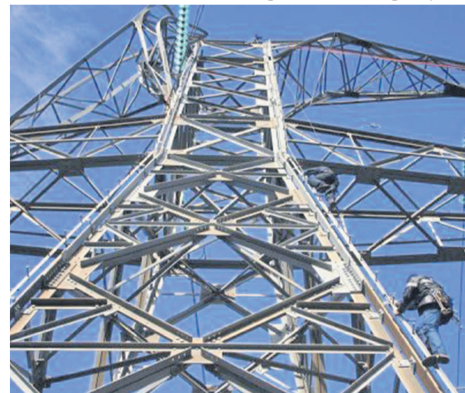
Un courant de mauvaise qualité

Dans certains quartiers mal pourvus, la lumière émise par des ampoules électriques est comparable à celle émanant d'une bougie. C'est d'ailleurs le cas du quartier 120 Mpaka, non