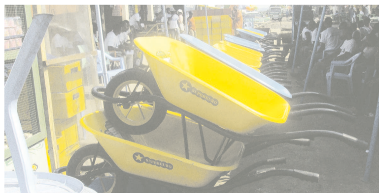
Une vue du matériel aratoire

En effet, cette association s'est fixé comme objectif principal, le curage des caniveaux ainsi que le nettoyage des ruelles et des avenues, moyennant une somme d'argent dont le montant