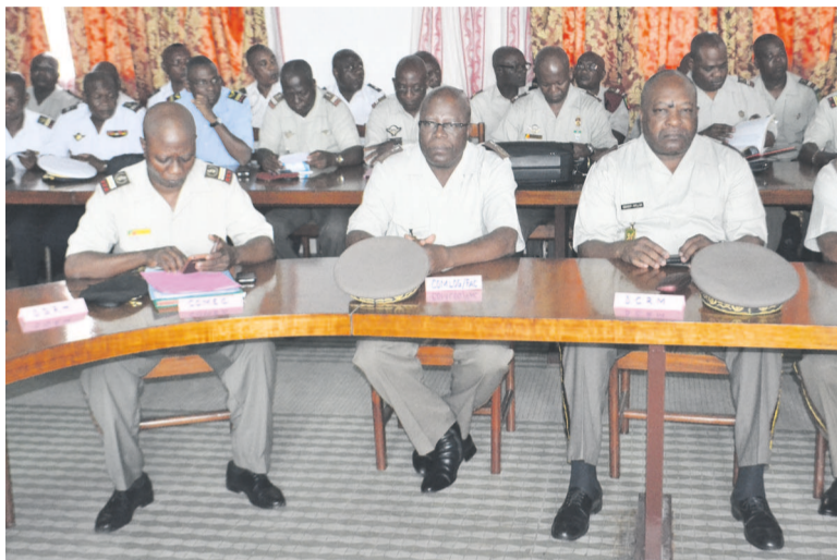
Une vue des officiers supérieurs des FAC

dans la fonction contrôle et compte rendu. Les enseignements seront dispensés par des cadres maison expérimentés des FAC, dotés d'outils pé-