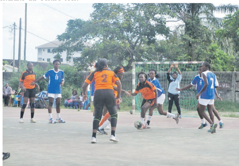
Un extrait du match Patronage/Banko «adiac»

Chez les dames en effet, pas de chance pour Banko qui a lourdement courbé l'échine face à Patronage, 16-46 et permet ainsi aux tenantes du titre de gagner leurs premiers points du championnat à l'issue de la troisième journée. Dans cette catégorie, les Cheminots dames sont en tête. Elles joueront leur dernier match de la phase-aller le 1 er mars face à Tié-Tié Sport. Un match très déterminant pour les cheminotes hostiles à la défaite. Elles sont d'ailleurs en préparation, question d'éviter toute surprise négative.