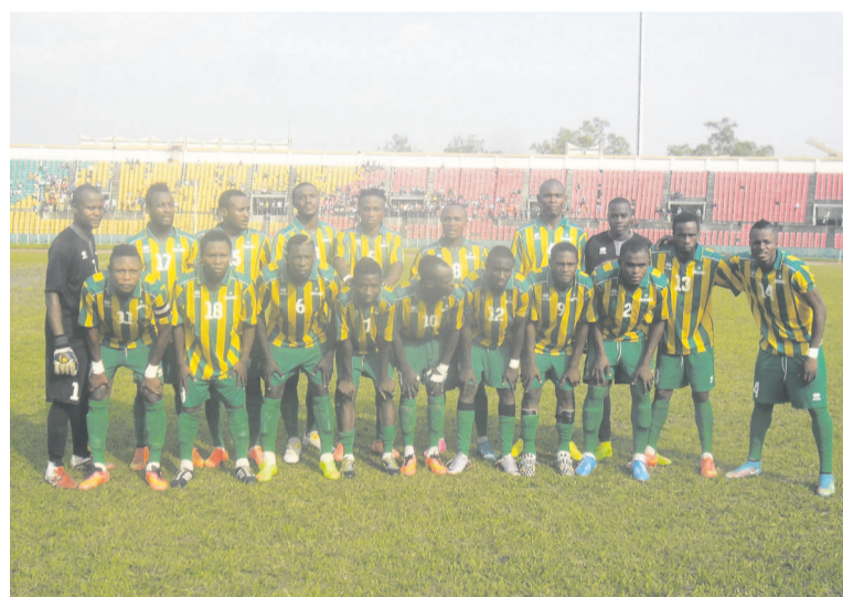
Les joueurs de l'Étoile du Congo

Le calendrier ne pouvait qu'être modifié étant donné les matchs retour des compétitions africaines des clubs