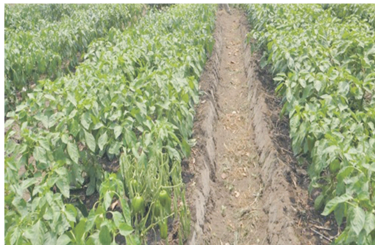
Une vue d'un champ dans une école

Saint Jean-Baptiste de Mvou-Mvou qui a souhaité la pérennisation de cette belle initiative agricole dans son établissement. D'ailleurs, pour manifester leur adhésion à cette action, les enseignants de cette école ont planté sur une surface de près de 400m 2 l'oseille de Guinée. Pour les élèves, le projet Champ-école