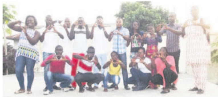
Les jeunes artistes à la fin d'une répétition théâtre sa vraie mesure, qui est la démesure; le verbe lui-même doit être tendu jusqu'à ses limites ultimes... », Eugène Ionesco, dramaturge et théoricien du théâtre, se situe bien dans cette perception du théâtre comme espace de matérialisation des angoisses et, partant, d'apprivoisement de la réalité sociale et humaine.

C'est l'oreille attentive de Madame Ana Elisa Susana Afonso, représentante de l'Unesco au Congo, qui permet finalement ce manuscrit, ayant accompli le parcours du combattant, de sortir de l'ombre au moyen d'un partenariat entre la Représentation de