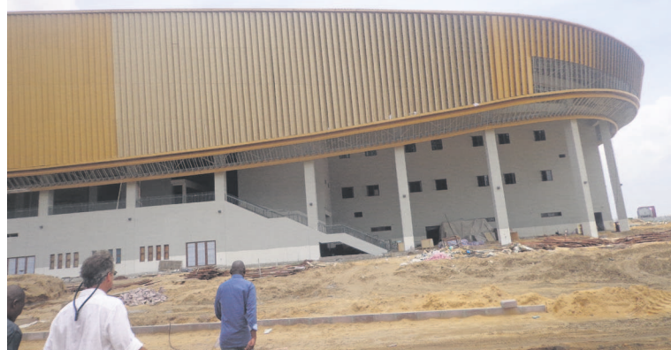
La façade latérale du stade

pour sa jeunesse. Ce que nous avons vu ici fera progresser le sport congolais. Vous allez