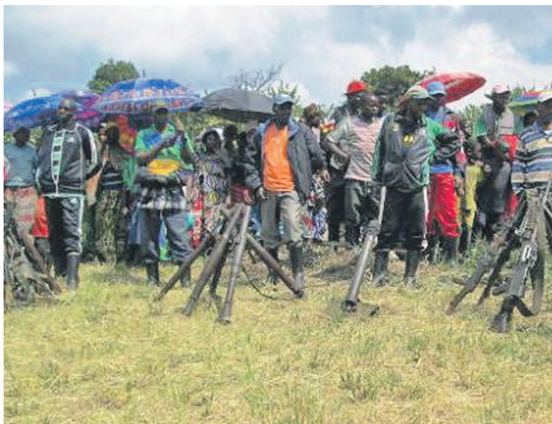
Des rebelles hutus rwandais

Ce bon comportement des Fardc au front a lieu au moment où des voix s'élèvent dont celles du vice-Premier ministre belge chargé de la Coopération et du Développement, Alexandre De Croo, et de son collègue des Affaires étrangères, Didier Reynders, pour contraindre Kinshasa à admettre de nouveau l'appui de la Monusco dans la traque contre les FDLR dans l'Est du pays