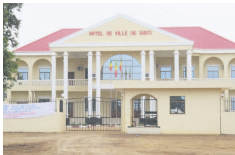
L'hôtel de ville de Sibiti/Adiac

Excepté des attentes sur la construction d'édifices promis, tels que le marché moderne, les écoles et bien d'autres, à Sibiti la municipalisation fait