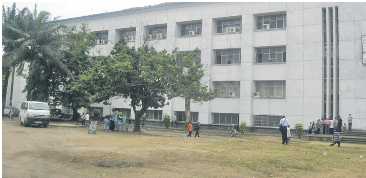
Une vue du bâtiment de la Fonction publique

Avec un personnel pléthorique toujours difficile à maîtriser et, à la clé, la corruption ainsi que la gabegie qui l'ont toujours caractérisée, l'administration publique ne joue véritablement pas son rôle de centre d'impulsion de la croissance économique et du développement du pays. Ce triste constat, Olivier Kamitatu l'a fait à l'occasion de l'ouverture de la troisième session de l'atelier de vulgarisation du Code de conduite de l'agent public de l'État. Pour le ministre du Plan, il est temps que le gouvernement puisse requalifier ce secteur d'activités et en faire un élément attractif pour des investisseurs publics et privés.