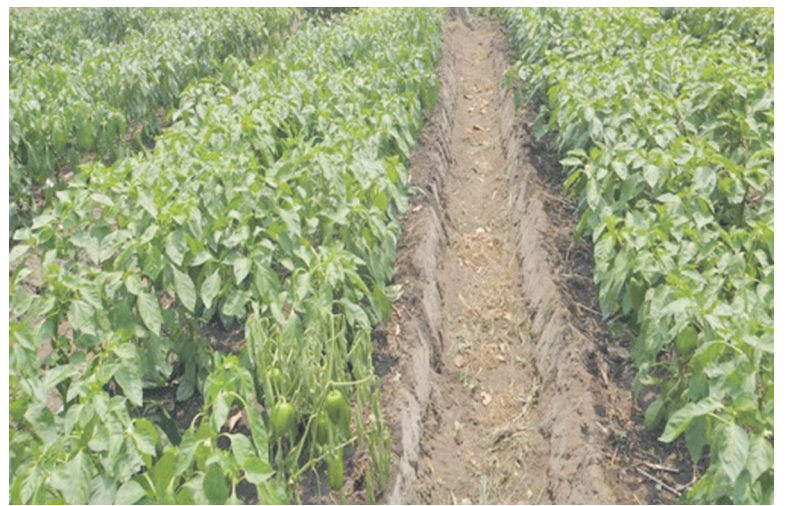
Une vue d'un champ dans une école

Saint Jean-Baptiste de Mvou-Mvou qui a souhaité la pérennisation de cette belle initiative agricole dans son établissement. D'ailleurs, pour manifester leur adhésion à cette action, les enseignants de cette école ont planté sur une surface de près de 400m2 l'oseille de Guinée. Pour les élèves, le projet Champ-école