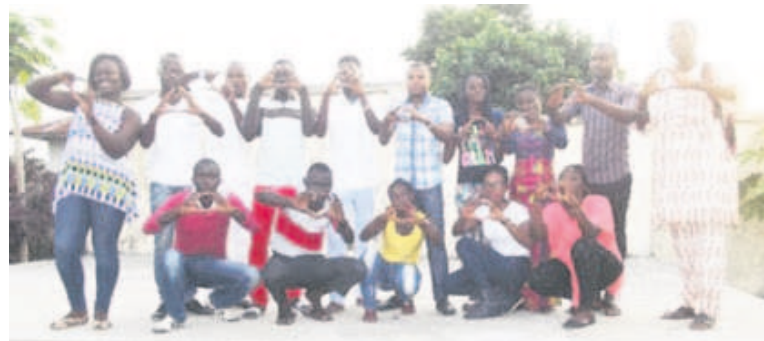
Les jeunes artistes à la fin d'une répétition théâtre sa vraie mesure, qui est la démesure; le verbe lui-même doit être tendu jusqu'à ses limites ultimes... », Eugène Ionesco, dramaturge et théoricien du théâtre, se situe bien dans cette perception du théâtre comme espace de matérialisation des angoisses et, partant, d'apprivoisement de la réalité sociale et humaine.