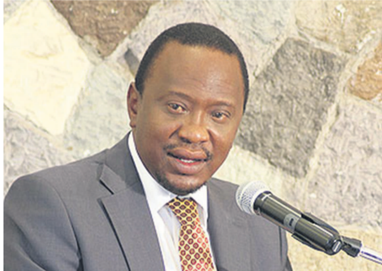
Le président Uhuru Kenyatta