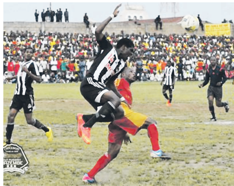
Instantanée du match entre Sanga Balende et Mazembe le 8 mars

Les Corbeaux se sont procuré plus d'occasions de but que les locaux. Mais au finish, ils ne rentrent à Lubumbashi qu'avec le point du match nul. « C'est un bon score. Mes joueurs ont fait