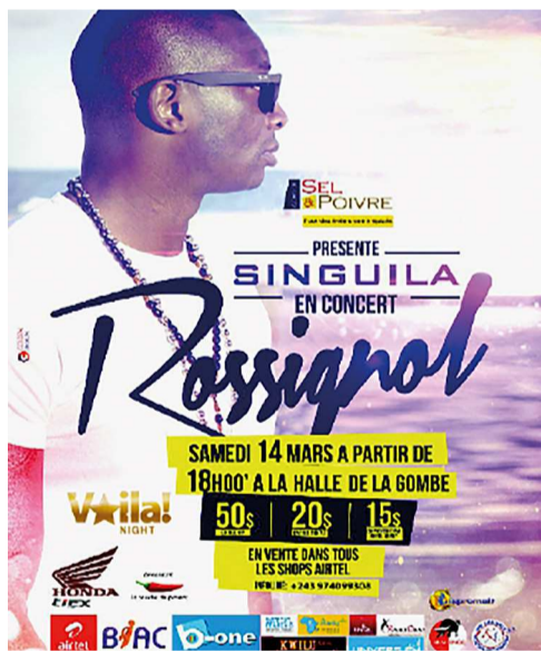
L'affiche du concert Rossignol à la Halle de la Gombe

En effet, ce ne serait pas trop dire que d'affirmer qu'il sera l'évènement musical du mois qui accompagne le mois de mars de cette année. Ce sera assurément un double hommage rendu tout à la fois à la femme congolaise et à la langue française.