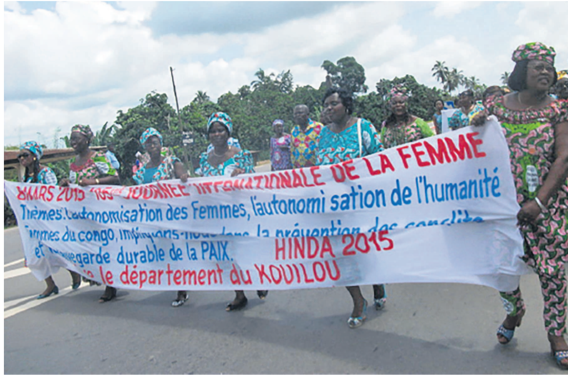
Une vue des femmes pendant la marche «adiac»

« Nous les femmes du Kouilou avons écouté le message de la nation sur notre autonomisation mais, nous avons besoin du matériel moderne pour développer nos champs. Nous travaillons encore avec des outils traditionnels, la houe et la machette, ce qui n'est pas normal. Nous voulons des tracteurs et autres matériels nécessaires pour l'agriculture. Nous avons aussi un vrai problème, celui des routes. Quitter les villages où nous résidons pour Hinda,