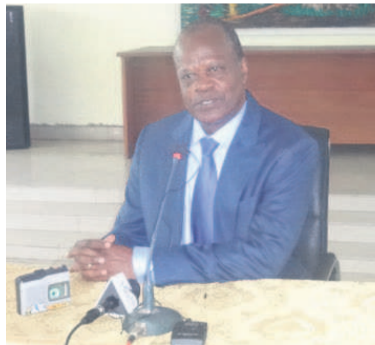
Le ministre Henri Djombo

S'agissant de la conférence, celle-ci se déroulera dans un format de quatre jours. Deux jours avec les experts qui plancheront sur les documents de base qui s'y trouveront dans les kits des conférenciers. Le premier jour sera consacré aux exposés où se déroulera la problématique de l'exploitation illégale et le commerce illicite. Le deuxième jour est réservé aux travaux en panel donnant l'occasion aux experts de travailler sur les deux documents phare : la stratégie et le plan d'action.