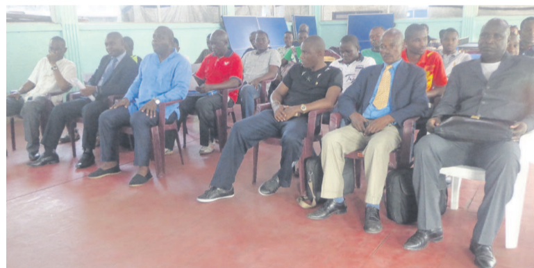
Une vue des stagiaires

L'organisation de ce stage d'entraîneurs de niveau 1, répond en effet à la vision des dirigeants de la FCTT, lesquels veulent gagner