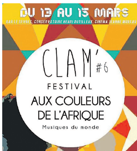
L'affiche de la sixième édition du Clam' Festival

La chanteuse-guitariste kinoise se produira, le 13 mars, à 20 heures, dans le sud de Paris en duo avec le saxophoniste français Jean-Remy Guédon pour le compte de la sixième édition qui entend célébrer l'Afrique de l'Ouest.