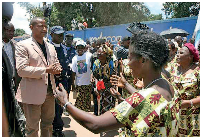
Moïse Katumbi ovationné par ses partisans