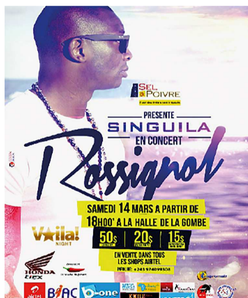
L'affiche du concert Rossignol à la Halle de la Gombe

En effet, ce ne serait pas trop dire que d'affirmer qu'il sera l'évènement musical du mois qui accompagne le mois de mars de cette année. Ce sera assurément un double hommage rendu tout à la fois à la femme congolaise et à la langue française.