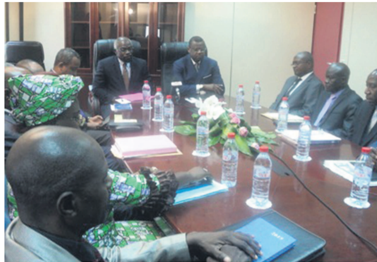
Les officiels peu avant la signature