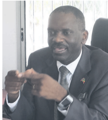
L'ambassadeur de Namibie

En témoignent aussi les visites effectuées au plus haut niveau dans