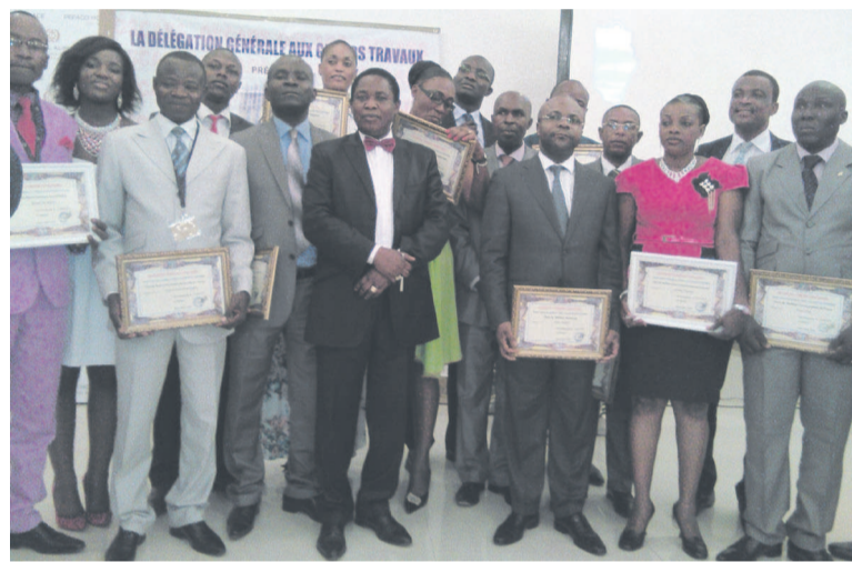
La photo de famille des Oscars de la presse 2015