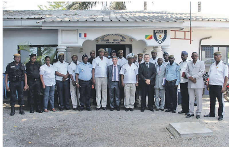
Photo de famille de la cérémonie

tés de police des départements du Kouilou et de Pointe-Noire ont eu accès aux outils essentiels managériaux de pilotage des services de police. « Pour la police, le management c'est le maintien de l'ordre public, la protection des personnes et des biens, des institutions et des frontières. Être chef aujourd'hui, ne se limite plus à commander, il faut manager. Or, ma-