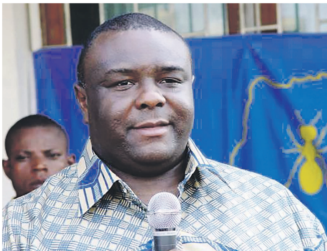
Jean Pierre Bemba