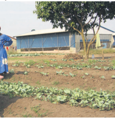
Une opération de fertilisation du sol

Coddipa qui n'a pas une forte capacité financière. Il faut importer l'aliment de bétail. Il s'agit du Soja qui est autour de 20% dans la fabrication d'un aliment de bétail et le maïs qui contribue à 60%. Mais nous n'avons, par exemple, pas d'unité d'extraction de l'huile de Soja pour qu'il y ait le marché ». « Nous allons aujourd'hui au Cameroun pour chercher le produit. Ça coûte cher avec le transport.