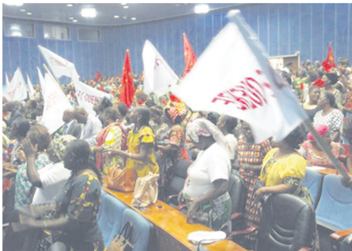
Une vue des femmes de l'OFC

en la rendant responsable dans la société, au foyer, au sein de l'administration et de l'entreprise, etc. Une évocation qui a suscité l'intérêt des femmes présentes à cette cérémonie. « Aujourd'hui, nous constatons que ce dynamisme qui habitait nos structures in-