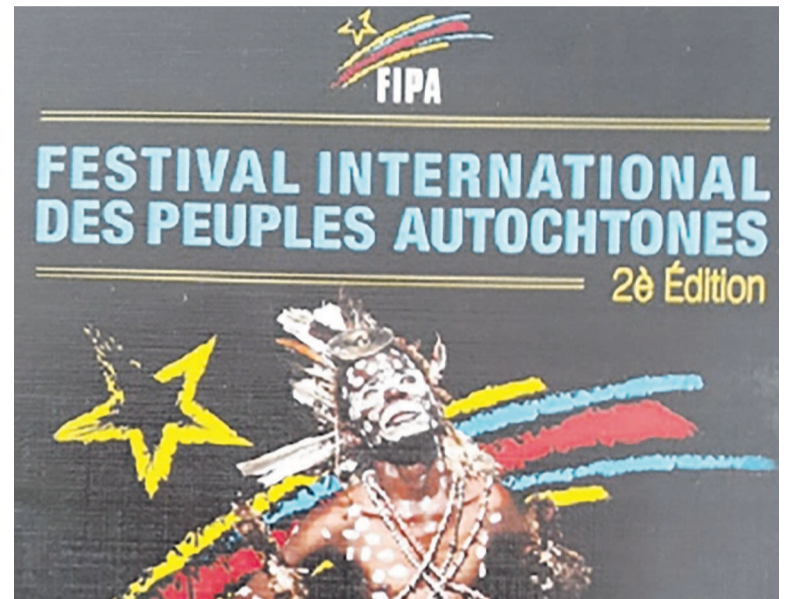
L'affiche du festival

L'évènement prévu dans deux semaines dans la capitale congolaise vise à faire connaître les droits des peuples autochtones pygmées auprès de tous les Congolais, mais aussi arriver à booster l'adoption et la promulgation de la loi spécifique élaborée en leur faveur et sous examen actuellement au niveau de l'Assemblée nationale.