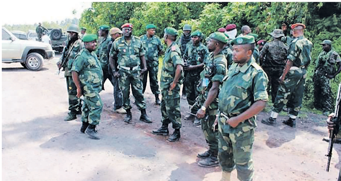
Quelques officiers des Fardc