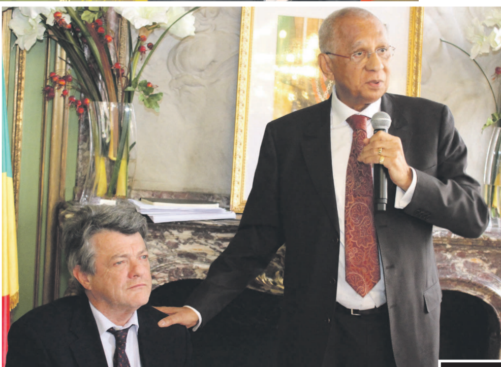
Henri Lopes et Jean-Louis Borloo se retrouveront, ce lundi à 15 heures, pour aborder, avec Henri Djombo, le projet d'électrification de l'Afrique lancé par l'ancien ministre de l'Ecologie