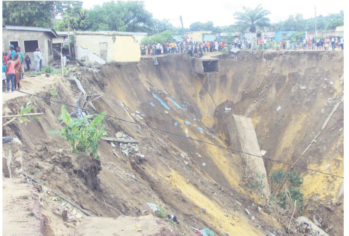
Faute de drainage des eaux pluviales, les érosions gagnent du terrain à Brazzaville

Afin de lutter contre les érosions causées par la dégradation du réseau de collecte des eaux et de drainage pluvial dans les quartiers de Brazzaville, l'Agence française de développement va investir plus de 6 milliards FCFA. La mise en œuvre de ce projet a fait l'objet d'un partenariat conclu lundi entre l'État congolais, représenté par la délégation générale aux grands travaux et la société française Eiffage TP. Une première tranche des travaux de réhabilitation et d'extension du réseau d'eaux pluviales de Brazzaville concernera l'aménagement des collecteurs des rivières Mission, Mfoa et Madoukou. Page 3