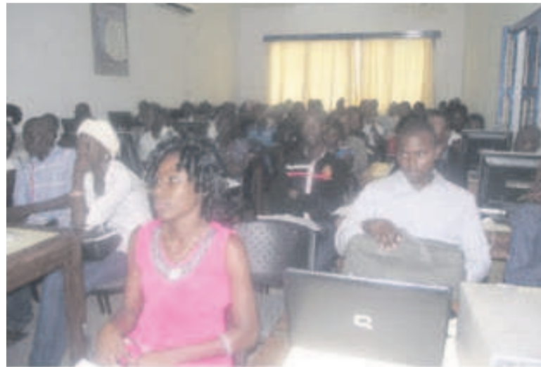
Les participants à l'atelier de formation

Les impacts dévastateurs du changement climatique, le rôle des jeunes dans la préservation de l'environnement, ont fait partie des modules enseignés lors de cette formation le 20 mars dernier au Campus numérique francophone à Brazzaville.