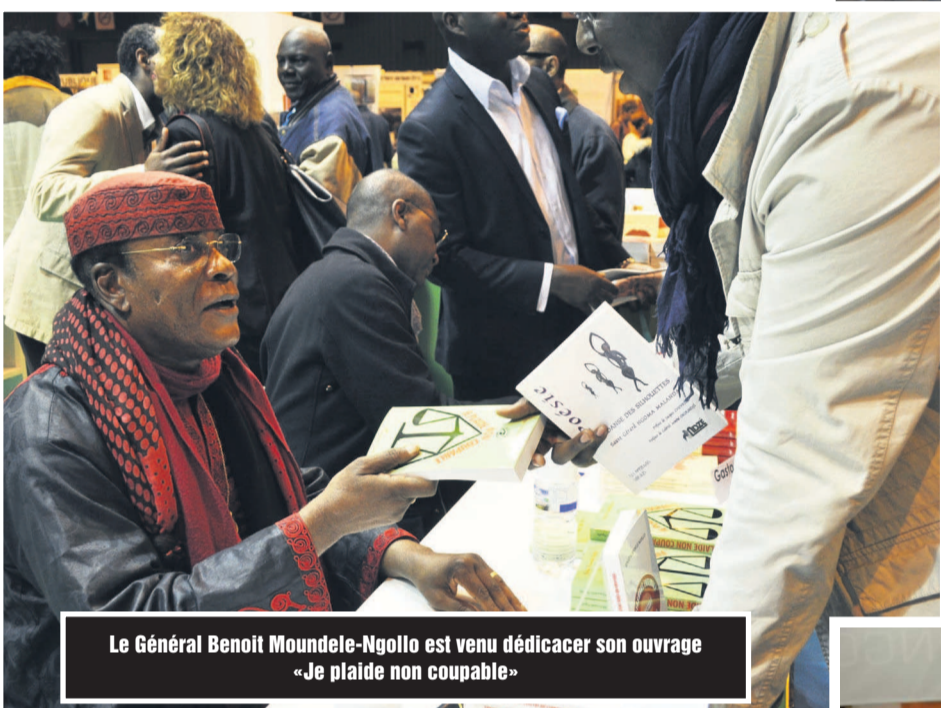
Le Général Benoit Moundele-Ngollo est venu dédicacer son ouvrage «Je plaide non coupable»