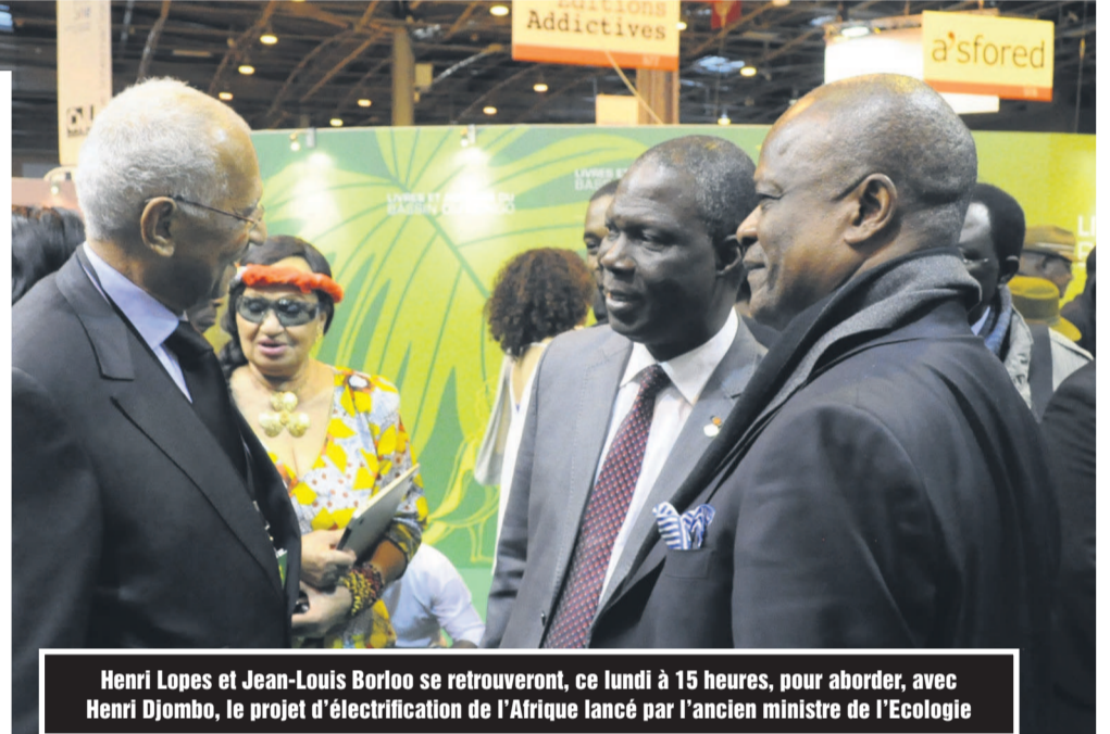
Henri Lopes et Jean-Louis Borloo se retrouveront, ce lundi à 15 heures, pour aborder, avec Henri Djombo, le projet d'électrification de l'Afrique lancé par l'ancien ministre de l'Ecologie