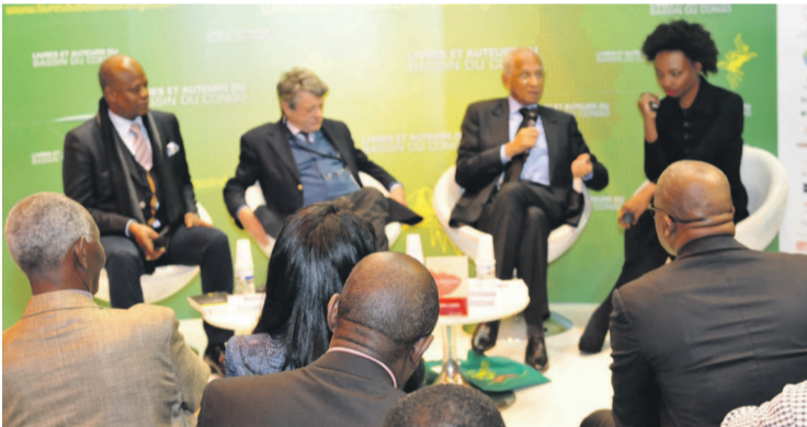
Henri Djombo Jean-Louis Borloo et Henri Lopes animant la tribune sur le Projet d'électrification en Afrique

La 35 e édition du Salon du livre de Paris s'est achevée lundi soir par la remise du Prix Stéphane Hessel par Christine Saragosse, Présidente-directrice générale de France Médias Monde, sur le Stand Livres et Auteurs du Bassin du Congo.