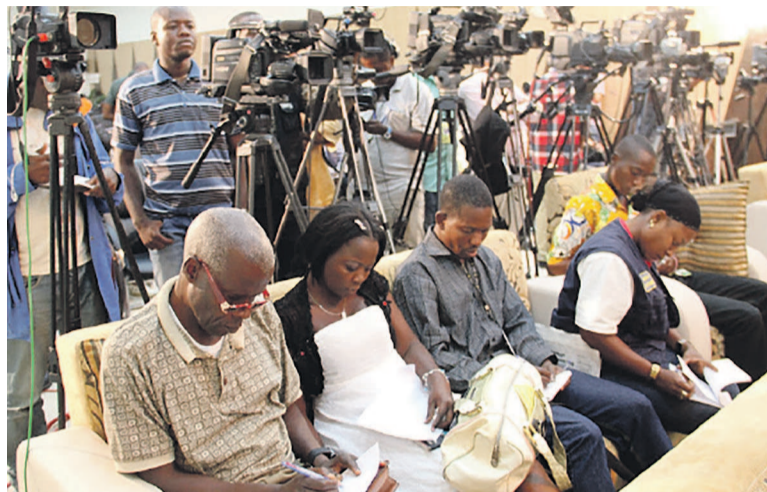
Les professionnels des médias, lors d'une activité à la Ceni