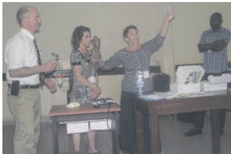
Des formateurs lors des exercices de ventilation