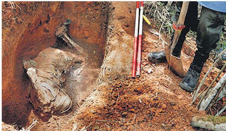
Découverte d'une fosse commune à Maluku