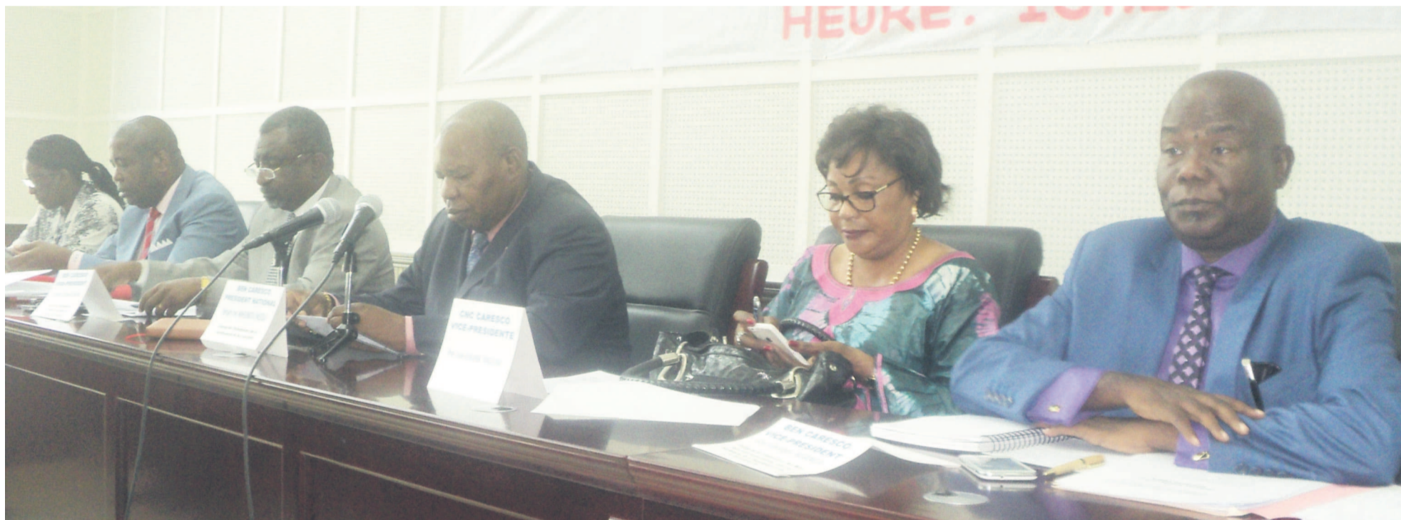
Le président de la Caresco ( au centre ) ouvrant les travaux

La Coordination des associations et réseaux de la société civile du Congo (Caresco), réunie le 7 avril à Brazzaville, a déploré « une certaine limite des pouvoirs publics à arbitrer avec parcimonie et recul » la situation de