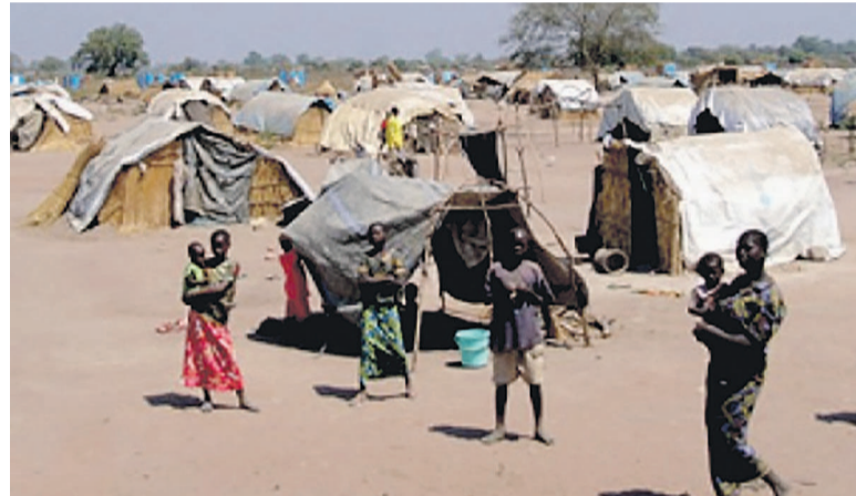
Un camp de déplacés dans l'est de la RDC

Pour Joseph Inganji, les sites de personnes déplacées sont des lieux protégés par le Droit international humanitaire (DIH) et ne peuvent, par conséquent, être la cible d'acte belliqueux. « En faisant partie de la population civile, les personnes déplacées doivent bénéficier de la protection accordée par le DIH auquel l'État congolais est soumis », a-t-il précisé en exhortant, par ailleurs, les autorités congolaises à se