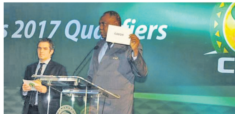
Issa Ayatou, président de la Caf, lors du tirage au sort

La Confédération africaine de football (CAF) a choisi le Gabon comme pays organisateur de la prochaine Coupe d'Afrique des nations (CAN), aux dépens de l'Algérie et du Ghana. La CAF a également réparti en 13 poules les 52 équipes nationales qui