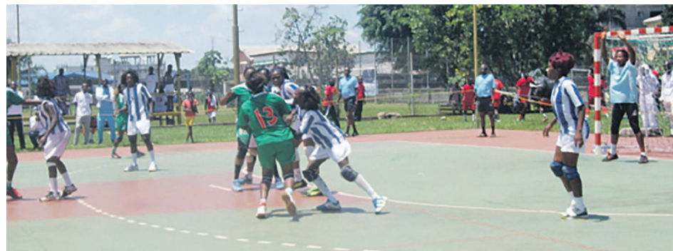
Un extrait du match opposant Cheminots dames à Patronage

Les deux équipes dames ont terminé le championnat avec le même nombre de points. Battue 17-24 à l'aller face à Cheminots, Patronage a pris sa revanche le 5 avril au stade Enrico Mattéi en s'imposant 25-24 face à son adversaire