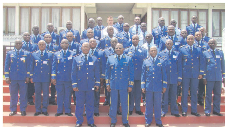
La photo de famille

Le projet « Vision 2020 » se précise. Des lignes directrices sont définies pour un nouveau mode de gestion. Les directeurs centraux, commandants de régions, commandants des grandes formations et chefs de services sont réunis pour une conférence de planification à Brazzaville.