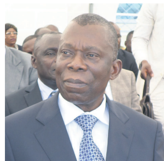
Le ministre François Ibovi

D'après plusieurs enquêtes scientifiques réalisées, ces décès touchent surtout les enfants. Ces derniers sont contaminés par des bactéries, des virus, des parasites ou des substances chimiques occasionnant plus de 200 maladies. La sécurité des aliments est également menacée, a expliqué le ministre François Ibovi, par l'excès de sel, de graisse, substances engendrant les maladies non transmissibles telles que : le diabète, l'hypertension artérielle, les maladies cardiovasculaires et les cancers. « Ces facteurs de risques alimentaires augmen-