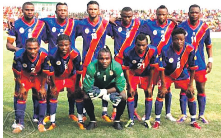
Léopards locaux de la RDC

Rappelons que l'Afrique centrale enverra trois qualifiés à cette compétition. Ces