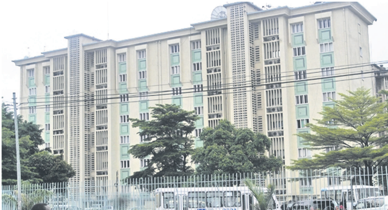
Le siège de la DGDA à Kinshasa

Mais il y a des défis importants à relever, notamment la mise à niveau technique de ces régies financières. En d'autres termes, il s'agit de les doter des services informatiques en télé-procédure, en télé-déclaration et en télépaiement. Dans un pays aussi vaste que la RDC, il est impérieux de monter des politiques qui permettent effectivement d'optimiser les ressources financières. Page 12