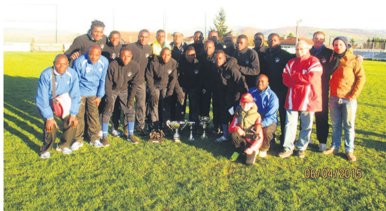
Les sept joueurs retenus en France parmi tant d'autres