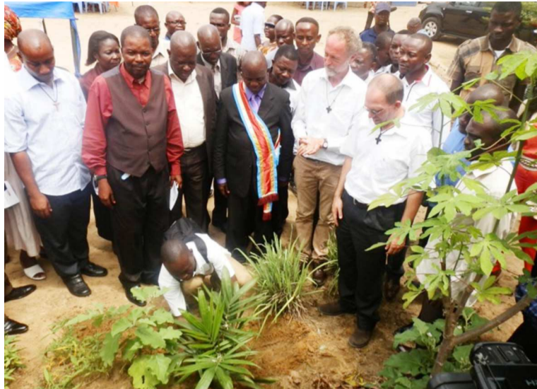
Plantage d'un palmier pour les dix ans du Centre Ndako ya Biso

Dans ce message, ces enfants ont notamment sollicité de l'autorité politico-administrative de cette municipalité une aide pour leur permettre de retrouver leur place dans la société et à regagner l'école comme tous les autres enfants de leur âge. « Dites aux pasteurs et aux agents de la police de ne plus nous maltraiter. Nous ne sommes pas de sorciers. Nous ne sommes pas de bandits. Nous sommes des enfants et nous voulons avoir notre place dans notre famille, dans notre école », ont-ils dit.