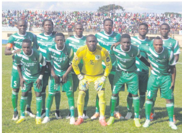
L'équipe de l'AC Léopards de Dolisie contrainte à améliorer son bilan face aux Égyptiens

fois de plus. Nous connaissons un peu ce football pour l'avoir déjà cotoyé à plusieurs niveaux. La ville d'Alexandrie aussi nous y avons joué déjà. Je pense que