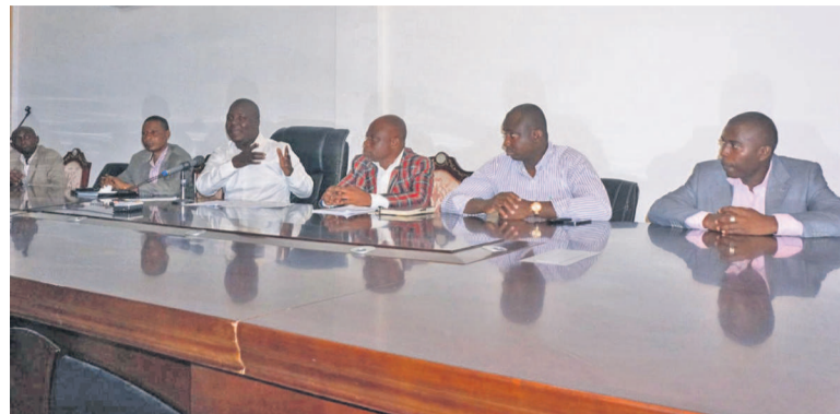
Tribune officielle de la conférence

Le Coordonnateur général de la Dynamique citoyenne « Po na Ekolo » s'est exprimé ainsi à l'occasion d'une conférence de presse qu'il a animé samedi 11 avril dans la ville océane. Celle-ci s'inscrit dans le cadre du lancement officiel des activités dudit mouvement dans le département de Pointe-Noire.