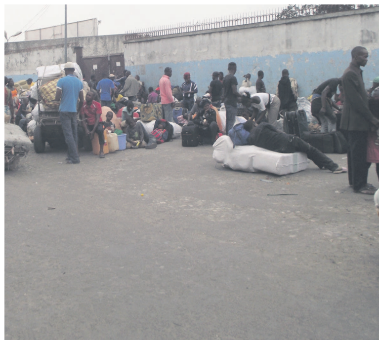
Des étrangers reconduits à la frontière.

JMT : La différence est tout simplement due au fait que lors de la première phase, il y avait des groupes importants qui étaient en vagabondage dans la ville. D'où, il fallait déployer un grand nombre de policiers pour pouvoir les interpellés. Mais aujourd'hui, il convient de signaler que bon nombre d'étrangers en situation irrégulière vivent discrètement. Pour la police, il s'agit de faire des opérations ciblées basées sur des renseignements, c'est-à-dire que, chaque fois qu'il y a des populations qui nous signalent la présence des étrangers en situation irrégulière, nous les interpel-