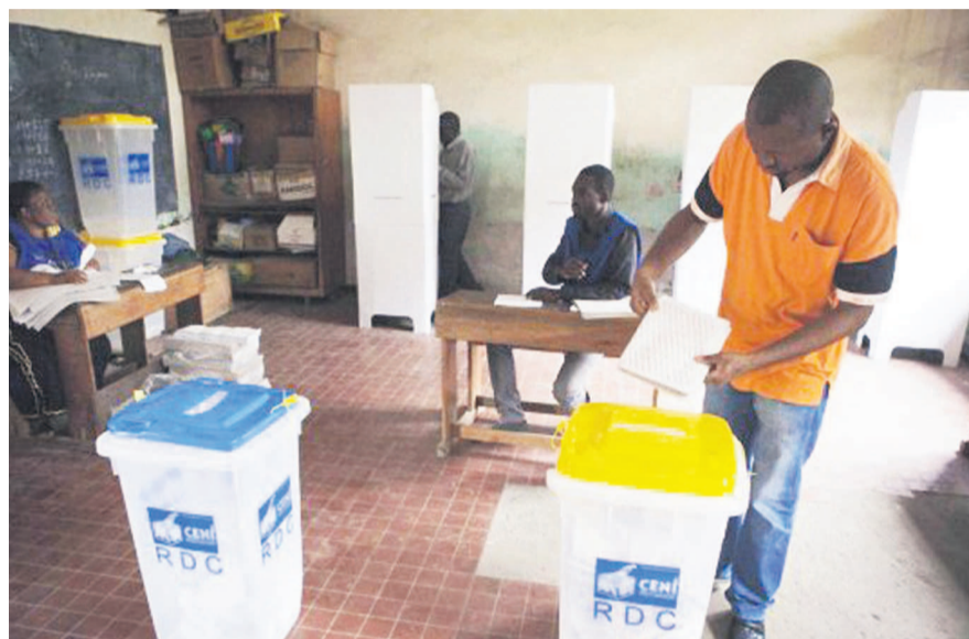
Un électeur en train d'accomplir son devoir civique

meilleurs délais pour retirer les formulaires afin de déposer leurs candidatures. Il est, de ce fait, demandé aux uns et aux autres de parer au plus pressé étant entendu que les BRTC n'auront que vingt et un jours pour traiter les différents dossiers en leur disposition. Page 12