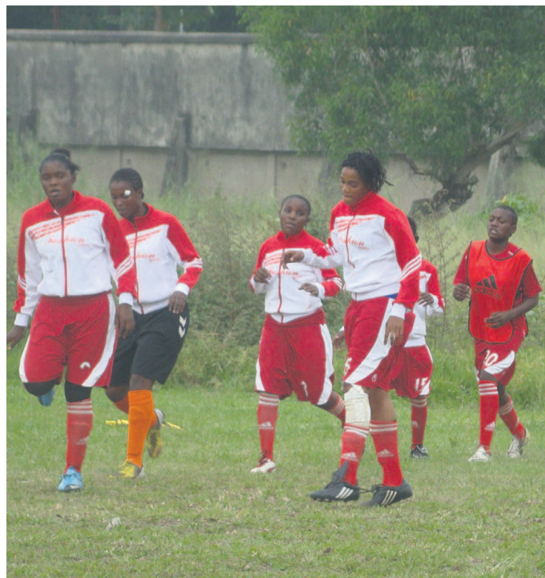
Quelques joueuses d'Espérance Muchanga retenues en équipe nationale

mençant par une victoire sur la Guinée-Equatoriale. Une tâche pas facile face à une équipe mondialiste de la discipline, pas