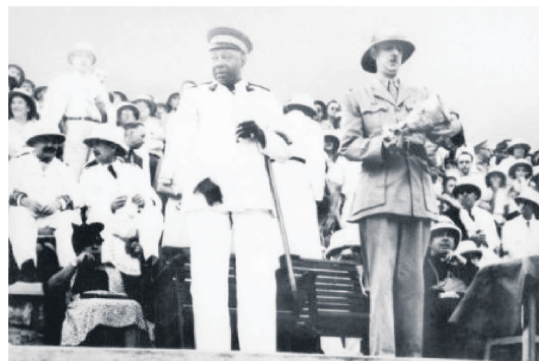
Félix Eboué (Gouverneur général de l'AEF) et Charles de Gaulle président de la France-libre en février 1944 à Brazzaville

où De Gaulle forgea les prémices de sa politique africaine qui aboutit à la Conférence de Brazzaville en 1944. On y parle aussi des tribunaux indigènes, de l'action du Dr Schweitzer, de la vaccination, des champs de pétrole, etc.