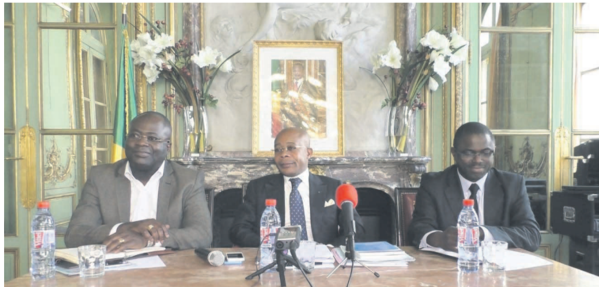
Le ministre Martin Parfait Aimé Coussoud Mavoungou entouré du Conseiller près de l'ambassade du Congo en France et du directeur de l'OGESC/DR

Signalons qu'au cours de cette communication le ministre Martin Parfait Aimé Coussoud Mavoungou