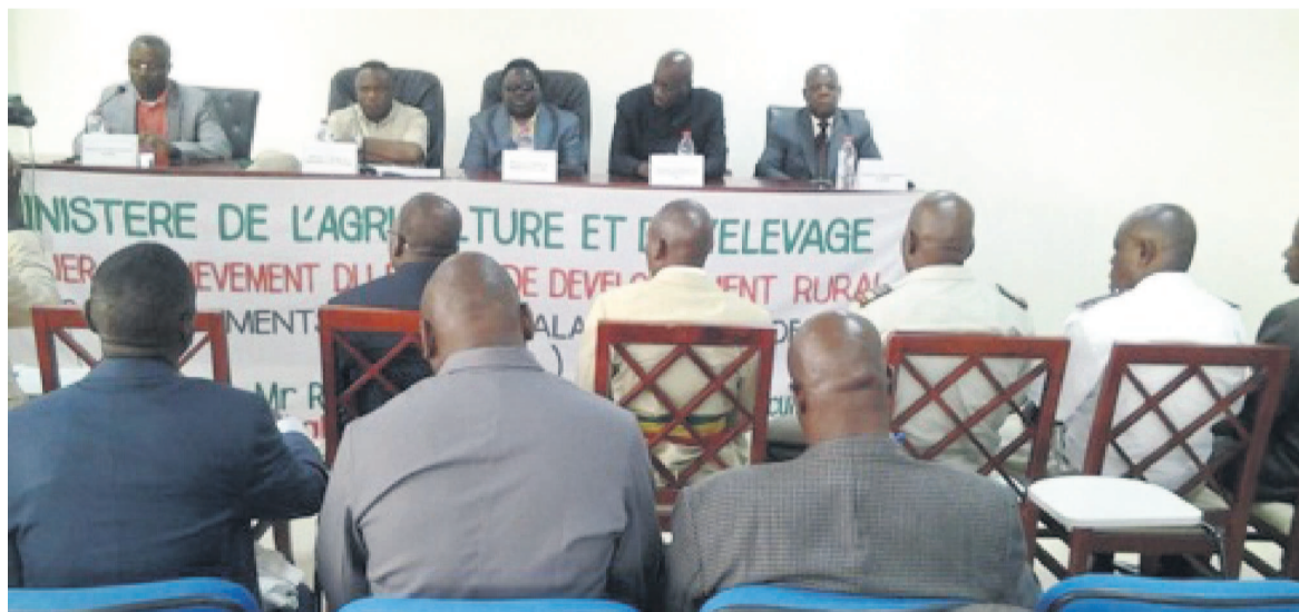
Le ministre de l'Agriculture, en deuxième position à partir de la gauche, lors de l'atelier d'achèvement du Proder 3