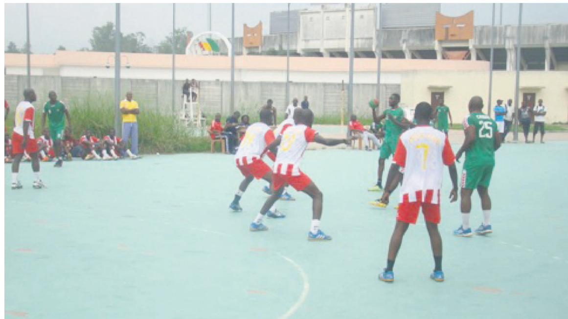
Un des matchs de l'Inter club

Les hommes de l'Inter club, surtout les dames d'Abo-Sport ont conjugué leur saison sportive départementale au plusque-parfait. D'un côté, les militaires de la première équipe ont donné du fil à retordre à leurs adversaires le long de la compétition, de l'autre les dames d'Abo n'ont laissé aucune chance aux rivales qui se sont dressées sur leur route menant au titre. Dans les phases aller-retour, en effet, les handballeuses de ce club n'ont perdu aucun match. Le nul concédé contre Asel a été la plus mauvaise performance enregistrée par ces dernières. Pour le reste, Abo-Sport a avancé tranquillement vers le titre départemental