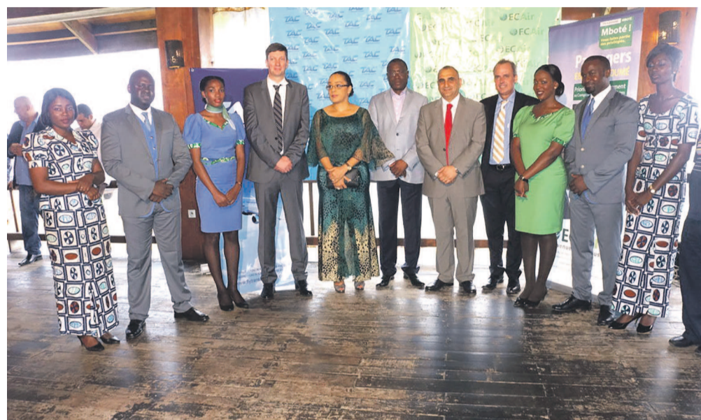
Photo de famille de la rencontre

Pour terminer, l'orateur a rappelé la performance de l'aviation civile congolaise en vue d'une meilleure exécution de ce partenariat par les deux sociétés. « Ce qui est sûr, aujourd'hui l'aviation civile congolaise est en train de démontrer que grâce à ce partenariat les sociétés ECAIR et TAC peuvent aller plus loin par rapport aux pays frontaliers de la République du Congo. Les deux sociétés ont une desserte régionale, elles ont démontré leur capacité, leur compétence, leur savoir faire à desservir hors des frontières du Congo. ECAIR et TAC offrent donc à leurs passagers toutes les garanties de sécurité, de sûreté, de fiabilité qui rassurent l'ensemble des pays que ces sociétés desservent », a-t-il conclu.