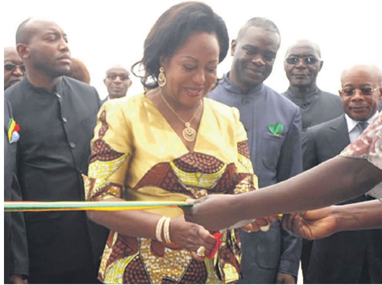
Antoinette Sassou N'Guesso coupant le ruban de mise en service de l'ouvrage.

Antoinette Sassou N'Guesso, l'épouse du chef de l'État, a patronné le 28 mai la cérémonie de réception officielle de la Maison de la jeunesse et de la citoyenneté de cette localité dédiée à son nom. Cette cérémonie s'est déroulée en présence des membres du gouvernement, du maire de Pointe-Noire et des autorités locales militaires et civiles