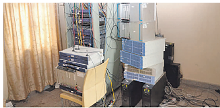
Des matériels de télécommunication

Certains opérateurs téléphoniques ont indiqué à radiookapi.net que deux raisons sont la base de l'inefficacité d'Agelis-Télécom. Il s'est d'abord agi du fait que ses équipements détecteraient ces appels entrants en retard, alors l'entreprise buterait, ensuite, contre la même pesanteur officielle que rencontrent trop souvent ces télécoms. Pourtant, ces opérateurs téléphoniques auraient assuré savoir où se trouvent ces Sim box. « La majorité de cette mafia est entretenue par certains officiels congolais qui brassent ainsi frauduleusement de millions de dollars au détriment du Trésor public », ont souligné ces