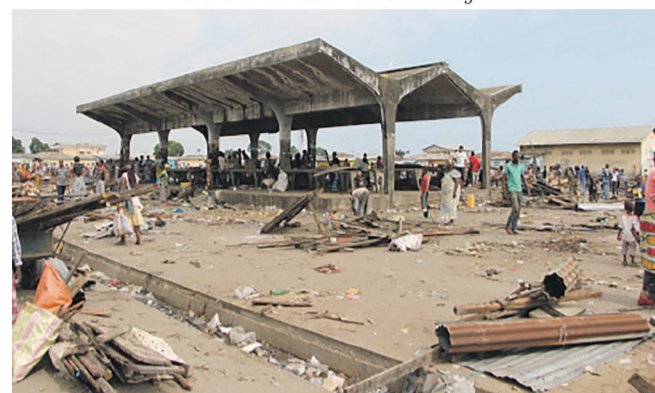
Le marché Tié-Tié Massola après sa démolition

La construction d'un marché moderne digne de ce nom, est une nouvelle qui a été bien accueillie par plusieurs vendeurs, bien que d'autres sont restés pessimistes. En effet, les travaux de construction des marchés modernes, lancés çà et là et qui, jusque aujourd'hui sont restés sans suite, font