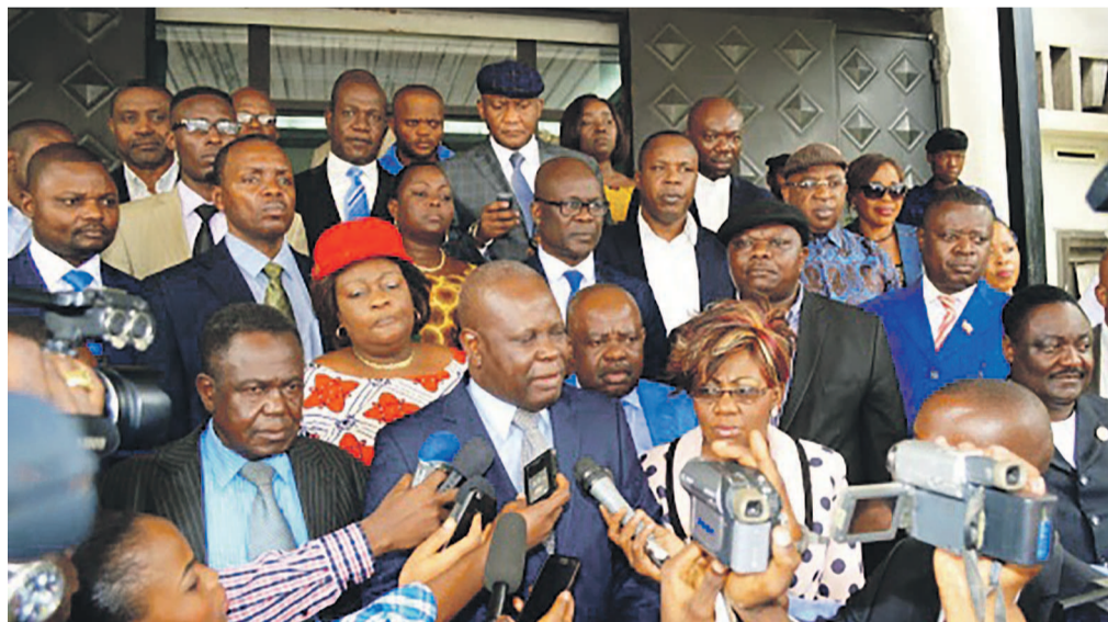
Des leaders de l'opposition au sortir d'une réunion à Kinshasa

Des partis politiques de l'opposition ont réaffirmé, à la veille des pourparlers engagés par Joseph Kabila avec la classe politique et les forces politiques et sociales du pays, leur refus d'y participer. Pour le MLC, l'UNC, le CDR, le MPCR-MLP et autres partis membres de la plate-forme contestataire, il y a inopportunité de tenir un dialogue pendant qu'ils avaient déjà transmis leurs préoccupations au président de la République via son émissaire sur ce que sont, à l'heure actuelle,