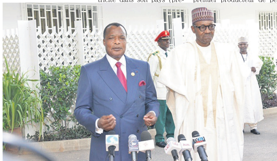
Muhammadu Buhari en compagnie de Denis Sassou N'Guesso

en place un nouveau centre de commandement militaire