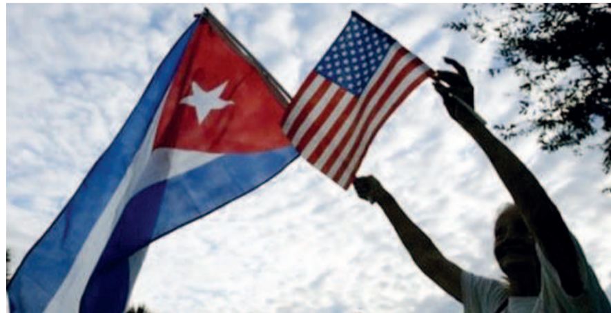
Les drapeaux des deux États

En effet, Moscou a émis une liste de 89 hommes ou femmes politiques qui sont aujourd'hui indésirables sur le sol Russe. Cette liste a été communiquée le 29 mai