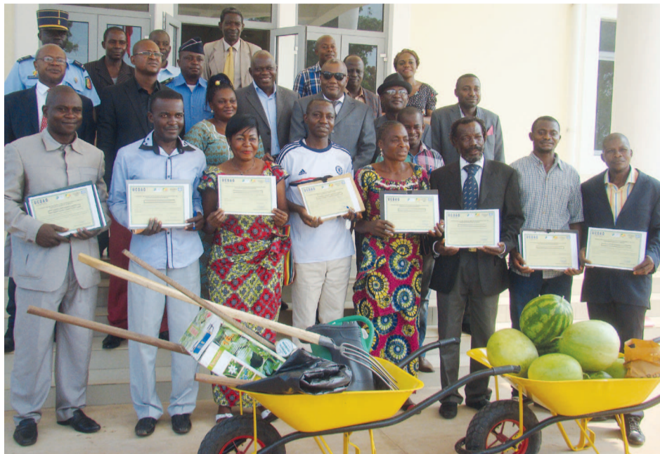
Les maraichers et les responsables en photo de famille

Ce matériel aratoire, don de la direction générale du développement local, relevant du ministère de l'Aménagement du territoire et de la délégation générale aux grands travaux, permettra à ces jeunes maraichers, de travailler davantage afin d'augmenter leur production et renflouer les marchés locaux en produits maraichers.