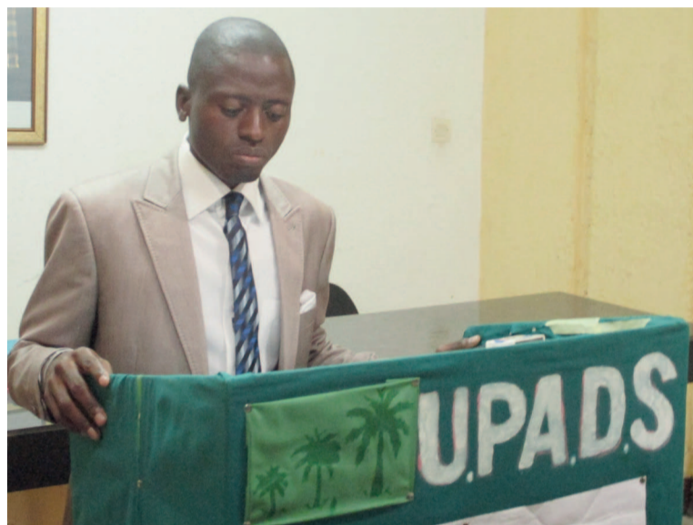
Sidoine Giscard Madoulou faisant le point à la presse