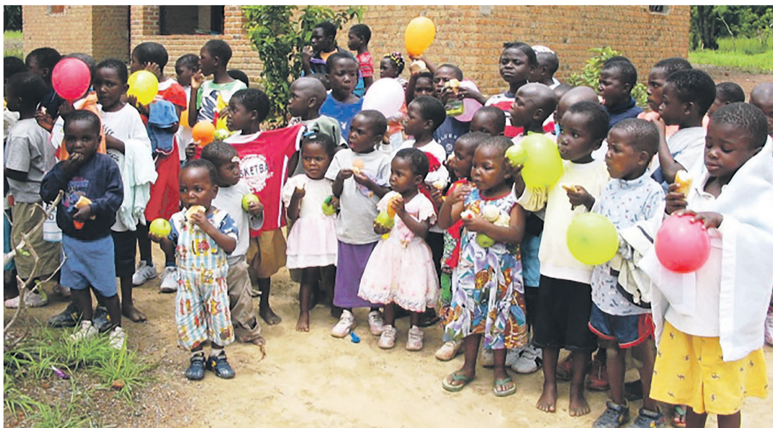
Des enfants posant devant un ophelinat à l'Est