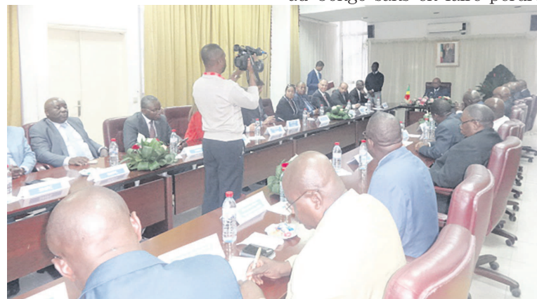
La cérémonie de signature des CPP

Quant à Perenco, la société a repris les actions de la société Nomeco sur les permis Yombo-Masseko-Youbi, en forme de concession. Cette dernière, arrivée à échéance, tient compte