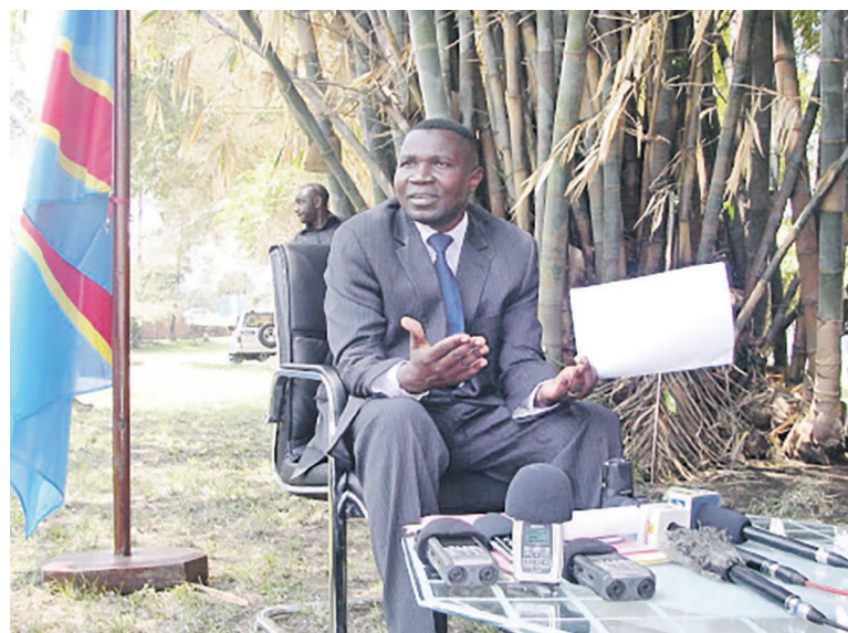
Le gouverneur Julien Paluku appelle les investisseurs à investir au Nord-Kivu en toute sécurité

À propos des routes, l'on apprend que le gouvernement envisage la construction deux milles kilomètres pour un coût estimé à deux milliards de dollars américains. Prenant la parole à la clôture du Forum, Salomon Banamuhere a rassuré les participants sur la détermination du gouvernement pour renforcer la paix dans cette