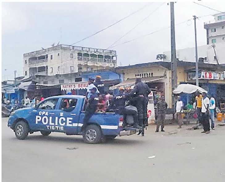
Les éléments du poste de police de tié-tié lors d'une opération de routine

Rappelons que l'opération «Mбата ya bakolo» se déroule en toute intelligence à