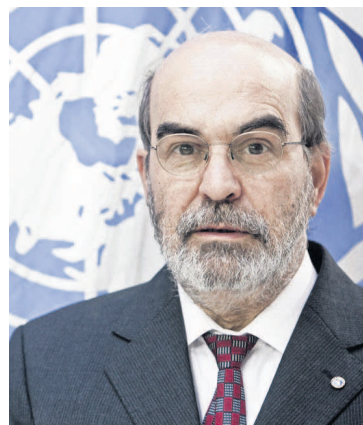
José Graziano da Silva

Événements qui ont culminé avec l'élection, samedi, du directeur général de l'Organisation. Seul candidat en lice, le Brésilien José Graziano da Silva a été reconduit – par acclamation – pour un nouveau mandat de 4 ans comme directeur. A l'heure où le monde enregistre un lent mais réel recul de la faim dans le monde, qui aujourd'hui est passé sous la barre des 800 millions (795 millions d'affamés), Graziano da Silva invite à appuyer sur l'accélérateur. Car, comme l'a souligné le Secrétaire général des Nations unies Ban Ki-moon, l'objectif de l'éradication de la faim sur la planète « est à portée de main ». Le directeur de la FAO est d'avis