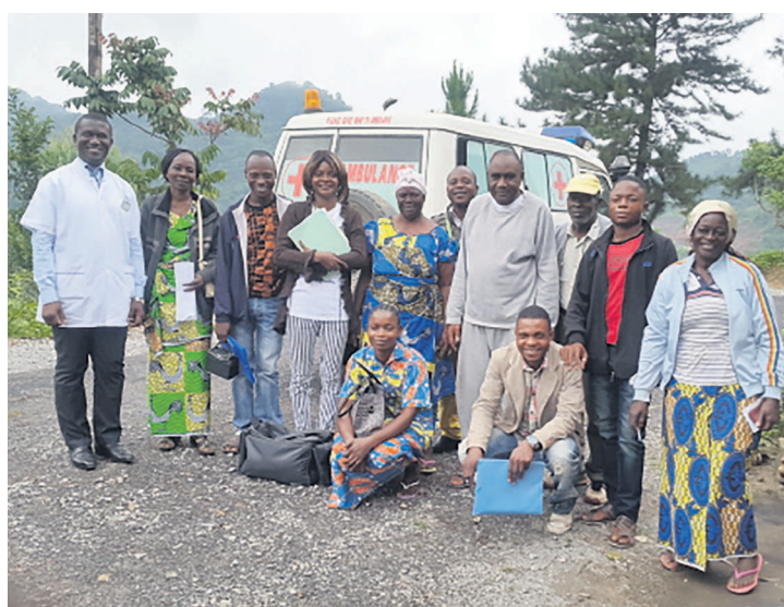
Photo de famille de la cérémonie