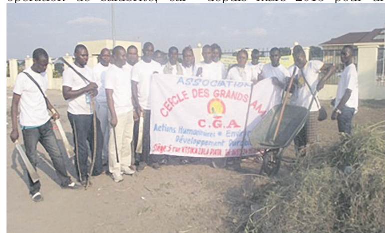
Photo de famille à l'issue de l'opération