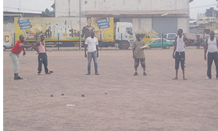
La 5 e et dernière séance d'entraînement avant le départ du Tchad