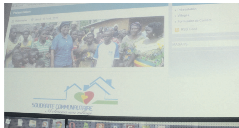
La page d'accueil du site du ministère

Il est composé d'une page d'accueil, des fenêtres comme structures spécialisées, ministre, politique,