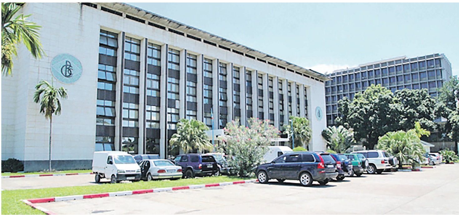
Siège de la Banque centrale du Congo à Kinshasa

C'est le premier pays africain à prendre une telle option. L'objectif de la Banque centrale du Congo (BCC) est de les aider à concurrencer les banques internationales et à augmenter le montant de leur engagement de manière à participer à des grandes transactions. L'annonce a été faite, le 9 juin, par la BCC lors d'une conférence de presse à Kinshasa. Elle ouvre des nouvelles perspectives au secteur bancaire congolais qui a connu un développement fulgurant, ces dernières années, avec l'intégration des nouveaux produits pour résister à une concurrence à 18.