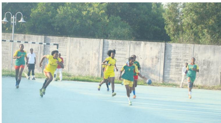
Une rencontre de handball

Dix-sept clubs, soit neuf en hommes et huit en dames, vont se lancer dans la course au titre national, du 20 au 30 juin à Pointe-Noire, pour succéder à Etoile du Congo.