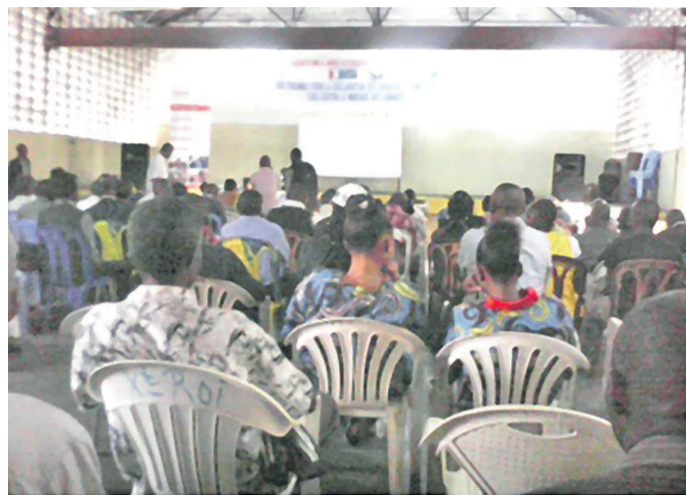
La salle, lors de l'activité organisée à la paroisse Christ-Roi

Pour le ministre Kimbuta, la création de bureaux auxiliaires de l'état civil qui vise à rapprocher la population de l'administration rentre également dans cette vision de la promotion de l'enregistrement des naissances. Saluant l'augmentation des enre-