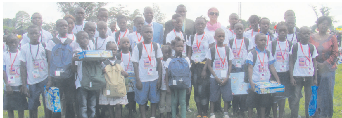
Photo de famille des 30 heureux gagnants

La représentante des élèves a elle aussi remercié la Felbo pour la mobilisation réussie et pour le geste d'amour manifesté à leur endroit. Au nom de tous les élèves