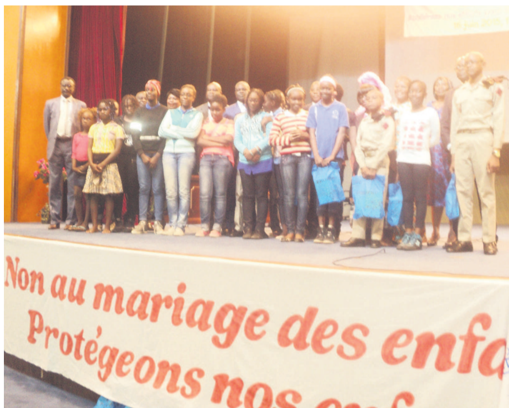
Quelques enfants ayant participé à la 25 e Journée de l'enfant africain