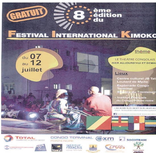
Affiche du festival international kimoko

Le FIK est un rendez-vous annuel devenu incontournable sur la place de Pointe-Noire mais également au niveau de l'Afrique. Pendant six jours durant, ce festival réunit les amoureux des arts de la scène, des professionnels des arts et des ar-