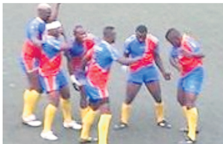
Les Léopards Rugby célèbrent à Kinshasa leur victoire sur le Rwanda