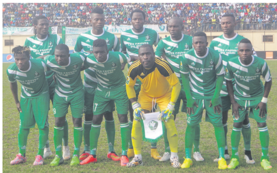
Les Fauves du Niari doivent ouvrir leur compteur à point à Sfax

dispositions parce que nous avons laissé les points, maintenant il faut aller les conquérir ailleurs. » L'échec de la première journée étant à oublier, les Fauves du Niari ont désormais le regard tourné vers l'avenir. Les Léopards de Dolisie doivent en effet se montrer plus conquérants et rassurants lors de cinq prochains matches qui leur restent à livrer pour aller le plus loin possible dans cette compétition.