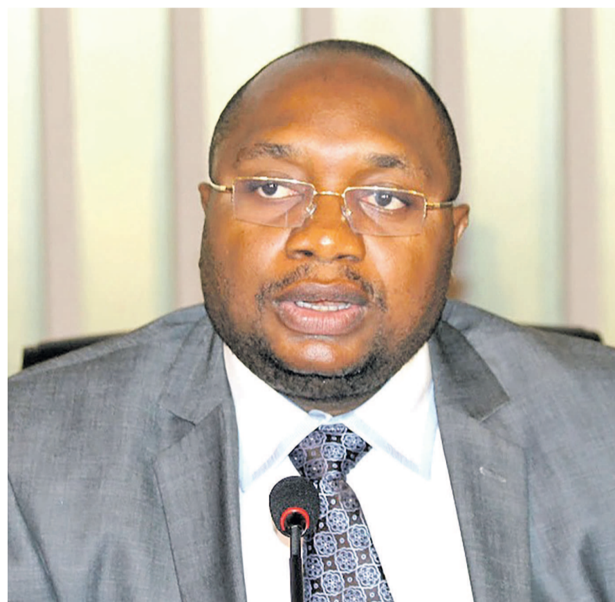
Dr Félix Kabange Numbi

Le vendredi 03 juillet 2015, au cours de la réunion du comité national de coordination de lutte contre la maladie, le ministre a tenu une télé conférence avec l'équipe d'experts à Mosambia qui a déjà fait des prélèvements. Dans 48h, les résultats seront connus.