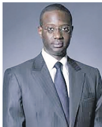
Tidjane Thiam, nouveau patron de Crédit Suisse

Tidjane Thiam n'a pour sa part pas encore fait de déclarations concrètes sur cet aspect. Les résultats du deuxième trimestre, à paraître dans trois semaines, sont