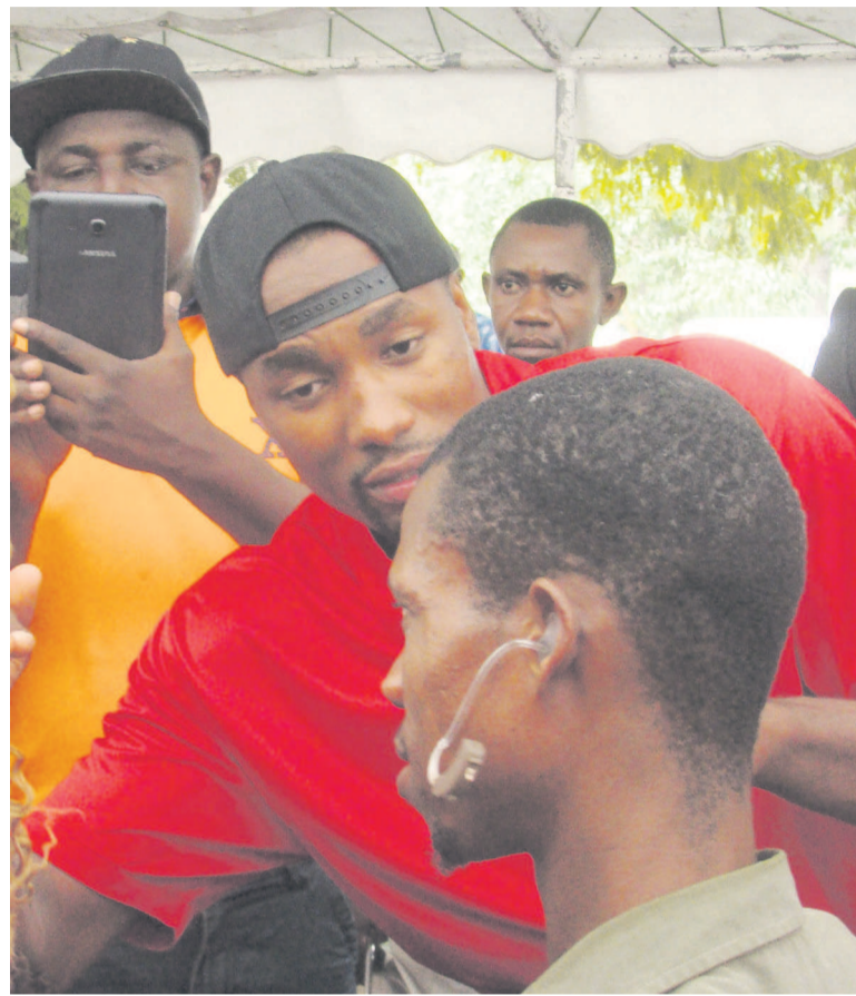
Vu d'un appareil auditif posé sur l'oreille un malentendant

« Je suis venu ici pour me faire soigner. Ce mal en moi s'était manifesté depuis mon