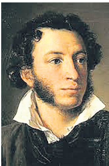
Alexandre S. Pouchkine