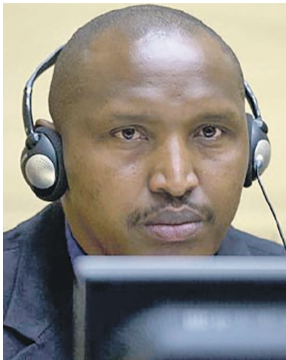
Bosco Ntaganda à la CPI

Les Congolais ainsi que toutes les personnes intéressés par le procès de Bosco Ntaganda doivent prendre leur mal en patience. Pour cause, les déclarations liminaires initialement prévues du 7 au 9 juillet 2015, sont reportées du 2 au 4 septembre 2015. Dans le même ordre, la comparution du premier témoin dans l'affaire débutera le 15 septembre au lieu du 24 août 2015. Ce report fait suite au dépôt, le 29 juin 2015, par la défense de Bosco Ntaganda, d'une requête en vue de l'ajournement de la procédure jusqu'à ce que les conditions nécessaires soient mises en place pour assurer un procès équitable. Dans sa requête, a révélé un communiqué de la CPI, la défense de l'ancien chef d'état-major général adjoint présumé des Forces patriotiques pour la libération du Congo (FPLC) a soulevé diverses questions qui l'empêchaient, selon elle, d'être prête pour débiter le procès. « L'accusation a répondu à cette requête le 30 juin 2015 et ne s'est pas opposée à un ajourne-